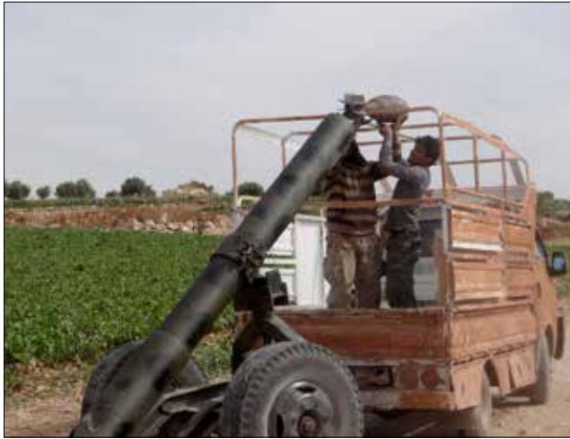
مسلحون في قرية الحاضر في ريف حلب الجنوبي أمس

ما أدى إلى تدميرها ومقتل أفراد طاقمها. كذلك وقعت اشتباكات بين مسلحي «جبهة النصر» ومسلحي «لواء الحبيب المصطفى»، التابع لـ «الجيش الحر»، في مدينة طفس في الريف الشمالي الغربي لمدينة درعا. إلى ذلك، نفذت الطائرات الحربية الروسية 55 طلعة جوية على 60 موقعاً للمسلحين في أرياف اللاذقية ودمشق وحماه وإدلب وحلب ودير الزور، حسبما ذكرت وزارة الدفاع الروسية أمس.