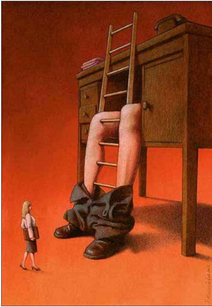
(بافيك كوزنسكي - بولندا)

الصحافيين الذي شاركوا في عملية الفضح، إنمّا عبر تقنية الـ Screen Capture، منعاً للوقوع في فخ الترويج للمواقع والمساهمة في تسجيل الدخول إليها. في حديثه إلى «الأخبار»، تطرّق الدنا إلى الصدمة التي أصابته عندما شاهد صاحب إحدى الصحف المحلية يعيد نشر مواضيع مبتذلة على حسابه الشخصي على أحد مواقع التواصل الاجتماعي. وتناول الدنا أيضاً خطورة هذه الموجة، لا سيما أنّ رواد السوشال ميديا هم من جميع الأعمار، ومن ضمنهم صغار السن الذين يتم اصطيادهم سريعاً إلى هذه المواقع الإخبارية من دون حسيب أو رقيب.