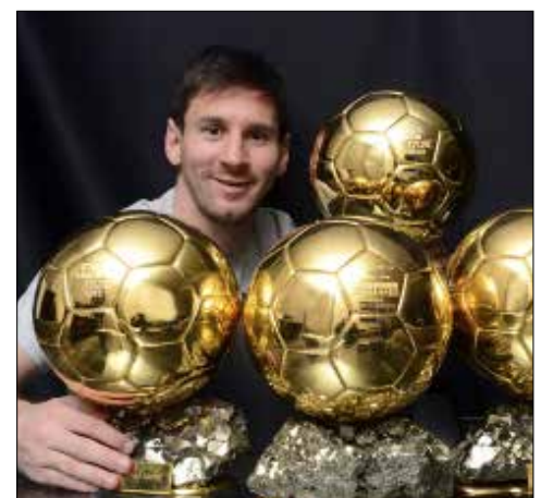
ميسي على رأس المرشحين لحمل الكرة الذهبية

بدأ العد العكسي لإعلان أفضل لاعب كرة قدم في العالم لسنة 2015 بعدما سُمي الاتحاد الدولي لائحة المرشحين الـ 23 لجائزة الكرة الذهبية. وسيُكشف عن القائمة النهائية المؤلفة من 3 لاعبين في 30 تشرين الثاني المقبل، على أن تسلم الجائزة في 11 كانون الثاني 2016 في زيوريخ، حيث يبدو النجم الأرجنتيني ليونيل ميسي الذي حصل أواخر الماضي على لقب أفضل لاعب في أوروبا، مرشحاً فوق العادة لاستعادة الجائزة من غريمه نجم ريال مدريد الإسباني الدولي البرتغالي كريستيانو رونالدو. وبرزت سيطرة قطبي الكرة الإسبانية