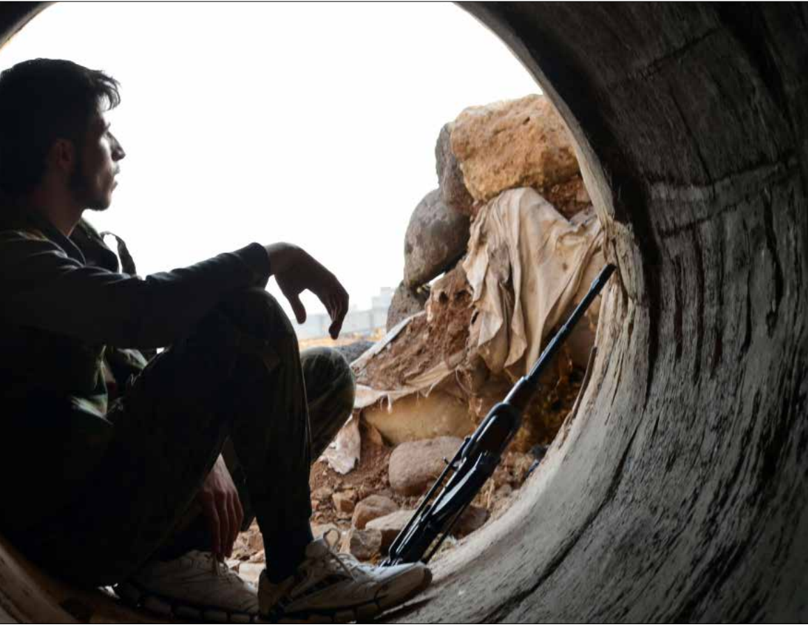
بتعاطف ظهور الفورة التركية - الخليجية لعنم الانكسار المتوالي لفصائل المعارضة المسلحة (الناضول)