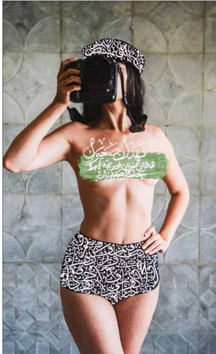
«المصورة» (اكربليك) على ورق مقوى - 111x74 سنتيمتر - 2015

في معرضه «الحقيقة العارية» في «غاليري أيام»، يقارب الفوتوغرافي السوري السلطة الدينية والسياسية عبر 16 صورة يمارس فيها فعل الرقابة على أجساد نسائه، قبل تحريرها مجدداً