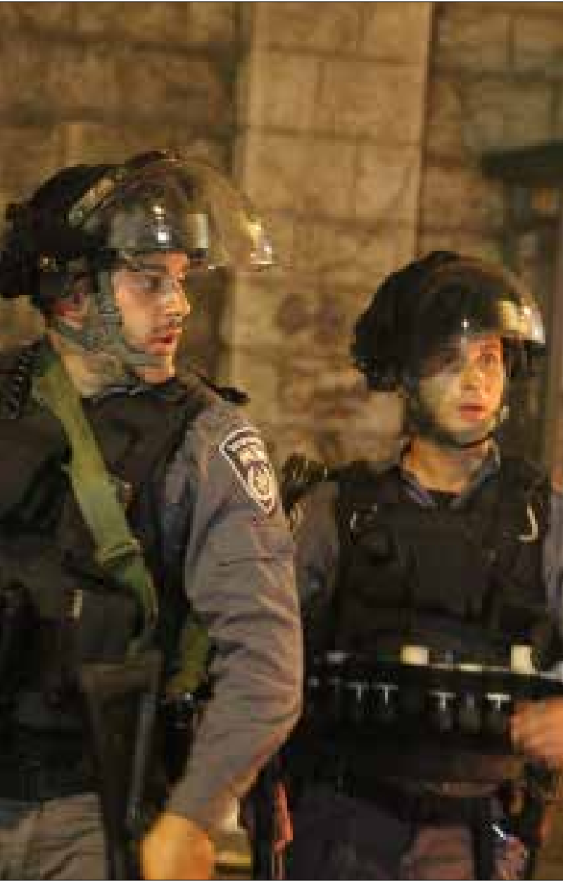
أثبتت التجارب ان الاستخبارات الإسرائيلية أقل قدرة على استشراف فعل الجماهير

الأقل لم يصدر أي تعليق يزعم أن ما يجري كان متوقفاً، على مستوى النطاق الجغرافي أو حجمه أو أساليبه وآفاقه. صحيح أن هذا الفشل الاستخباري ليس الأول ولن يكون الأخير، وهو يرافق كل جهاز استخباري في العالم، لكن ما يميزه أنه يتعلق بالساحة «الأكثر أولوية»، إضافة إلى أن هذه الأجهزة تملك تسليطاً وسيطرة على هذه الساحة بما لا يتوافر في الساحات الأخرى. ومع ذلك، فإن الفشل الاستخباري الإسرائيلي إزاء الهبة الشعبية الفلسطينية التي لا تزال تتفاعل، تجلى في أكثر من عنوان: أصل الحدث، وتوقيتته، ونطاقه ومداه،