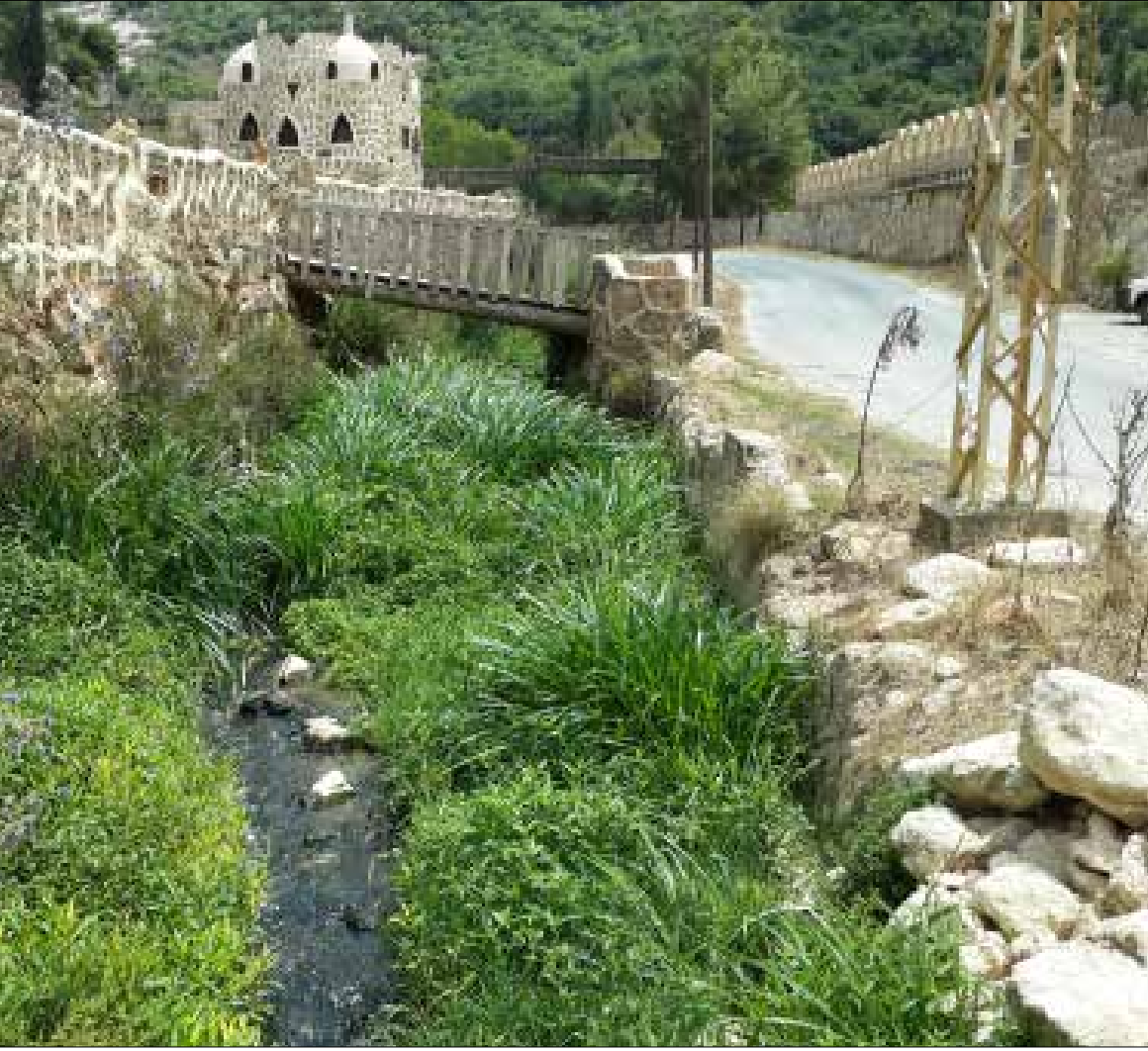
موازنة بلدية تفاعتا لا تتخطى 290 مليون ليرة، فيما المشروع يحتاج إلى ملايين الدولارات (الخبار)

النفايات»، وبذلك تكون النميرية، وهي البلدة الأكثر تضرراً، قد تخلصت من مشكلة أزلت سكانها على مدى سنين طويلة، وحرمتهم استصلاح أراضيهم وعرضتهم لأفات صحية وبيئية.