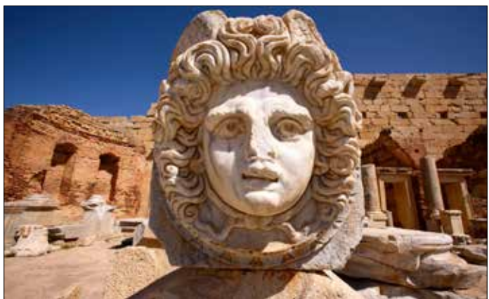
الاسم «هيدوسا» في ليدة الكبرى

لا شك في أن الفوضى السياسية العارمة في ليبيا مع وجود رأسين حكوميين في البلاد، لعبت دوراً في تدهور الأوضاع الأمنية. وقبل ذلك لم يكن نظام معمر القذافي يولي أهمية للآثار التاريخية في بلاده. وبالتالي خلق ذلك غياباً تاماً للوعي الشعبي لأهمية هذا التراث والمحافظة عليه. كما غاب أيضاً الاستثمار في هذا القطاع سباحياً بسبب الاكتفاء والعيش على عائدات النفط الليبية. وبعد انتفاضة فبراير 2011 ومقتل القذافي، بدأت تنشط البعثات الأجنبية المهتمة بعلم الآثار من إيطاليا وفرنسية لا سيما في