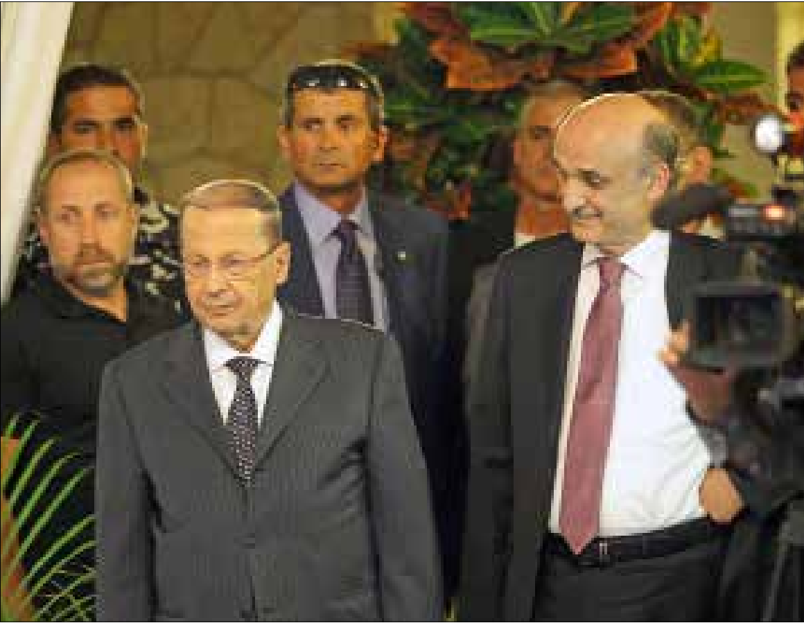
بدا خلف الكواليس نقاش بين عون وجمعهم حول مشروع قانون انتخابي جديد

هزة جديدة، يعود فريقيا 8 و14 آذار الى مناقشة قانون الانتخاب. ورغم أن كل ما يدور حول القانون استهلك منذ سنوات، ثمة احتمال لخط الأوراق، في حال أعاد التيار الوطني الحر والقوات اللبنانية درس مشروع جديد للقانون