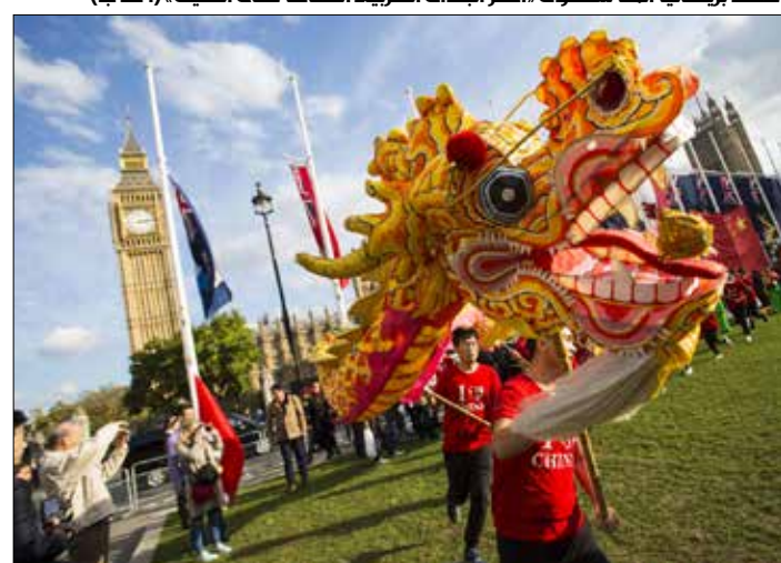
أعلنت بريطانيا أنها ستكون «أكثر البلدان الغربية انفتاحاً على الصين»

بقيادة لندن البريطانية التي تعد مركزاً مهماً للعلاقات الاقتصادية بين البلدين البريطاني والصيني في مجال الطاقة النووية، كما في مجال القطارات السريعة، تتناسب تماماً مع الحاجات البريطانية».