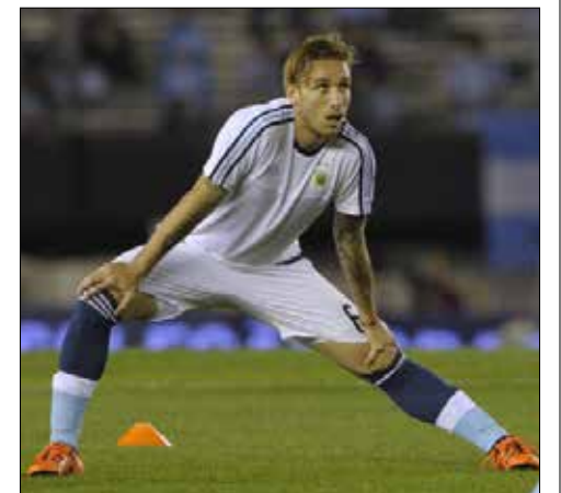
لوكاس بيليا احد اهداف ارسنال

وتوصلنا إلى هذه النتيجة». واستلم تسونينغر (48 عاماً) مهماته مطلع الموسم بعد تفادي شتوتغارت الهبوط إلى الدرجة الثانية في الموسم للماضي، كما أعفي كامل جهازه الفني من مهماته.