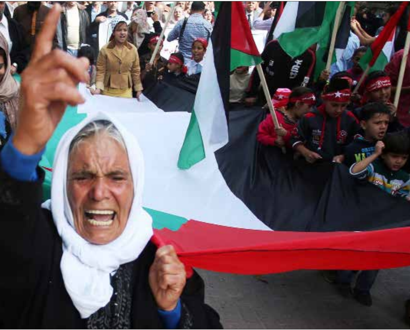
دابت البروباغندا الصهيونية على الترويج لكذبة أن الشعب اليهودي عاد إلى أرضه التاريخية