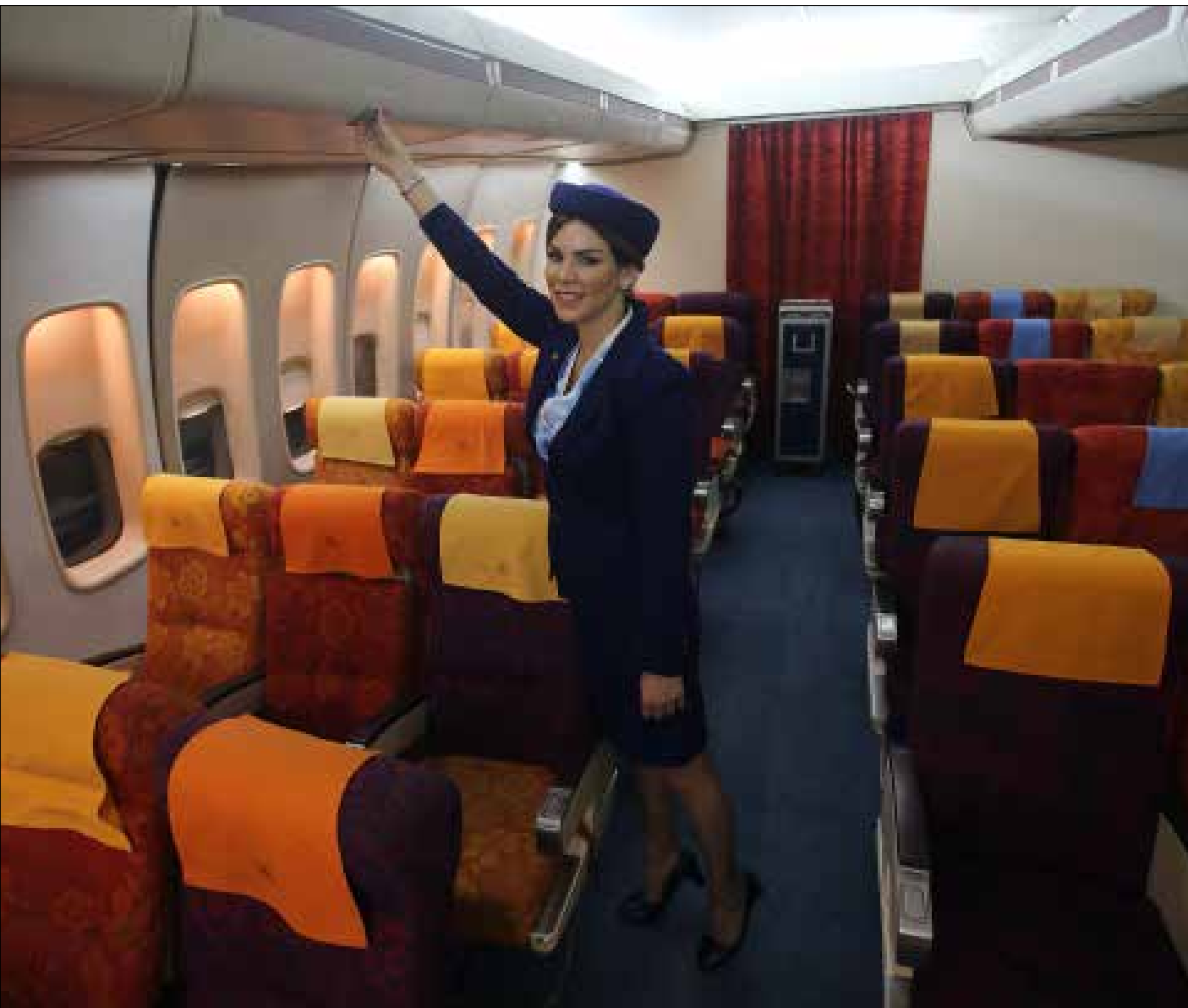
من الشروط المطلوبة التمتع بصفة القيادة (هيلثم الموسوي)

سارة، الشابة التي لا تزال تحافظ على «البشرة الصافية»، التي تضمن بقاءها مضييفة، توقن بأن جمال وجهها، الذي لم يفتر بعد برغم تقدّمها في العمر، كان جواز عبورها إلى «السماء»، وإن كانت، في الوقت نفسه، لا تنفي ميزات الأخرى التي تعدها بمثابة «push» (دفع)، حققت من خلاله الحلم. تنفجر شفهاها عن السائل البيضاء، ثم تستدير برشاقة، لم تغيرها الولادات الأربع. استدارة «توب موديل»، قد تُنسي في لحظة الطيران، «رعب ارتفاع التسعة آلاف قدم عن مستوى الأرض»، يقول أحدهم مازحاً. مزحة تحيل إلى الكثير من الأسئلة عن ماهية تلك الوظيفة التي يفترض أنها تحمل هدفاً واحداً هو خدمة المسافرين جواً: كيف يجري توصيف هذه المهنة؟ وما هي الشروط التي