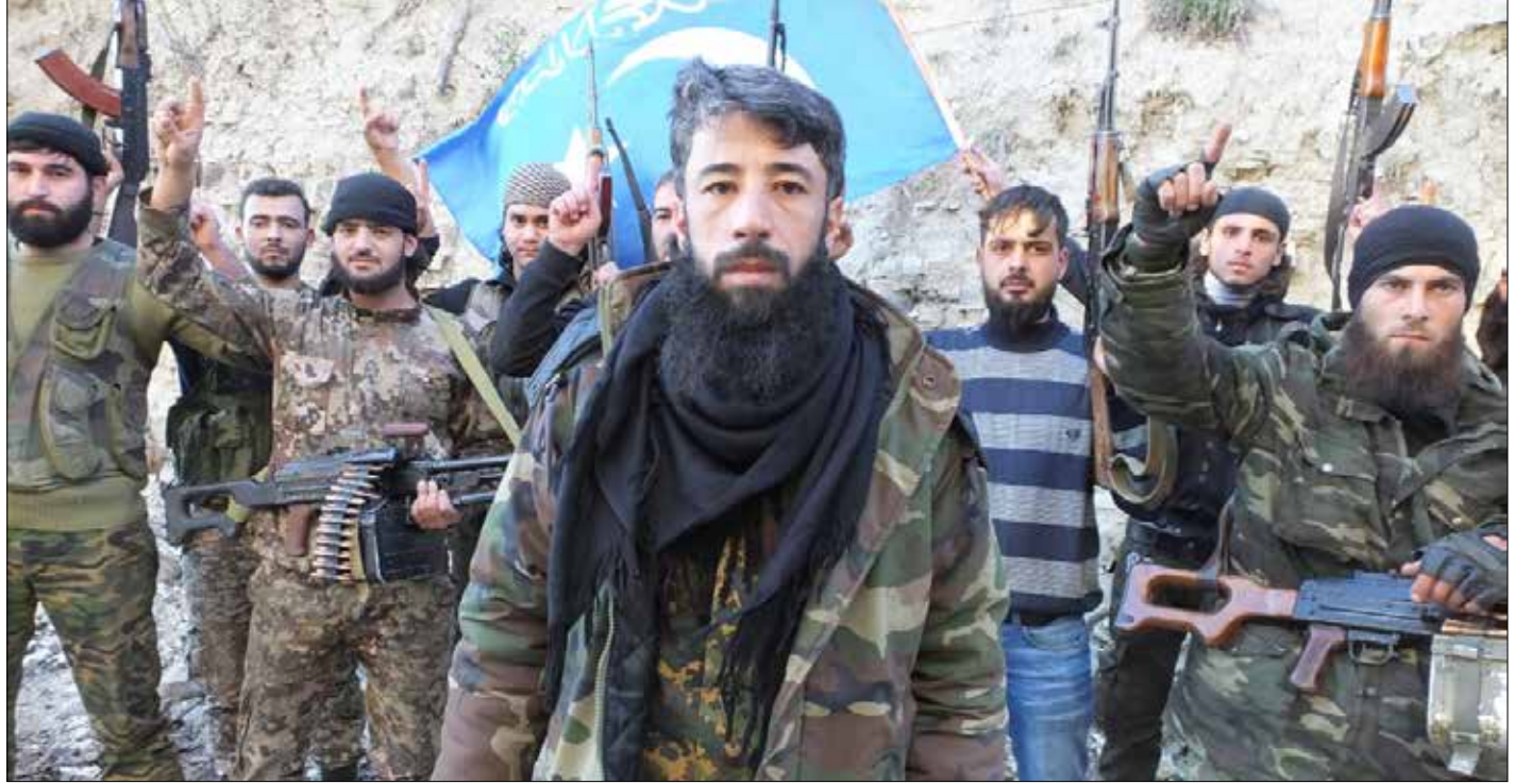
مقاتلون تركمان من «لواء السلطان عبد الحميد، في ريف اللاذقية (الناضول)