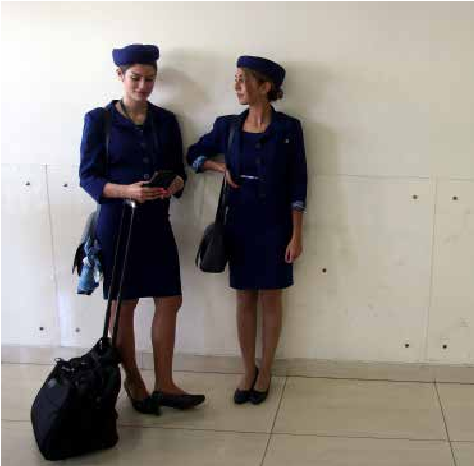
تحلم المضيفات بالسفر ويجلن العالم في سنوات قليلة