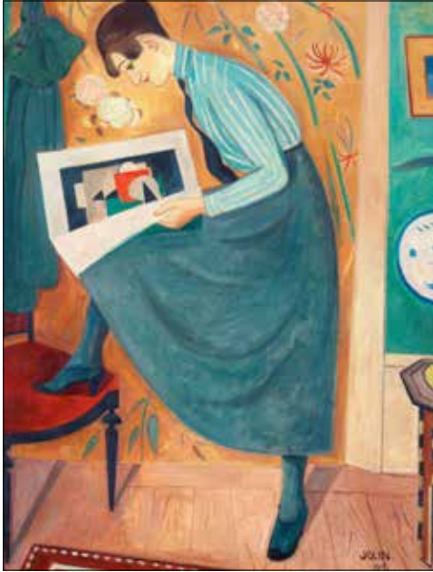
«صبيّة تقرأ» مجلة فنية، للسويدي إينور جولين (121x91 سنتم - 1919)

كما كل سنة، في جعبة منظمي «معرض الكتاب» لألحة طويلة من النشاطات الثقافية المرافقة، تتمثل في برنامج منوع من المحاضرات والندوات في حقول الفكر والثقافة والتربية والتاريخ والأدب والسياسة والنقد الأدبي والراهن السياسي المتفجر في المنطقة. ومن أبرز الأحداث في برنامج المعرض حفلة «نبض الغد» التي تحييها جوقة «مؤسسة رفيق