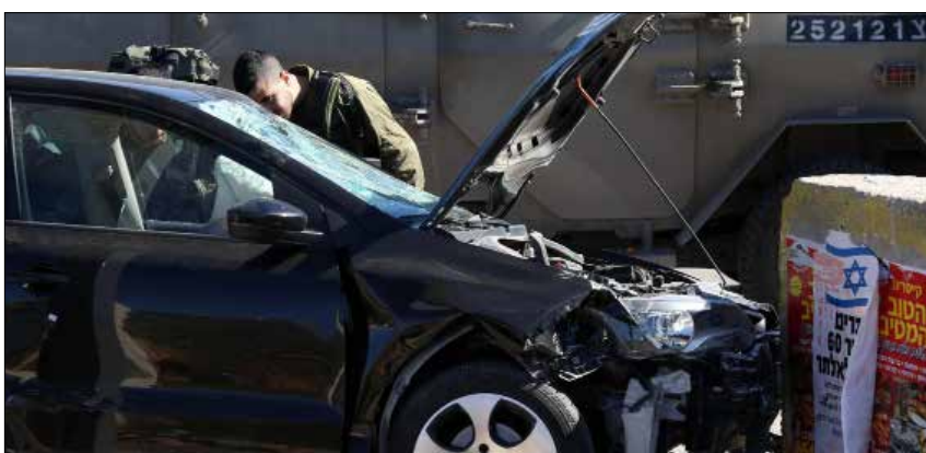
الرؤية الإسرائيلية والاميركية تقول إن العمليات الفلسطينية ليست حالة عبث وطائفة

في سياق متصل، ذكرت صحيفة «إسرائيل اليوم» أن رئيس الحكومة ووزير الأمن ورئيس الأركان، اتفقوا أمس على سلسلة من الخطوات لمواجهة «الإرهاب»، من ضمنها تركيز الجهد على استهداف حركة «حماس» التي يقدر أنها قد تبادر إلى تنفيذ عمليات قاسية وقاتلة.