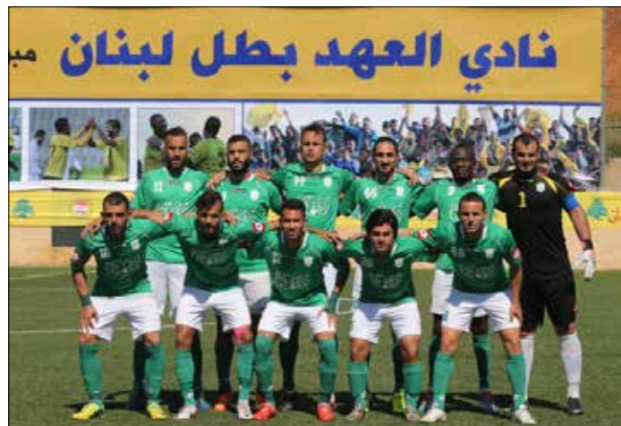
سيلعب فريقاً الانصار والعهد بعيداً عن ملعبهما لاسباب قاهرة (عمدنا الحاج علي)

اقامة مباراة الأنصار والعهد على ملعب زغرنا هي التي فرضت اقامة المباراة بين النجمة وطرابلس على ملعب المراداشية.