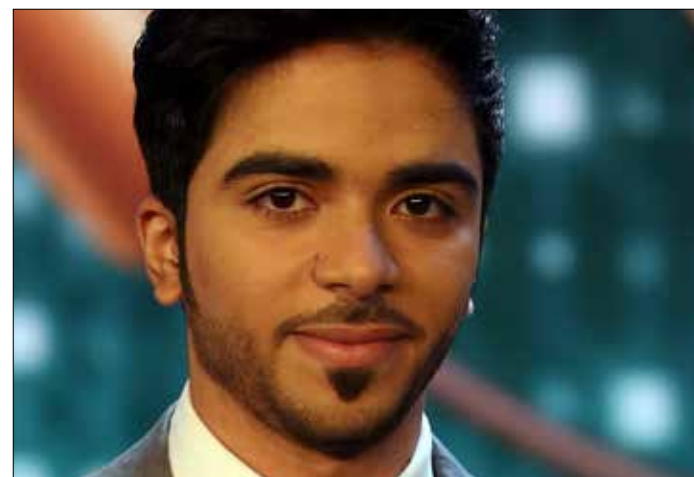
اختيار الفائز في البرنامج ليس بعيداً عن السياسة

عليه أو «أبو نورا»، قد ترك اليمن في وقت مُكر باتجاه «الأرض الحرام» مدفوعاً بالبحث عن لقمة العيش. بتذكر اليمينيون جيداً الحفلات الثلاث التي أداها محمّد عبده في ثلاث مدن يمنية عام 2004، وتعهد خلالها عدم ارتداء الزي السعودي التقليدي. وحين سألته مذيعه في