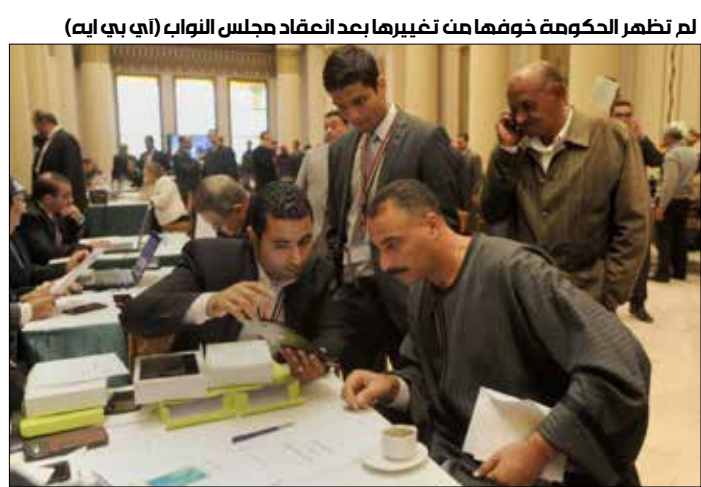
لم تظهر الحكومة خوفاً من تغييرها بعد انعقاد مجلس النواب (أي بي إيه)

الإعلام»، مشيراً إلى أن هناك أربع وزارات دُمجت في التعديلات الأخيرة سيُعلن نواب فيها قريباً. وأعلن رئيس الحكومة رغبته في عرض خطة الحكومة على النواب في البرلمان مع انعقاد جلساته، وسيطلب الحديث في أكثر من جلسة لعرض وجهات النظر في مختلف القضايا أمامهم، مؤكداً أن جميع القوانين ستعرض عليهم ليقرروا موقفهم منها وأولويات مناقشتها.