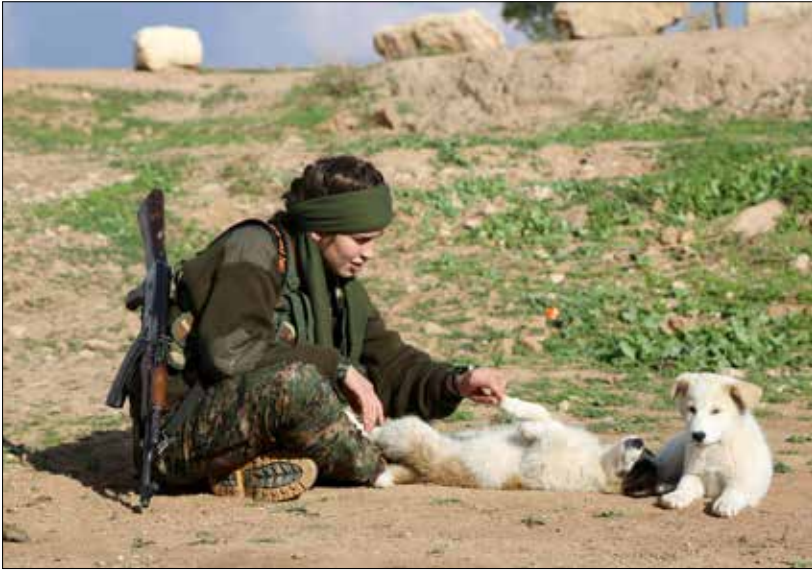
مقاتلة ضمن «قوات حماية نساء بيت نهرين» التابعة لـ «المجلس العسكري السرياني»

الجبل الاستراتيجي المشرف على بلدة سلمى، أبرز معاقل المسلحين في المنطقة. ومن معوقات العملية التي تعثرت مرات سابقة «الطبيعة الجبلية الوعرة والبرد الشديد الذي يصعب عمل القوات البرية»، حسب المصادر، وذلك على الرغم من التغطية الجوية المكثفة من سلاح الجو الروسي. وتضيف المصادر أن «الاستفادة من الأخطاء السابقة هي عنوان العملية الجديدة التي بدأتها القوات، أمس، للسيطرة على تحصينات الجبل الاستراتيجي». وتلفت المصادر إلى «وقوع قتلى وجرحى عديدين بين صفوف المسلحين جراء الاشتباكات القائمة على المرتفعات الشرقية».