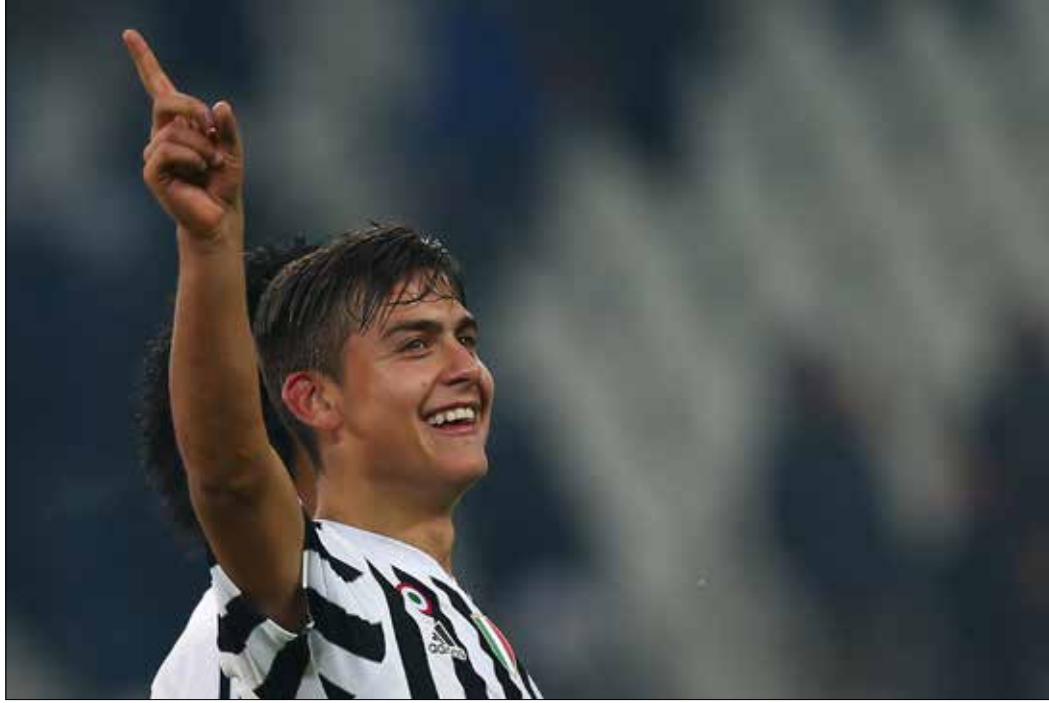
سجلك ديبالا 8 اهداف من اصله 25 هدف حتى الان

كان يتابعه منذ كان لاعباً في الأرجنتين، لكن لم ينجح في الحصول على خدماته سابقاً، لذا ما زال يحاول من جديد. لم يقف ديبالا حائراً، للاختيار بين الاثنين، وبرغم أنه كلام غير رسمي على الإطلاق، من الواضح أنه يفضل النادي الكاتالوني، لا لتشجيعه لهم بل لوجود مواطنه النجم - قذوته - ليونيل ميسي. من من اللاعبين، الأرجنتينيين تحديداً، لا يحب مجاورة «البرغوث» في الملعب؟ في المشهد العام، وإذا ما كان لاعب موهوب يرى في ميسي قذوته، فإنه سيكون «الجوهرة» أو «الأخويا» باللغة الإسبانية، كما أطلق الأرجنتينيون عليه. يسعى اللاعب ذو الـ 22 عاماً، ولو لم يقل ذلك، إلى إخبار جمهور الـ «يوفتي» على