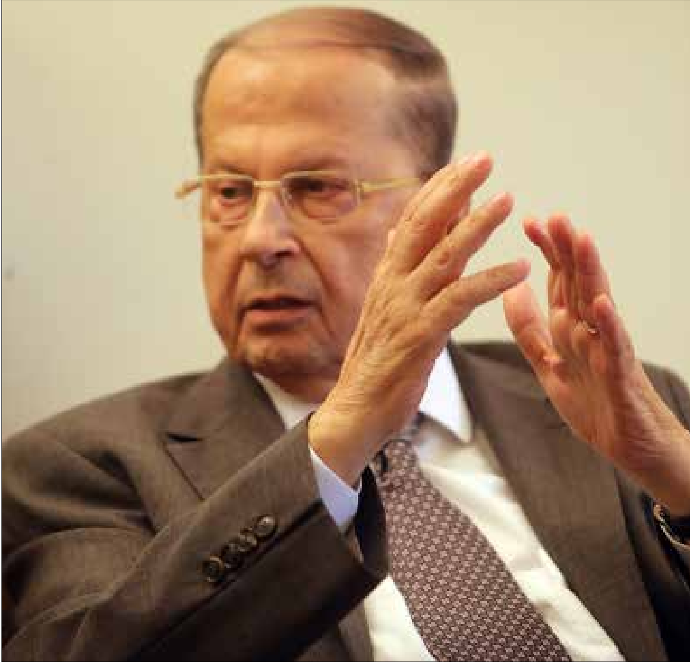
نصرالله: اسم عون مكتوب على كفتي (هيثم الموسوي)

من غير المستبعد استغراق مبادرة الرئيس سعد الحريري في رقاد طويل قبل ان تفيق البلاد على صدمة انتخاب رئيس. اي صدمة، بمن وبأي رئيس؟ حتى ذلك الوقت يلبث النائب سليمان فرنجييه بين حلفائه من غير كتم تصدّم اصابهم