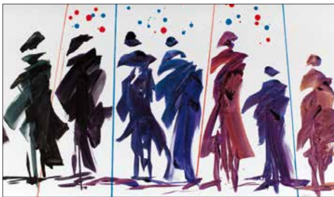
هت المعرض (حبر على ورق - 2015)