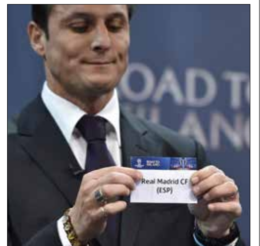
زانيتي يسحب اسم ريال مدريد

سينتظر عشاق دوري أبطال أوروبا لكرة القدم حلول شهر شباط المقبل بفارغ الصبر لمتابعة دور الـ 16 بعد أن أسفرت القرعة التي سحبت أمس، في نيون السويسرية، عن ثلاث مواجهات من العيار الثقيل، هي أرسنال الإنكليزي ضد برشلونة الإسباني، ويوفنتوس الإيطالي ضد بايرن ميونيخ الألماني، وباريس سان جيرمان الفرنسي ضد تشلسي الإنكليزي. وهنا نتيجة القرعة: غنت (بلجيكا) - فولسبورغ (ألمانيا) روما (إيطاليا) - ريال مدريد (إسبانيا) باريس سان جيرمان (فرنسا) - تشلسي (إنكلترا)