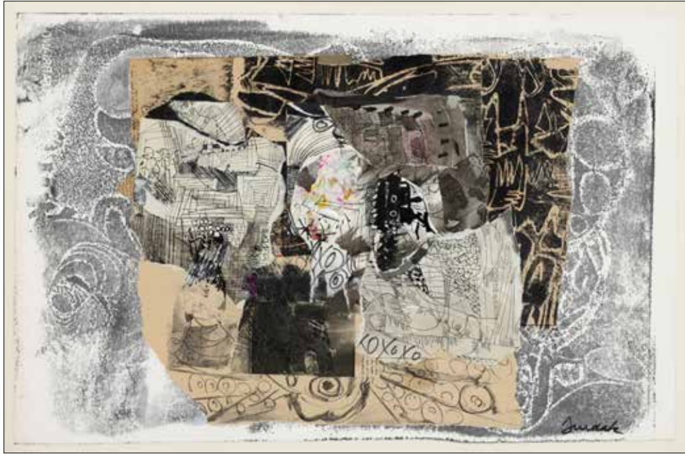
«هت دون عنوان» (2000 - كولاج على ورق نقل - 71 × 47 سنتم)