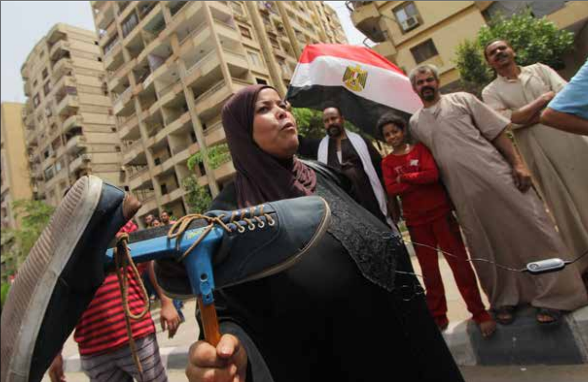
أعلنت «إخوان الإسكندرية»، التزامهم «المنهج الثوري الكامل»، المستقى من أدبيات الجماعة (أي بي إيه)

فتح ظهور القيادي محمود حسين على فضائية «الجزيرة» جبهة جديدة من جهات الصراع الإخوانية، التي يبدو أنها تتجه ناحية التشطي، بعيداً عن التيارين المتصارعين على قيادة الجماعة حالياً