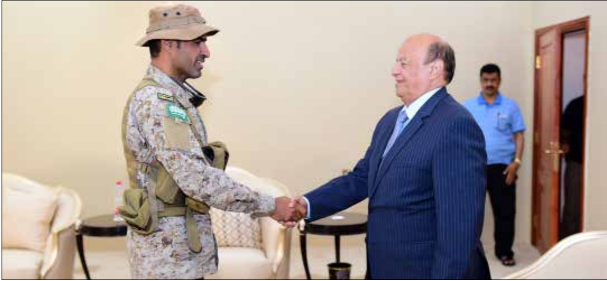
من لقاء الرئيس الفار عبد ربه منصور هادي بقائد القوات الخاصة السعودي عبدالله السهيان الذي قتل أمس

والمجموعات المسلحة، ويوجهون رسائل سياسية مفادها أن حركة «أنصار الله» التي يشن عدوان عليها منذ تسعة أشهر لن تدفع أي ثمن لوقف الحرب، وأن الرياض ستهرع، بفعل هذه الضربات، إلى القبول بوقف النار ورفع الحصار والتخلي عن سقفاها العالي وبالتالي إلى نسيان شرط تسليم السلاح وعودة عبد ربه منصور هادي وحكومته إلى الحكم من جديد. «أنصار الله» قالت من جديد يوم أمس، إن لها اليد الطولى في هذه الحرب، وإن أشهر العدوان الطويلة لم تؤثر بترسانتها العسكرية التي أدخلت عليها صواريخ جديدة، وأنه لا يزال بإمكانها أن توجع الأعداء أكثر من ذي قبل، وبالتالي إن هذه الحرب كانت برمتها غير مجدية.