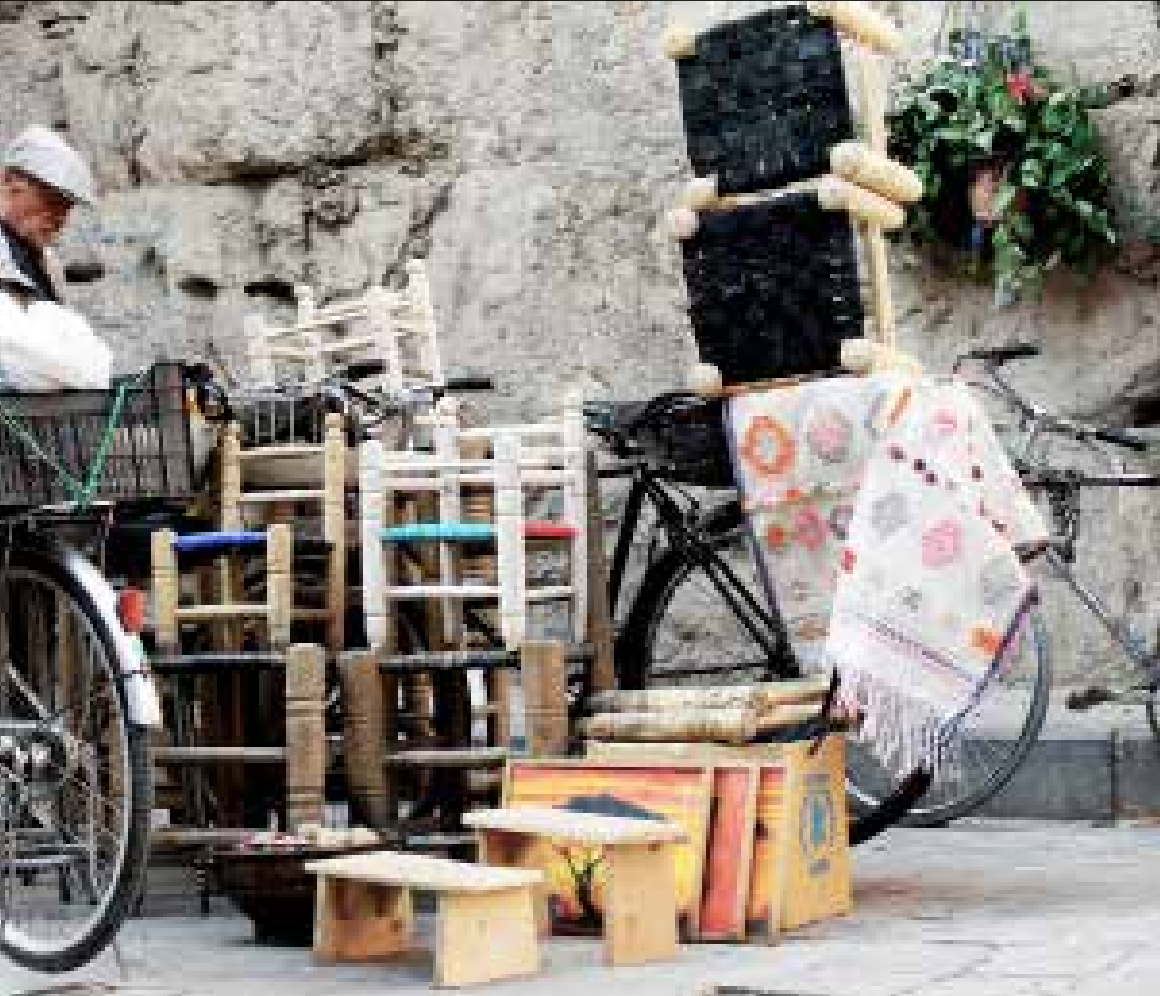
الروس باتوا مكوناً مهماً من مكونات المدينة، وجميع المؤشرات تدل على أن إقامتهم طويلة (هادي أحمد)