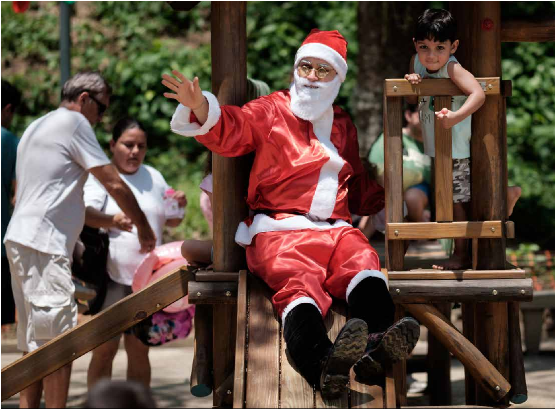
فيما الاستعدادات مستمرة في مختلف أنحاء العالم لاستقبال عيد الميلاد في 25 كانون الأول (ديسمبر) الحالي، ارتدى رجب برازيلي أخيراً ثياب بابا نويك وراح يلعب مع الأطفال في وضوح النهار في حديقة «غوينك» في ريو دي جانيرو، ويلتقط الصور التذكارية معهم.