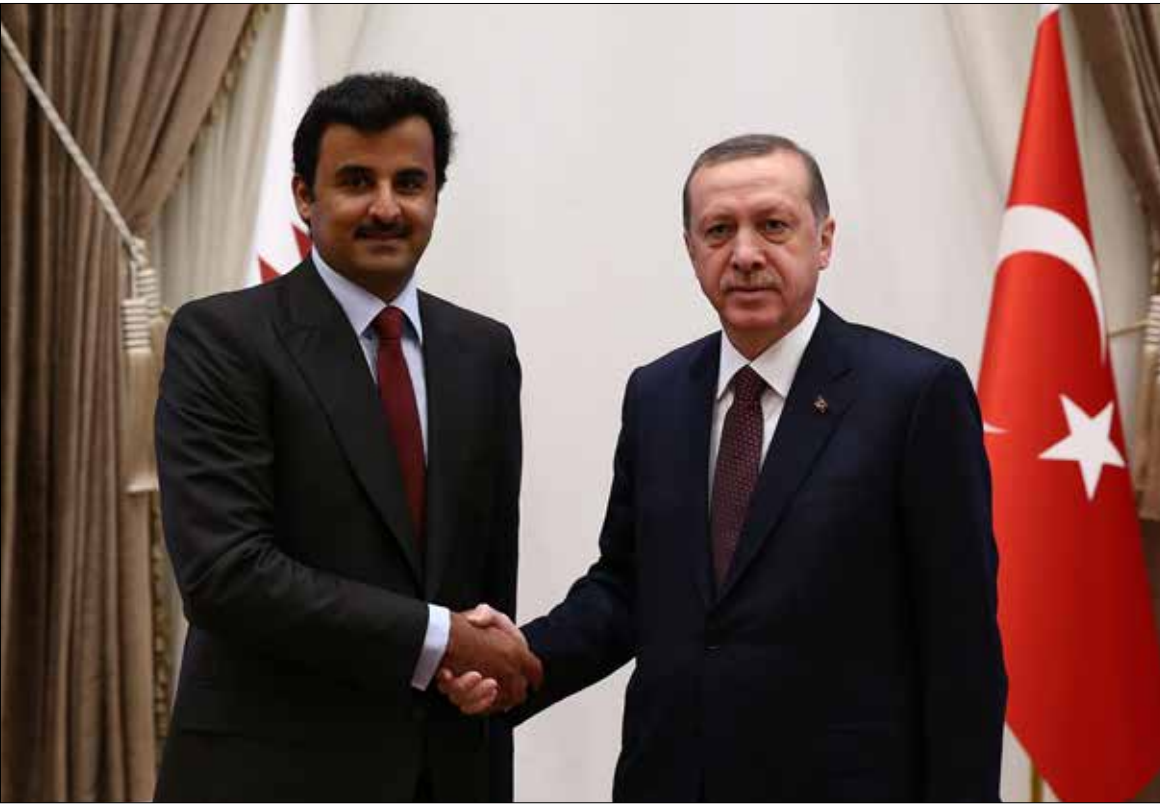
وقعت انقرة والدوحة عام 2014 اتفاقية لمواجهة «الأعداء المشتركين»، (أرشيف)

الغموض والبلبلية يلفان «التحالف الإسلامي»: لم نعرف به ولا نريده... عسكرياً