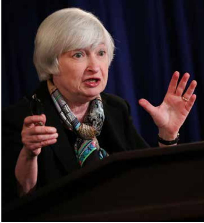
جانيت يلين (ارشييف)

الزيادة. ووعدت اللجنة برفع نسبة الفائدة لاحقاً، وبشكل تدريجي، لتصل إلى 1,4% في نهاية العام المقبل، معتبرة أن سوق العمل في الولايات المتحدة قد «تحسن إلى حد كبير» العام الجاري، ومعربة عن ثقتها في معاودة ارتفاع نسبة التضخم نحو هدف 2%. ومع هذا القرار، يطوي الاحتياطي الفيدرالي صفحة السياسة النقدية التي أنقت معدل الفائدة يحوم حول الصفر، والتي اعتمدها البنك عند انفجار الأزمة الاقتصادية عام 2008، في محاولة لتحفيز النمو.