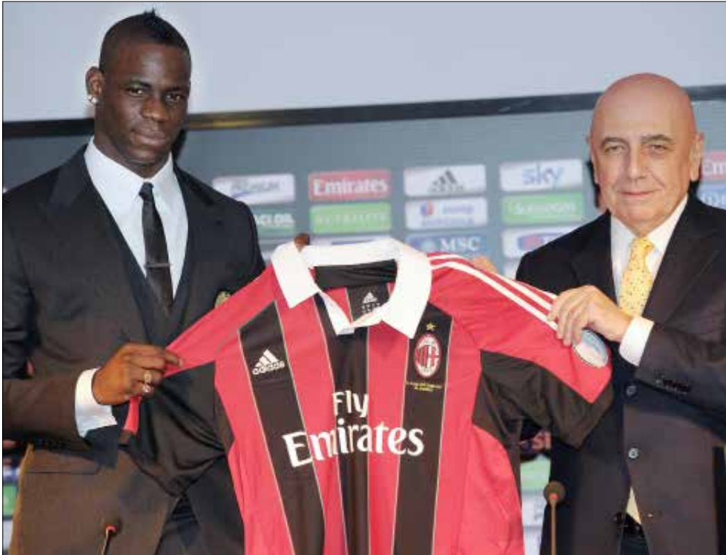
إذا ما أراد ميلان تحسن حال الفريق فعليه أولاً أن يخفف من سلطة غاليناني داخل النادي

إذا ما أراد برلسكوني تحسن حال الفريق، فعليه أولاً أن يخفف من سلطة غاليناني داخل النادي، وخصوصاً على صعيد التعاقدات غير النافعة، وتعيين مساعد إداري خبير بالشؤون الفنية، ويمكك عيناً تصطاد مواهب تؤثر في المباريات، لا «تاجر» يبيع اللاعبين ثم لا يلبث أن يحتاج للتعاقد معهم مجدداً مثلما يحصل حالياً مع الغاني كيفن برينس بوتاتينغ، وإلا فسيفي النادي منافساً على المراكز المؤهلة لـ «يوروبا ليغ»، أو دوري أبطال أوروبا في أحسن الأحوال.