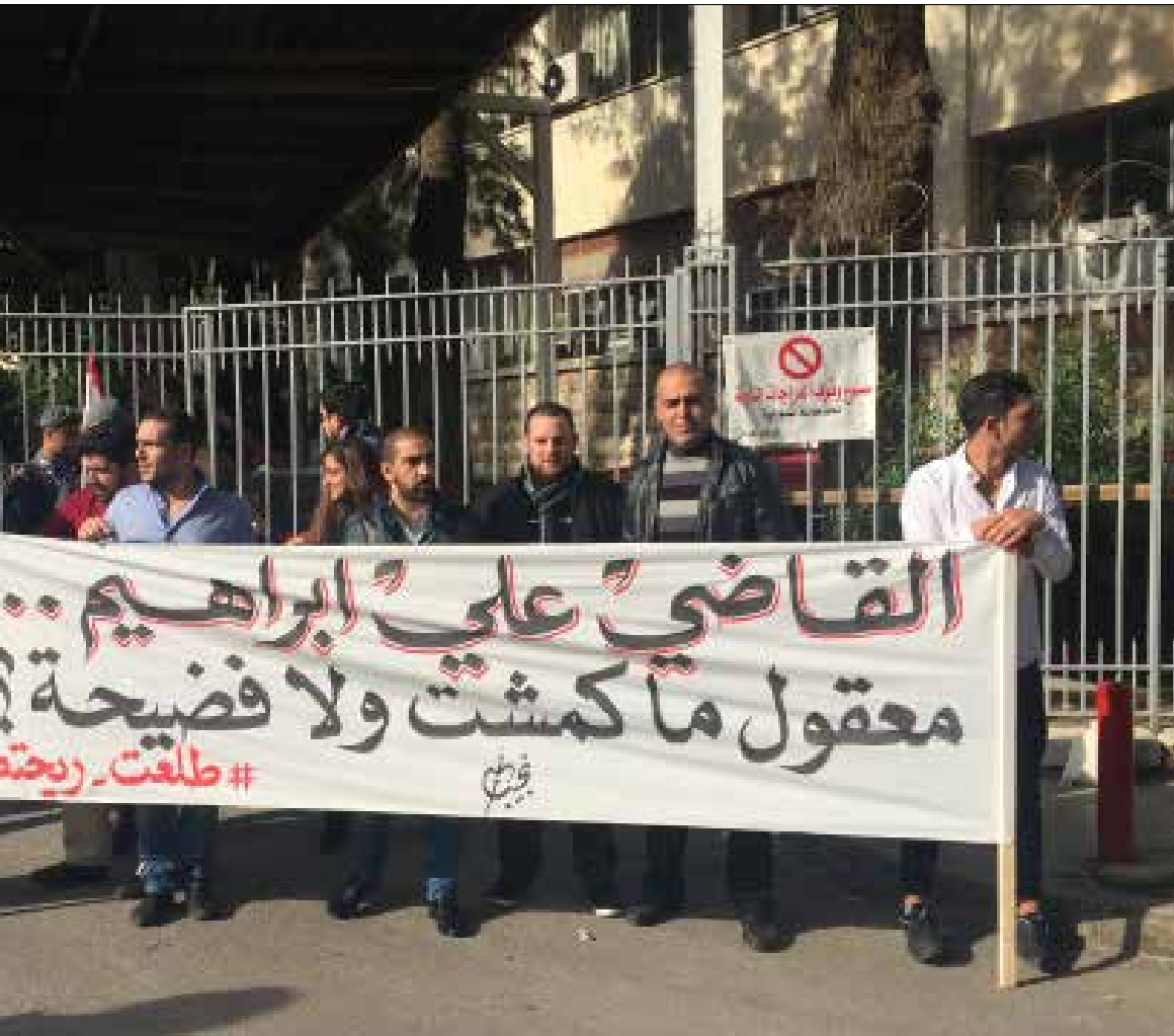
بعد 10 أيام سيعلم القاضي نتائج التحقيقات مع سوكلين