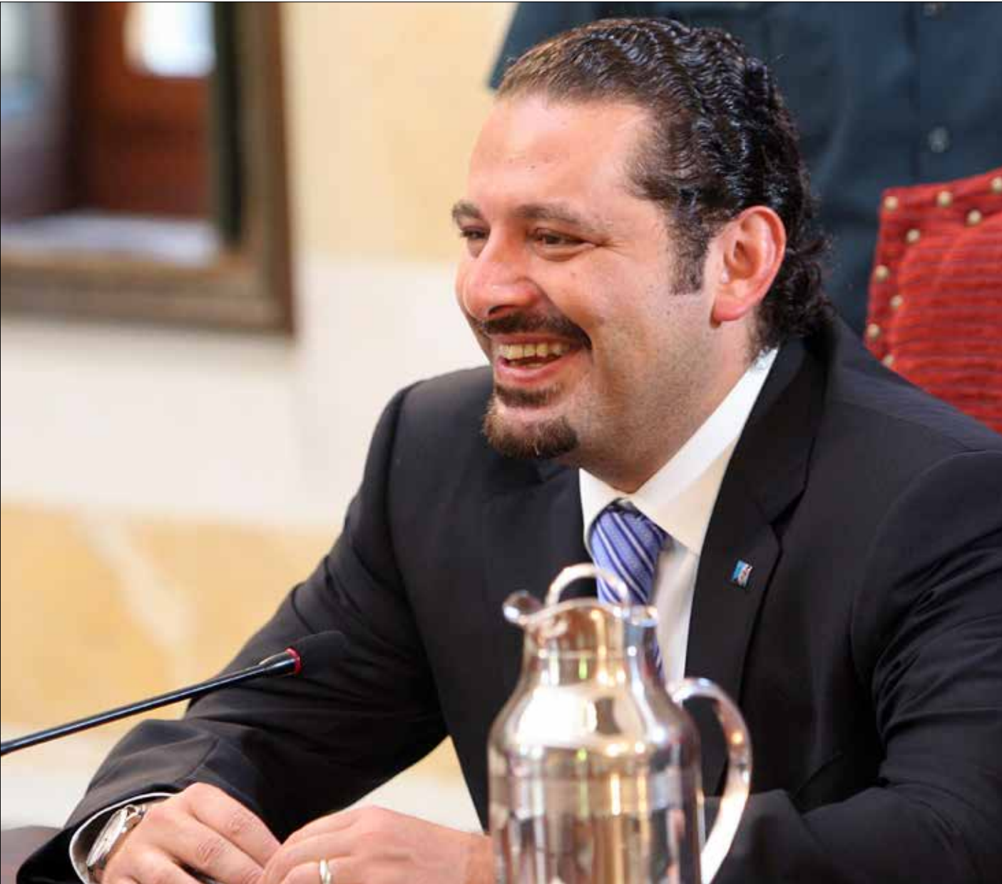
مستشاره الحريري بين الرابطة ومعراب: التسوية ماشية!

فيما السجال دائر حول أزمة النفايات ومشروع ترحيلها، استمرت القوى السياسية بمناقشة مبادرة الرئيس سعد الحريري بشأن انتخاب النائب سليمان فرنجية رئيساً للجمهورية، وبانتظار إطلاقة الأخير المتلفزة اليوم، عبّر رئيس حزب القوات لحلفائه في تيار المستقبل عن موقفه من اقتراحهم للتسوية الرئاسية