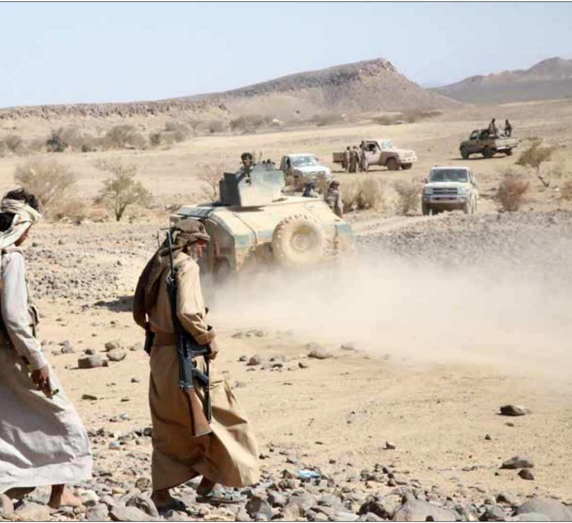
تجددت الهجمات في مأرب بالتزامن مع الغارات الجوية عليها

ورسحت من سويسرا يوم أمس، سلسلة معطيات تشير إلى إمكانية أن تلاقي المحادثات مصير «جنيف 1»