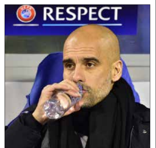
اتخذ «بيبي» قراره بالرحيل

ضجت الصحافة العالمية أمس بنبا توسعت فيه صحيفة «ذا دايلي مايل» البريطانية ومفاده رحيل الإسباني جوسيب غوارديولا عن بايرن ميونخ بطل ألمانيا عند نهاية عقده أواخر الموسم الحالي. وفي وقت ذكرت فيه صحيفة «ذا دايلي مايل» البريطانية أن «بيبي» اتخذ قراره وسيعلم هذا الأمر في الأسبوع المقبل، ذهبت إلى القول بأن بايرن سيستبدل مدربه الحالي بالإيطالي كارلو انشيلوتي الذي عُرض عليه تدريب تشلسي لكنه لا يملك الحماسة للعودة إلى الفريق اللندني. هذا وقد أفادت الصحيفة عينها