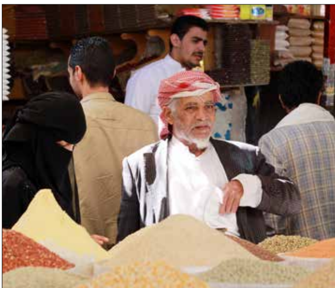
«لا احد اليوم يرفع بصره حين تحلق الطائرات عشان يشوفوا مكان الغارات»

والجامعات والمدارس أيضاً دوامها بنحو طبيعي، وكذلك الشركات الخاصة التي صمدت ولم تغلق أبوابها. وفيما كان القصف السعودي على العاصمة يعلّق الدوام بين الآخر، لم يعد الأمر كذلك