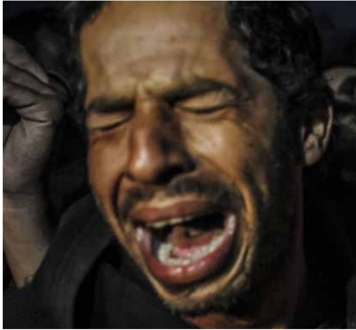
«تكاليف الدفن مرتفعة في ألمانيا، منذ 2000 يورو وما فوقه، طول عمرنا ندفن موتانا بالرقعة ببلاش» (الناضول)

المصري. وفي النهاية تعيش غريباً، وتموت غريباً، وتدفن غريباً». أما في فرنسا، فالمشكلة كبيرة، لا تتجاوز المقابر المخصصة للمسلمين عدد أصابع اليد، وتكاليف الدفن عالية جداً، ويتم وفق نظام إيجار القبور من 15 إلى 30 عاماً، وبعد انقضاء المدة المحددة يحق لـ«الشركاء الموتى» إخلاء القبر وإحراق ما بقي من الجثة، وهذا مخالف للشريعة الإسلامية.