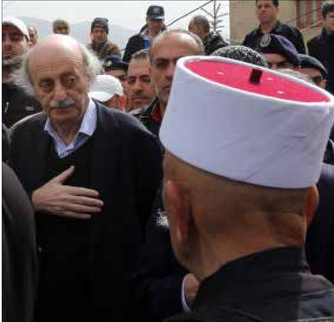
التيار الوطني الحر: جنبلاط يريد تجنيس 500 عائلة درزية سورية

في المقابل، يتهم مصدر في التيار الوطني الحر «تيار المستقبل الذي لا يريد أن يظهر مجدداً ضد حقوق المسيحيين، بالاعتراض على القانون على لسان مكارى». أما جنبلاط «فيريد تجنيس ما لا يقل عن 500 عائلة من الدرور السوريين من أبناء جبل السماق وجبل الدرور من النازحين خلال الأزمة إلى الشوف وعاليه، وممن لديهم فروع في لبنان من الدرور في سوريا والأردن». وتقول المصادر إن «جنبلاط يريد تحصين واقعه الانتخابي في الشوف تحديداً عبر التجنيس، في ظل ارتفاع موجة الهجرة وتناقص أعداد الدرور اللبنانيين». غير أن مصادر الحزب التقدمي الاشتراكي تضع الطعن في خانة «إعطاء الحق لمن يستحق»، وتسال «أيهما أحق بالجنسية: من يعيش في البرازيل منذ 80 عاماً ولم يعد يربطه بلبنان شيء، أم ذو الأصل اللبناني الذي يعيش على مقربة من الحدود ولا يزال لديه أقارب وأهل وارتباط بلبنان؟».