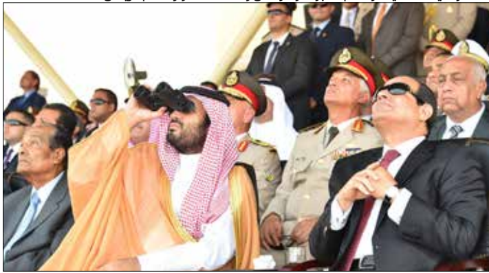
القاهرة ليست في موضع القبول والرفض وحتى المناورة مع الرياض

التلاعب بمبادئ الإسلام، مشيراً إلى دور الرياض ومسؤوليتها الخاصة في هذا المجال. ورأى لافروف أن مبادرة الرياض لتوحيد جهود الدول الإسلامية في محاربة الإرهاب قد تشكل نقطة انطلاق لعقد مؤتمر أممي لبحث دور البيانات العالمية في التصدي للفكر الديني المتطرف. (الأخبار، رويترز، الأناضول)