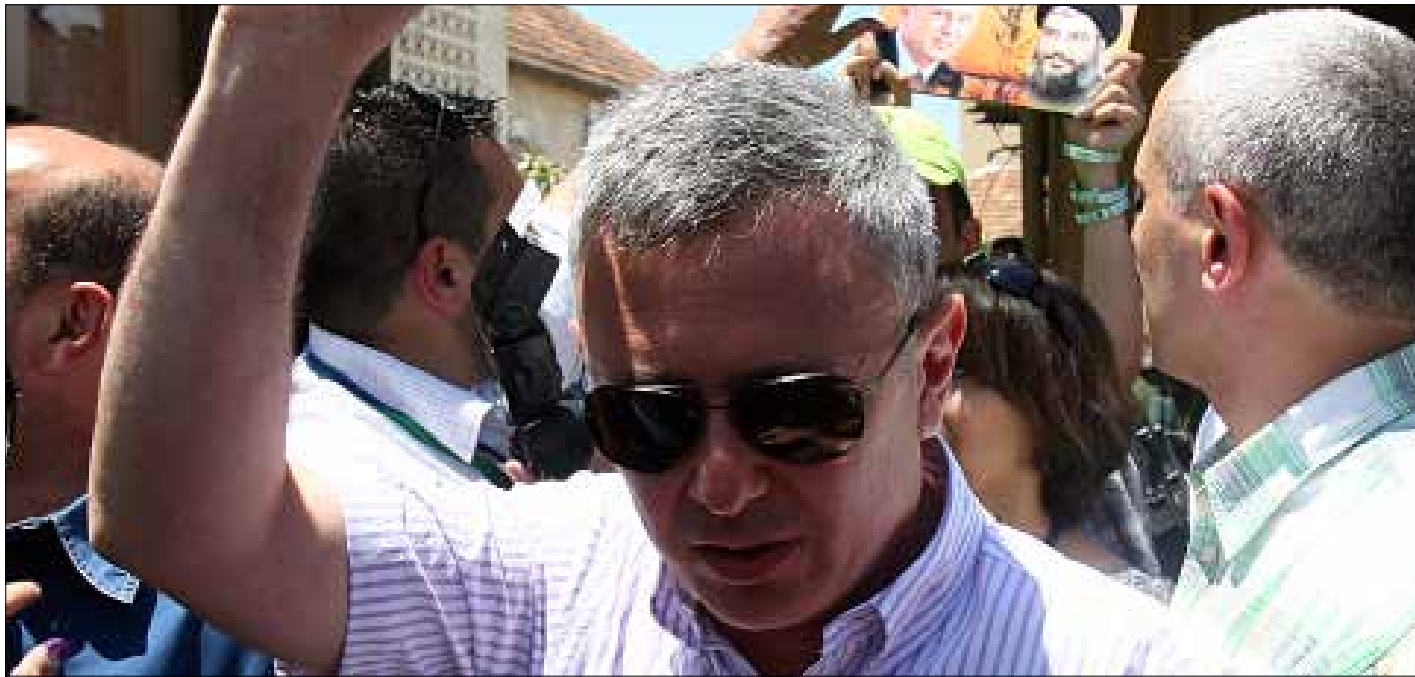
لم يقله حزب الله لفرنجيه انه ضد انتخابه، ولا قال انه يؤيده، ولا طلب انسحابه

سالك الحريري فرنجيه هل يزور بعد انتخابه رئيساً الرئيس السوري؟