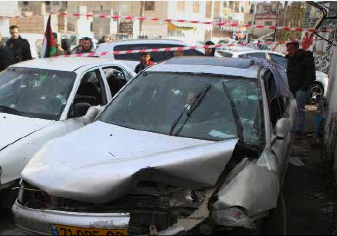
فلسطينيون حول السيارة التي نفذت بها العملية في قلنديا أمس

فلسطين يواصل العدو الإسرائيلي استباحته للمناطق الفلسطينية بعدوانية كبيرة وحملة اقتحامات واعتقالات مستمرة منذ ثلاثة أشهر. تصدى شباب قلنديا لاجتياح مخيمهم أمس و نفذوا عمليتي دهس خلاك الاشتباك بالحجارة