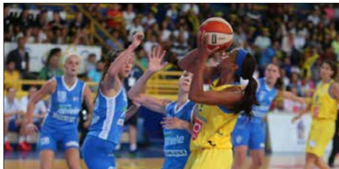
واضع الاتحاد على مشاركة لاعبة أجنبية في كل فريق في الموسم المقبل (ارشيف)

مباريات المربع الذهبي والنهائي، وقد تمت الموافقة على الاقتراح. كذلك أخذ الاتحاد العلم بكتاب اتحاد غرب آسيا حول تحديد موعد كأس أندية السيدات من 21 إلى 25 آذار المقبل في الأردن، بمشاركة لاعبة أجنبية، وتمت