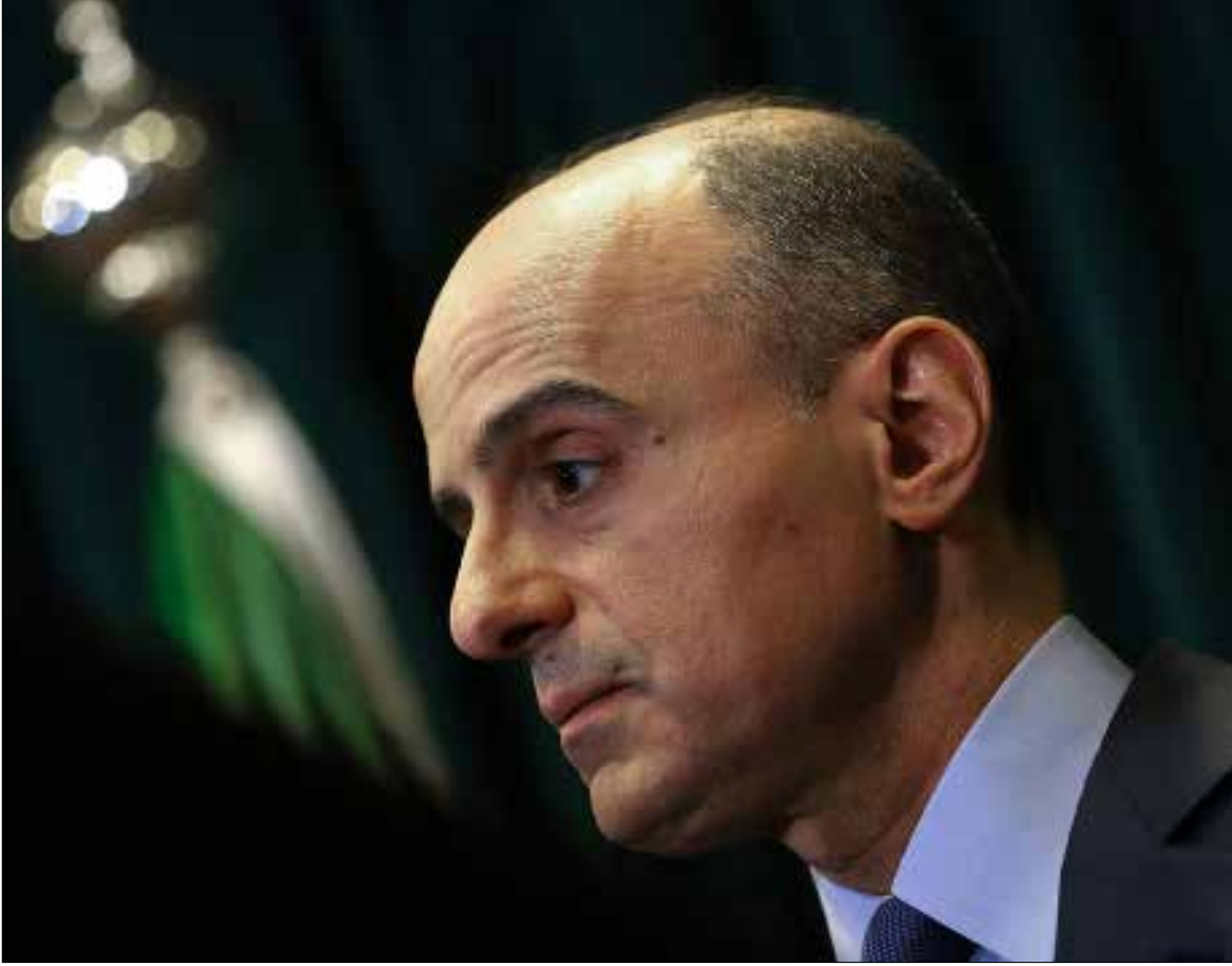
قام الجبير بترداد الأقاويل ذاتها التي تندرج في إطار صناعة السعودية للحدث

بدا واضحاً أمس أن السعودية، التي أوغلت في ممارسة الكيدية في وجه إيران، انتقلت في حربها المضمره ضد الأخيرة إلى مرحلة العلانية، بقطع العلاقات، في خطوة أتبعها بتحشيد غير مسبوق للحلفاء للحدو حذوها، لم تفلح إلا في إخضاع البحرين والسودان الواقعتين تحت الهيمنة السعودية. فيما أبدت الإمارات حداً أدنى من المسايرة، من خلال خفض التمثيل الدبلوماسي الإيراني لديها، خصوصاً أن مصالحها الاقتصادية والتجارية مع إيران تمنعها من رفع سقف تجاوبها مع السعار السعودي. لكن الضربة الأشد جاءت من أنقرة، التي أسست والرياض قبل أيام مجلساً أعلى للتعاون الاستراتيجي. لم تكتف تركيا بإدانة إعدام نمر النمر، بل دفعت موقفها إلى وضع السعودية مع طهران في نفس خانة «الأصدقاء» الذين لا تريدهم أن «يقتلوا»، وذلك في موقف تراقف مع