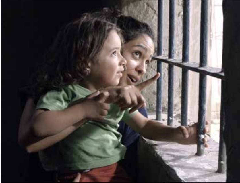
مشهد من «3000 ليلة»

بنفي هذا نجاح الإيقاع في اصطيد المتفرج حتى النهاية. رموز التحزّر والخلاص حاضرة برفق وروية. الحصان ذو الأجنحة. عصفور الطيران. الرسم على جدار المنفردة. اسم البطلة «ليال عصفور» نفسه، التي تلد «نور»، وتتحوّل تدريجاً إلى «سناء». نشيد «يا ظلام السجن خيم» الذي ألّفه السوري نجيب الرّيس، متحدياً الاحتلال الفرنسي من منفاه في جزيرة أرواد عام 1922.