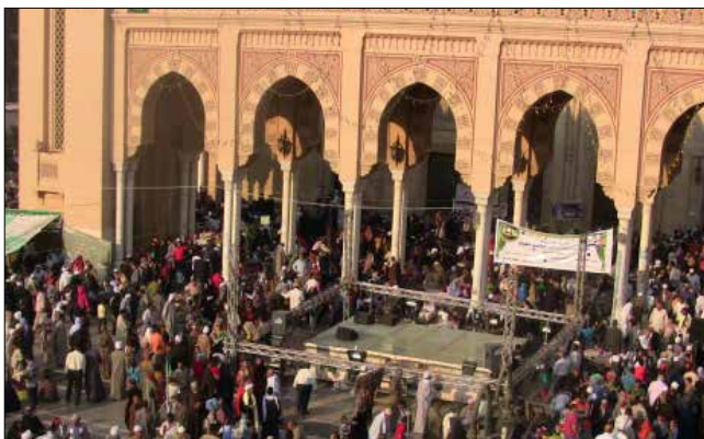
عزلت الوزارة 49 إماماً خطيباً ليثم خطاباً متشدداً