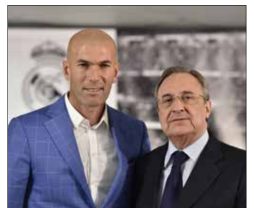
بيريز وزيدان بعد المؤتمر الصحافي امس

حقق رئيس نادي ريال مدريد الإسباني، فلورنتينو بيريز، الحلم الذي راوده طويلاً بتعيينه النجم الفرنسي السابق زين الدين زيدان مدرباً للفريق الملكي بعدما أقال المدرب رافايل بينيتيز بسبب سوء نتائج الفريق.