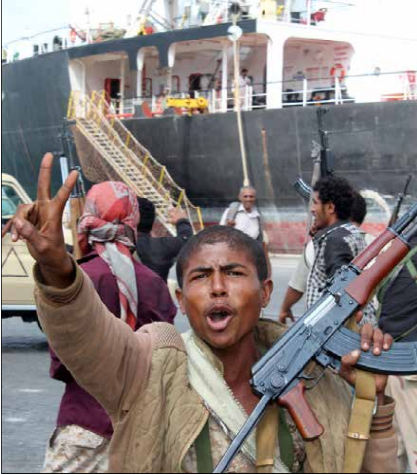
يستعد التحالف السعودي إلى جولة مفاوضات أخرى غير واضحة المعالم

بمعنى أن تصبّ النتائج الميدانية في القنوات السياسية، كذلك فإن واشنطن رمت من المفاوضات إلى تشييد، وإن متأخر، لاستراتيجية الخروج من العدوان، يمكن تفعيلها عند الحاجة. ويستعد «التحالف» في المرحلة المقبلة للعمل على خطين متوازيين؛ الأول، الحشد والتجهيز والتدريب، استعداداً لجولات عسكرية في أكثر من جبهة. والثاني، الإعداد لجولة مفاوضات أخرى غير واضحة المعالم، في التاريخ والمكان وجدول الأعمال.