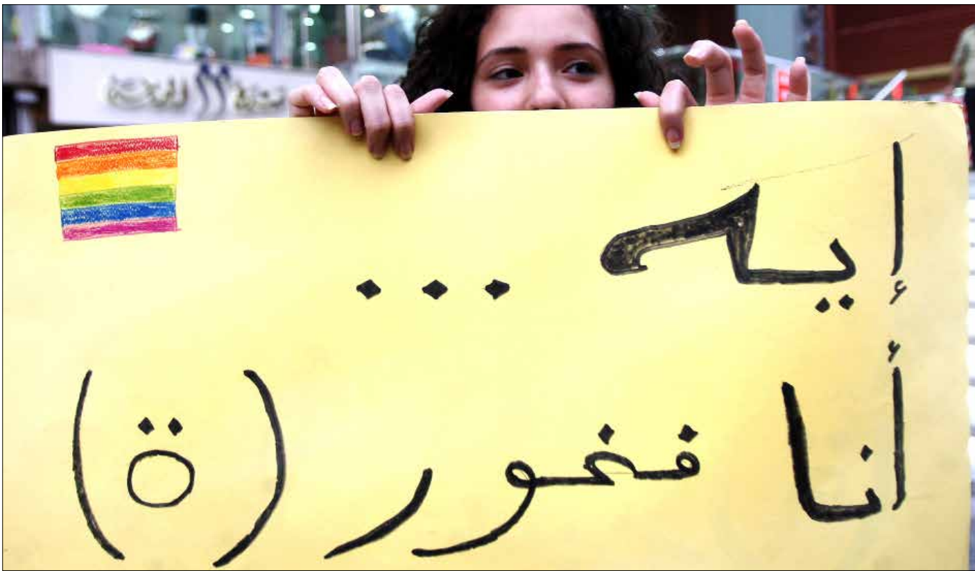
مسألة هويات متغيري النوع الاجتماعي تكسب تعاطف الرأي العام (بلاك جاوبش)