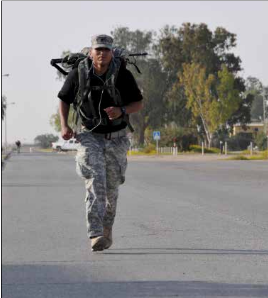
جندي أميركي من قوات حفظ السلام الدولية في سيناء

على المستوى الإنساني، شهدت مناطق جنوب الشيخ زويد نزوح الأهالي من منازلهم ليلاً بعد قصفهم بعشوائية عبر الطيران الحربي، ومنذ الرابع من تموز يقيم هؤلاء في بيوت من سعف النخيل وأغصان الأشجار، في ظروف إنسانية صعبة وقاسية، في مناطق غرب العريش.