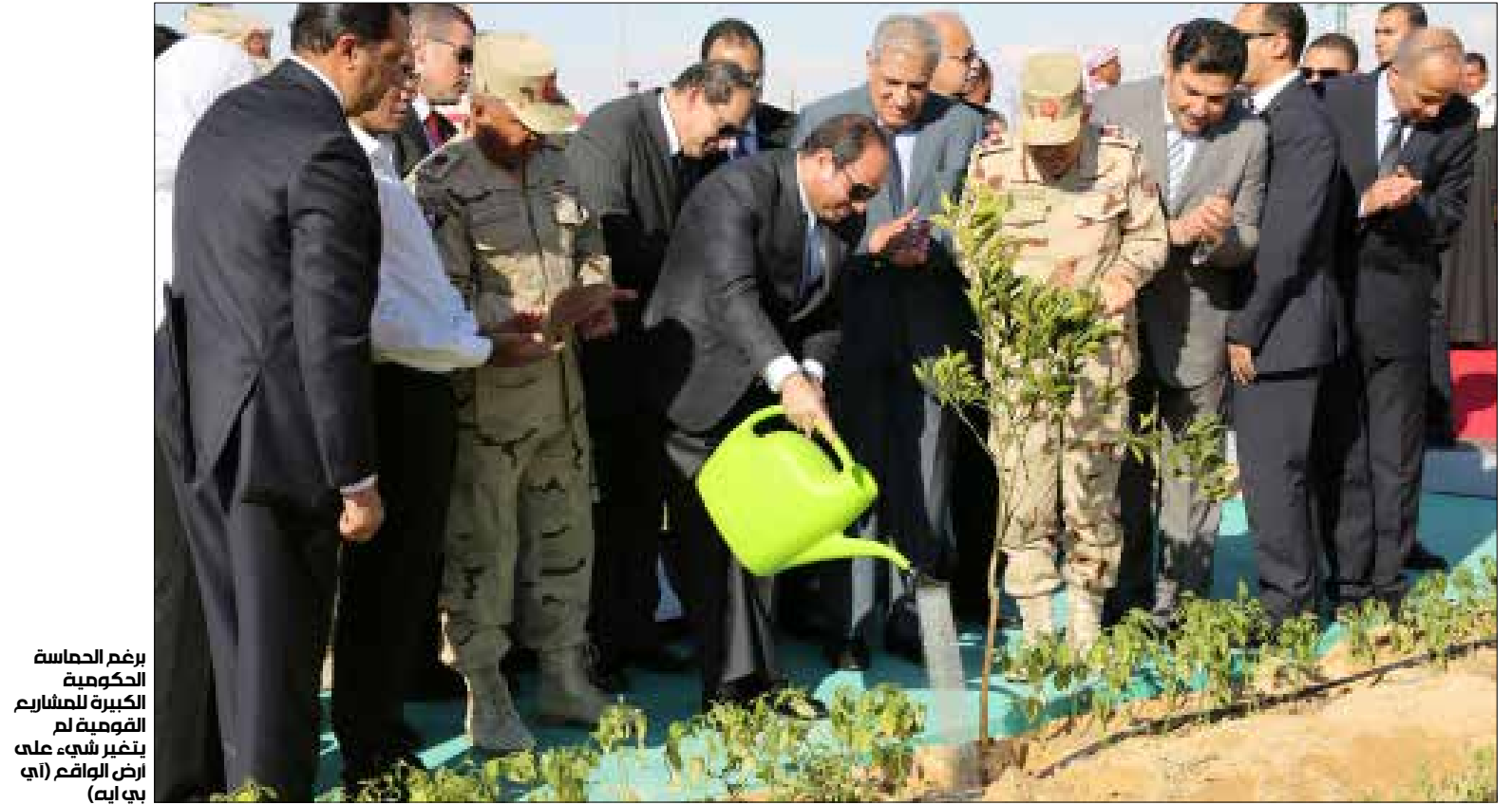
برغم الحماسة الحكومية الكبيرة للمشاركة في تغيير شيء على أرض الواقع (أي به آية)

وحتى نهاية العام، قدرت الخسائر الشهرية بنحو 800 مليون دولار نتيجة توقف رحلات السياحة التي كانت قد بدأت بالانتعاش بعد سنوات من الانكماش، فيما أجرت الحكومة عدة إجراءات لدعم السياحة المحلية لكنها لم تحقق العائد المنتظر منها. وقبل حادثة الطائرة الروسية بشهر واحد تقريبا، قتل 12 سائحا مكسيكياً في هجوم جوي شنته على سياراتهم القوات المصرية عن طريق الخطأ.