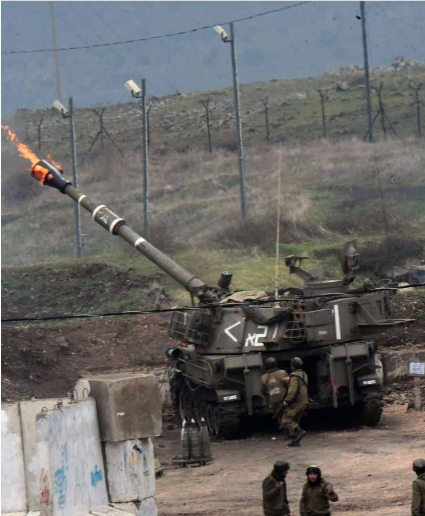
ليس من الحكمة التعامل مع عملية شبعا على أنها «نهاية الرد»

بعد عملية هزاعم شبعا أمس، تحوّل السؤال الإسرائيلي المركزي هن «هل يردّ حزب الله على اغتيال سمير القنطار» إلى «هل يكتفي حزب الله بهذه العملية؟». الأكيد أنّ حكومة العدو أيقنت مجدداً أنّ المقاومة لن تلتزم سقوفه التي يحاول تثبيتها بالتهديد