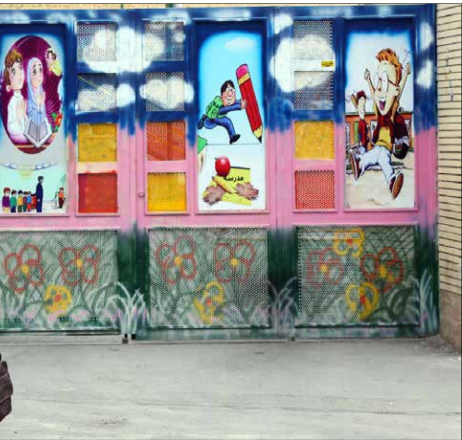
في أحد شوارع طهران قبل أيام

في التجربة التاريخية للدول التي حققت تصنيعها المتأخر بعد الحرب العالمية الثانية، استخدمت الدولة كحوافز للمستثمرين، أسعار الفائدة وأسعار صرف العملة والحماية الجمركية ومنع «المنافسة الزائدة عن الحد» من خلال ضبط أعداد المستثمرين في القطاعات الجديدة، واعتماد