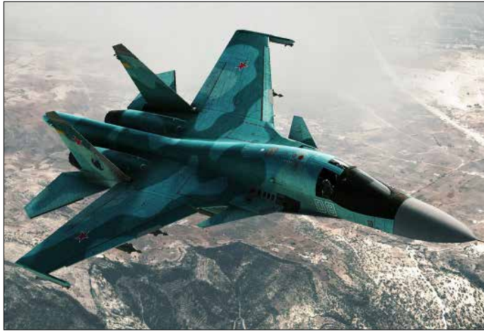
موسكو: الرادارات التركية بإمكانها فقط تحديد ارتفاع الطائرة وسرعانها

بـ«تصرف غير مسؤول» من قبل القوات الروسية، ومعتبرة أن «هذا الانتهاك دليل جديد وملوم على سعي روسيا إلى تصعيد التوتر، رغم التحذيرات الواضحة من دولتنا وحلف الأطلسي».