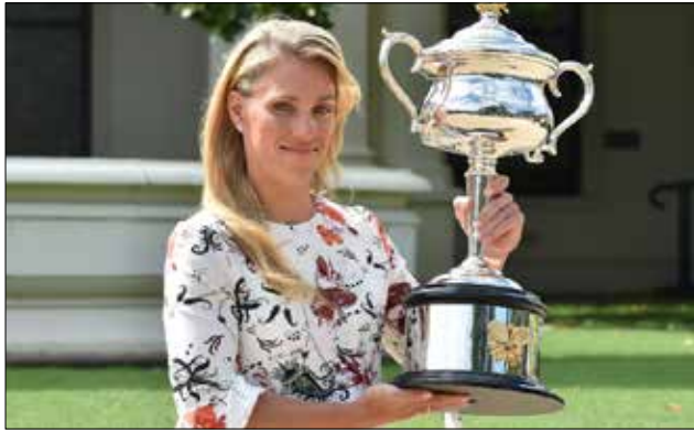
كيربر مع كأس البطولة

«الغراند سلام». وكانت كيربر تخوض المباراة النهائية لإحدى البطولات الأربع الكبرى للمرة الأولى في مسيرتها، بعدما كانت أفضل نتائجها دور الأربعة لبطولتي «فلاشينغ ميدوز» عام 2011 وويمبلدون عام 2012. وأصبحت كيربر أول ألمانية تحرز لقب بطولة كبرى منذ غراف في