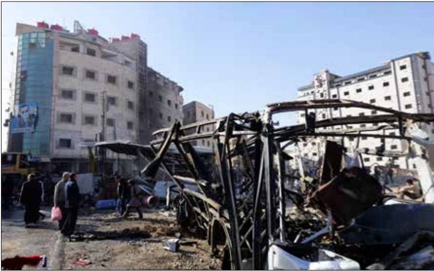
أكثر من 50 شهيدا، بعد 3 تفجيرات تبناها «داعش» في منطقة السيدة زينب، أمس