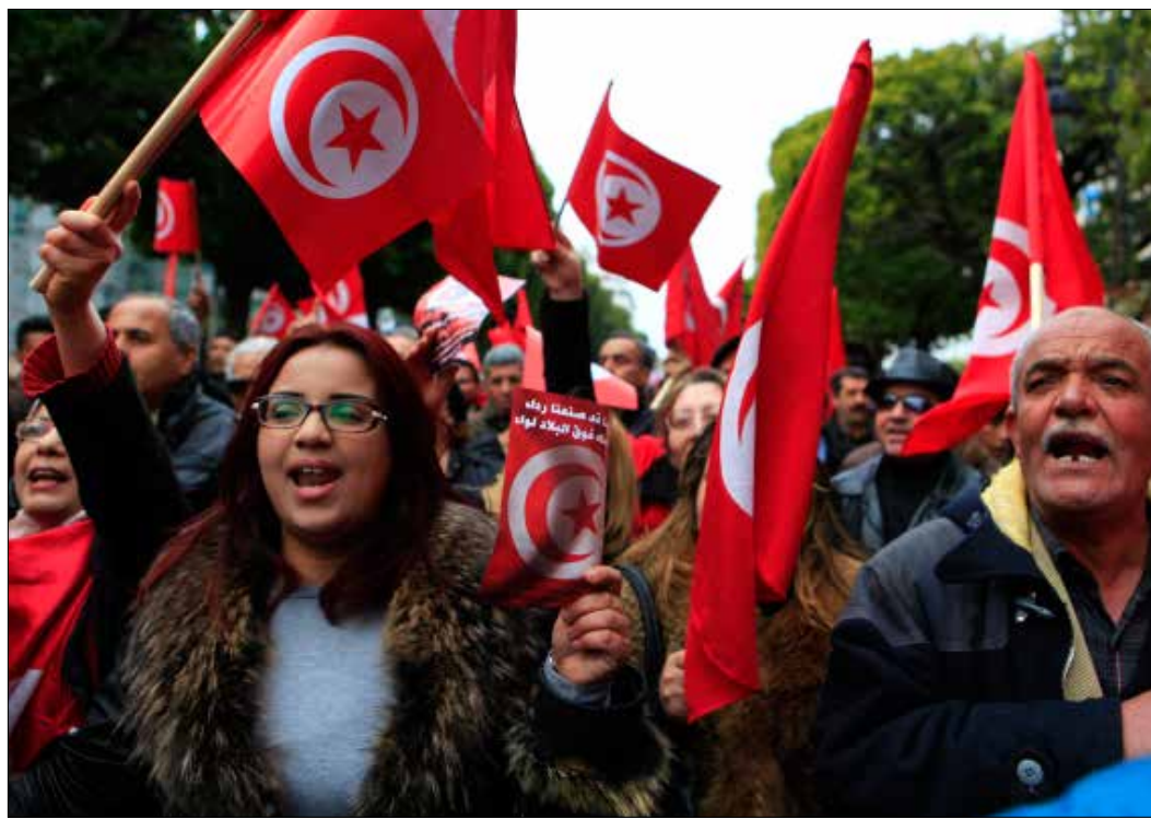
التراجع في مؤشر مدركات الفساد كارثي ولم يسبق له مثيل بعد الثورة (الأخبار)

واستعرض المسؤولون في منظمة «أنا يفظ» جملة من الحلول لمقاومة الفساد، منها توافر الإرادة السياسية الجادة لمكافحة هذه الظاهرة، من خلال انتهاج الشفافية وإشراك المجتمع المدني، وخلق الإطار التشريعي للهيئة الدستورية لمكافحة الفساد والحكومة الرشيدة. ودعوا إلى سحب مشروع قانون المصالحة الاقتصادية والمالية، «المؤسس لثقافة الإفلات من العقاب»، وإلى حماية نشطاء مكافحة الفساد، والعمل على صياغة استراتيجية وطنية لمحاربة الفساد، تشارك فيها جميع الأطراف الوطنية الفاعلة في المجال، من دون تدخل خارجي، والالتزام بتطبيقها. ويذكر، في السياق، أن الدستور التونسي الجديد الذي دخل حيز التنفيذ في 2014، أقر بوجود هيئة مستقلة لمكافحة الفساد، غير أنها ظلت مهمشة، ولم تحظ باهتمام صناع القرار في الحكومات المتعاقبة.