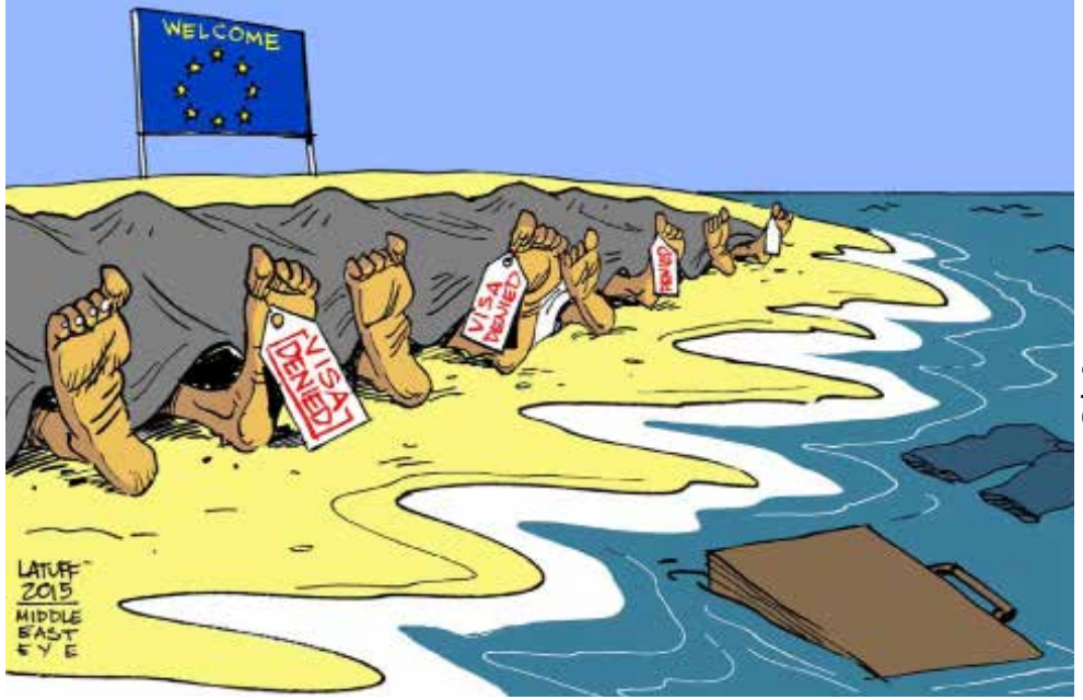
(كارلوس لوف - البرازيل)