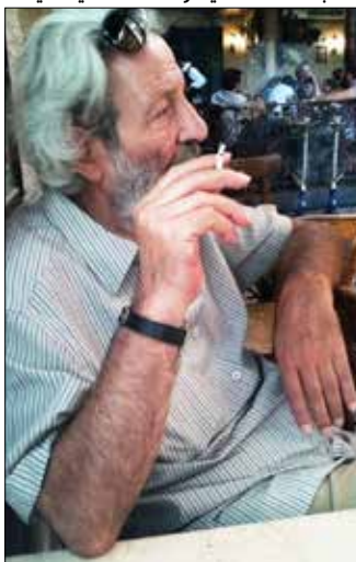
برون في «وحشة الأبيض والأسود» مكابذاته الشخصية وأحلامه السينمائية

روايته الأولى «إعلانات عن مدينة تعيش قبل الحرب» التي بدأ كتابتها في موسكو وأتممها في دمشق مدموغة بخاتم «عدم الموافقة». لم تكن تبريرات حنا مينه مقنعة في رفض المخطوط الذي قال بأنه لم يتمكن من إكمال قراءته. ورغم أن سعيد حورانية وصف الرواية بأنها «سيمفونية شوبرت الناقصة»، إلا أن «اتحاد الكتاب العرب» رفض نشرها أيضاً. لتري النور لاحقاً في «دار ابن رشد» في بيروت. حصيلة اللقاءات اليومية مع عمر أميرلاي انتهت إلى التفكير بمشروع مشترك اقترحه الأخير بصيرته المشعة عن «القرامطة»، فانخرط بحماس في كتابة التصورات الأولية للفكرة، ثم انضم إليهما صنع الله إبراهيم. يقول محمد مخلص في هامش كتابه لاحقاً «اليوم بعيداً عن مطبخ ومختبرات الكتابة المشتركة التي جمعتنا نحن الثلاثة، أريد أن أقول إن سيناريو «القرامطة» يتناول تاريخياً تجربة القرامطة في بناء دولة حرة، وأن الخلفاء الذين حكموا الدولة الإسلامية في العصر العباسي لجأوا إلى كل أشكال العسف والعنف لإسقاط هذه التجربة». بالطبع لم يتجزأ الفيلم على غرار مشاريع موعودة أخرى، كان مفكرة هذا المخرج مرتبهة للخيبات المتلاحقة، في معارك لا تهدأ «أشعر أنني في قصص يلتفت من حولي. وأني أحمل قصصي وأتجول في الشوارع،