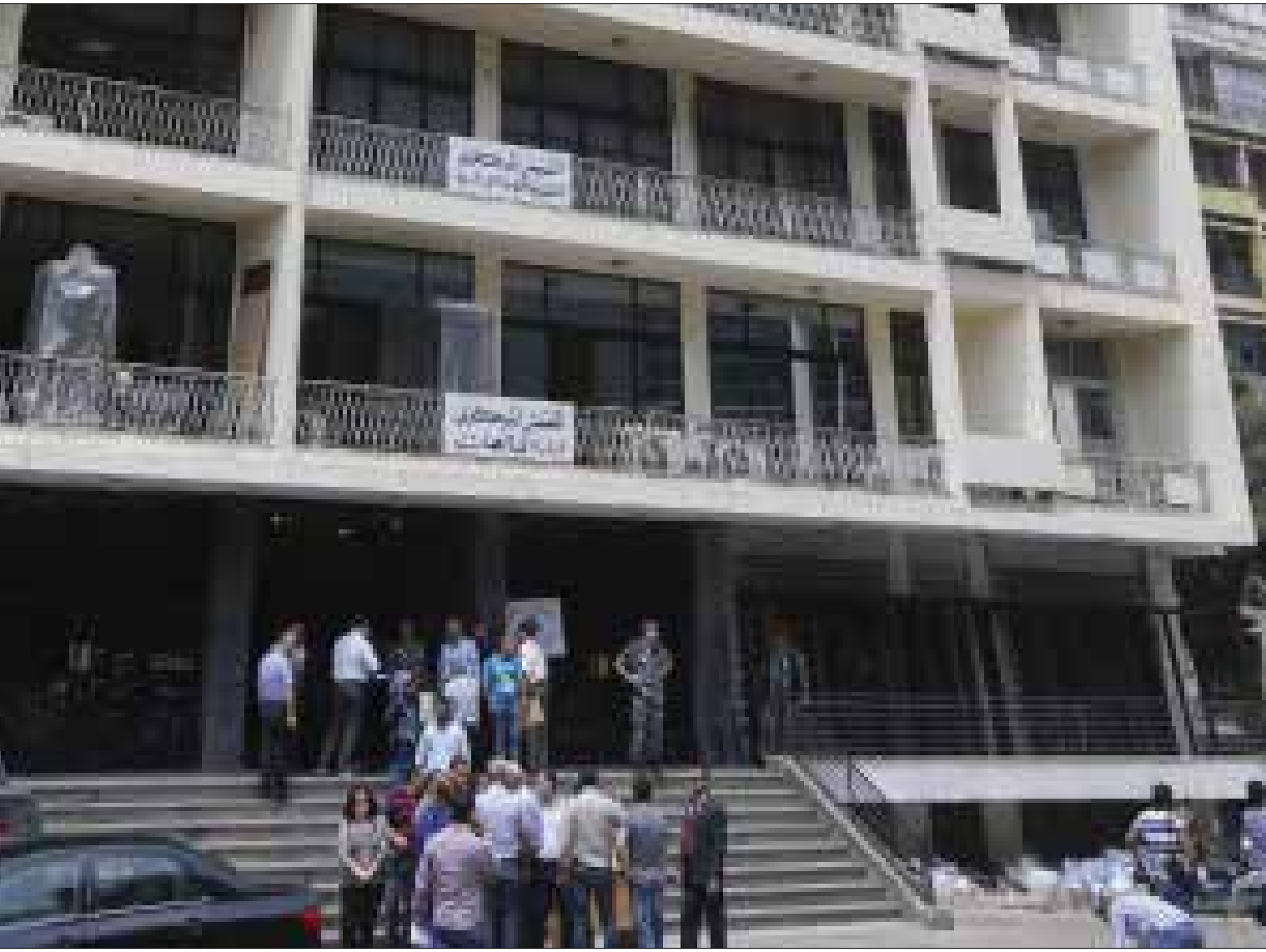
وزير الاتصالات طلب وقف الشكاوى ضد يوسف في مخالفة صريحة للقوانين (هيلم الموسوي)