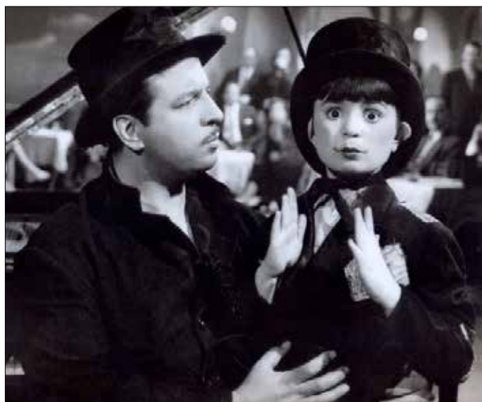
فيروز وانهور وجدي في فيلم «دهب» (1953)