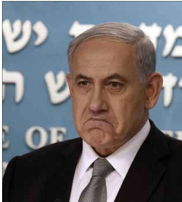
برر نتنياهو رفضه للمبادرة الفرنسية بالقول إنها «تحفز الفلسطينيين على عدم تسوية في المفاوضات»، (الأخبار)

مع ذلك، برر رئيس حكومة العدو بنيامين نتنياهو رفضه للمبادرة الفرنسية، التي أتت على لسان وزير الخارجية لوران فابيوس، بالقول إنها «تحفز الفلسطينيين على عدم قبول أي تسوية في المفاوضات تؤدي للتوصل إلى حل نهائي». ويعكس هذا الموقف مخاوف نتنياهو من أن مثل هذه المبادرات قد تفتح الأفاق أمام السلطة الفلسطينية وتعزز موقفها الرفض للسقف الذي تملبه إسرائيل لأي تسوية مقترضة.