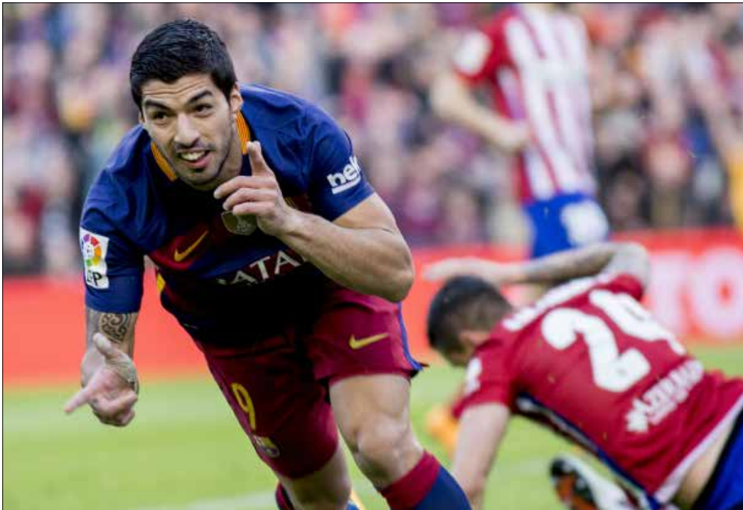
لويس سواريز محتضراً بتسجيله ثاني هدفي برشلونة في مرعى أتليتيكو مدريد

فريق إنريكي هو نسخة متطورة على هذا الصعيد عن الفريق الذي تركه جوسيب غوارديولا، إذ إن المدرب الحالي عرف بلا شك ما يدور في فكر خصومه، الذين ظنوا أنه بالضغط العالي لمنع «البرسا» من الاستحواذ على الكرة سيعطلونه تماماً، لكن الكاتالونيين يتفنون بالخروج من هذا الضغط بتمريراتهم السريعة وتحرك لاعبيهم خارج مراكزهم في أحيان كثيرة، فيكون التمرير سهل وأفضل في الربع الأخير من الملعب، وهذا ما أكده أفضل فريق يلعب الكرة حالياً، بتحرك وتميرة جوردي ألبا إلى ميسي في حالة الهدف الأول، وبالكرة الطويلة للبرازيلي داني الفيش وبتحرك سواريز في الهدف الثاني.