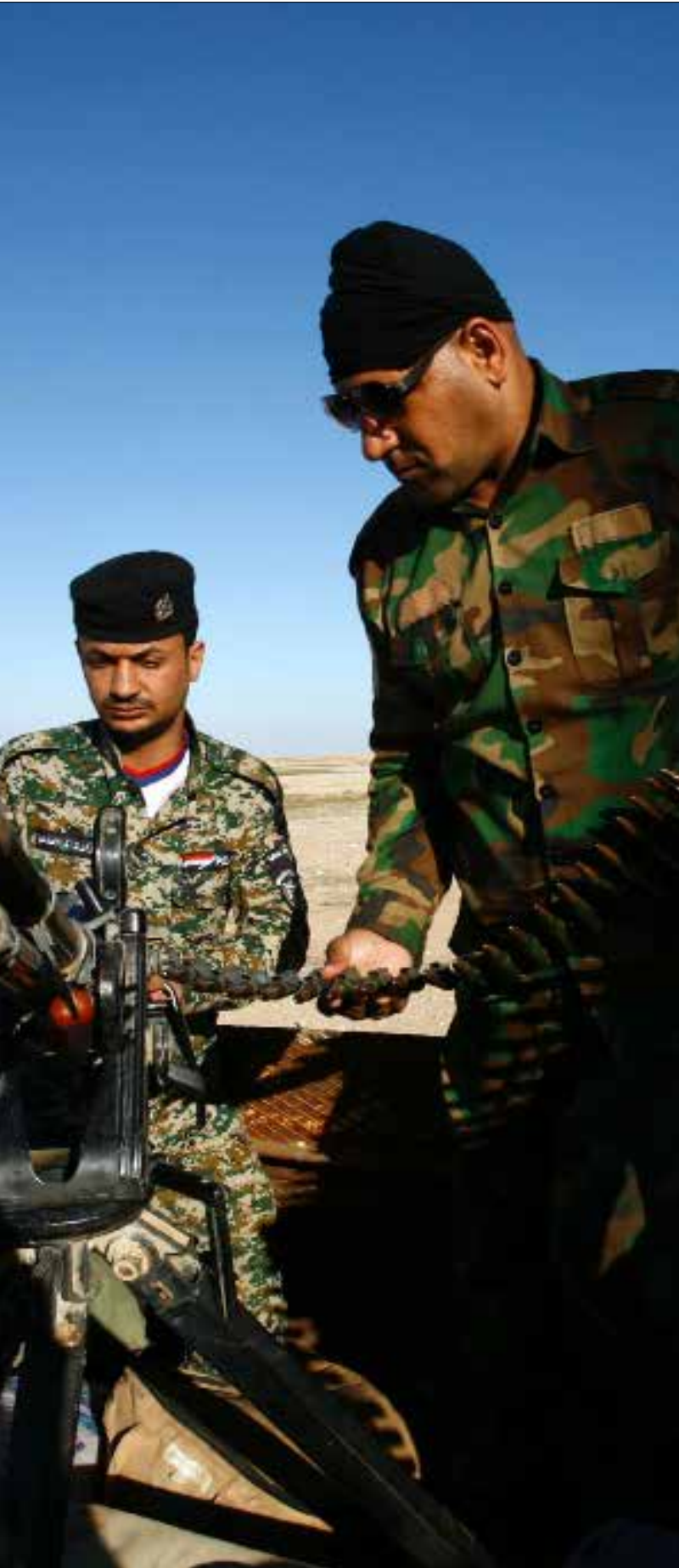
بيدو الحديث عن ممارسات «داعش»، تزخيماً منعمداً (الناضول)

تلت سيطرة «داعش» على الفلوجة في أوائل عام 2014 لم تعال من المدينة إلا أصوات الوجوه القبلية والعشائرية الحاضرة على مباحة التنظيم والركون إليه بدلاً من الدولة. أشهر هذه الوقائع سجلت في شهري أيار وحزيران من عام 2015. في 5 أيار 2015 انضم عدد من شيوخ الفلوجة إلى مشايخ آخرين في ما سمي «المؤتمر الأول لعشائر الأنبار». حينها، أصدر هؤلاء بياناً أعربوا فيه عن اعتقادهم «بان الدولة الإسلامية ما جاءت إلا لإظهار الحق ورفع الظلم والحيث والقهر عن أبناء الأنبار خاصة وعن أهل السنة عامة، مرتضين بمن يمثلنا على الأرض من أبنائنا وإخواننا رجال الدولة الإسلامية طوعاً لا كرهاً». بعد أسابيع قليلة فقط، انعقد «المؤتمر الثاني لعشائر الأنبار» بمشاركة مشايخ من الفلوجة، في ذلك المؤتمر الذي حمل اسم «في سفينة واحدة» اصطف المشايخ خلف المتحدث باسمهم الذي أعلن «من مدينة الرمادي قاهرة الصليبيين والرافضة مباركة الشيوخ والوجهاء وأبناء العشائر لأهالي عاصمة الأنبار النصر العزيز والمبين على أرجاس الردة وأدران الشرك». وأضاف تالي البيان «أن مصيرنا واحد وموقفنا واحد وسيفنا مع جنود الدولة الإسلامية موجه صوب عدو واحد. فنحن ركاب سفينة واحدة، إما أن ننجو جميعاً وإما أن نهلك. لذا لن نسمح لأحد بخرق سفينتنا أياً كان اسمه ونسبه وانتماؤه».