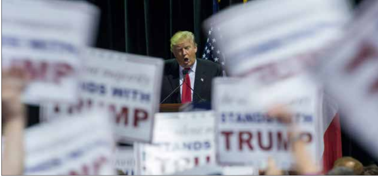
بتكفله الوقت بترسيخ فكرة أنه لا يمكن لأي جمهوري أن يوقف ترامب

قبل أيام فاز دونالد ترامب في الانتخابات التمهيدية في ولاية كارولينا الجنوبية، وازداد الإعلام الأمريكي والسياسيين والمهتمين بالثبات الانتخابي أمام واقم لا يمكن التغاضي عنه. الأمر الذي دفعهم إلى دفع ناقوس الخطر خوفاً من حصوله على ترشيح الحزب الجمهوري للانتخابات