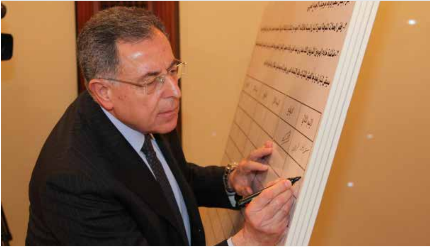
السيورة يوقّع على عريضة «احتضان» الملك السعودي في منزل الحريري أمس

حفلة استجداء النظام السعودي مستمرة. الذروة أمس كانت في منزل الرئيس سعد الحريري، الذي جمع سياسيين وأصحاب ثروات، ليطلبوا اللبنانيين بالتوقيع على عريضة تناشد الملك السعودي "احتضان" لبنان. بعض الموقعين في منزل الحريري أمس خفض رأسه كثيراً ليصل إلى حيث يريد كتابة اسمه