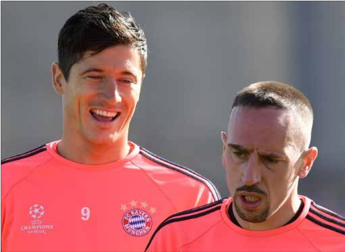
ريبري وليفاندوفسكي في حصة تدريبية استعداداً لمواجهة يوفنتوس

مباراتان من العيار الثقيل تنتظران متابعي دوري أبطال أوروبا لكرة الليلة. الساعة 21,45 بتوقيت بيروت، بين أرسنال وبرشلونة من جهة، ويوفنتوس وبايرن ميونيخ من جهة ثانية، في ذهاب دور الـ 16. مواجهتان يُنتظر أن تكونا على قدر عالٍ من التشويق والحماسة