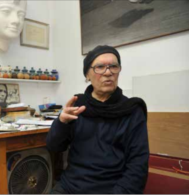
التشكيلي الراحل