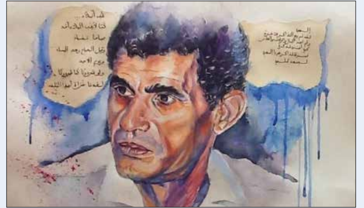
بورثيه الشاعر بريشة الفنانة أمينة بالطيب

أدرك أولاد أحمد بفطنته العجيبة أن الشعر أساساً هو ضد السلطة بما تمثله من استبداد وتفرد بالرأي، وهو أيضاً نافذة على الأحلام والأغاني. لذلك، بدأ مسيرته الشعرية بقصيدة كانت سبباً في شهرة وعذابات أيضاً هي «نشيد الأيام الستة» التي دُون فيها ما يعرف في تونس بـ «ثورة الخبز» عام 1984. صودر كتابه الأول، ولم يصدر إلا بعد رحيل الزعيم الحبيب بورقيبة عن الحكم. ورغم أن النظام الجديد لين علي رفع عنه الحظر، إلا أنه استقبله بقصيدة مطلعها «أقبل الجيش علينا ببيان مدني» لتبدأ علاقته الحذرة مع النظام السابق الذي عينه مديراً لـ «بيت الشعر» (من 1993 حتى 1997) ثم عزله بعدما أعلن انحيازَه للمعارضة ضد بن علي.