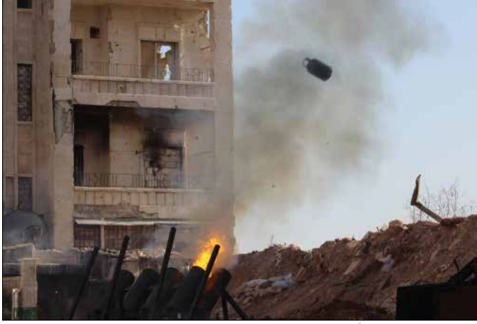
الهدنة فرملت تقدماً غير مسبوقة للجيش والحلفاء في «عاصمة الشمال»

على الصعيد ذاته، أكد قيادي «جهادي» أن «المعارك في الريف الجنوبي لن يوقفها شيء». المصدر المنتمي إلى «جبهة النصرة» قال لـ «الأخبار» إن «الإخوة في بعض الفصائل وضعوا في صورة محاولات إغرائهم بالتخلي عن معركتهم المقدسة، لكننا لا نتوقع منهم الرضوخ». في الوقت نفسه، أكد المصدر أنه «حتى ولو ارتكب بعض الإخوة هذا الخطأ القاتل واستجابوا لما يُمارس عليهم من ضغوط، فإبنا لن نتوقف، وسيخسر الإخوة دينهم وديناهم».