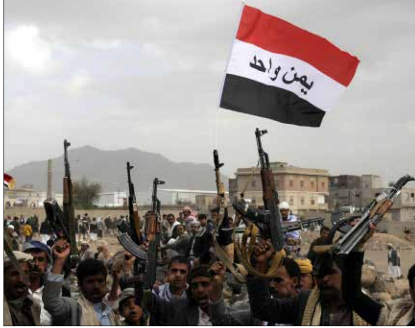
الخطوة الأولى وقف الأعمال العسكرية في محافظات تعز ومارب والجوف