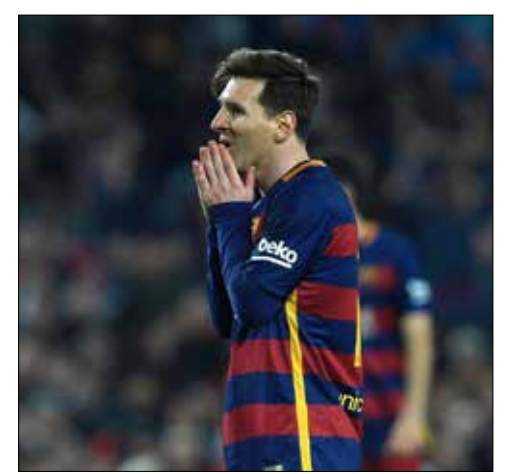
أكد ميسي أن شركة عائلته في بنما لم تستخدم قط في التهرب الضريبي (أ، ب)

بدو أن معاناة النجم الأرجنتيني ليونيل ميسي، لاعب برشلونة الإسباني، مع التهرب الضريبي لا نهاية لها، حيث يقف الآن أمام أزمة جديدة في هذا الإطار، هي «وثائق بنما» التي كشفت عمليات مالية لأكثر من 214 ألف شركة في أكثر من 200 دولة ومنطقة حول العالم، وأوردت بين المشاهير والرياضيين اسمي ميسي والفرنسي ميشال بلاتيني، رئيس الاتحاد الأوروبي لكرة القدم الموقوف 6 سنوات، إضافة إلى الاتحاد الدولي للعبة. وأكد «البرغوث» الأرجنتيني أن الشركة العائدة لعائلته في بنما لم تستخدم قط في التهرب الضريبي. وأوضح ميسي في بيان صادر عنه