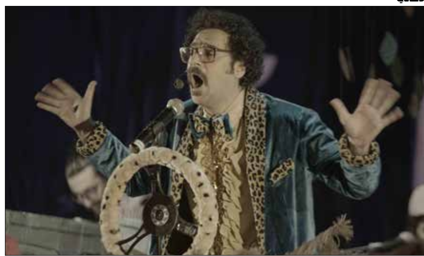
يضم العرض ريبيرتوارا جديداً من الأغاني