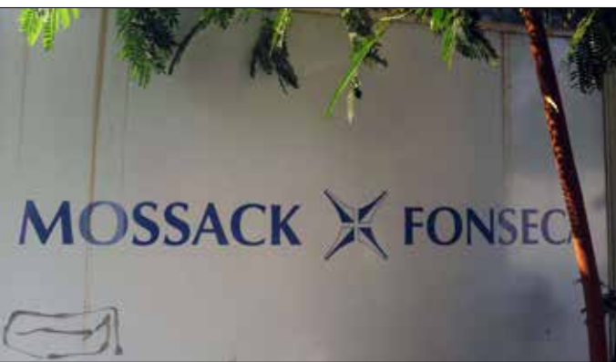
لم تذكر التحقيقات الشركات الغربية الكبرى ولا أرباب طبقة الـ 1%

الدولي للصحافيين الاستقصائيين، الذي يموله أمثال: فورد فوندايشن، وكارنيغي، وروكافيلر فاميلي فند، وغيرها... لا تتوقعوا كشفاً حقيقياً عن رأس المال الغربي، إذ إن الأسرار القذرة للشركات الغربية ستبقى مُخفاة. ومن الجدير بالذكر أن صحيفة «ذا غارديان» أكدت أن الكثير من التسريبات ستبقى سرية ولن تنشر.