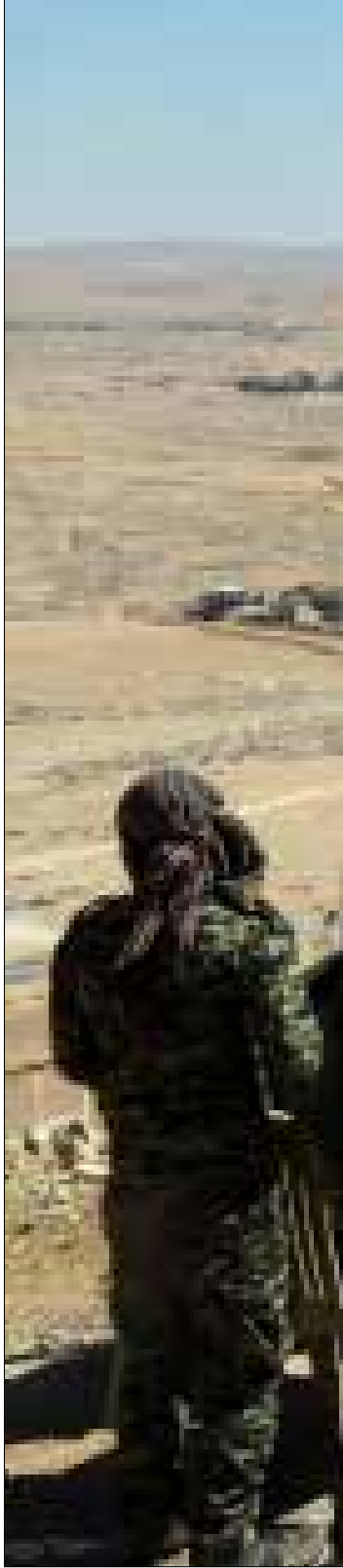
ترتفع اعمدة الدخان بشكل متواصل نتيجة تفجير العبوات الناسفة