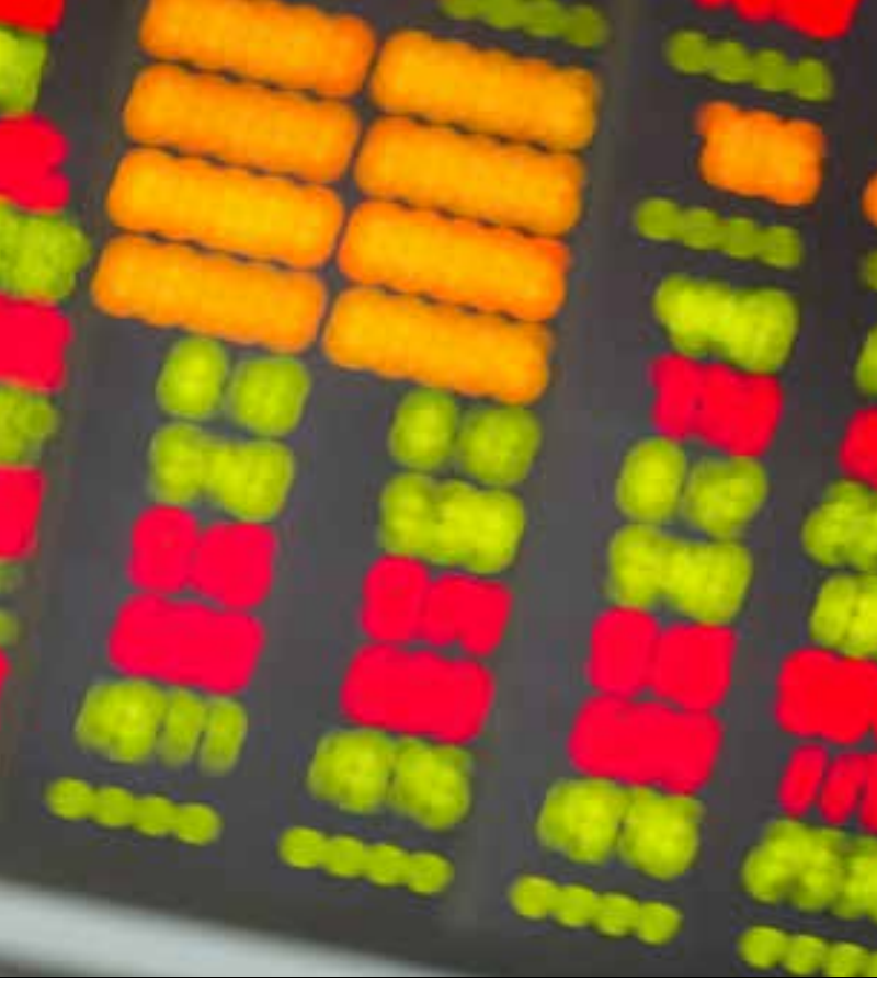
القطاع السياحي يحتاج نحو 13 شهراً لاستعادة عافيته بعد أي عمل إرهابي

الأولى تكون مؤلمة، أما الثانية فيصبح تحملها أسهل مهما كانت قوتها. يقال إن العادة أقوى من كل شيء، وهذا،