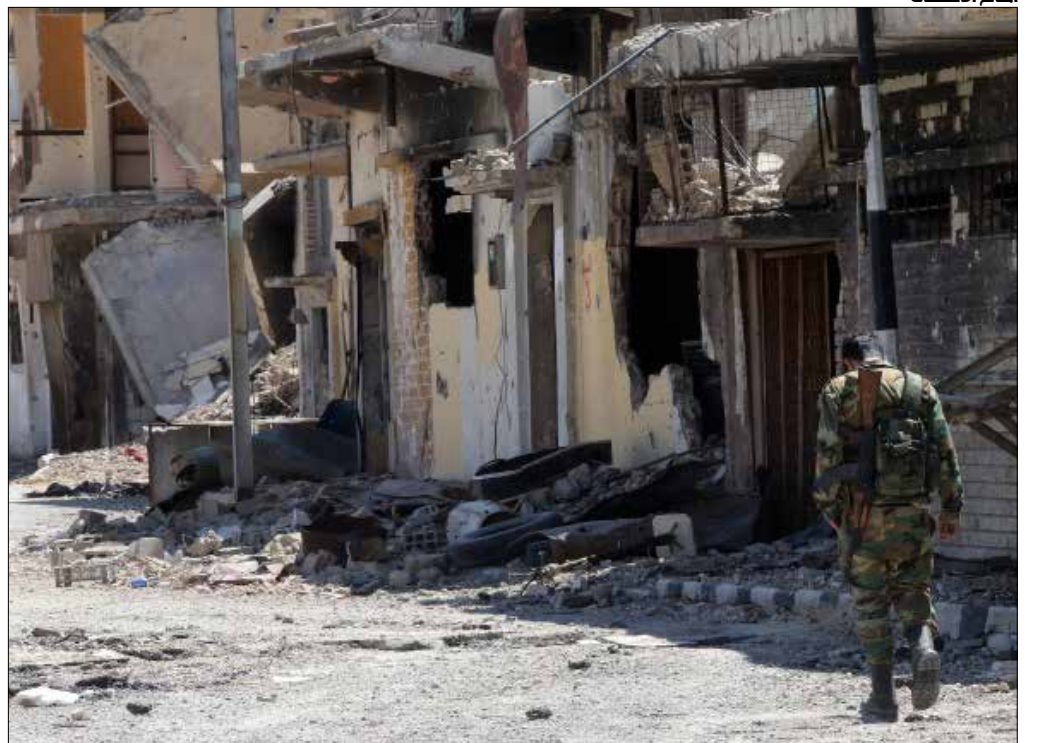
استخدمت ساحات المدينة لعرض أفلام عن التنظيم لإحباط الأطفال