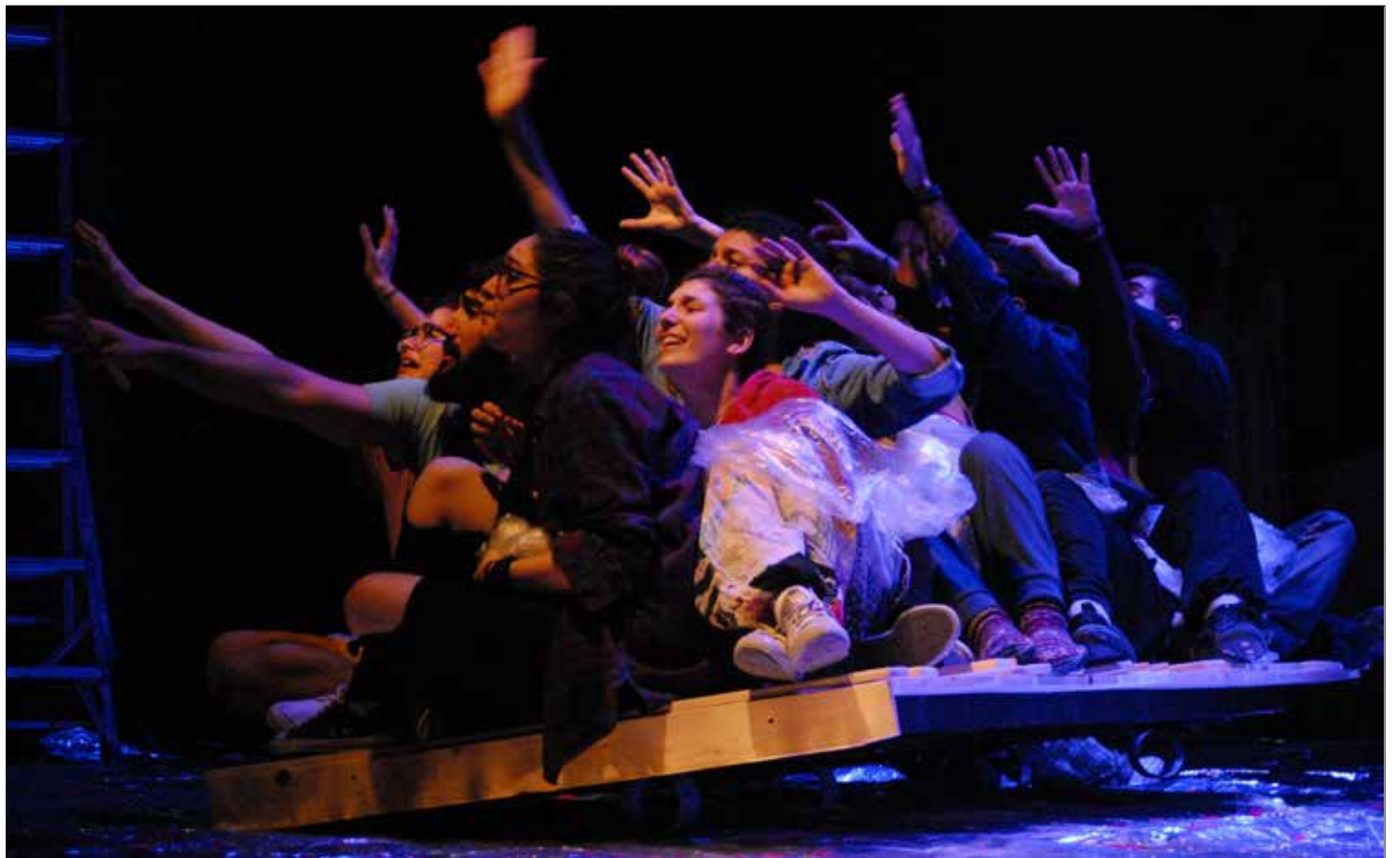
مشهد من «نوم الغزلان»

«نوم الغزلان» لينا أبيض: 20:30 مساءً، حتى 10 نيسان (أبريل) الحالي - مسرح إروين» في حرم الجامعة اللبنانية الأميركية» (قريطم - بيروت). للاستعلام: 01786464