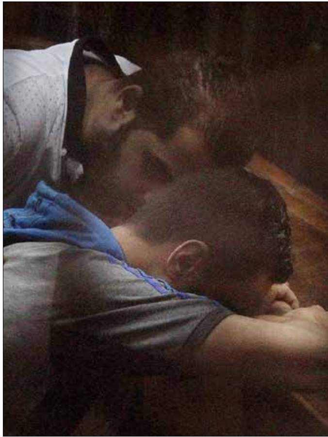
تصرفات «الإخوان» تؤجل الجلسة دون النظر في أوراق المتهمين كلهم

النظر في قضية فض اعتصام رابعة. وقضية رابعة من أكثر القضايا التي يوجد على ذمتها متهمون، كما أنها أشهر القضايا السياسية التي يحاكم فيها أعضاء وقيادات «جماعة الإخوان المسلمون» منذ عزل الرئيس الأسبق محمد مرسي. وتضم القضية 739 متهما، بينهم قيادات الجماعة، مثل المرشد العام محمد بديع، وعضو مكتب الإرشاد عبد الرحمن البر، ونائب رئيس حزب «الوسط» عصام سلطان، ونجل مرسي، وأعضاء من الجماعة كانوا يشاركون في الاعتصام، فضلاً عن بعض الصحفيين مثل المصور محمود شوكان، إضافة إلى أشخاص لا علاقة لهم بالتنظيم وقبض عليهم عشوائياً يوم فض الاعتصام.