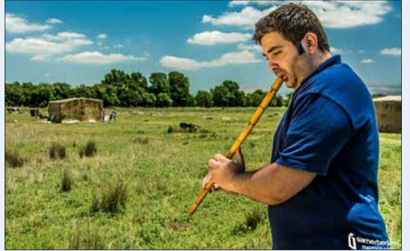
الموسيقي والمند مهدي كلاس

«أربعاً بنص الجمعة»: بدءاً من الليلة (20:00) - مسرح «رسالات» (المركز الثقافي لبلدية الغبيري). للاستعلام: 71/014452