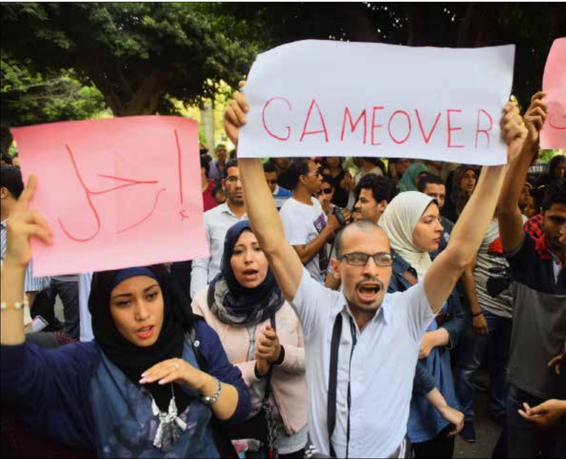
يدرك النظام أهمية «نقابة الصحفيين» التي لم يجرة نظام مبارك على حصارها

اليوم الثاني على التوالي تستمر في مصر تظاهرات الرضخ لترسيم الحدود البحرية مع السعودية. في ظل تودّد رسمي متزايد من الخليج عبّرت عنه القاهرة بتجديدها «مساندة البحرين في مواجهة التدخل الإيراني»