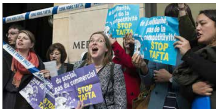
الحكومة تريد «إرضاء» الأطراف الداخلية المناهضة للاتفاق

يبدو أن الحكومة الفرنسية الاشتراكية، التي تراجعت شعبيتها، تحاول بمعارضتها للاتفاق، أن تظهر بمظهر «المدافع عن أوروبا» وأن «توفّق مع اليسار»، وفق تقرير لصحيفة «ليبيراسيون» الفرنسية، خصوصاً أن هذه «المعركة» جديدة على هولاند. وهكذا يصير «جدل» مناهضة «الشراكة العابرة للأطلسي» من الأوراق الراححة التي قد يرى «الاشتراكي» أنها سترفع شعبيته من جديد.