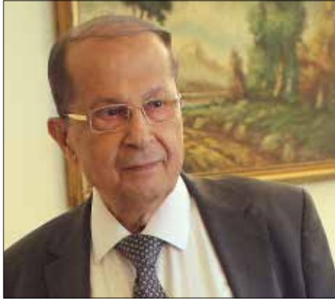
اتهم عون بري بتدبير ترشيح الحريري لفرنجية من دون دليل (هيثم الموسوي)

كيف ينتهي الجفاء؟ «اللي طلع الحمار على المدينة، ينزله. ليعتذر عون عن طعنه في شرعية المجلس». العونيون لا يزالون يكزرون بأن المجلس غير شرعي، وبري يستفز. وإذا لم ينته الجفاء، بري لا يريد أن يقاتل أحداً. وهو في موقفه أول من أمس (عدم الدعوة لعقد جلسة تشريعية) كان يراعي عون وحده. القوات اللبنانية في الأصل تقاطع، والكتائب خمسة نواب. بري يريد أن يعود عون إلى المجلس ليكون المجلس ميثاقياً، ويشعر المسيحيون بالشاركة الحقيقية.