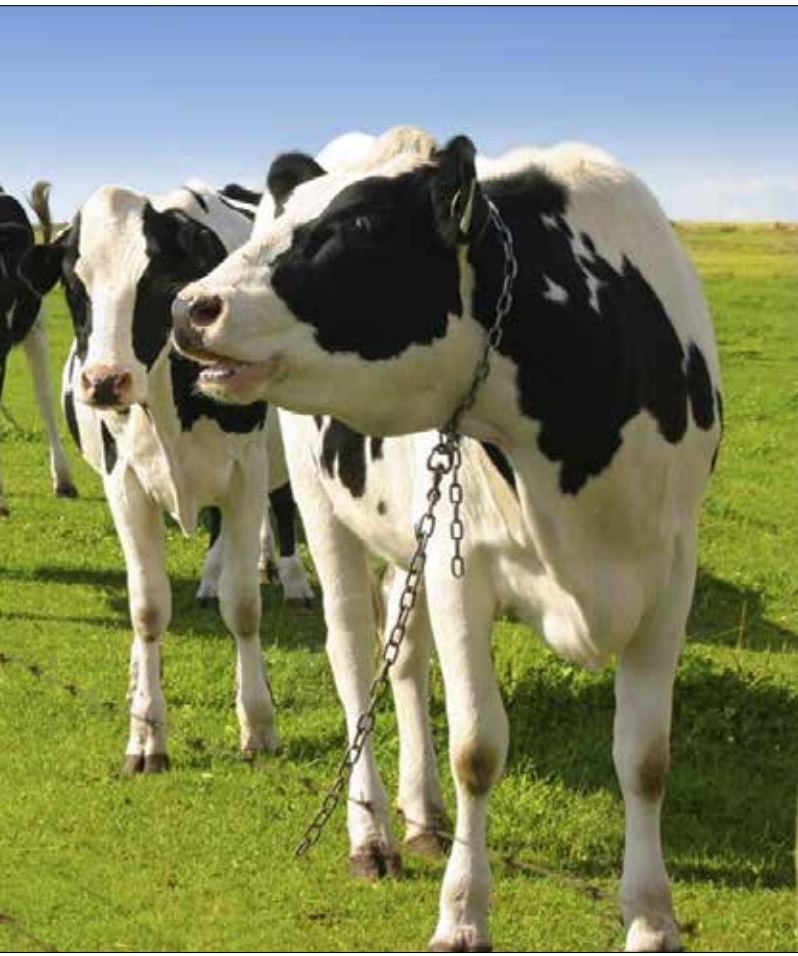
يشكل الحليب الطازج 22% من نسبة الاستهلاك، وحليب البودرة 78%

أطلق بنك مصر ولبنان قرض البقرة المنتجة بهدف تمكين المزارعين في المناطق الريفية، من خلال دعمهم وتشجيعهم على تأمين مداخيل