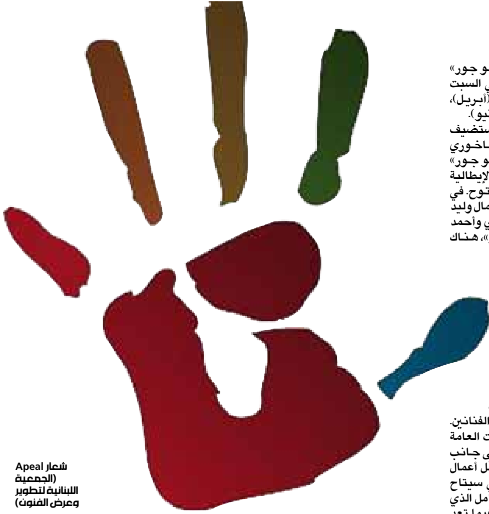
شعار Apeal (الجمعية اللبنانية لتطوير وعرض الفنون)