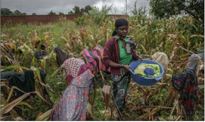
تعمل الشبكة على استغلال فقر النساء وإقناعهن بالسفر إلى الكويت للعمل