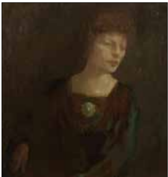
«بورترية لكاربي اود، لخليل صليبي (زيت على كنفاس - 47 x 40 سنتم - 1916)»

موقعاً فريداً في المشهد الثقافي في الشرق الأوسط؛ من أيام الفينيقيين حتى اليوم. لا يمكن التغاضي عن اختلاف لبنان عن محيطه لجهة القيمة الاجتماعية والتاريخية، مضيفاً: «عدد المغتربين اللبنانيين يفوق الـ 15 مليوناً، وبينهم أسماء لامعة في ميادين فنية». وفيما يثني ساغارشي على «التنوع الذي يطبع المجتمع اللبناني»، يشير إلى أنه «رغم أن هذا التنوع أدى إلى نتائج سلبية كثيرة، أبرزها الحرب الأهلية المريرة، عادت الحياة الثقافية والفنية للازدهار». وكما يحصل عادةً في المواعيد الفنية المشابهة، يتوقع المراقبون أن تحظى الأعمال اللبنانية بحفاوة كبيرة وأن تحقق أرقاماً عالية.