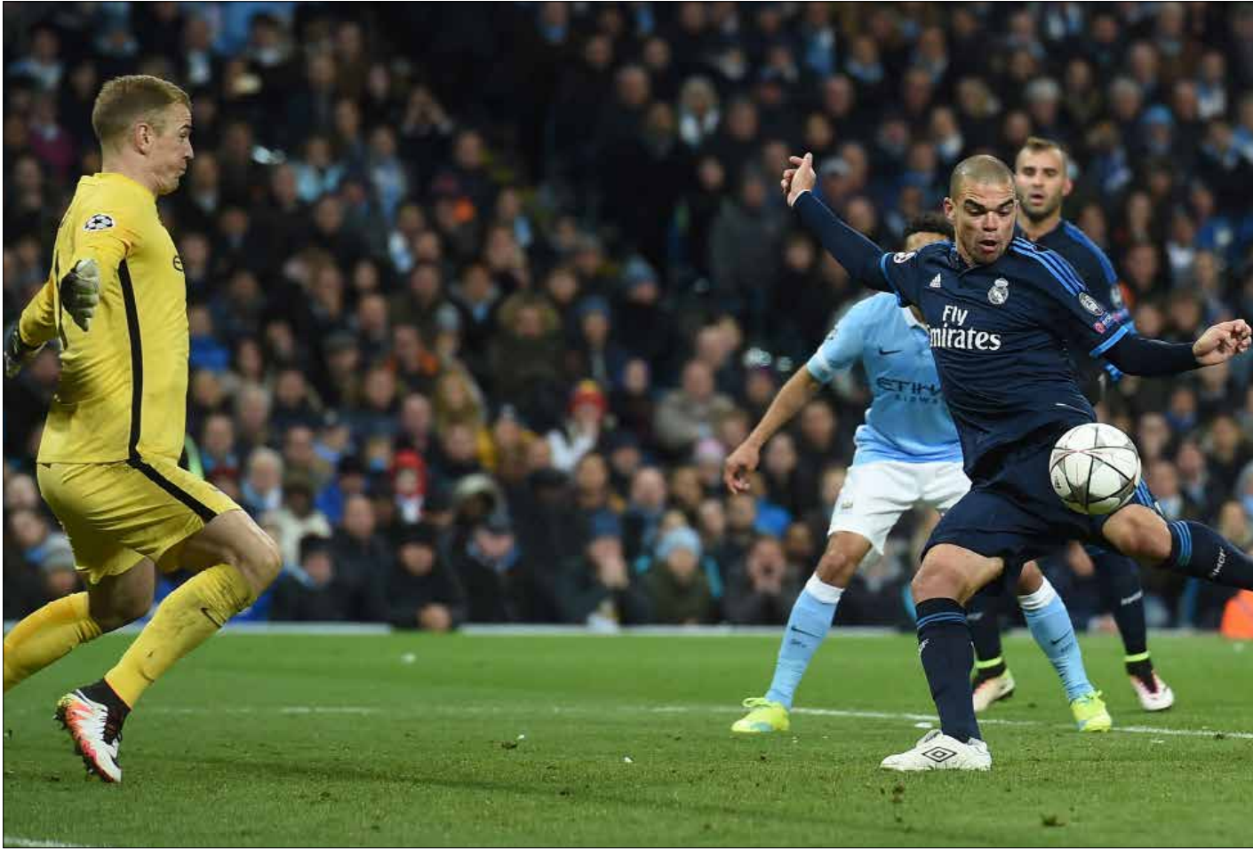
كانت فرصة بيبي الخطر في المباراة

تعادل مانشستر سيتي مع ضيفه ريال مدريد 0-0 في المباراة المملة التي جمعت بينهما في ذهاب الدور نصف النهائي لدوري أبطال أوروبا لكرة القدم. سيطرة في الشوط الأول لسيتي. وفي الثاني لريال. لم تجعل أيًا منهما يرقص إلى ما كان ينتظره متابعو البطولة ليلة أمس