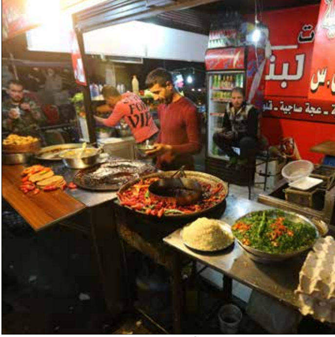
مخالفات زيت الزيتون هي الأكثر رواجاً