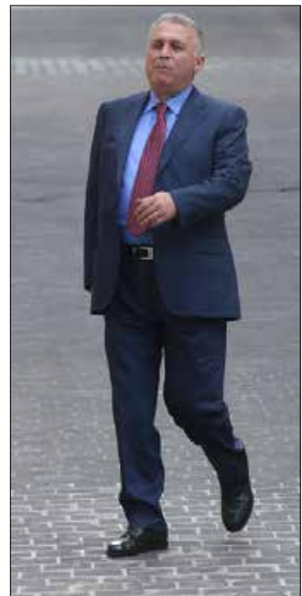
رفض اهليق برجاوي لـ«الاتفاق الفوضي»