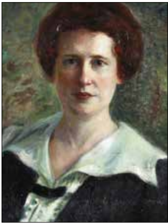
«بورترية للسيدة الكسندر مورتن» لجبران خليل جبران (زيت على كنفاس - 66 x 63 سنتم - 1914)