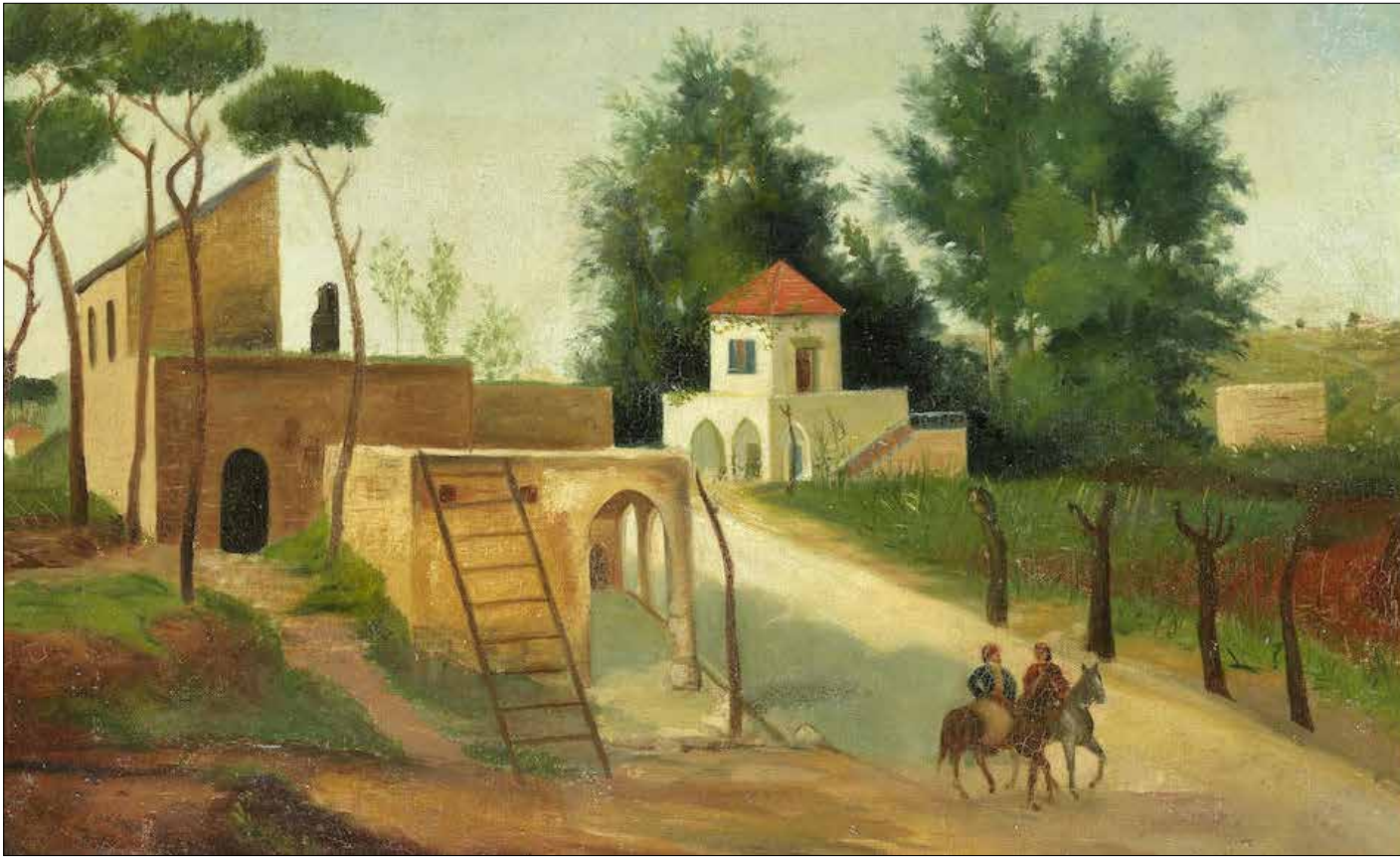
«منظر من الأشرفية، لداوود القرم (زيت على كنفاس - 36 x 55 سنتم - 1881)»

من جبران والأنسي والدويهي... إلى أيمن بعلبكي