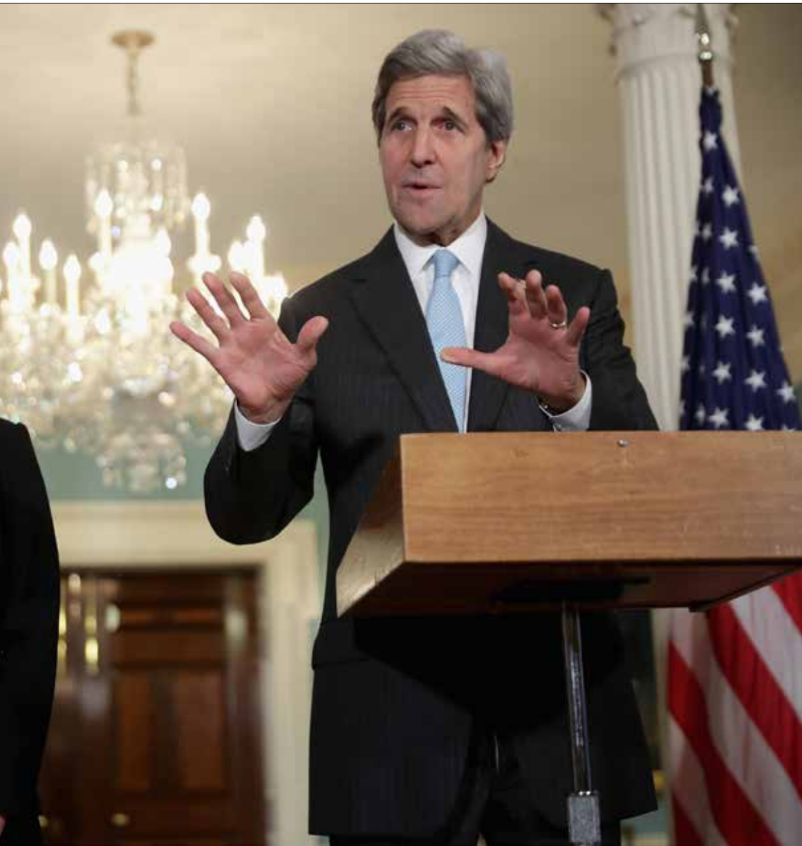
كيري، وواشنطن ستقوم بدورها مع فصائل المعارضة للالتزام بالهدنة

نجحت واشنطن وموسكو في ضمّ مدينة حلب ومحيطها إلى اتفاق هدنة مدته 48 ساعة. اتفاق يبدو أنّ الأطراف المعارضة نجحت في جرّ المدينة إليه بعدما أشعلتها بقذائفها ثم بردّ الجيش عليها... لكن بعد يوهين، كيف سيكون المشهد؟