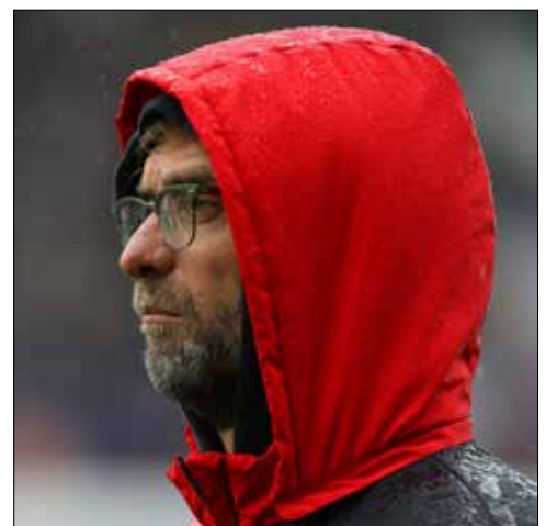
كلوب امام المهمة الصعبة

تقام الليلة الساعة 22:05 بتوقيت بيروت مباريات الإياب في الدور نصف النهائي لمسابقة «يوروبا ليغ» لكرة القدم، حيث يلعب ليفربول الإنكليزي مع ضيفه فياريال الإسباني الفائز 1-0 ذهاباً، بينما يحل شاختر دونيتسك الأوكراني ضيفاً على إشبيلية الإسباني بعد تعادلهما 2-2 في مباراة الذهاب. ويتجه الاهتمام إلى مباراة «أنفيلد رود» الذي يمزّ فريقه ليفربول في فترة انعدام توازن، حيث لم يحقق أي فوز في آخر 3 مباريات في مختلف المسابقات، لكن مدربه الألماني يورغن كلوب يبدو واثقاً من استعادة إيقاعه في الوقت