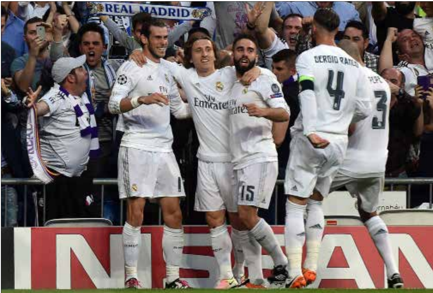
فرحة لاعبي ريال مع جمهورهم بهدف التاهل الوحيد

نجم ريال مدريد في التاهل إلى نهائي دوري أبطال أوروبا بعد فوزه على ضيفه مانشستر سيتي 1-0 في إياب نصف النهائي (0-0 ذهاباً). مدريد تتنسم كلها بعد أن لحق الملكي بجاره اللدود أتليكو إلى ملعب «سان سيرو» في مدينة ميلانو