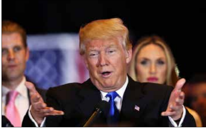
تحولت إنديانا إلى الولاية التي دفنت 43 مليون دولار صرفت على الجهود لإيقاف ترامب

وفي هذا السياق، أشارت استطلاعات الرأي إلى أنه في حال احتدام المنافسة بين ترامب وكلينتون في الانتخابات الرئاسية، فإن السيدة الأولى السابقة ستكون الأوفر حظاً بالفوز، ذلك أنها نالت في المئة من نوايا تصويت الأميركيين مقابل 40.5 في المئة لدونالد ترامب، بحسب معدل آخر ستة استطلاعات رأي.