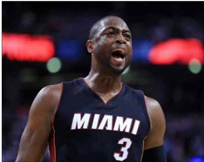
وايد بصرخ فرحاً بعد فوز هيامي على تورونتو

بدوره، احتاج ميامي هيت إلى وقت إضافي للتغلب على مضيفه تورونتو رابتورز 102-96 ليتقدمه