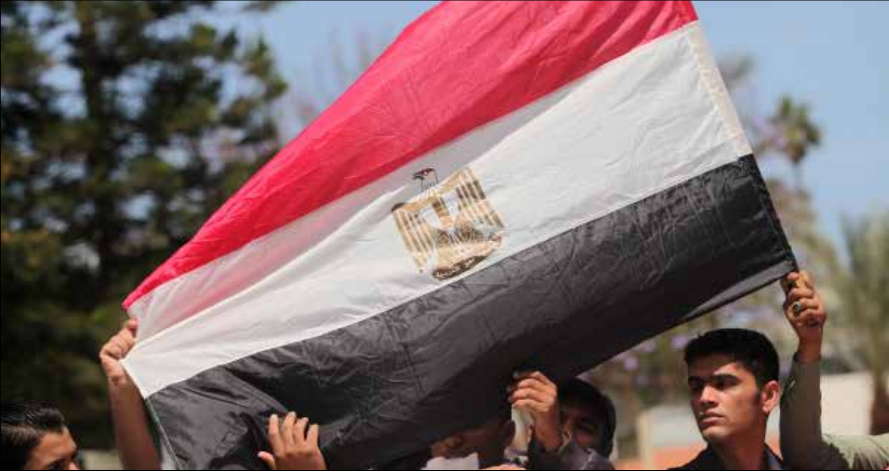
من مسيرة تطالب بفتح معبر رفح

يبدو أن الفريزين اعتادوا أن يواجهوا حرباً كل عامين. ضريبة فرضت عليهم مكرهين، فهم لا يزالون تحت حصار العدو و«الشقيف». منذ عامين شنت إسرائيل عدواناً على القطاع. أبدعت فصائل المقاومة، لكن القيادة السياسية لم تترجم ذلك نجاحاً. اليوم الحرب تلوح في الأفق من جديد. برغم أن كل الأطراف، لا تريد لها ذاتها