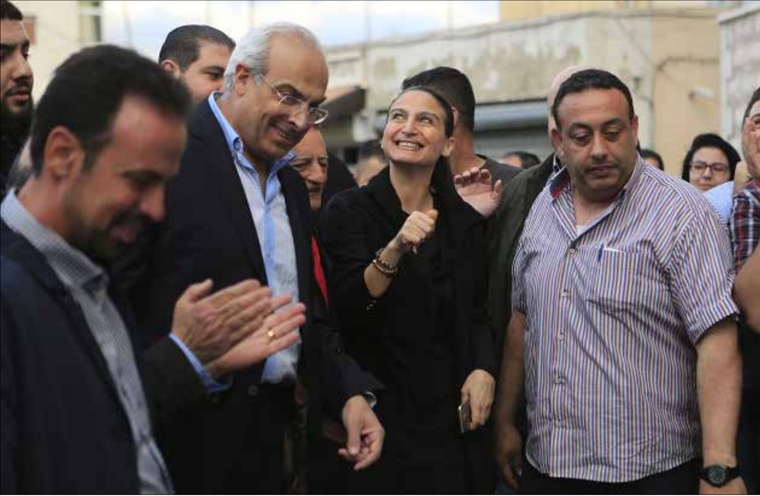
اسقطت سكاف رهانات خصومها على شق صفوفها (الخبار)

المستقبل يلتزم لائحة سكاف «زي ما هي» وحزب الله سيشكل لائحة خاصة به