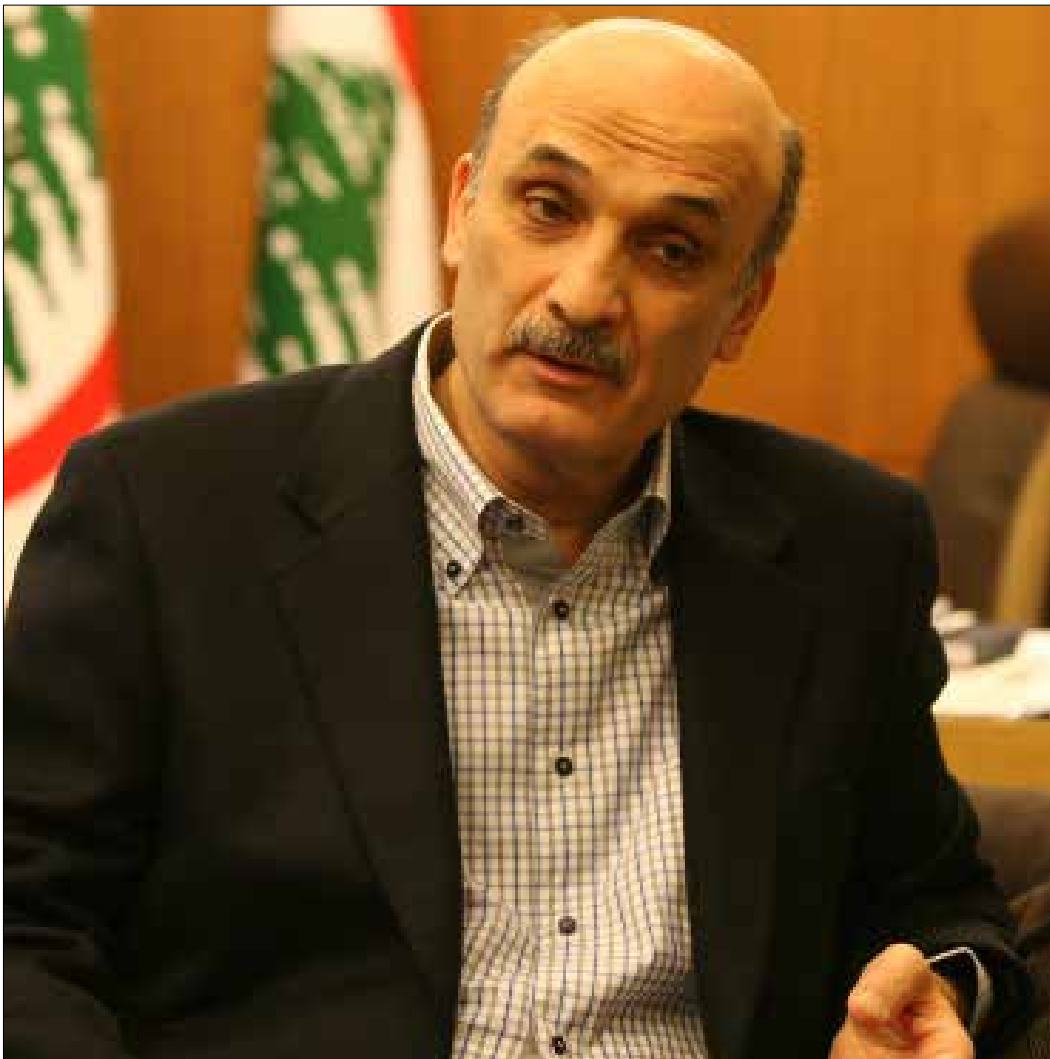
مصادر معرّاب تؤكد استياء جعجع من شطحات الحريري (هيثم الموسوي)

لم يكن كلام سمير جعجع في إطلالته التلفزيونية الأخيرة سوى اختبار لنيات الرئيس سعد الحريري. جسّ قائد معرّاب نبض رئيس تيار المستقبل بعد الانتخابات البلدية فوجد إصراراً منه على «المزيد من التباعد»