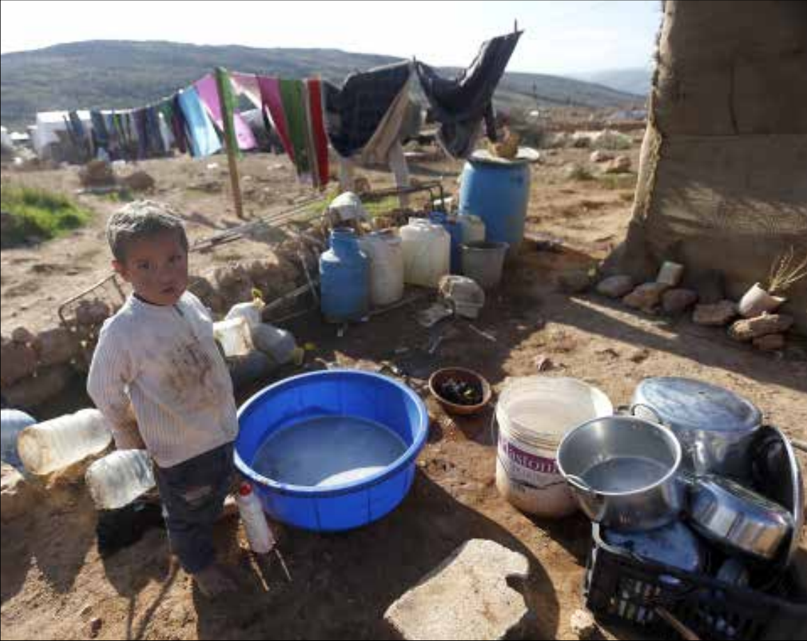
أية عملية إعادة إعمار يجب أن تترافق مع خطة اقتصادية شاملة (هيلثم الموسوي)