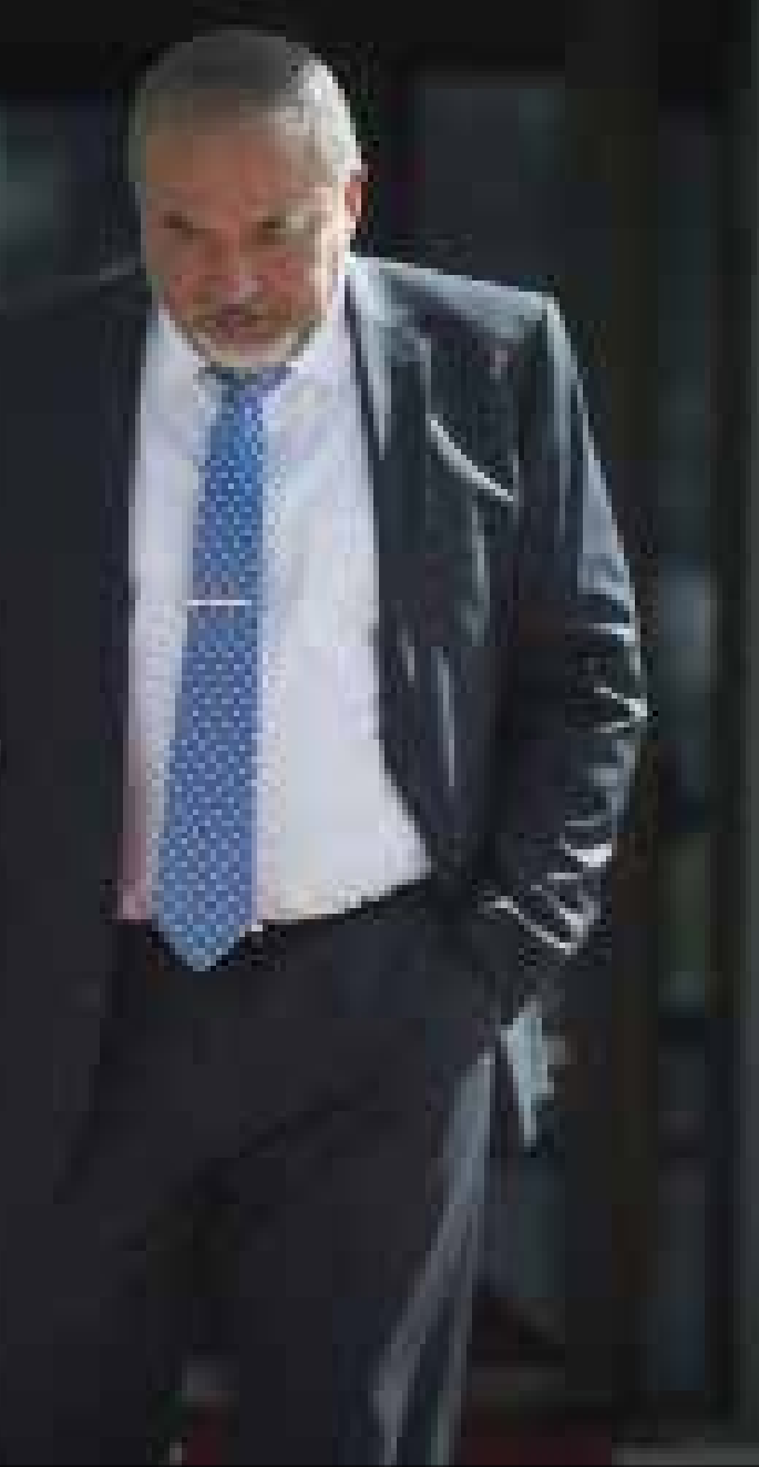
سيناريو ضبط نتنياهو وليبرمان في وزارة الخارجية سيتكرر في حقيقة الأمان

والجبان والبعوضة»، وأن «كل ما يفعله هو إرهاب سياسي صرف»، معتبراً أن انهيار نظامه «مسألة وقت فقط». وفي اجتماع آخر، دعا سفراء إسرائيل في الخارج إلى التعامل والتصرف بكبرياء أمام العالم، وطبقت دعواته هذه عبر حادثة الإذلال التي مارسها نائبه، داني أيلون، بحق السفير التركي في