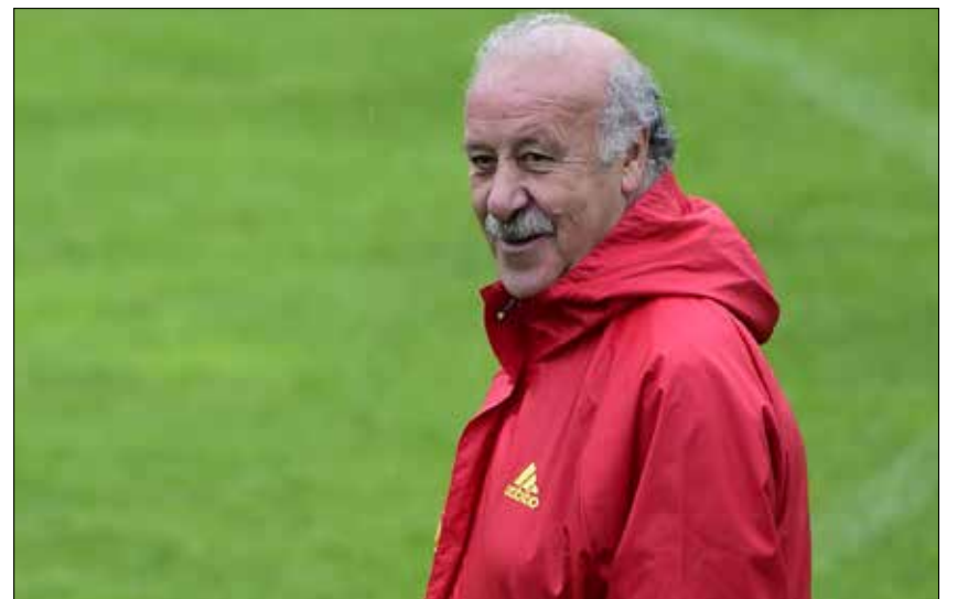
فيستندي دل بوسكي

للغاية، ولكننا مستعدون لخوض البطولة في أفضل حال. وتابع دل بوسكي قائلاً: «نحن مستعدون للانطلاق... الفوز أمر آخر. هناك منافسون جيدون، وفي كرة القدم كل الأمور متكافئة تماماً». وبوجه المنتخب الإسباني نظيره الجورجي يوم الثلاثاء المقبل في آخر مباراة ودية إعدادية قبل بدء رحلة الدفاع عن اللقب في 13 حزيران الجاري بمواجهة تشيكيا في تولوز. وتلعب إسبانيا في المجموعة الرابعة التي تضم كلاً من تركيا وكرواتيا إلى جانب تشيكيا. من جهة أخرى، رأى لاعب وسط روما دانيليلي دي روسي، أن منتخب بلاده ليس من المرشحين لإحراز اللقب، لكنه في المقابل قادر