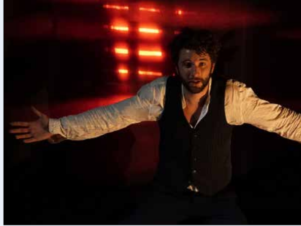
الافتتاح مع عرض «أموك» الذي اقتبسها اليكسي مونكورجي عن قصة ستيفان تسفاينغ

كانت للمسرح محطة مميزة عام 2013 حين استضاف أكثر من عمل للمخرج والكاتب المسرحي اللبناني الأصل وجدي معوض هي «حرائق»، و«وحيدون» و«الحارسة». عبر تلك النصوص، شرّع وجدي معوض أبوابه للحديث عن الجذور وتسرّبات الحرب الأهلية والالتزام الكوني والإنساني والفن. كذلك، تعرف المقلوبون على المهرجان إلى أعمال المخرجة والممثلة التونسية رجاء بن عمار التي قدمت عرضاً تجهيزياً مع فرقة «فو»، هو «فقاعات» (2009)، وقدم عمر راجح «عملية اغتيال» (2009) في الفضاء الطلق في الحمامات الرومانية، و«أباؤنا» لفرقة «باباكاس» البريطانية. كذلك، كانت روح بينا باوش حاضرة بقوة في عرض «تفاح مهروس» (2014) لفرقة «غانديني جاغلينغ» التي تعود إلى المهرجان هذا العام بعرض يحمل عنواناً مثيراً: «4 ضرب 4: رسوم هندسية فانية» (6/7 - س: 21:00) تقدمه في «مسرح المدينة» (الحمرا - بيروت). الفرقة التي تعمل منذ 24 عاماً على فن الألعاب البهلوانية، أرادت أن تكتشف أفقاً جديداً لهذه الفنون، حيث تدمج مع الباليه الكلاسيكي: