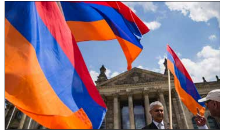
رفع حضوره في البرلمان لفتات شكر عند إعلانات نتيجة التصويت

أثر تبني البرلمان الألماني بالإجماع قراراً يعترف فيه بالإبادة الأرمنية في العلاقات مع أنقرة، المتوترة أصلاً، فقد صدقت تركيا دبلوماسياً، وتوعد رجب طيب أردوغان باتخاذ خطوات للرد