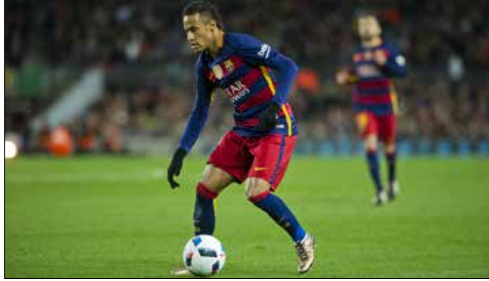
سيحدد برشلونة عقد نيمار رغم العروض الكبيرة التي تلقاها

من جهة أخرى، تعاقده مانشستر سيتي الإنجليزي مع لاعب بوروسيا