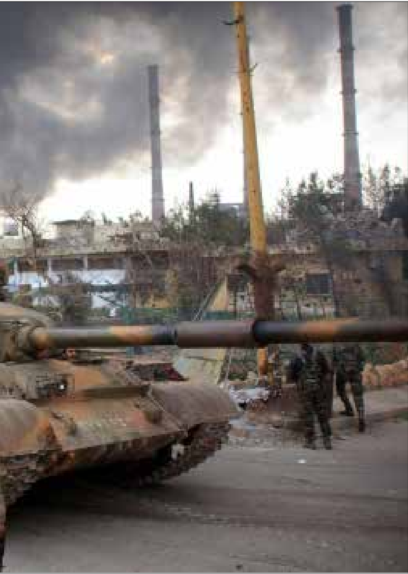
يعمل الجيش للوصول إلى المنطقة وعدم تركها لحلفاء الأميركيين

إلهم، إن كان بالنتيجة الميدانية غير المباشرة أو بالتفرغ اللاحق لقتال هؤلاء في أرياف حلب وإدلب. كذلك لم تقفل ساحة حلب، فالدولة السورية وحلفاؤها يستعدون لاستئناف معركة تطويق المدينة، وهم لا ينتظرون، في المرحلة الحالية، سوى «عدم ممانعة روسية» في ذلك، حسب مصادر عليمة في الميدان السوري.