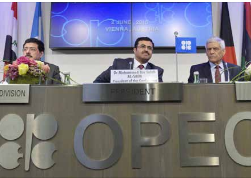
«قد لا تعود المنظمة إلى أسلوبها السابق» في إدارة سوق النفط (أبو فراس)