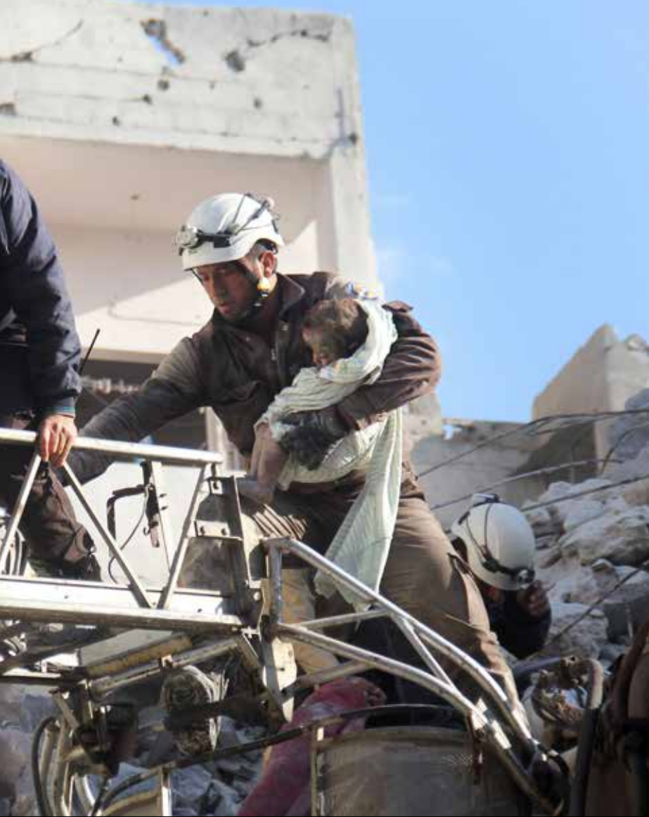
شهدت السنوات الأخيرة سلسلة من التغيرات تؤدي إلى إعادة ترسيم المنطقة