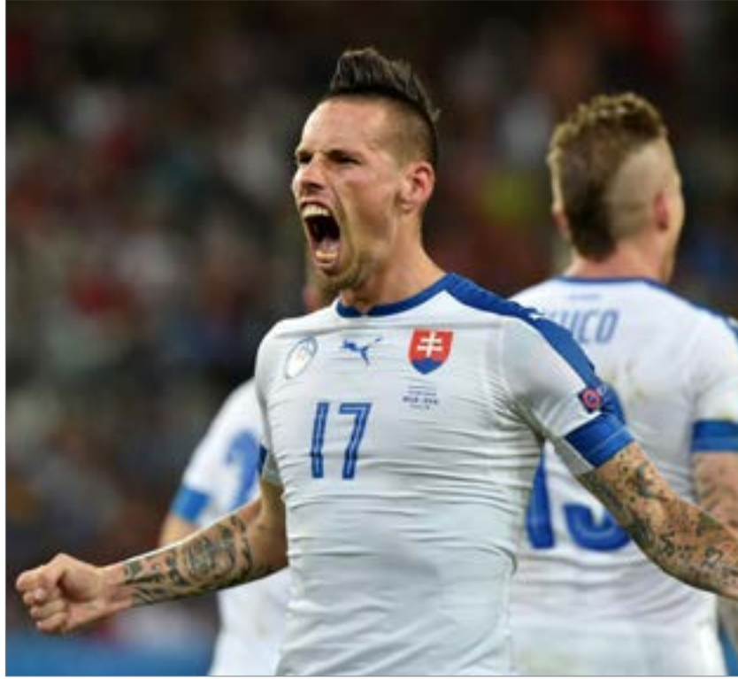
هامسيك هدفه فرضته بهدفة أمام روسيا

الرياضة في الموضوع، وبدلاً من أن يخفف أحد ما عن ثقل اللاعبين، مخافة الخروج إذا ما «استفنز» أحد جماهيرهم، زاد وزير الرياضة الروسي فيتالي موتكو الطين بلة حين أقر بأنه لن يستبعد وقوع حوادث عنف جديدة من قبل جماهير بلاده في خلال البطولة. اللاعبون كانوا بغنى عن أي تصريح