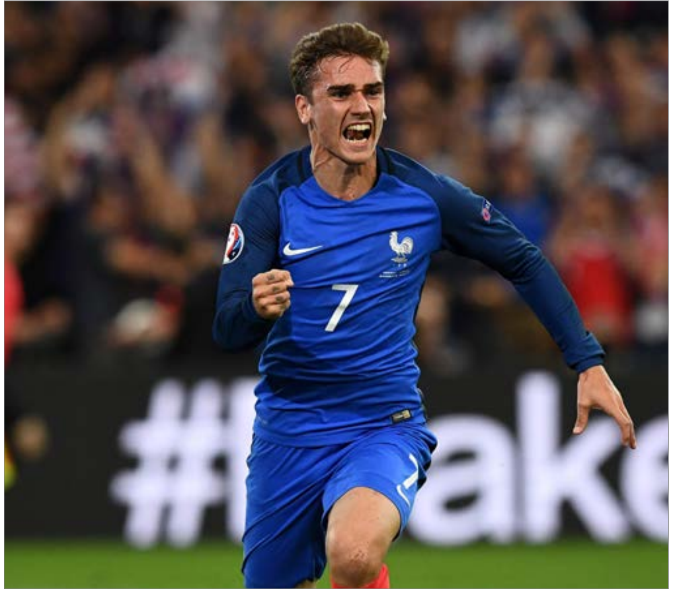
غريزمان يحتفلًا بتسجيله الهدف الأول في الدقيقة 90