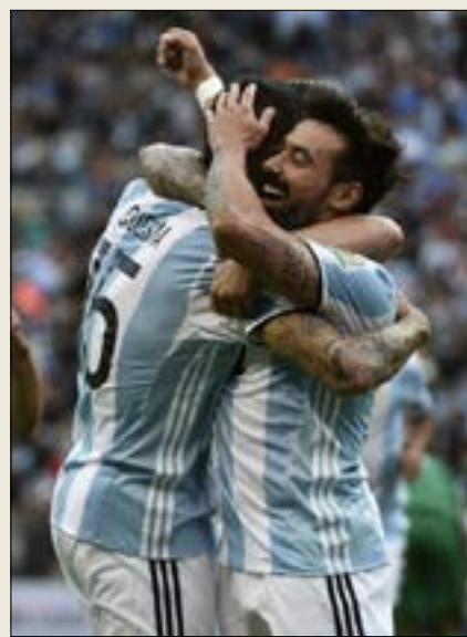
باستثناء الأرجنتين، لم يحقق أي منتخب النقاط الكاملة في دور المجموعات منذ 2007 (أ، ب)

مارتينو إلى القول إن الفترة الحاسمة في عمر البطولة تبدأ بمواجهة فنزويلا في الدور المقبل، وواقفه القائد ليونيل ميسي بالقول إن