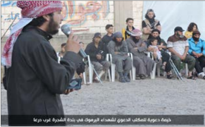
خيمة دعوية للمكتب الدعوي لشهداء اليرموك في بلدة الشجرة غرب درعا

وتشكيلات الجبهة الجنوبية و«حركة أحرار الشام» من جهة أخرى، بعد ركود شهوده حوض اليرموك. مصدر مقرب من «النصرة» يستشر في الأيام المقبلة يرى أنها ستضع منطقة حوض اليرموك أمام «مجهول»، خصوصاً مع معلومات تفيد أن «إعلاناً رسمياً قريباً جداً سيصدر لجيش خالد بن الوليد يبايع فيه تنظيم الدولة». يضيف المصدر أن ذلك «قد يعني دخول طائرات التحالف إلى الساحة الجنوبية، ما يعّد تحولاً كبيراً في سير المعركة»، مشيراً إلى إمكانية «انسحاب النصر من المعركة على غرار ما حصل في ريف حلب الشمالي (إبان الانسحاب الكامل لـ«النصرة» من نقاط اشتباكها مع «داعش» بعد سقوط تعرّضت لها من عدد من مشايخ ومنظري القاعدة، الذين أصدروا فتاوى تحرم القتال بالتعاون مع «طائرات التحالف الصليبي»». ويختّم المصدر قوله إن الغارات الجوية لتستهدف النصر، كما سبق أن حصل في مناطق متعددة من إدلب... وقد يؤدي إلى خارطة تحالفات جديدة».