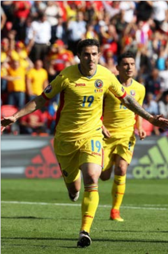
أصبح ستانكو ثالث لاعب في تاريخ النهائيات يسجله ركلتي جزءاً أو أكثر

راؤفان رات الأرضية من داخل المنطقة التي جاءت قريبة من القائم الأيسر (46)، والكرة التي أبعدها يوهان دجورو عن المرمى في الرمي الأخير قبل أن تصل إلى كلاوديو كيشيرو والمرمى تحت رحمته (52). وتمكنت سويسرا من معادلة النتيجة عبر أمير محمدي بتسديدة يسارية صاروخية من داخل المنطقة بعد كرة مرتدة إثر ضربة ركنية (57)، ف سجل هدفه الخامس في 44 مباراة دولية، وأصبح أول لاعب سويسري يسجل في كأس العالم وكأس أوروبا. هكذا، انتهت المباراة بالتعادل. نتيجة لم يكن يتمناها المنتخبان طبعاً ليتأجل حسم تأهلها إلى دور الـ16 إلى الجولة الأخيرة.