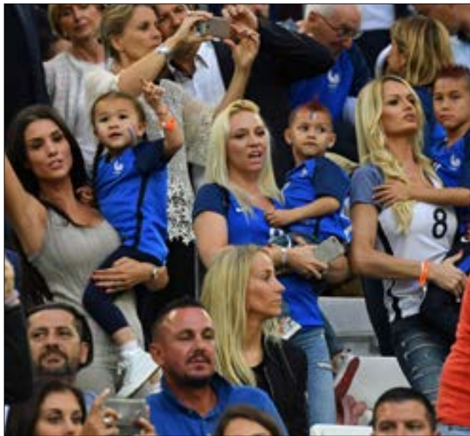
زوجات لاعبي فرنسا يحتفلن بهدف باييه

لكن المفاجأة التي أعد لها ديشان للجمهور الفرنسي وللخصم ارتدت عليه، إذ إن الألبان عرفوا كيف يفسدون خطته وتكتيكة تماماً