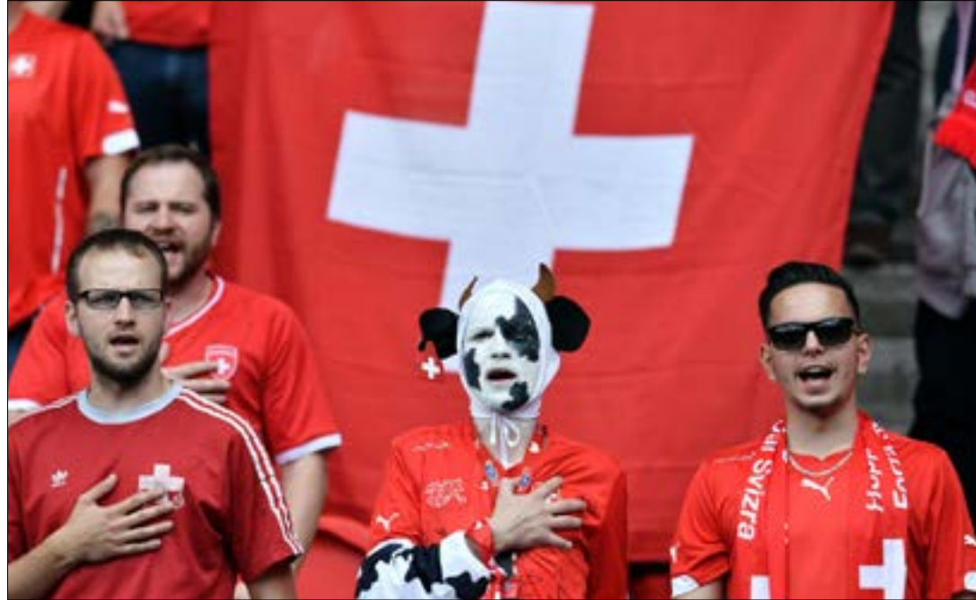
النشيد الوطني هو نوع من أنواع التفاعل الأساسية مع الشعب الذي يمثل المنتخب

إلا أن أوزيل، وفي المباراة الأولى أمام أوكرانيا، لم يبال بهذا الانتقاد وبهذه الدعوة، وأصرّ على موقفه عدم ترديد النشيد لتكون الصورة مشابهة لما كانت عليه في مونديال 2014 وقبل ذلك