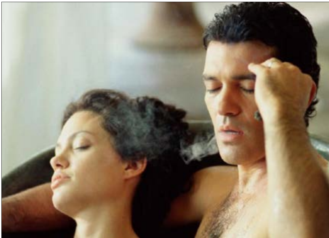
أنطونيو بانديراس وأنجلينا جولي في مشهد من Original Sin

لكن حساب الحقل لم يطابق حساب البيدر، وسرعان ما ضبط رواد مواقع التواصل الاجتماعي البرقاوي وبطله تيم حسن ونادين نسيب نجيم وآخرين متلبسين باقتباس واحد من أشهر الأفلام الهوليوودية. بعد عرض بضعة حلقات من «نص يوم»، عرف الجمهور أنه مستنسخ