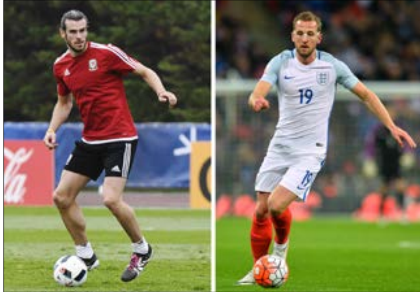
بدات الحرب بين إنكلترا وويلز قبل انطلاق المباراة

مواجهات مرتقبة وحادة ستشهدها كأس أوروبا 2016 اليوم. بداية مع مواجهة بريطانية بحثة بين الجارتين إنكلترا وويلز الساعة 16:00 بتوقيت بيروت/ في الجولة الثانية من مباريات المجموعة الثانية.