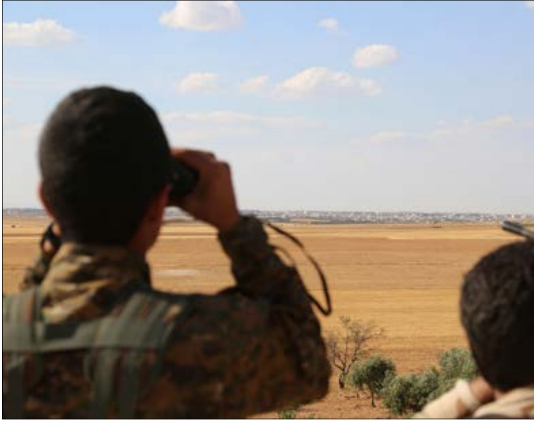
سيطرت «فسد» على 1000 كلم مربع في ريف حلب

الراهنة على امتصاص أي هجمات تستهدف مناطق السيطرة في الريف الجنوبي، عبر تنفيذ انسحابات من بعض النقاط ومعاودة التقدم إليها بعد فسخ المجال أمام سلاح الجو لتنفيذ تدخلات مكثفة. ضمن هذا الإطار، عاود الجيش والحلفاء نهار أمس السيطرة على نقاط عدة على محور «خلصة - زيتان» كان قد انسحب منها فجرأ، وكانت «جبهة النصر» وحلفاؤها «الحزب الإسلامي التركيستاني» ومجموعات «جيش الفتح» قد شنوا هجمات مكثفة دشنتها عمليات انتحارية أدت ليل أول من أمس إلى انسحاب الجيش وحلفائه من بلدة زيتان (جنوب شرق الزربة) بعد اشتباكات عنيفة. وتزامن هذا الهجوم مع آخر استهداف بلدة خلصة (شمال غرب الزربة)، وثالث نحو بلدة برنة (جنوب الزربة). فيما كان الهدف التالي حسب خطط «النصرة» شن هجوم مركّز على تمرکزات الجيش في بلدة الحاضر الاستراتيجية، في إحياء لخطط قديمة تطمح إلى السيطرة على نقاط استراتيجية عدة في الريف الجنوبي («الأخبار»، 2868). وأكد مصدر ميداني سوري لـ«الأخبار» أنّ «الجيش والحلفاء تمكّنوا من استعادة كل النقاط التي انسحبوا منها تكتيكياً لوقت قصير، وكبدوا الإرهابيين خسائر فادحة».