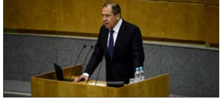
لافروف: نمة رغبة لتقويض موقع روسيا كمنافس

إن «نمة رغبة واضحة لترميم النظام عبر الأطلسي على حسابنا، وتقويض موقع روسيا كمنافس في أسواق الطاقة والسلاح». وأعلن الوزير أن بلاده «لا تنوي الانخراط في المواجهة التي تُفرض علينا»، مضيفاً أن «عادة المجابهة والألعاب الجيوسياسية ذات النتائج الصفرية تقوّض الجهود لتأمين التنمية العالمية المستدامة، وتخلق أزمات شبيهة بالازمة الأوكرانية»، والتي رأى أنه لا يمكن حلها إلا بالوسائل السلمية.