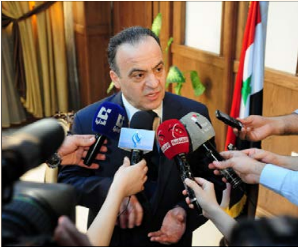
صدر الرئيس بشار الأسد، أمس، مرسوماً يقضي بتكليف المهندس عماد خميس (وزير الكهرباء) بتشكيل الحكومة الجديدة

في إحداهن خرق جديد في دفاعات تنظيم «داعش» في مدينة منبج، باقتحامها لصوامع الحبوب، الواقعة جنوب شرق المدينة، والتي تطل على معظمها، بعد أكثر من عشرة أيام على حصارها، ما سيجلب لها إشراقاً على أجزاء واسعة من المدينة، ويمكنها من تحقيق مزيد من التقدم باتجاه عمق أحيائها، التي تشهد وجوداً لقرابة مئة ألف مدني فيها، إضافة إلى السيطرة على قرية قناة الشيخ طباش على طريق منبج - حلب.