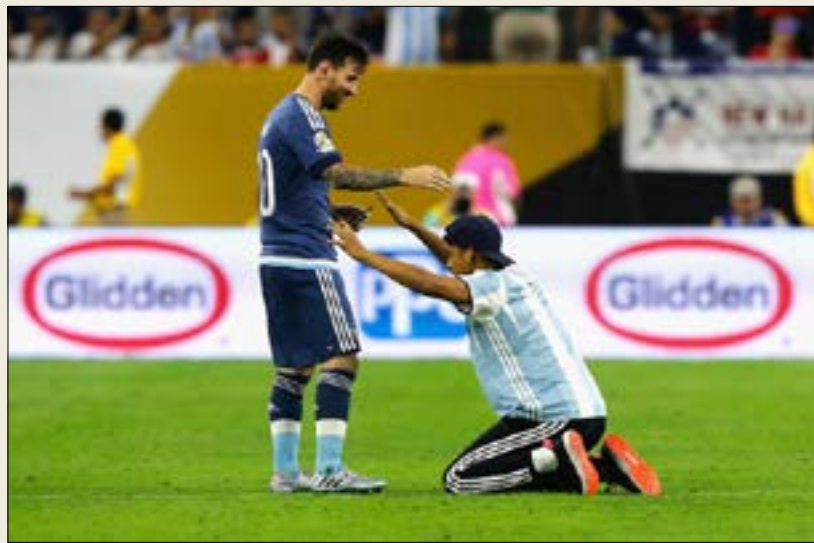
مشجع نزل إلى أرض الملعب لتحية ميسي

وتلعب فجر اليوم الساعة 3:00 بتوقيت بيروت كولومبيا مع تشيلي في نصف النهائي الثاني.