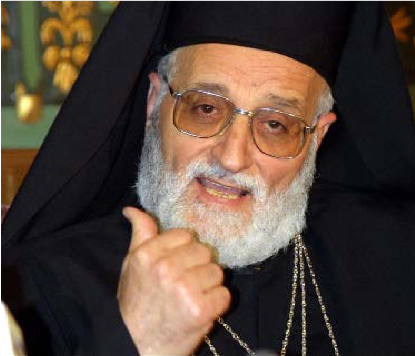
غالبيت المطارنة متخرجون من «مدرسة» لحام