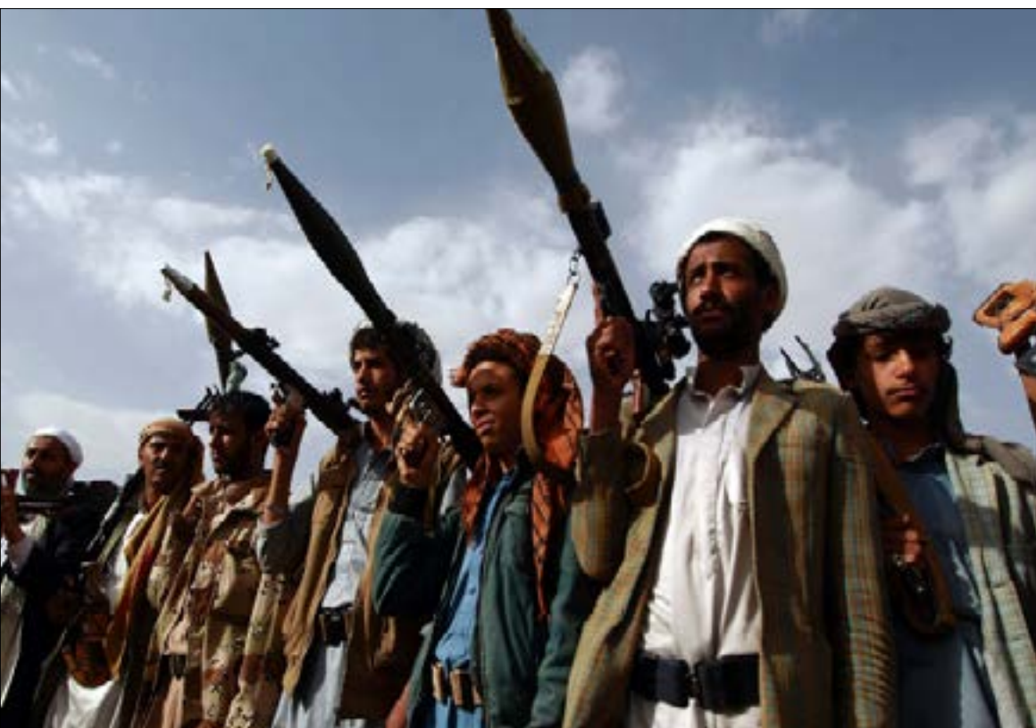
تؤدي مجموعات حزب «الإصلاح» الدور البارز في معارك شرقي صنعاء

وأفادت مصادر عسكرية بأن قوات الجيش و«اللجان» سيطرت على أربعة مواقع جديدة في منطقة حريب نهم المرتبطة بمنطقة حريب القراميش شرقي محافظة صنعاء، وعلى عدد من التّباب المطلة على وادي حريب من الجهة الجنوبية. وكانت قوات الجيش و«اللجان الشعبية» قد تقدمت في نهم مطلع الأسبوع، وتمكنت من استعادة جبل حلبان الاستراتيجي في مديرية فرضة نهم، والذي يمتد حتى الأطراف الغربية لمحافظة مأرب.