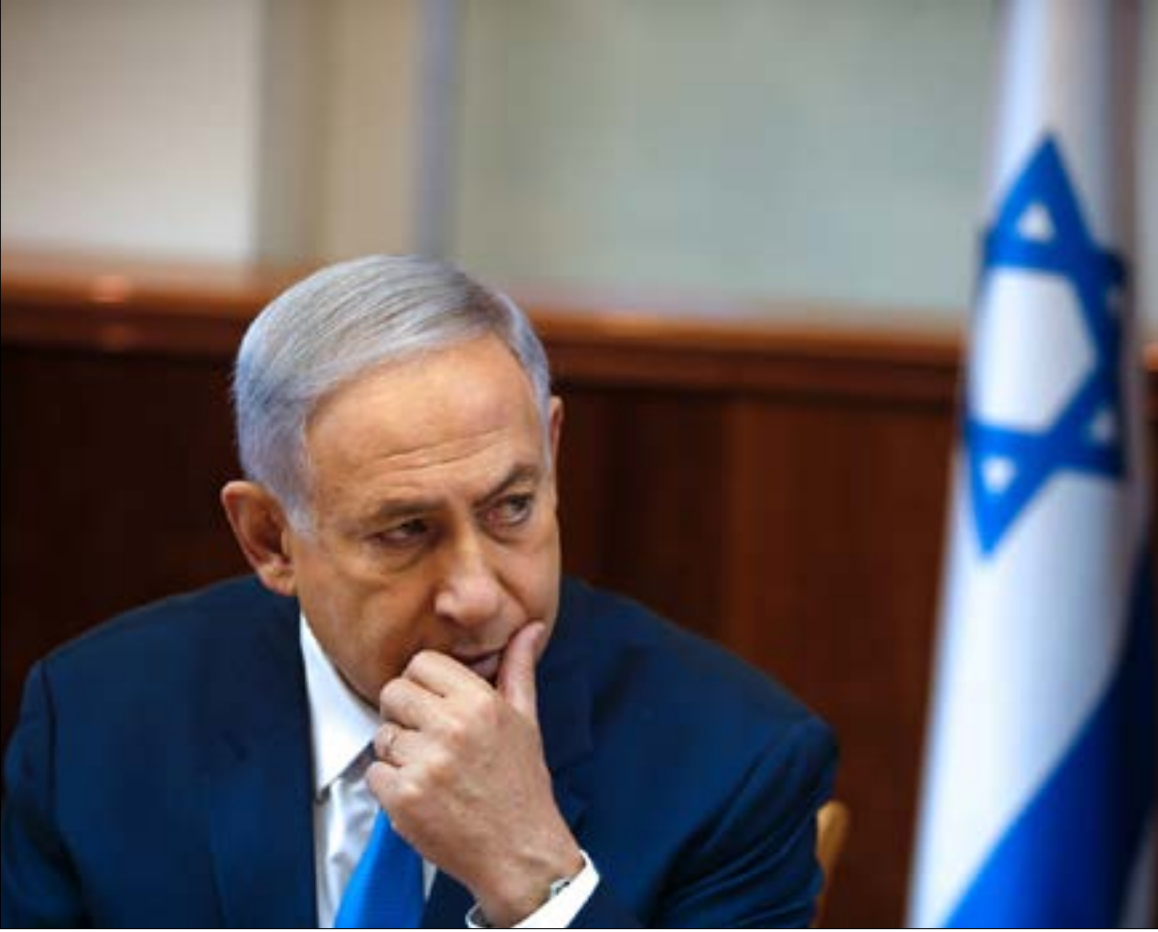
قُد يوَجَل النسر إلى ما بعد جولة لقاءات نتيناهو

تسعى حكومة العدو الإسرائيلي إلى تطوير تداعيات التوصيات الصادرة عن تقرير «الرباعية الدولية». ومن المتوقع أن يوجه التقرير انتقادات قوية إلى إسرائيل. لذلك نشط بنيامين نتيناهو «هاكياتاه» لتخفيف لهجة الانتقاد لتلك آييب