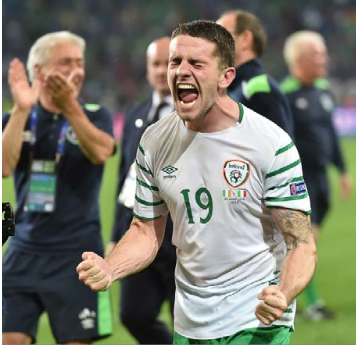
صرخة روبرت باردبي بعد الهدف التاريخي في مرمرى إيطاليا (أف ب)