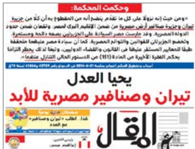
من الصفحة الاولى لجريدة المقالة

من جهتها، رأت جريدة «المقال» أن الحكم انتصار لها، لكونها اليومية الوحيدة التي دعمت مصرية الجزيرتين منذ البداية وبشكل مكثف. وقال عنوانها الرئيسي: «يحيى العدل... تيران وصنافير مصرية للابد». أما «الأهرام»، أعرق الصحف وأقربها للدولة، فجاءت تغطيتها باهتة في عدد الأمس، وتضمن عنوان التغطية معلومة حول «طعن الحكومة» بحكم بطلان الاتفاقية، ولم تنشر أي صور مع الخبر.