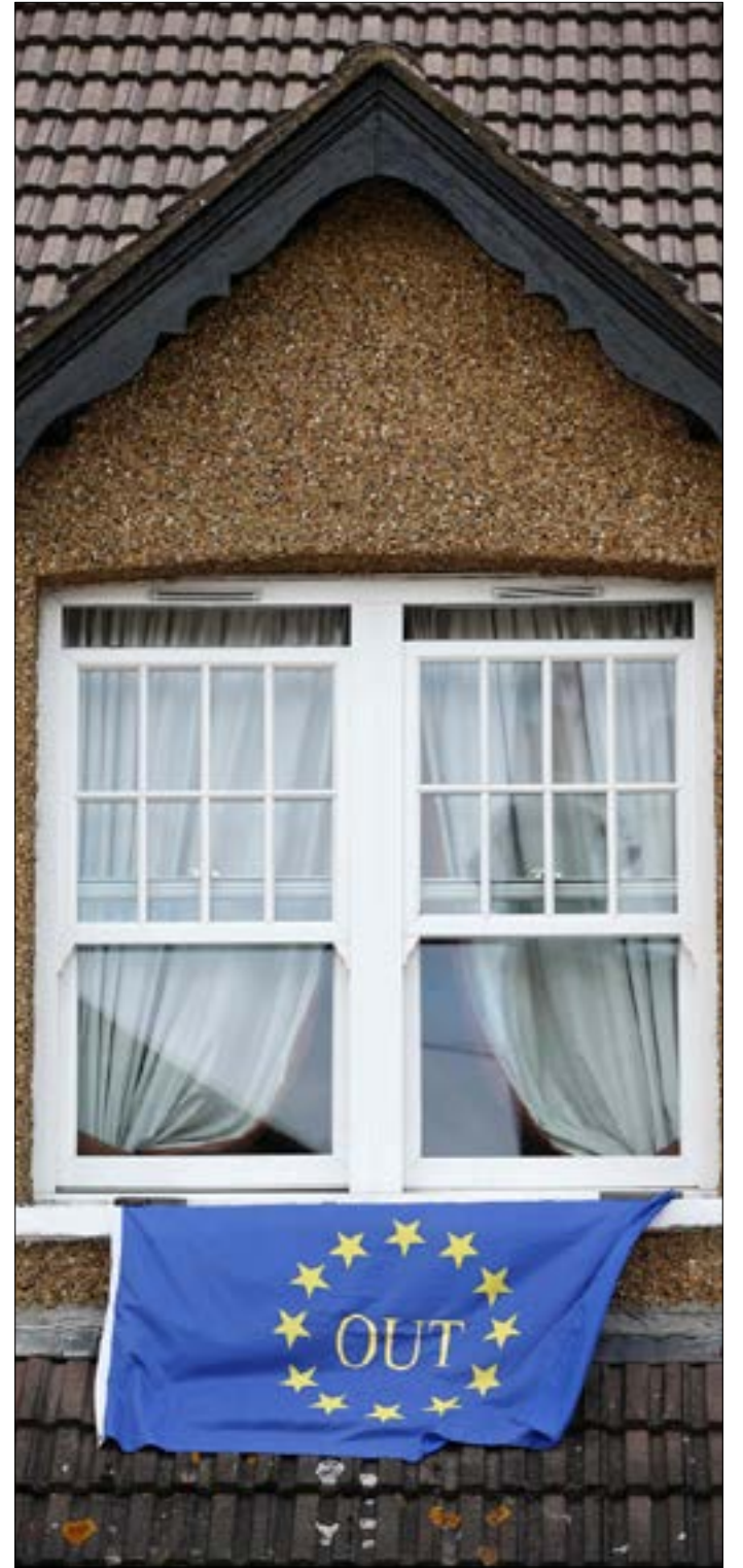
منذ عام 2013 بدأت نقاشات تاريخية حول طبيعة العلاقة مع أوروبا

تاريخنا الطويل كرس مبدئياً سيادة برلماننا، وهذه مشكلة لأن الاتحاد الأوروبي نظام تشريعي... ويحتج العديد من الناس على اتباع برلماننا لقوانين آتية من أوروبا. من ناحية أخرى، نحن لا نفهم مؤسسة