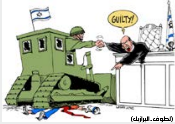
(لطف - البرازيل)

إلياس خوري ضد أمين معلوف؟ كل ما كتبه في المقالة المشار إليها أعلاه، يوحي بغير ذلك. إنّه يتماهى مع «المطبّع» - في لاوعيه على الأقل، أو بفعل تقاطع المصالح وتشابه التنازلات وتلاقي الطموحات - ويصبّ جام غضبه، من أوّل المقالة إلى آخرها، على منتقدي صاحب «الغونكور»، من دون تسميتهم طبعاً، وهذه التعمية التي تعمّق النقاش، لا تشرف من يتقمّص دائماً دور «المثقف الشجاع»، يكتب أن هؤلاء ليسوا إلا «حفنة قومجيين» (... «مشغولين بالدفاع عن أبدية الأسد وقراره إحراق سوريا وتدميرها». و«الكلام القومي الممانع يحجب الدم السوري الذي يغطي السماء». ألم يلاحظ الرفيق بروتس أنّه يفعل مثل كتبة الوهابية والربيع القطري واليمين الانعزالي، إذ يقحم الجرح السوري في النقاش، ليبرئ أمين معلوف، ويمسح خطيئته الكبرى؟ أي صديق لسوريا هذا الذي يستعملها بيداً أو حجر داما في ألعابه القذرة! أي فكر وضع هذا الذي يمسح