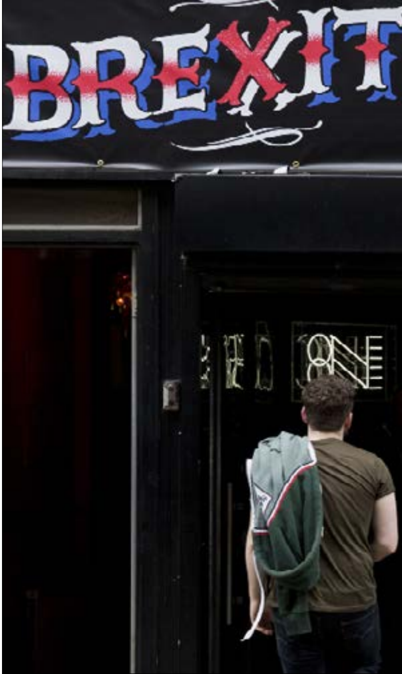
وقّع 300 من النجوم رسالة تعبر عن قلقهم من خروج بريطانيا من الاتحاد

لعل الروائية جيه كيه رولينغ عبّرت أكثر من غيرها عن هذا الاستقطاب الهائل الذي يعيشه الشعب البريطاني، وذلك في رسالتها الخاصة عن الاستفتاء. كتبت تقول: "لقد خلق لنا الطرفان تناهين لإخافتنا مما قد يحصل غداً إذا صوتنا بالطريقة الخطأ. اليوم سنقرر أياً من هذه التناهين كانت حقيقية وأياً منها أوهام، وسيتحول المواطن من قارئ لقصص هذه التناهين إلى مؤلف، إذ إن نهاية القصة سعيدة كانت أو حزينة، إنما سيكتبها المواطنون بأصواتهم في الاستفتاء".