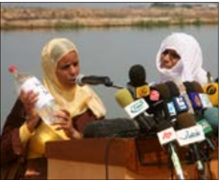
تعاين مناطق كبيرة من ارتفاع نسبة التلوث في المياه

أوفر وأكثر صحة للمواطن من مياه محطات التحلية التجارية التي لا تتوافق ومعايير الجودة». وبالنسبة إلى سكان القطاع، الحديث عن جودة المياه التي تنتجها المحطات أكثر الأمور المشددة، لأن الخزان الجوفي يعاني ارتفاع نسبة الملوحة، ما يجعل 97% من مياهه غير صالحة للاستخدام الآدمي.