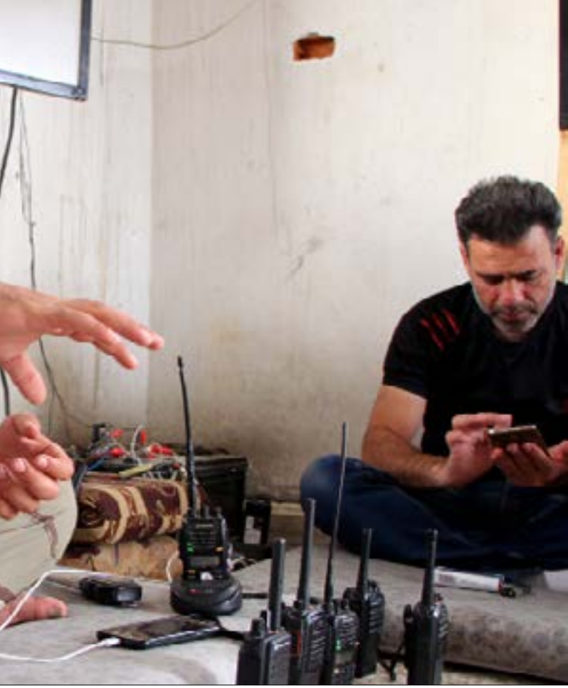
شبكة «الموك» في تشكيل غرفة عمليات داخل الأراضي السورية (الناضول)