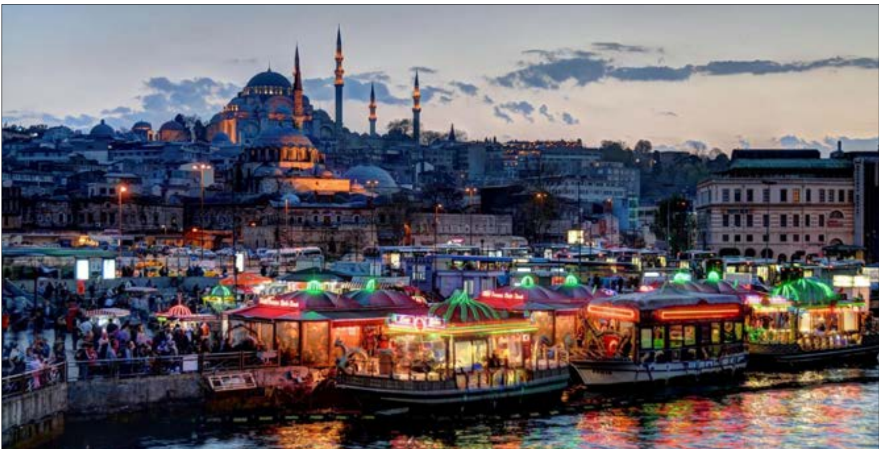
تفجير إسطنبول قتل ما تبقى من الموسم السياحي