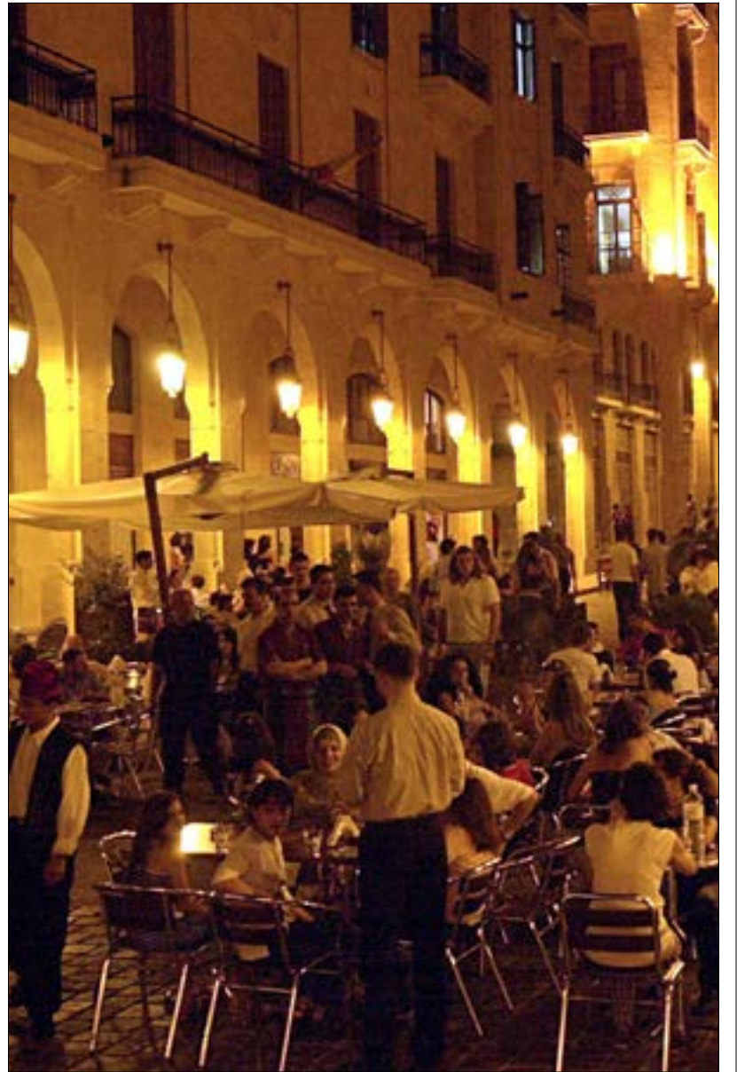
هك بات هذا المشهد من الماضي؟

وتحتل تركيا قائمة الدول الأكثر تعرضاً لهجمات إرهابية، خاصة بعد أن تلقت السياحة فيها - التي تراجعت