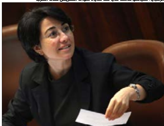
الزعبي: نتنياهو فأشل في كل شيء سوى التحريض على العرب

زعبي: أنتم لم تنفصلوا عن غزة أنتم فصلتم غزة عن الحياة