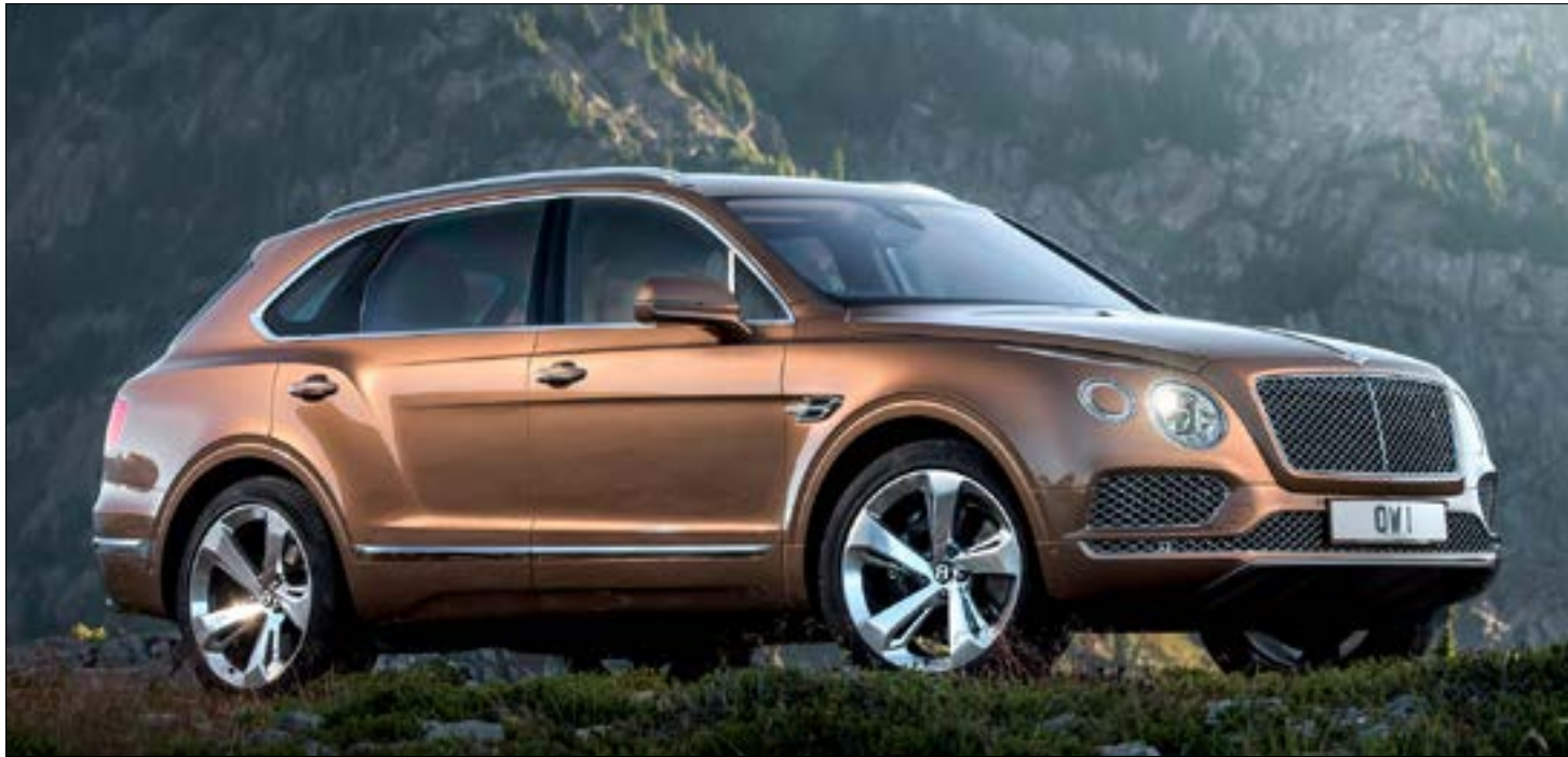
جرى تحسين كفاءة المحرك الجديد بنسبة 11,9% مقارنة بمجموعات الدفع الموجودة في السوق