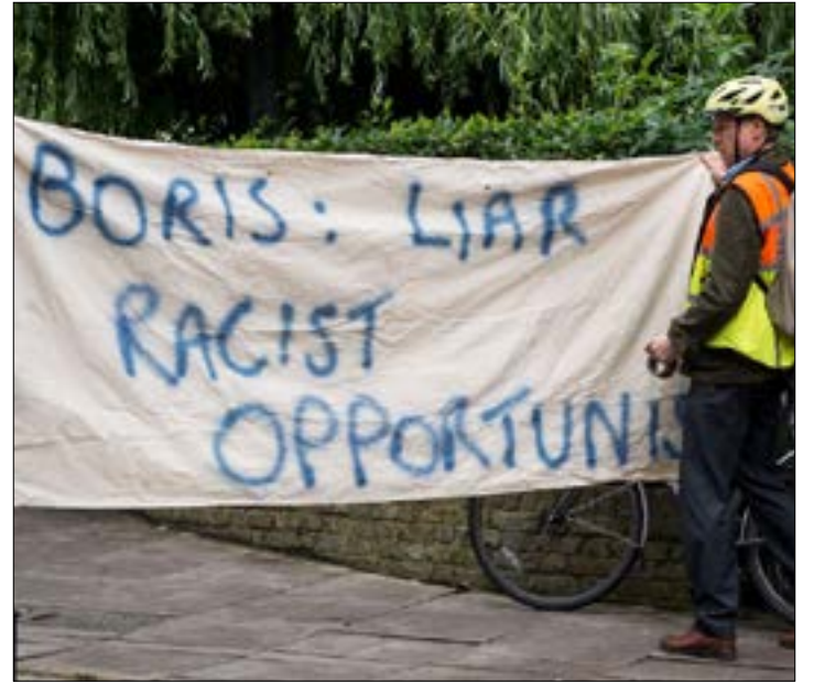
أعلنت جونسون عدم نيته دخول السباق على رئاسة الحكومة

اعتبر الرئيس الروسي، فلاديمير بوتين، أمس، أن تداعيات «الصدمة» التي أثارها تصويت البريطانيين للخروج من الاتحاد الأوروبي ستدوم «مطولاً»، مضيفاً أن موسكو ستتابع «عن كثب» المفاوضات بين الأوروبيين وبريطانيا.