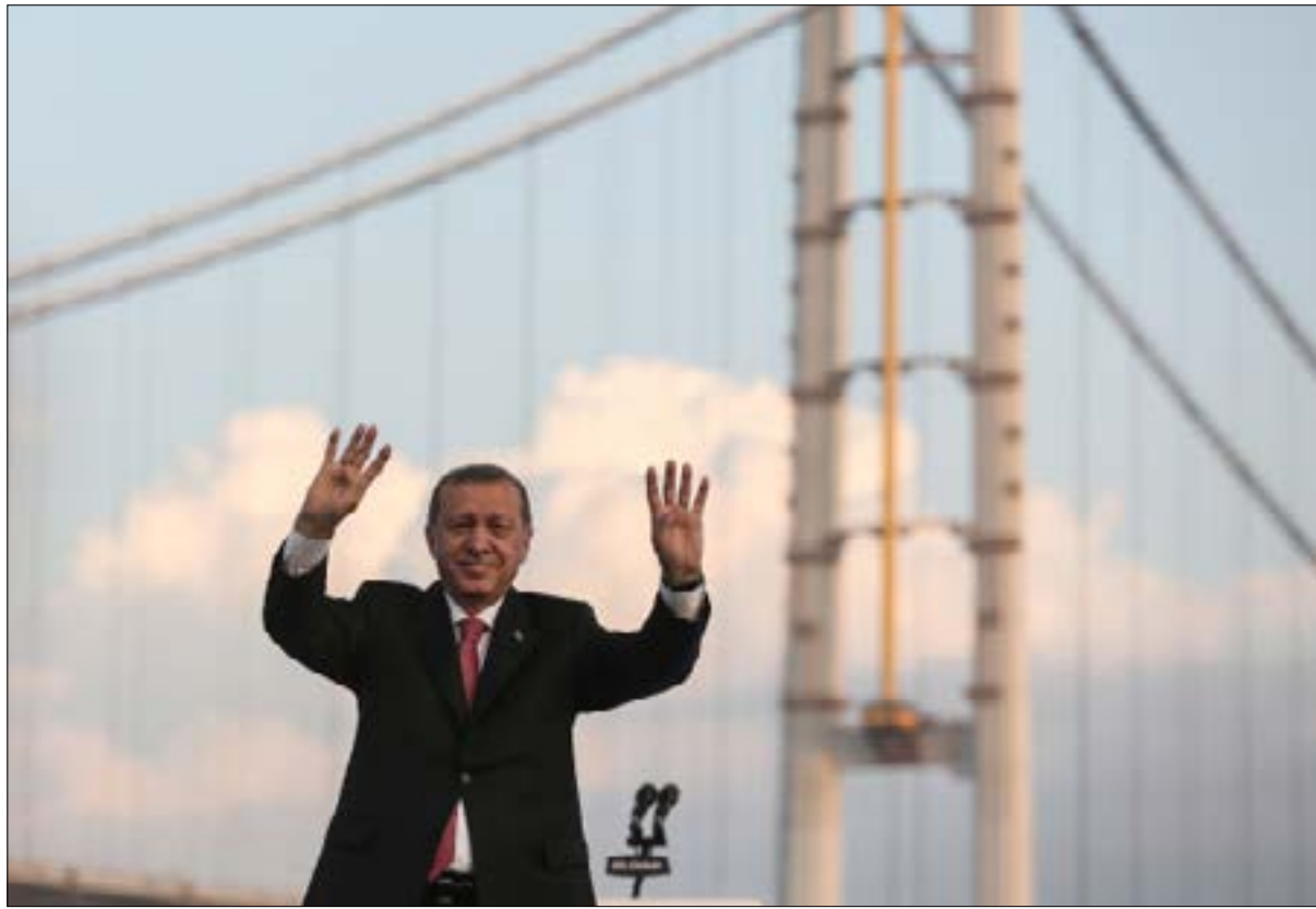
لم يستبعد الكرملين عقد لقاء بين بوتين وأردوغان قبل إيلوك العقيد

بعد الانفتاح مع موسكو وتل أبيب، تتعاطف الحظوظ بأن تقود انعطافة السياسة الخارجية التركية إلى القاهرة. ورغم السرعة في عودة التطبيع مع روسيا وإسرائيل، فإن العلاقات مع مصر لا تزال مجمدة منذ نهاية عهد الرئيس محمد مرسي عام 2013، على الرغم من تحالفهما المشترك مع السعودية. تركيا لا تزال على الإصرار الإيديولوجي لرئيسها رجب طيب أردوغان، حليف مرسي، على عدم الاعتراف بالسلطة المصرية، وهو ما تشترطه القاهرة مسبقاً لعودة العلاقات. وبحسب مقال نشرته صحيفة «وول ستريت جورنال» يوضح وزير الخارجية التركي الأسبق، الذي شغل أيضاً منصب سفير أنقرة في مصر، يسار ياكيش، أن رفض الاعتراف بالرئيس عبد الفتاح السيسي تحول إلى «فكرة ثابتة» بالنسبة لأردوغان، مضيفاً أنه «يجب ألا تكون هناك مشاكل بين الدولتين... فمصر شريك أساسي في أي شيء تريد القيام به في الشرق الأوسط، وتركيا تحرم نفسها هذا الدعم».