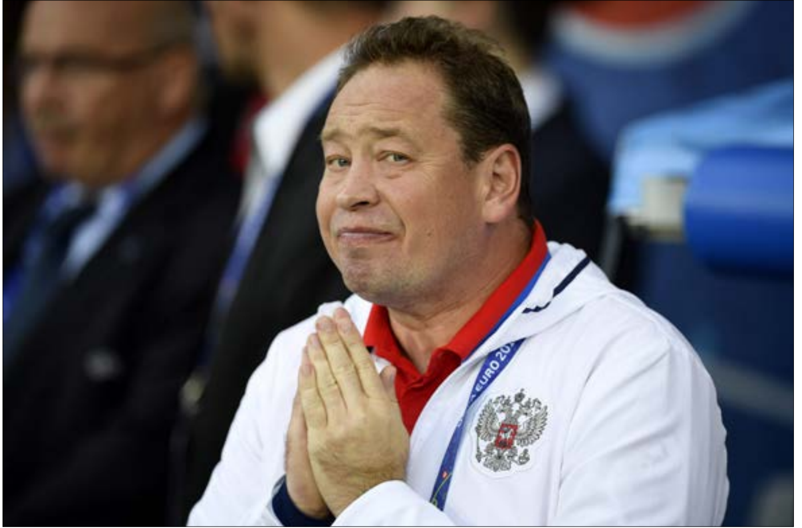
مدرب روسيا ليونيد سلوتسكي جديد المدربين المقالين من مناصبهم (مارتن بورو، اف ب)

بنفس الإيقاع في فرنسا فخرجت روسيا من الدور الأول في المركز الرابع لترتيب المجموعة الرابعة بعد تعادل مع إنكلترا (1-1) وخسارتين أمام سلوفاكيا (2-1) وويلز (3-0). وتجنب الإتحاد الإشارة إلى اسم خليفة سلوتسكي الذي يدرّب في الوقت ذاته فريق سسكا موسكو. وكان وزير الرياضة الروسي فيتالي موتكو قد أكد قبل أيام أن سلوتسكي لن يستمر في مهامه. وفي تشيكيا أيضاً، أعلن رئيس الإتحاد المحلي لكرة القدم ميروسلاف بيلتا أن مدرب المنتخب بافل فربا ترك منصبه من أجل الإشراف على فريق إنجي ماخاتشكالا الروسي. وقال بيلتا في بيان: «يمكننا فقط احترام رغبة المدرب الذي أراد أن يجرب عملاً جديداً في مكان آخر». وتعرض فربا لانتقادات عنيفة بعد خروج المنتخب التشيكي من دور المجموعات لـ «يورو 2016» إثر خسارته أمام إسبانيا وتركيا وتعادله مع كرواتيا في المجموعة الرابعة. وقال بيلتا أيضاً: «رغم أن مهمتنا انتهت في الدور الأول، إلا أنني اعتبر أن المدرب كان ناجحاً». وبدأ فربا، مدرب فيكتوريا بلزن سابقاً (قاده إلى اللقب المحلي عامي 2011 و2013)، الإشراف على منتخب تشيكيا في كانون الأول 2013 بعد الفشل في بلوغ نهائيات مونديال 2014 في البرازيل. وقاد فربا منتخب بلاده في تصفيات كأس أوروبا وتصدر المجموعة الأولى على حساب اسلندا وتركيا وهولندا، وخاض 25 مباراة دولية فاز في 10 وخسر مثلها وتعادل 5 مرات. وقد يكون مساعده في المنتخب كاريل كريبيتشي الذي قاد فيكتوريا بلزن إلى اللقب المحلي عامي 2015 و2016، أحد الأسماء المطروحة لخلافته.