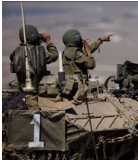
استعاض حزب الله بصواريخ أكثر وتدميرها من الكورنيت (أرشيف)

الانكسار في تلك الحرب، ولا تلغي القلق من المواجهة المقبلة، وتحديداً لسلاح المدرعات الاسرائيلي. مع الاشارة الى ان الصواريخ التي استخدمها حزب الله لاصطياد الاليات الاسرائيلية، اي كورنيت من الجيل الاول، خرجت من الخدمة لديه، واستعاض عنها بصواريخ أكثر دقة وفتكا وتدميرا.