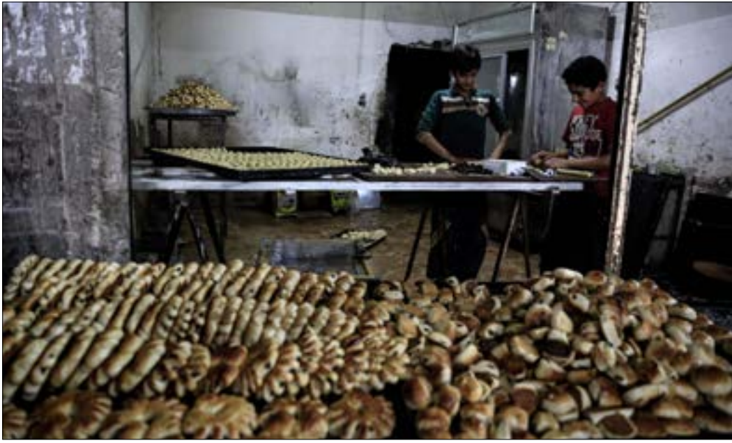
داخل فرن في حجة تشرنوب الدمشقي منذ يومين

بلباسنا فقط، واحتجزونا حين (هنا) من حوالي أربع شهور، وصلنا مرحلة اليأس بهي الصحراء الخالية، لو كنا مطلوبين ما طلعنا عالشام، كنا رحنا إلى تركيا أو أي منطقة أخرى، أنا طلعت لأن ابني عندو امتحان الصف التاسع. يا ريتنا ما طلعنا من الرقة».