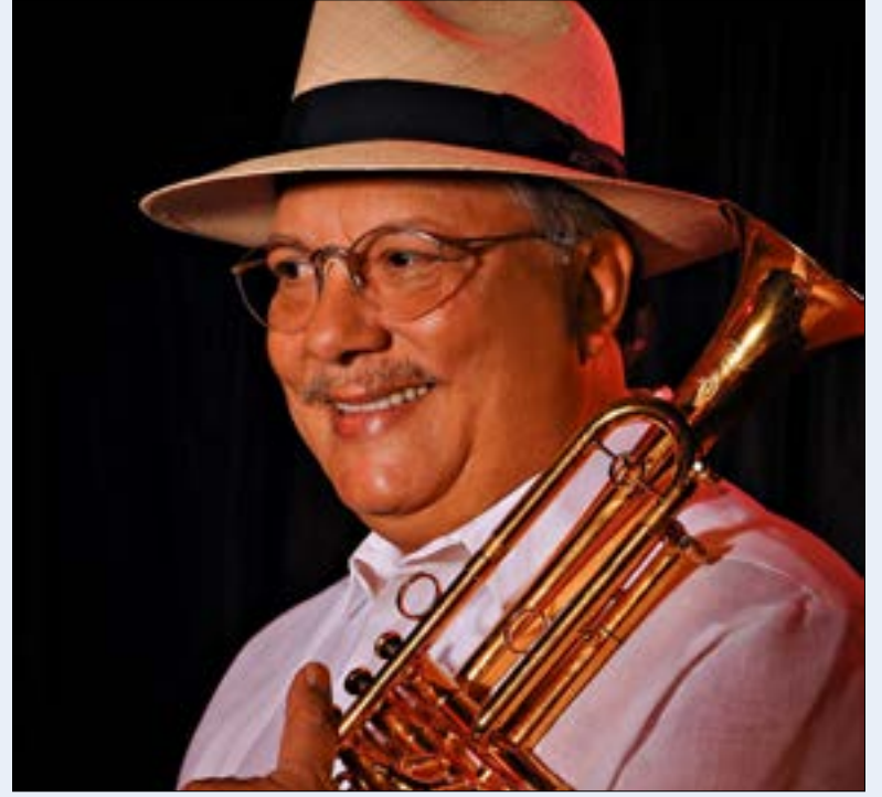
يقف ساندوفال من أبرز العازفين في مجال الجاز اللاتيني

* مهرجان بيت مسك الصيفي: 1 و 2 و 3 تموز (يوليو) - للحجز: 71/211121