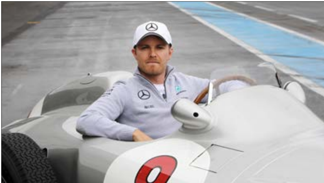
يتقدم روزبرغ في الترتيب العالمي بفارق 24 نقطة على هاميلتون

وعلى الاثنين في الوقت ذاته أن يحذرا، بحسب النمساوي توتو وولف المساهم الأكبر في فريق مرسيدس،