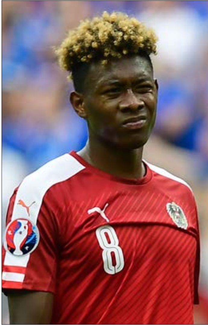
رفع ريال مدريد قيمة العرض لضم الألبا إلى 65 مليون يورو

لكن بارثوميو قال في مؤتمر صحفي لا يريد مغادرة برشلونة ونحن لا نريده أن يرحل، وأضاف: "في غضون الأيام القليلة المقبلة سنعلن تجديد عقده ليستمر معنا خمسة مواسم. اهتمام العديد من الأندية بنيمار أمر طبيعي، ولكن ينبغي للأعضاء الشعور بالإطمئنان لأن محامي النادي ونيمار سيعملون على تسوية بعض التفاصيل الصغيرة خلال الأيام المقبلة". إلى ذلك، أكد برشلونة أنه توصل إلى اتفاق مع ليون الفرنسي للتعاقد مع مدافعه الدولي صامويل أومتيتي مقابل 25