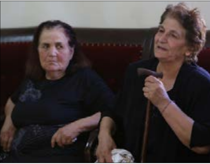
الانتحاريون تسللوا إلى المنزل المهجور في القاع من دون أسلحة و متفجرات

يسيطر القلق الأمني على المشهد العام، منذ الهجومين الإرهابيين اللذين ضربا بلدة القاع البقاعية. معلومات أمنية طغت على ما عداها من أحداث، وهو اجس ترخي بظلالها على حياة اللبنانيين. خيوط العملية بدأت تتكشف، مظهره معطيات لا تقلّ خطورة عما جرى إعلانه