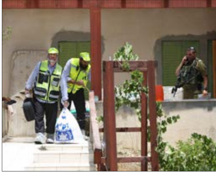
اعلنت شرطة الصدم مقتل مستوطنة هناثرة بجراح أصيبت بها

الأوسط، إن تقرير «الرباعية» (الأمم المتحدة والاتحاد الأوروبي وروسيا وأميركا) المتوقع صدوره قريباً (سيركز على التحديات الكبرى التي تحول دون تحقيق السلام بين الجانبين، بما في ذلك استمرار العنف والإرهاب والتحرير، ومواصلة سياسات الاستيطان التوسعية والأنشطة المرتبطة بها في الضفة الغربية والأوضاع في غزة وعدم سيطرة السلطة الفلسطينية على القطاع). وشدد على أنه يمكن عكس هذه الاتجاهات السلبية و«يجب عكسها بسرعة قصوى حتى يمكن أن نقوم بالنهوض بحل الدولتين»، مشيراً إلى أن «الهدف الرئيسي من التقرير لا يكمن في إلقاء اللوم على طرف أو آخر بل يسعى للنهوض بالهدف الذي ينشده الجميع وهو حل الدولتين». وجدّد المسؤول الأممي الدعوة إلى الأطراف بضرورة الانخراط في تنفيذ توصيات التقرير.