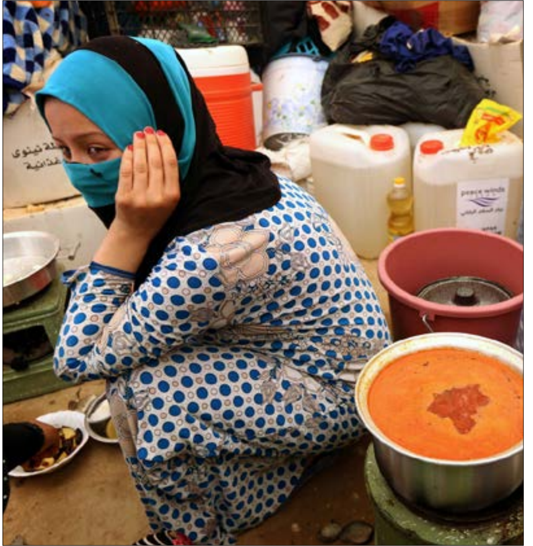
شكك سقوط الموصل صدمة أطلقت شياطين التقسيم