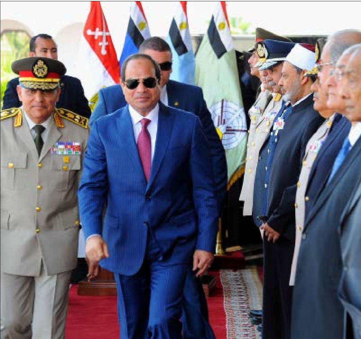
تساهم قوات الحرس الجمهوري وقطاعات أمنية أخرى في تعزيز حماية السيسي (أي بي إيه)

«الداخلية» تكشف عن إحباط مخطط لاستهداف مسؤولين ومواقع أثرية