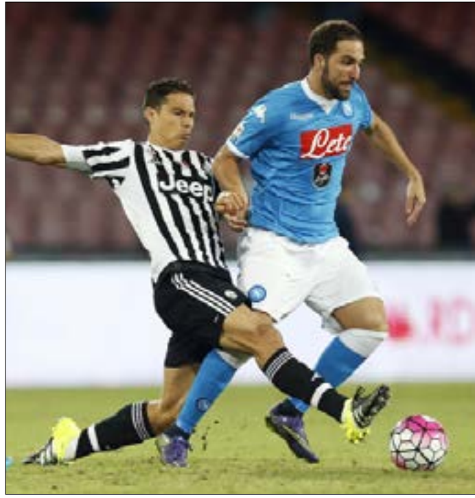
سيّد انتقالي هيوواين إلى «اليوفي» من منافسة نابولي على البطولة

إيطاليا، إلى اضعاف الدوري، إذ بعدما كان هناك مطاردة بسيطة من روما ونابولي على صدارة ترتيب «السييري أ»، يبدو أنها ستموت قريباً جداً. من روما خرج أحد أعمدتها إلى «اليوفي»: اليوسني ميراليم بيانيتش العقل المدبر لثغالب العاصمة، وخاصة في ظل قلة مشاركات