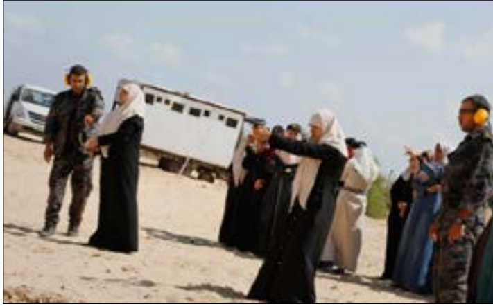
خلال دورة عسكرية للامن والحماية في غزة