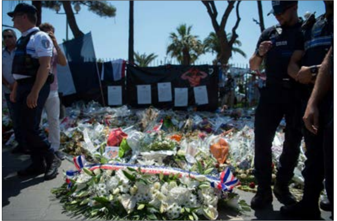
بدأت ملامح استئثار حالة الرعب من العمليات الإرهابية تظهر بوضوح في تصريحات غالبية الأحزاب المتنازعة على كرسي الرئاسة الفرنسية عام 2017.

تلك الانتقادات لم تمنع هولاند، صاحب أدنى نسبة تأييد شعبي في تاريخ فرنسا، والأقل حظاً وفق التوقعات في السباق الرئاسي، من المدافعة عن عمل حكومة فالس في مواجهة التهديد الإرهابي. وصرح هولاند بأن التهديد الإرهابي سيبقى، وأن على فرنسا أن تدافع عن نفسها، رافضاً في الوقت نفسه أي إجراء مخالف للدستور والقواعد الأساسية للقانون. ورأى أن الإرهابيين يريدون اختبار فرنسا في هذا المجال.