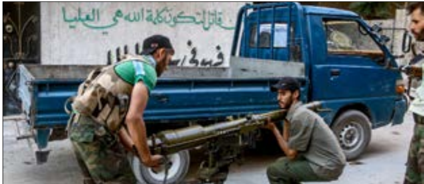
صدّ الجيش هجوماً لـ«داعش» في ريف حماة الشرقي

وفي العاصمة دمشق، ارتفعت إلى 9 شهداء و24 جريحاً حصيلة اعتداء المسلحين بالقذائف الصاروخية على أحياء باب توما، وحي المالك،