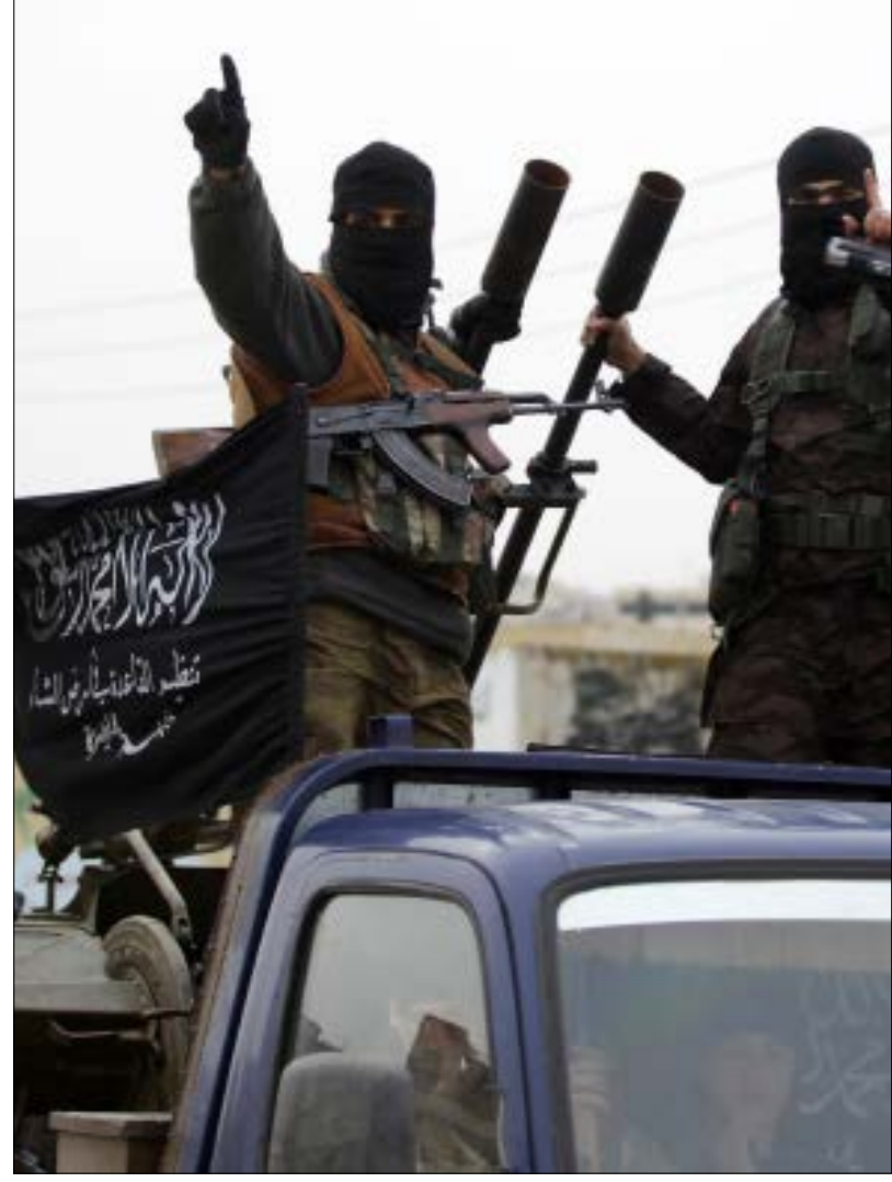
تيارات داخل «النصرة»: الأول مؤيد للارتباط بـالقاعدة، والثاني مع «سورنة» التنظيم

من جهتها، رفضت المندوبة الأميركية، سامانثا باور، اتهامات نظيرها الروسي، مطالبة بلاده بوقف «اعتداءاتها» في سوريا. وقالت في إفادتها إن «واشنطن تبذل قصارى جهودها لتقليص أعداد الضحايا من المدنيين الذين قد يسقطون في الغارات الجوية... وإذا ما تبين لنا أن هناك ضحايا من المدنيين نتيجة تلك الغارات، فنحن نقوم باتخاذ إجراءات حازمة». وفي سياق متصل، انتقد تشوركين قيام الأمم المتحدة «بالتشديد فقط على إيصال المساعدات الإنسانية إلى المناطق الخاضعة لحصار قوات النظام السوري، التي تقوم بمكافحة الإرهاب»، مضيفاً أن «المدن المحاصرة من قبل المجموعات الإرهابية لا نسلم عنها». وفي هذا الصدد، اقترح إسقاط المساعدات الإنسانية في المدن المحاصرة