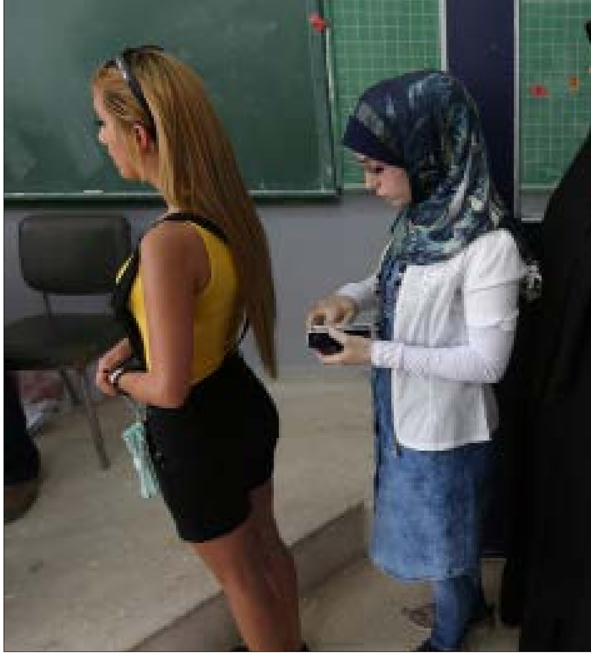
شاركت نحو 13 فتاة من بلدة الخيام الجنوبية في «ماراتون حرمون»