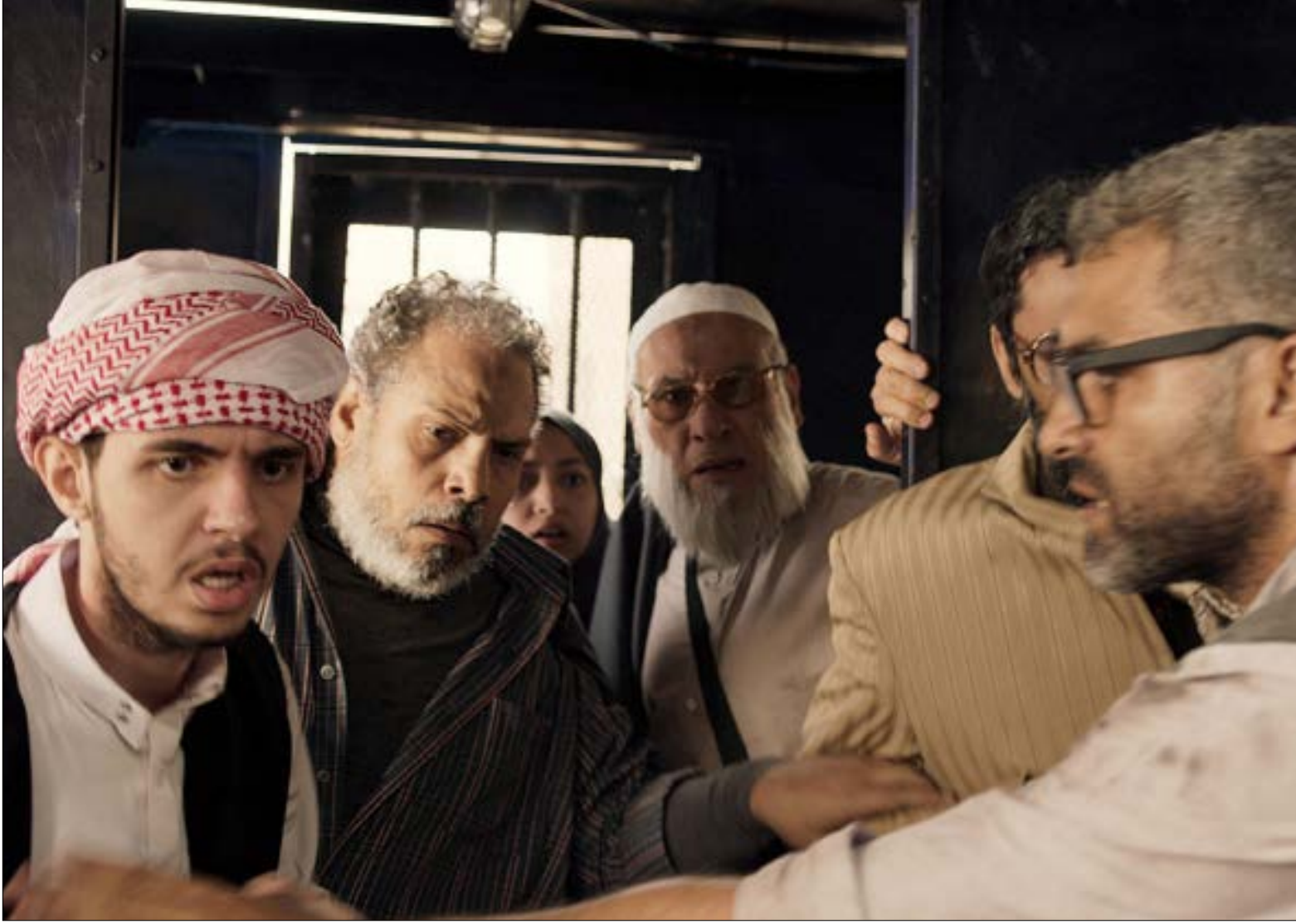
مشهد من الفيلم

لم ينته الجدل الذي أثاره فيلم المخرج المصري الذي يدور في حزيران (يونيو) 2013 حيث عربية ترحيلات تابعة للشرطة تحمل متظاهرين من المؤيدين للاخوان والمعارضين لهم. يروج الشريط للصورة النمطية عن الجماهير العربية الغوغائية. صورة يتبناها النظام أيضاً!