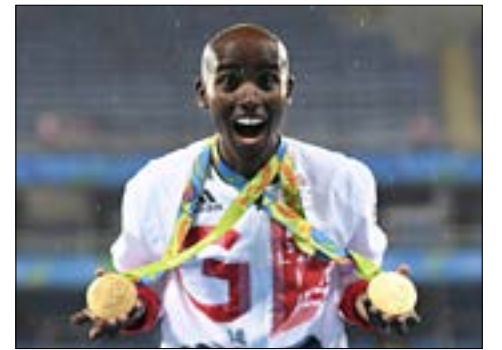
حقق البريطاني محمد فرح ذهبية 5 آلاف م