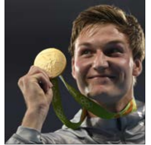
ناك توماس روهلر ذهبية مسابقة رمي الرمح