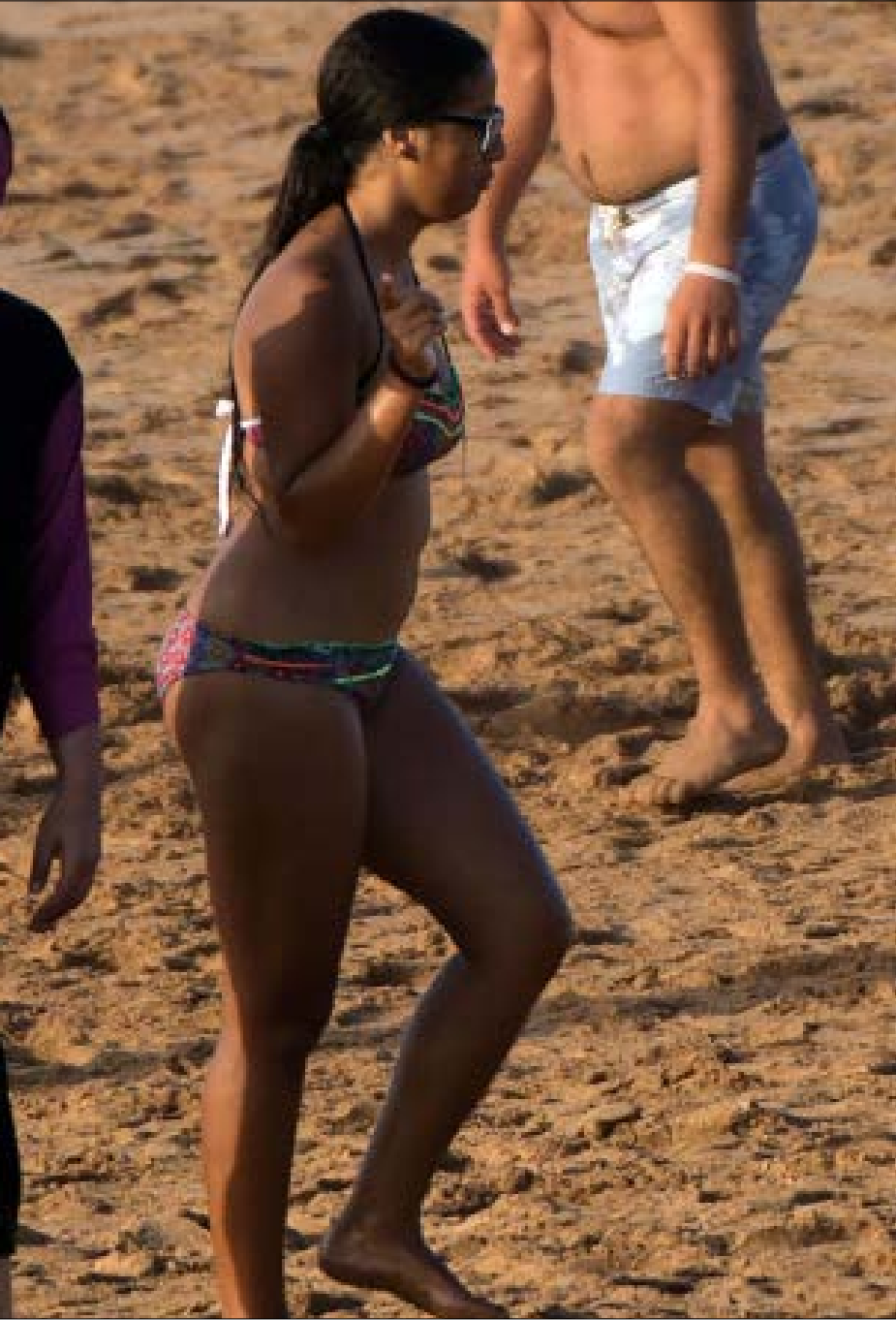
نقاش «البوركنيني» يُعدّ استكمالاً لنقاشات سابقة أُثيرت على خلفية قرار حظر ارتداء النقاب

ذلك لم يكن في مصلحة المدافعين عن حقوق الأقليات، ولكنه سمح من جهة أخرى للييسار الذي يخوض المعركة باسم المهاجرين بتحسين شروط الصراع، عبر منع اليمين من تحويله إلى صراع هويات. ساعده في ذلك السياق السياسي الذي لم يكن قد شهد بعد هذا القدر من الحضور للتنظيمات الفاشية والتي يصبّ خطابها في النهاية لمصلحة اليمين باجنحته المختلفة. أمكن على ضوء ذلك فكّ الاستقطاب قليلاً، عبر نقله من الحيز الاجتماعي الذي يخدم أجندة اليمين إلى داخل المؤسسات المنتخبة التي تكون فيها فرص الدفاع عن «القضايا العادلة» متساوية كونها تمثل المجتمع على نحو مقبول وتتيح للمجموعات الخاضعة للتمييز فيه فرصة مناسبة للدفاع عن نفسها. هذا الحضور على المستوى السياسي المباشر ضاعف من