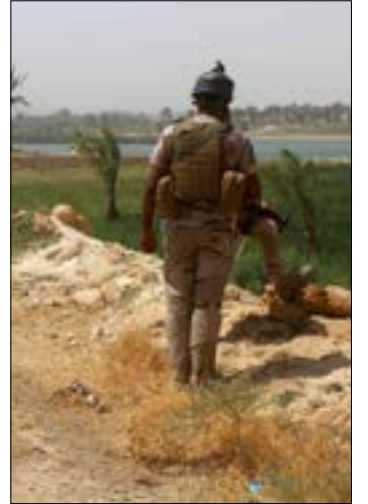
يستكمل «الحشد الشعبي» والجيش والشرطة اليوم تحرير الخالدية