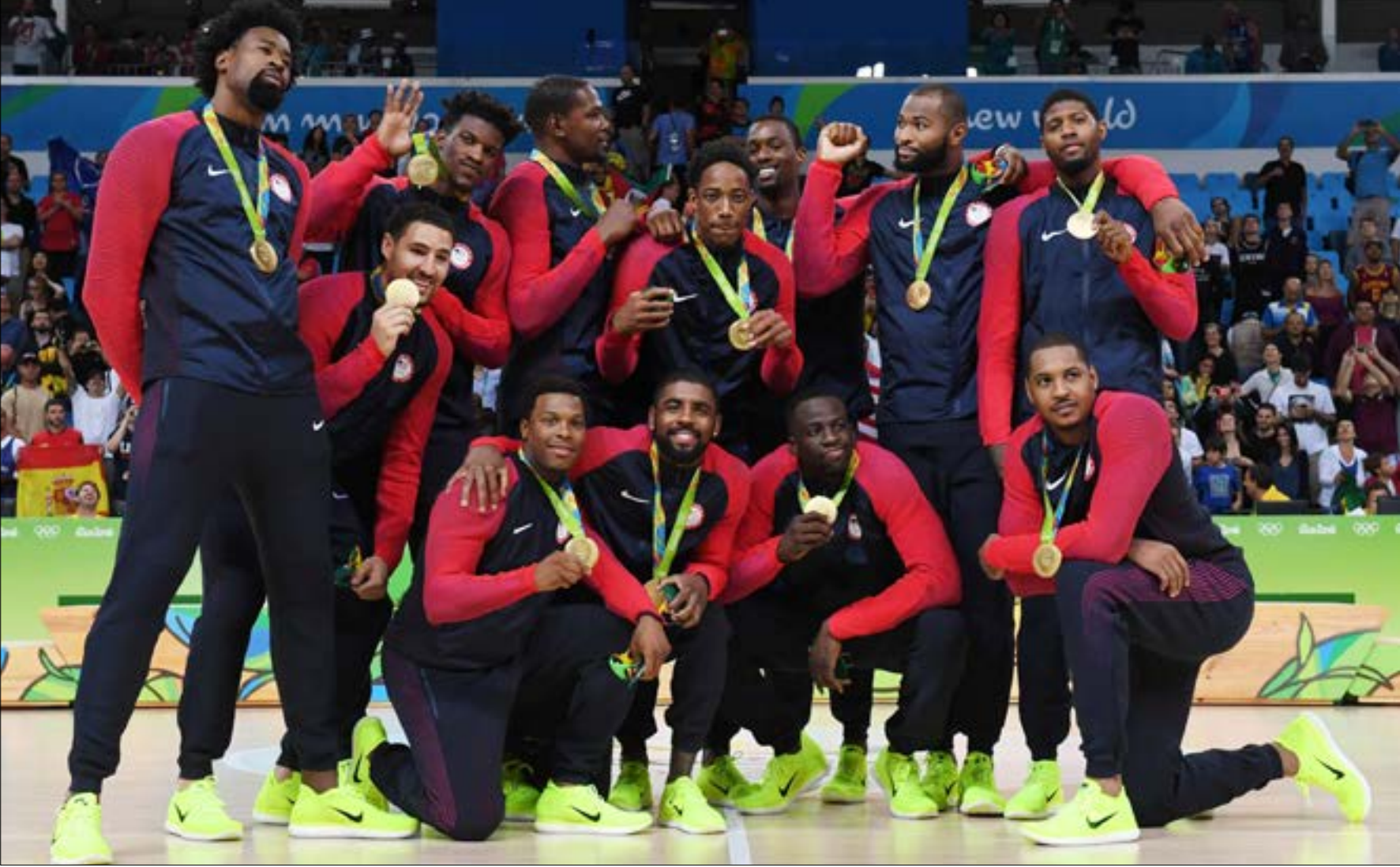
أحرز المنتخب الأميركي ذهبية كرة السلة بالفوز على صربيا (أضرب)

أن يتعرض للإصابة. وعادت البرونزية للترينيدادي كيشورن والكوت الذي سجل 85.38 م في محاولته الثانية. وكان الجامايكي أوساين بولت قد أضاف السبت ذهبية سباق التتابع 4 مرات 100 م إلى ذهبتي 100 و 200 م. وشارك بولت مع منتخب جامايكا الفائز بالسباق بزمن 37.27 ثانية على حساب اليابان (37.60 ث) والولايات المتحدة (37.62 ث).