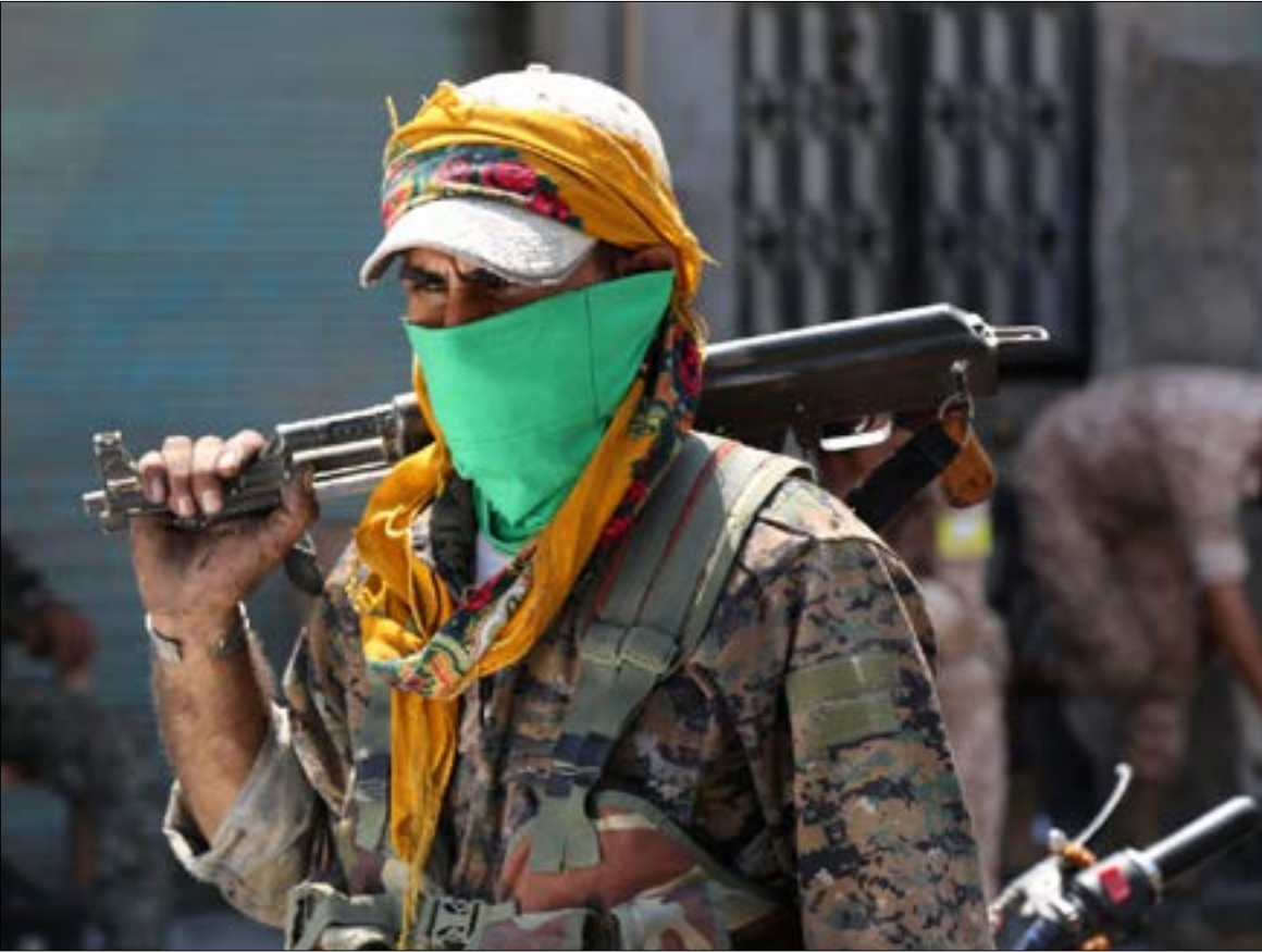
لن يقبل الأكراد أن يكون التقارب الإقليمي على حسابهم

رغم التوقعات بعودة الهدوء إلى مدينة الحسكة برعاية روسية، يظهر أن مرحلة عَصّ الأصابع في كل الشمال السوري فُتحت أبوابها. فالأكراد الذين ينتظرون جني ثمار معركة منبج بالتمدد نحو جرابلس، فوجئوا باستفافة تركية قد تسبقهم إليها. فيما كانت الدولة السورية على موعد عنيف من الردّ على مطالبهم «الاستقلالية» في الحسكة... ليشعروا بأنهم أمام «طبخة» إقليمية على حسابهم بدأت ملامحها بالظهور بتلقيهم ضربة قوية لمشروعهم الفيدرالي في الشمال السوري