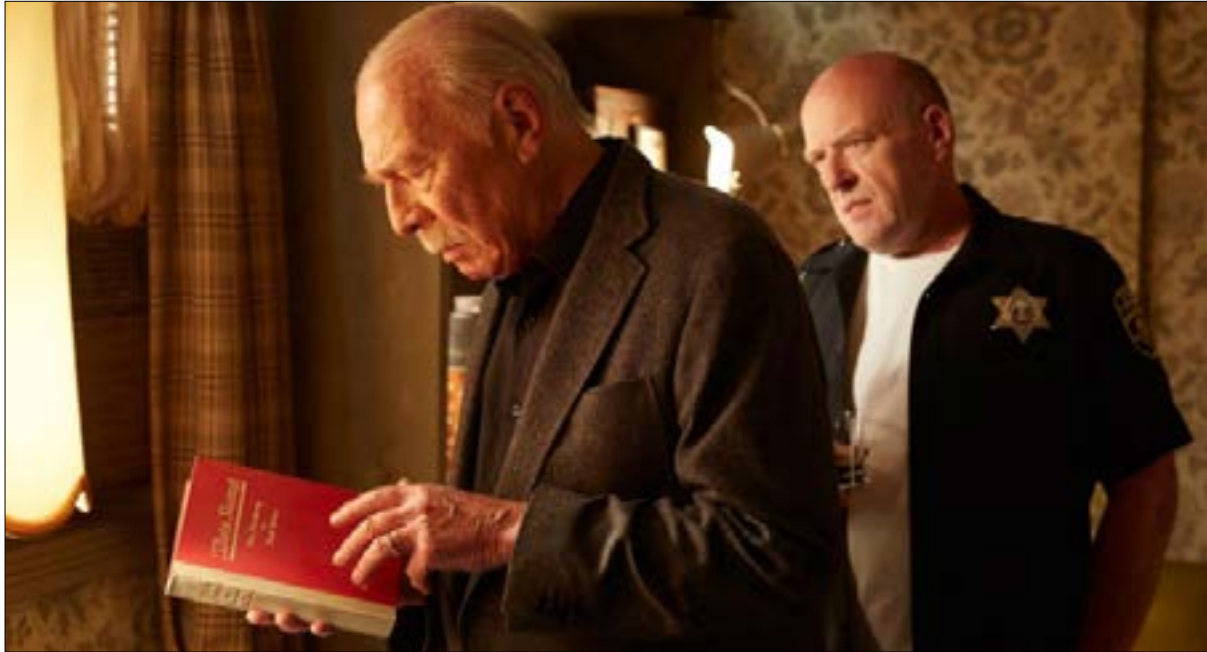
كريستوف بلامر في مشهد من «تذكر»

فيلمه الجديد «تذكر» الذي يعرض حالياً في الصالات اللبنانية، لا ينتمي إلى الكوميديا، لكنه ساخر في نمط التشويق نفسه الذي يتبناه، ومن الدراما والكوميديا ولا معقولة الحياة نفسها التي قد تتجاوز فيها كل هذه الأنماط جنباً إلى جنب وفي اللحظة ذاتها. عبر حساسية التفاصيل التي يرصدها، يلمس الشريط درجة موحجة من الانفعال لدى المشاهد، وأيضاً محيرة إلى درجة يراوح شعوره بين الرغبة في الضحك والبكاء في أن معاً البطل «زف» الذي يلعب دوره الممثل الثماني كريستوف بلامر، يعرّف في دار المسنين في نيويورك إلى «ماكس» الناجي مثله من معسكر أوشفيتز حيث تمت عمليات تعذيب وإبادة اليهود في ألمانيا النازية تحت حكم هتلر. يخبره «ماكس» (الممثل مارتن لوندو) أن قاتل عائلتهما المشترك أوتو فاليش، أحد القادة النازيين