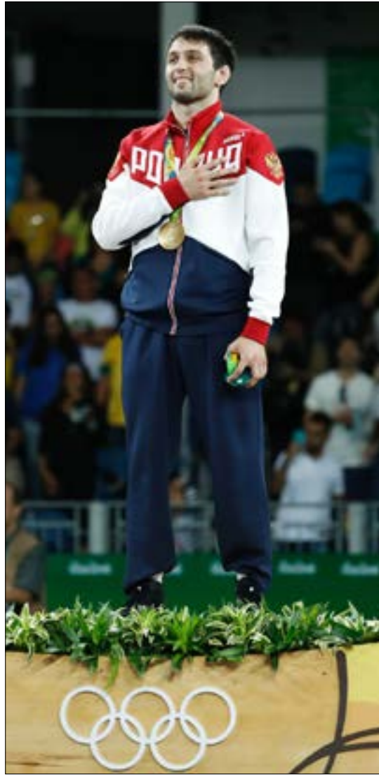
احرز الروسي سوسلان رامونوف ذهبية المصارعة الحرة