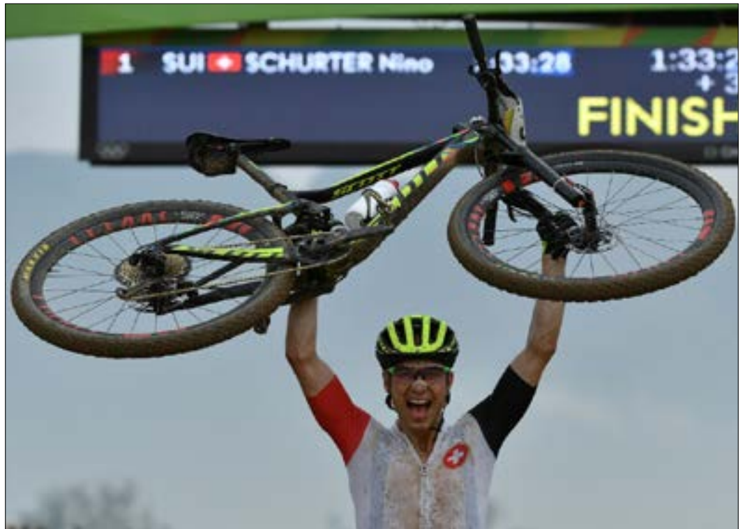
نينو شورتر يحتفل بعد الفوز بذهبية الطرقات الجبلية