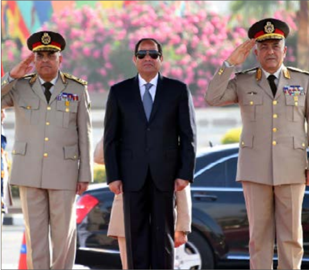
منذ تسلمه السلطة، لم يخف خطاب واحد للسياسي من ثنائية «الخوف والحماية»