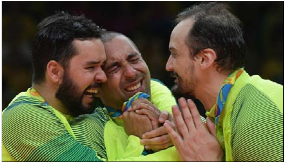
حازت البرازيل على ذهبية الكرة الطائرة بالفوز على إيطاليا 3-0