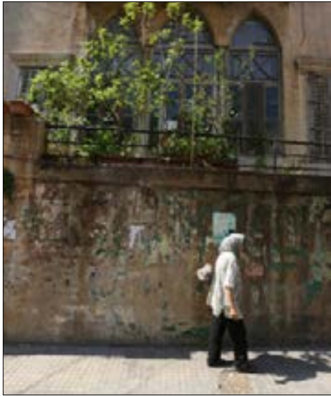
يعيش أهل الخندق في مجتمع لا يريد لهم لأنهم لا يشبهون الوسط

غالباً ما يُنظر إلى الخندق الغميق وأحياء ذوي الدخل المحدود بطريقتين: إمّا عبر شيطنتها والمطالبة بإزالتها بوصفها "سرطاناً" في وجه المدينة الحلوة، أو بمبادرة حسن نية يحاول الناس عبرها تبرير وجوده فيحوّلونه إلى مادة "إكزوتيكية". فإن عكس فكرة إقصاء الفقراء وتصوير مناطق عيشتهم كأحياء موبوءة، لا يكون بالاعتذار عمّا هم عليه ولا يكون بتبرنتهم من اتهامات بالجريمة والخروج عن القانون. من المضحك سماع أشخاص يتهمون أبناء الخندق أو غيره بالتحشيش أو "الحبحة". ومن المضحك أكثر أن نرى أشخاصاً يحاربون وجود الأحياء الفقيرة بحجة أنها معقل المهربين والمتاجرين والمتعاطين. من المعروف (نعتقد) بأن المخدرات موجودة في كل مكان، لا حاجز طبقياً لمكان ترويجها أو لمروجيها ومتعاطيها كأشخاص. وليست البضع فضائح التي كشفت في السنين الماضية في مدارس أبناء الوزراء والأغنياء سوى مثال على ذلك. ومن هنا، لا تبدو لنا الطريقة المناسبة لنصرة أهل الأحياء الفقيرة بنفي أية "آفة" تُتهم بها، بل بتأطير أي اتهام بأنه اتهام يريد صبغ المنطقة بستيغما أخلاقية، بينما هي في الحقيقة تفرقة على قاعدة طبقية.