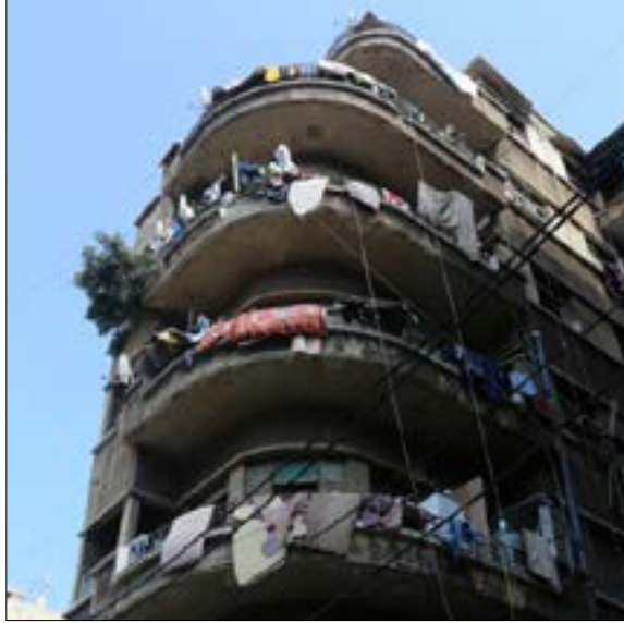
ينظر إلى الخندق الغميق بوصفه «سرطاناً» في وجه المدينة الحلوة

الأراضي، السماسرة لا يريدون الكلام، وأهل المنطقة يقولون "منيمين الأراضي"، مشددين على أن هناك عمليات بيع وشراء كثيرة تحصل، والإشاعات أكثر. حتى أن أحد الشباب تكلم عن تاجير أكثر من 5 قطع أراضٍ من وقف الكنيسة في المنطقة، لمدة 99 سنة، لأحد أهم زعماء الطائفة الشيعية. تسالته كيف يتم ذلك فيقول وهو يضحك "شو إشيك؟ إنت جديدة هون؟ ما مقسمينها بيناتن. عم يعملوا فينا مثل ما عملوا بأهل بيروت بالبلد. هيديك السوليدير تبعن، وهاي السوليدير تبعنا".