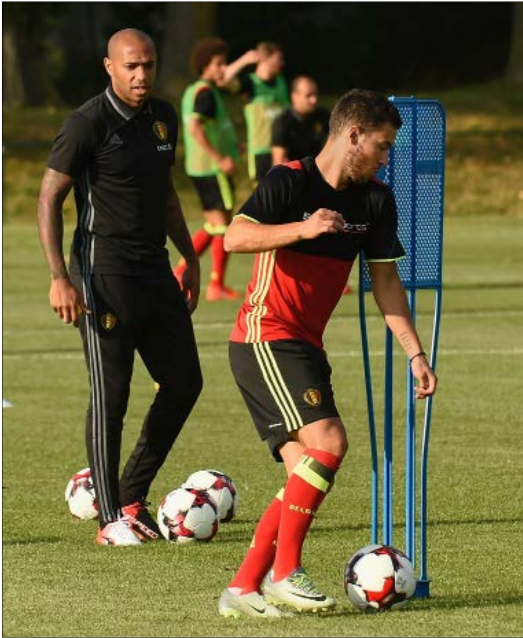
هنري في أولى الحصص التدريبية إلى جانب هازار

يتطلع لبدء تجربة جديدة في مسيرته في عالم التدريب والسير على خطى أبناء جيله في بلاده: لوران بلان وديدييه ديشان وزين الدين زيدان الذين سبقوه إلى هذا المجال وهو حصل بالفعل قبل فترة على شهادة في التدريب. لذا فإن «تيتي» لا يريد أن يحرق المراحل وأن يسير خطوة خطوة للوصول إلى مقعد فريق كبير أو منتخب بلاده ربما إذ إن فرصة العمل كمساعد لمدرّب بلجيكا لا تأتي كل يوم ومن شأنها أن تضيف إلى سيرته الذاتية التدريبية الكثير حيث إن المشروع البلجيكي واعد. تجربة هنري مع بلجيكا لا شك تستدعي الإهتمام والمتابعة، وأولى الأضواء عليها ستكون في المباراة الودية بين بلجيكا وإسبانيا غداً، حيث إن جلوس الفرنسي على مقعد تدريب بلجيكا لن يكون بالحدث العادي.