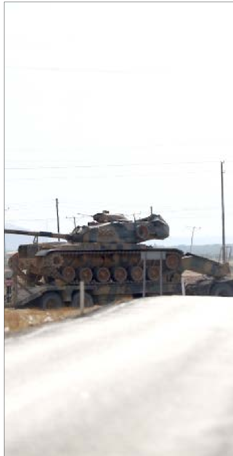
ترسك تركيا مزيداً من التمزقات العسكرية إلى حدودها مع سوريا

وردت على لسان عضو في «مجلس سوريا الديمقراطية» قبل يومين (الأخبار، العدد 2971). وجريا على عادة معظم المسؤولين السوريين، يختتم المصدر حديثه بعبارة توحى بالثقة بـ «امتلاك الخيوط». ومن دون الإفراط في التفاؤل، يمكن التأكيد، وفقاً للمعلومات المتوفرة، أن انعدام الثقة لم يوقف مساعي معظم الأطراف لـ «تدوير الزوايا»، وهي مساعي حملت مسؤولين سوريين اثنين (أحدهما أممي والآخر عسكري) خارج الحدود، في زيارات خاطفة بتواتر متزايد خلال الشهر الجاري. كذلك وضعت تلك المساعي ملف حلب على طاولة مشاورات «حامية» بين خبراء عسكريين أوفدتهم موسكو وواشنطن إلى جنيف. وتحافظ «عاصمة الشمال» على مركزيتها في كل الخطوط التفاوضية المفتوحة، مع اقتناع الأطراف بأن المدينة هي الأصل لأخذ الصراع إلى منعطف جديد. وينبغي التذكير بأن أي «صفقة» قد يتوافق الأطراف عليها سيكون من شأنها نقل الحرب إلى مرحلة جديدة فحسب، لا إنهاؤها. وحتى الآن، فإن «حدود التوافق الممكن» في الميدان الحلبي لا تتجاوز إمكانية العمل على «عزل جبهة فتح الشام / النصرة» ونظرائها المتطرفين (وعلى رأسهم «الحزب الإسلامي التركستاني») عن فصائل «المعارضة السورية المفحوصة (vso)». (الأخبار، العدد 2876). وسيكون من شأن إبرام صفقة مماثلة إبعاد «النصرة» وأخواتها غرباً نحو إدلب، التي باتت مسلماً أنها امتلكت كل المقومات الكفيلة بتحويلها ساحة لـ «تصفية الصراع».