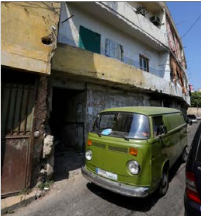
ترك المباني الترابية لتتاهر ولا ترهم