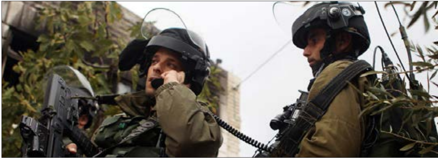
إمكانات حزب الله باتت هاجسا يورق المؤسسة الامنية الاسرائيلية (ارشيف)