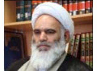
معهد المعارف الحكيمة النفس بين الفلسفة والعرفان