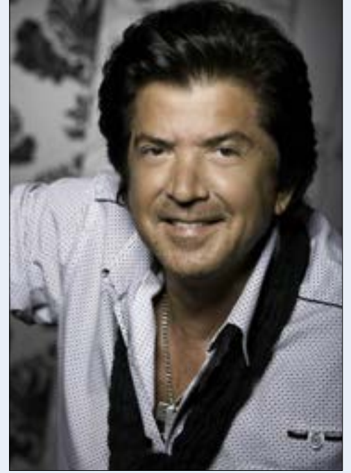
محمد خالد ملص

يذكر أن الدورة الأولى من المهرجان لم تثر كل هذا اللغط. يومها، ضرب رئيس البلدية السابق مصطفى عقل عرض الحائط بكل الأقاويل والسجلات، وأدار لها الأذن الصماء، لينجح في النهاية في إقامة المهرجان. وهذه السنة، سبق المهرجان هجوم عنيف وخصوصاً عندما أعلن عدد من المشايخ السلفيين في بيان «حرمة الأغاني والرقص حسب الشرع»، داعين الناس إلى عدم الحضور في حال عدم استجابة اتحاد بلديات المنطقة. وتحلّل افتتاح «مهرجانات المنية» مجموعة كبيرة من الفقرات الفنية والمسرحية، لتختتم اليوم الأربعاء بسهرة يحييها الفنان اللبناني وليد توفيق (الصورة).