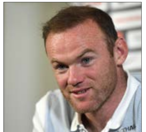
روني خلال المؤتمر الصحافي

كشف نجم المنتخب الإنكليزي، واين روني، النقاب عن موعد اعتزاله الدولي، حيث سيكون بعد انتهاء كأس العالم 2018 المقررة في روسيا. ويتطلع نجم مانشستر يونايتد (30 عاماً) لإنهاء مسيرته الدولية بأبهى صورة، مؤكداً سعيه إلى تحقيق النجاح مع المنتخب في العرس العالمي. وذكر روني في مؤتمر صحافي في منشأة «سانت جورج» ببارك التدريبية الكامنة في برتون وسط إنكلترا إزاء اعتزاله اللعب دولياً: «أعلم أن مونديال روسيا سيشكل آخر محطاتي. سأعمل جاهداً للاستمتاع في السنيتين القادمتين