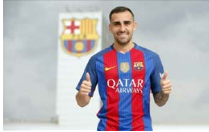
الكاسير بقميص «البرسا»

لضم مهاجمه لوكاس بيرين. ولم يتطرق النادي اللندني إلى مدة العقد ولا قيمة الصفقة التي قدرتها وسائل الإعلام البريطانية بـ 20 مليون يورو.