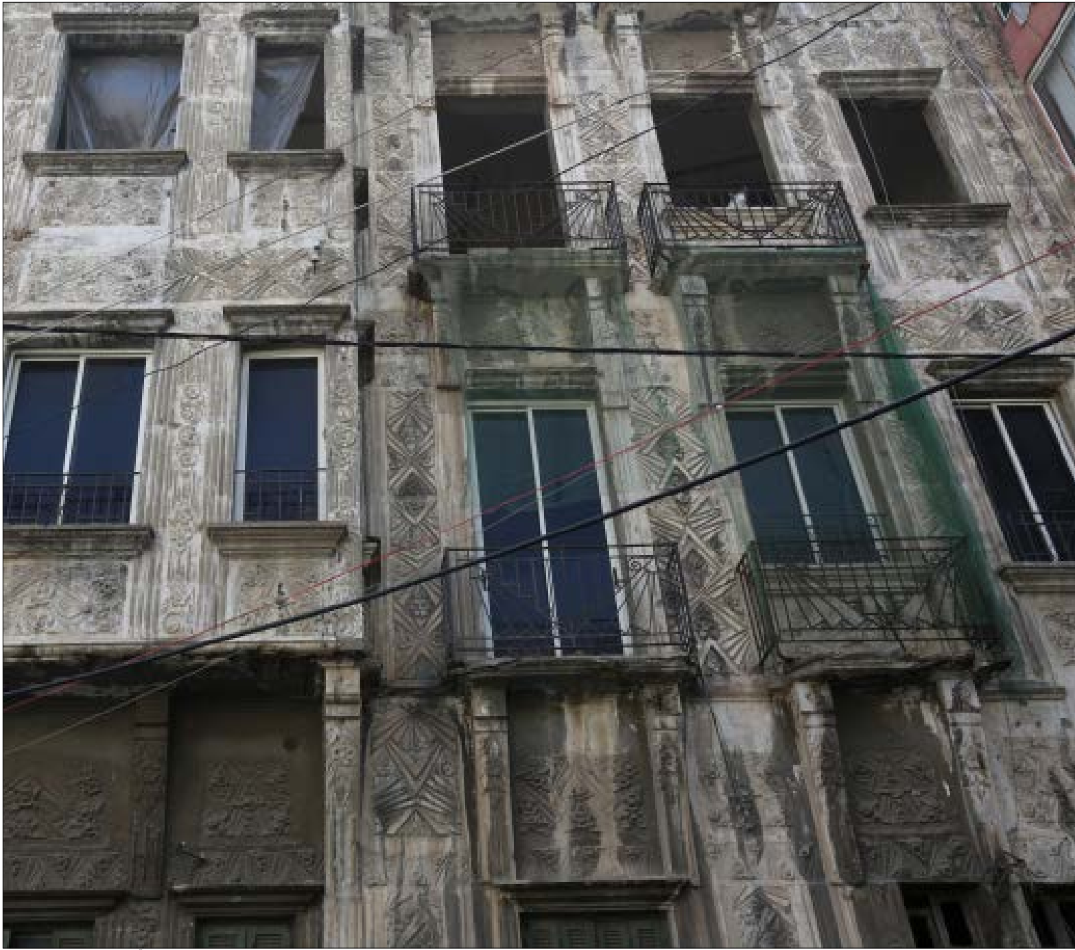
مبانٍ من عهد ذهبي مضى يحتلها أبناء القرى الحدودية