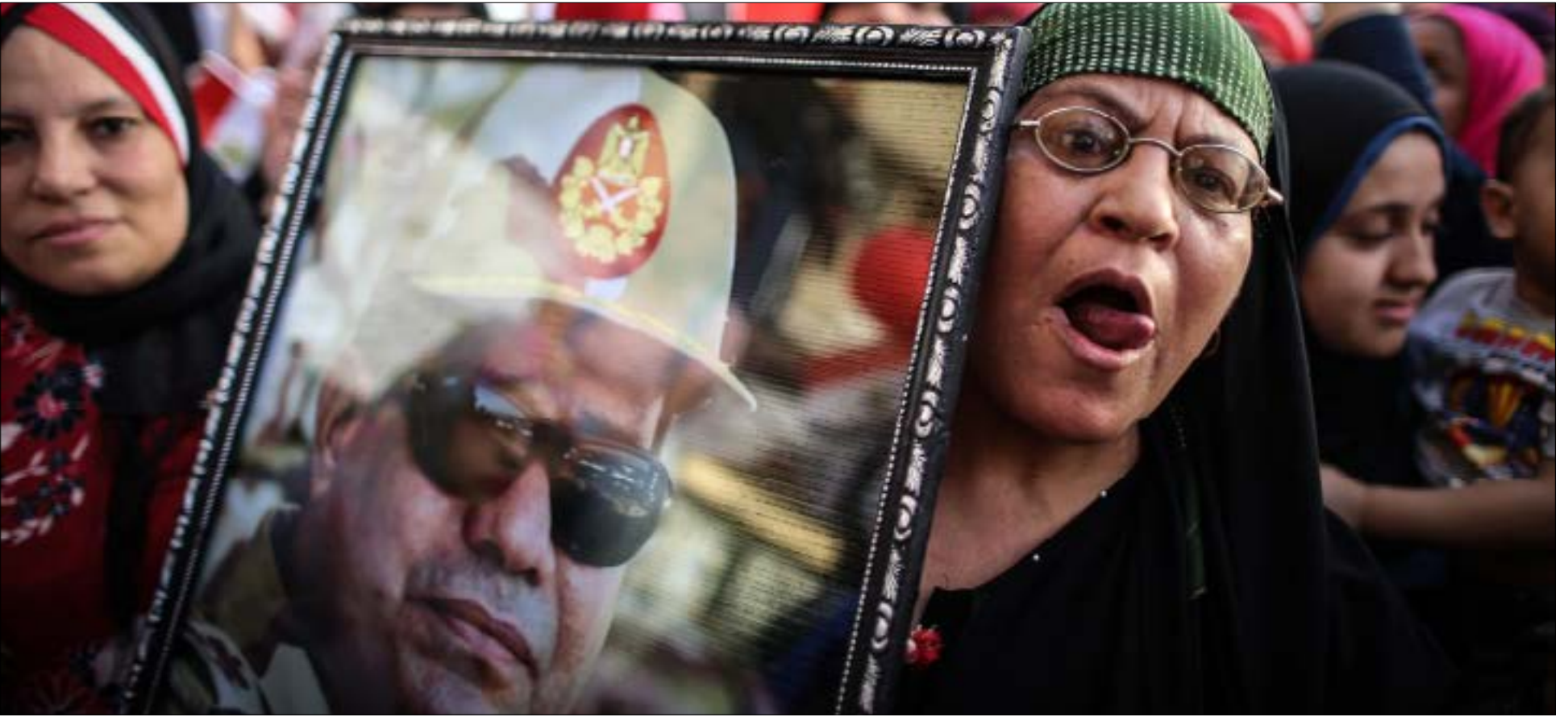
من «دروس يناير»، انّ الضبط لم يوجه باتجاه الدولة العميقة