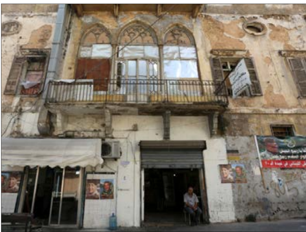
كيف لفقراء ان يعيشوا في مكان بهذا الجمال؟