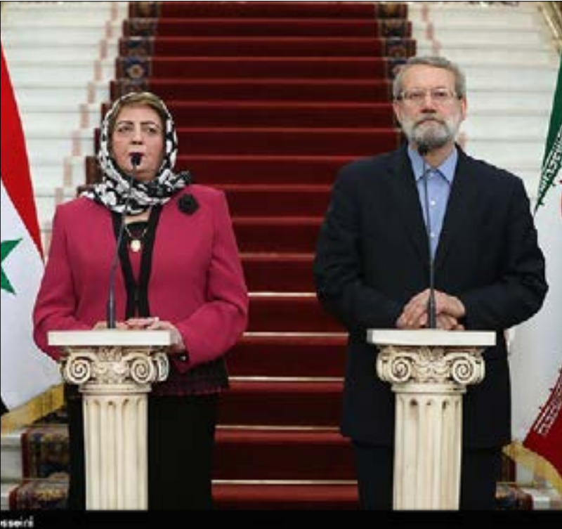
لاريجاني خلال استقباله هدية عباس: «حك الأزمّة يكمن في الخيار السياسي»

الخارجية الروسية ماريا زاخاروفا، عدم وجود جدوى من عقد اجتماع جديد في مجلس الأمن، مشيرة إلى أنها قد تتحول إلى «استعراض روسيا. ليعود نائب وزير الخارجية الروسي ميخائيل بوغدانوف، ويقول إن مسؤولين أميركيين يعولون من خلال حديثهم عن وجود خطة بديلة (ب) حول سوريا، على حل عسكري يلي انتخابات البيت الأبيض. وشدد أثناء اجتماع اللجنة الشؤون الدولية في المجلس الفيدرالي الروسي، على رفض بلاده مواصلة الحرب، كبديل من الاتفاقات المبرمة مع الجانب الأميركي، مضيفاً أنه «لا يزال هناك أمل في تطبيق الاتفاق».