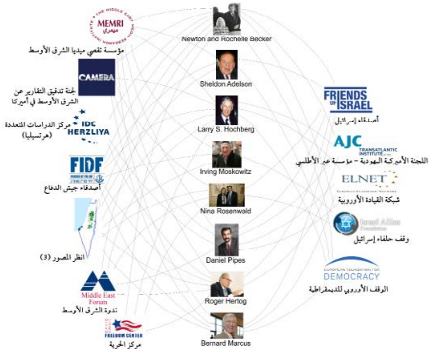
(2) الشخصيات الأميركية الأساس الداعمة للوبي إسرائيل ومنظماتها في أوروبا

Jewish Committee - AJC «مبادرة حلفاء إسرائيل» / Friends of Israel Initiative - «إسرائيل» / FII «المؤسسة الأوروبية للديمقراطية» / European Foundation for Democracy - EFD، وغيرها في ذلك.