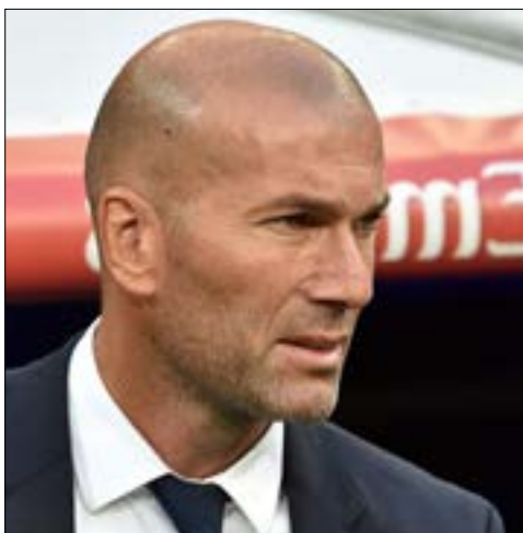
قال زيدان إن رونالدو يجب أن يرتاح أحياناً

زيدان، إذ في استطلاع للرأي قامت به صحيفة "أس" المدريدية فإن 84% من مشجعي الفريق دعموا قرار المدرب الفرنسي بإخراج النجم البرتغالي في المقابل، فإن نجم الفريق الغريم أتلتيكو مدريد، الفرنسي أنطوان غريزمان، علق أيضاً على الحادثة وأعلن دعمه لرونالدو، حيث قال لبرنامج "إل ترانزيسيتور" على إذاعة "أوندا سيرو": "أحياناً، يجب أيضاً تفهّم اللاعب".