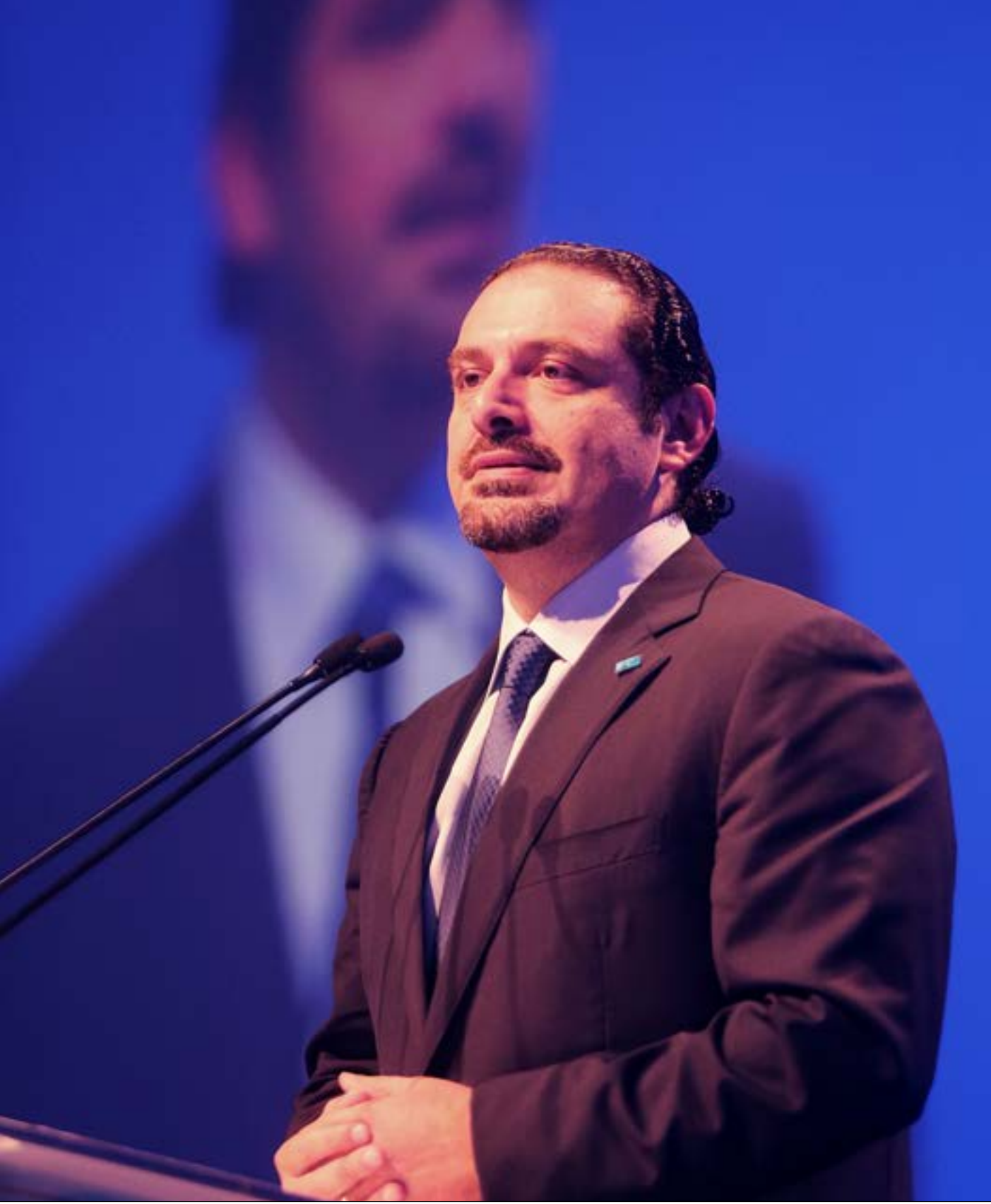
الحريري يطلق مسارا ربما ينتهي بانتخاب عون (هيثم الموسوي)

تكاد الاتصالات السياسية توحى بأن انتخاب رئيس جديد للجمهورية، سيكون في غضون أيام قليلة. وهذه المرة، التفاوض ليس من باب الأمنيات وحسب. فعلى ما رشح ليل أمس، قرر الرئيس سعد الحريري فتح الباب الذي يؤدي إلى انتخاب العماد ميشال عون رئيساً للجمهورية. مقربون منه يقولون إنه أطلق مساراً يمكن أن يؤدي إلى وصول عون إلى قصر بعبداً. لكن حتى اليوم، تواجهه عقبات كثيرة، أبرزها مواقف كل من الرئيس نبيه بري والنايب سليمان فرنجية، و«صقور» كتلة المستقبل. وبيري هو أشد المعترضين على انتخاب عون رئيساً، وعبر عن ذلك لحزب الله والمستقبل معاً. وهو يرى في وصول عون خطراً على «التركيبة» السياسية الحاكمة، ويخشى من تضاعف قوة الجنرال ونفوذه و«حصته» في حال وصوله إلى الرئاسة. وترى مصادر مطلعة