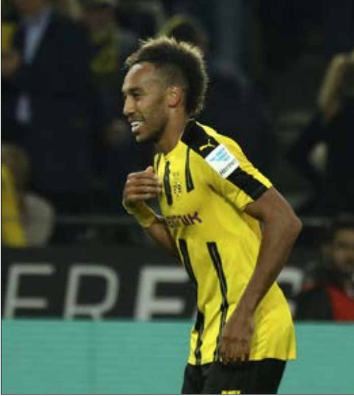
تجدد حكاية الأثر من جديد حيث يتواجه الريال مع دورتموند مرة أخرى

تطلق منافسة جديدة بين الألمان والإسبان في دوري أبطال أوروبا لإثبات علو كعب أحدهما على الآخر. أولى المواجهات الكبرى بين بوروسيا دورتموند وريال مدريد، تليها أخرى بين بايرن ميونيخ وأتلتيكو مدريد