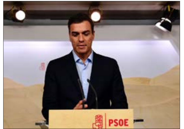
تعرض سانشيز لانتقادات قاسية من أعضاء أساسيين في حزبه بعد نتائج امس

ربما تساعد النتائج الجيدة التي حققها التيار المحافظ في الانتخابات المحلية الإسبانية في غاليسيا والباسك، رئيس حكومة تصريف الأعمال في تعزيز موقعه السياسي. لكن من غير المرجح أن تلغي الطريق المسدود الذي وصلت إليه البلاد في تأليف حكومة جديدة