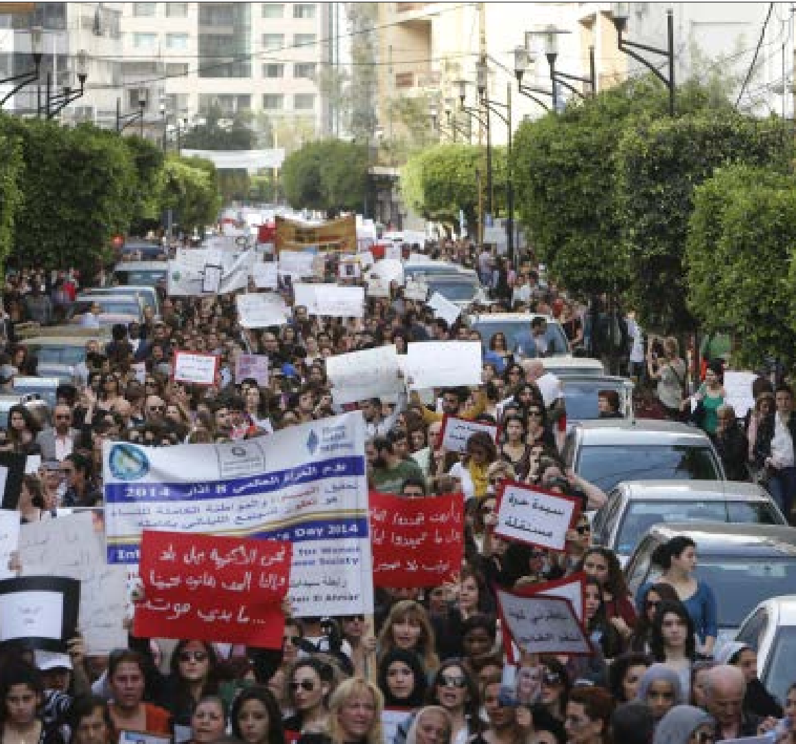
بإمكان المتطلبات المهنية المساهمة تحريك منظمة شعبية التوجه ومناقشة إلى مجرد منظمة مختصة في تزويد الخدمات