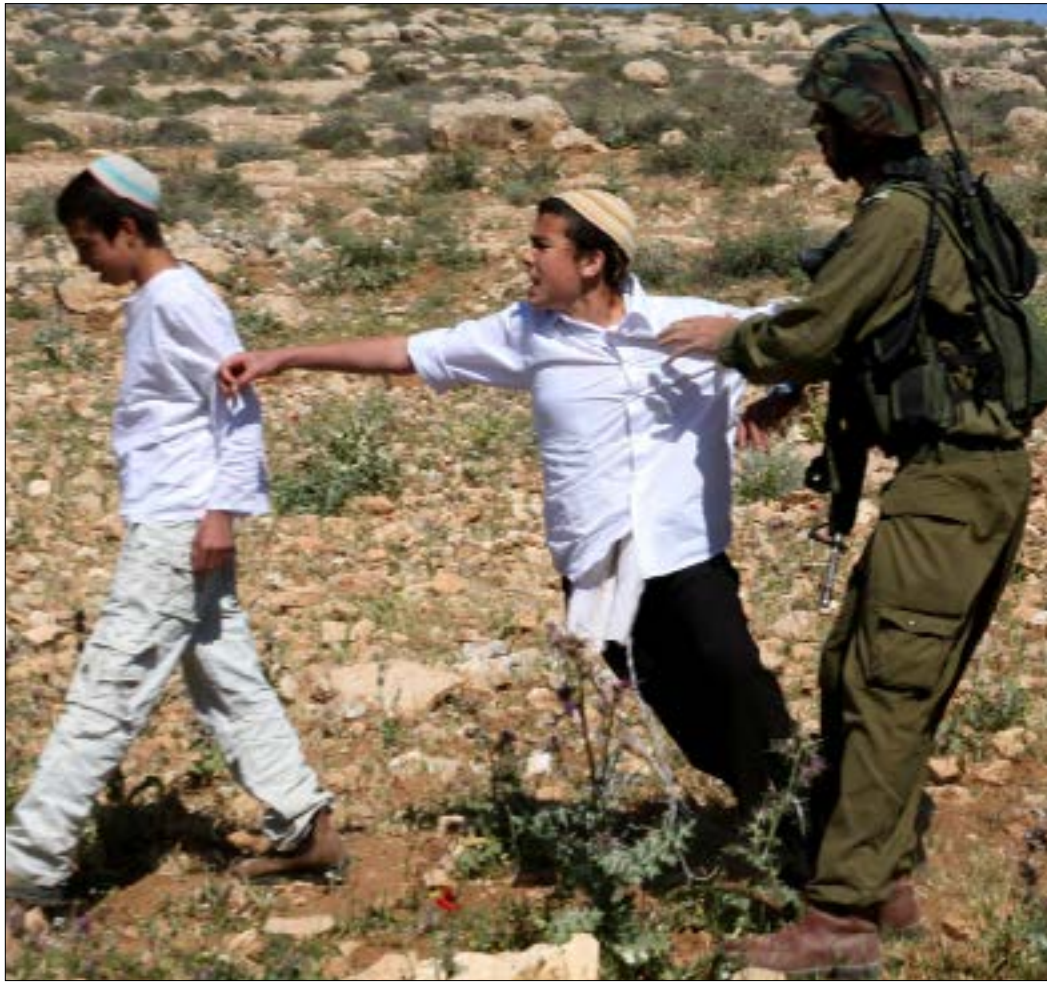
ما يحدث ينبغي أن الجيش استظام إعادة قبولية المجتمع الإسرائيلي

هذه الخطوة تسلط مرة جديدة الضوء على قضية دور الجيش في المجتمع الإسرائيلي، وتكشف عن حقيقة فشل مشروع «بوتقة الصهر» الذي راهن عليه «الأباء المؤسسون