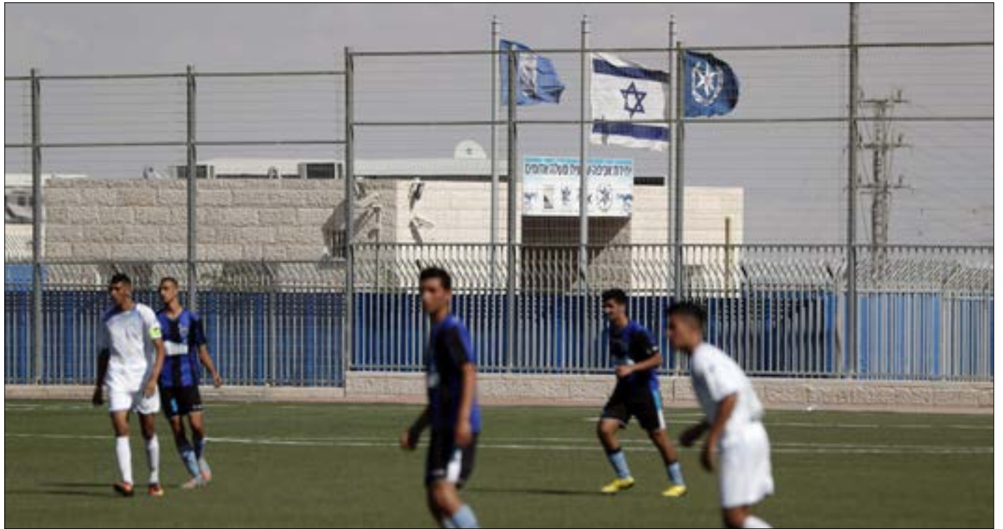
انهم «الفيفا»، برعاية مباريات لنادية إسرائيلية على اراض فلسطينية مسروقة

وقالت المنظمة المدافعة عن حقوق الإنسان، التي تتخذ من نيويورك مقراً لها، في تقرير إن سنة أندية في الدوري الإسرائيلي تلعب في مستوطنات في الضفة الغربية المحتلة غير الشرعية بموجب القانون الدولي.