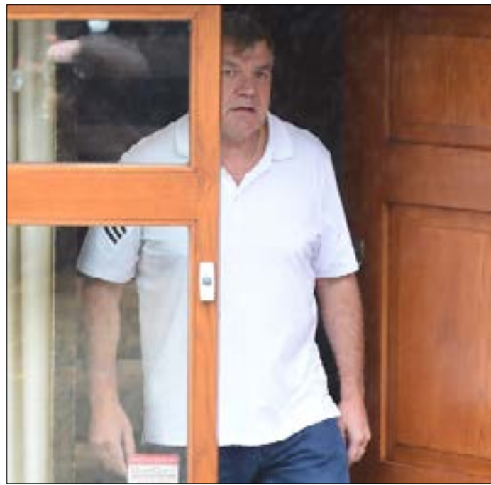
الأردايس أمام منزله أمس في بولتون

وكشفت "ذا دايلي تلغراف" عن تورط ثمانية من المدربين الحاليين والسابقين في الدوري الإنكليزي الممتاز، وآخرين من ناديين يلعبان في الدرجة الأولى.