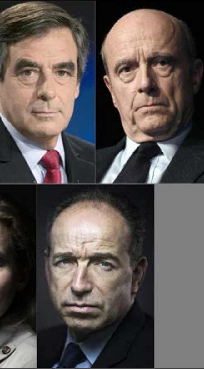
مرشحو اليمين السبعة للانتخابات الرئاسية الفرنسية المقبلة في عام 2017

من جانب آخر، يمثل فرنسوا فييون التيار «الليبرالي» في اليمين الفرنسي، خصوصاً في ما يتعلق بالقضايا الاقتصادية، فيما يُعدّ محافظاً في القضايا الاجتماعية. ويتميل مقترحاته الاقتصادية إلى التاشرية، بينما يدافع عن «القيم