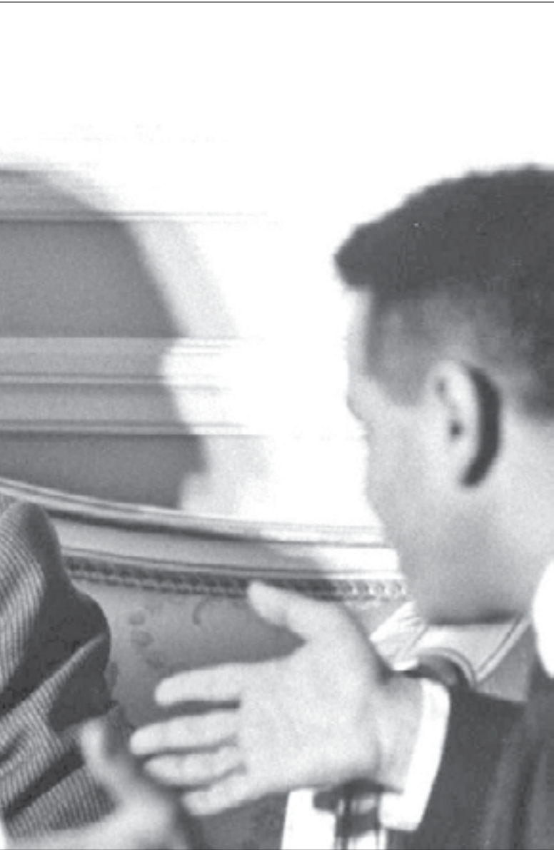
حديثي عن عبد الناصر هو لغد أرى فجره يطل من بين أكادس العتمة التي تلفنا

لقد عاد السيد حسين الشافعي وأكد هذه التهمة علناً غير مرة. ما دفع السيدة جيهان السادات إلى التهديد بإقامة دعوى قضائية ضده، ولا أحد يعرف اليوم ماذا