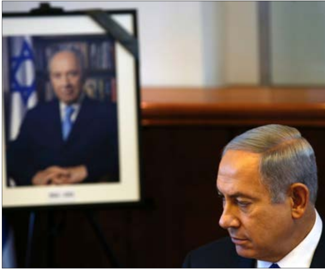
فقدت منظمة «الاعتدال العربي» أهم شريك لها. فيما فقدت إسرائيل شخصية قيادية مؤسسية

فقدت إسرائيل آخر «ديناصوراتها». مات شمعون بيريز، الداهية و«الهرباء» والشريك الدائم في المجازر بحق الفلسطينيين واللبنانيين والعرب