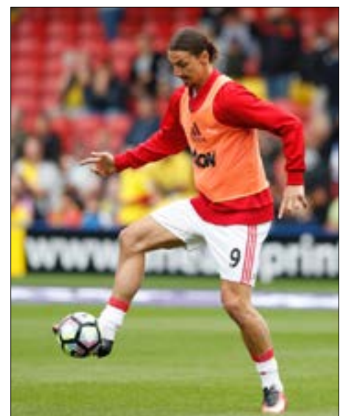
يستضيف يونايتد زوريا لوهانسك الأوكراني

بعد خسارتيهما المفاجئتين في الجولة الأولى، يتطلع مانشستر يونايتد الإنكليزي وإنتر ميلانو الإيطالي إلى انطلاقة جديدة في «يوروباليغ» في المرحلة الثانية. وسقط يونايتد أمام مضيفه فيينورد روتردام الهولندي 0-1، وإنتر ميلانو أمام ضيفه هبويل بئر السبع الإسرائيلي 0-2. ويستضيف الشياطين الحمر زوريا لوهانسك الأوكراني في مهمة يفترض أن تكون في متناولهم، فيما يحل إنتر ميلانو ضيفاً على سبارتا براغ التشيكي، باحثاً بدوره عن النقاط الثلاث الأولى له. وفي أبرز المباريات الأخرى، يلتقي روما الإيطالي مع ضيفه أسترا جيورجيو الروماني، وهو مطالب بالفوز بعد تعادله مع مضيفه فيكتوريا بلزن التشيكي 1-1 في