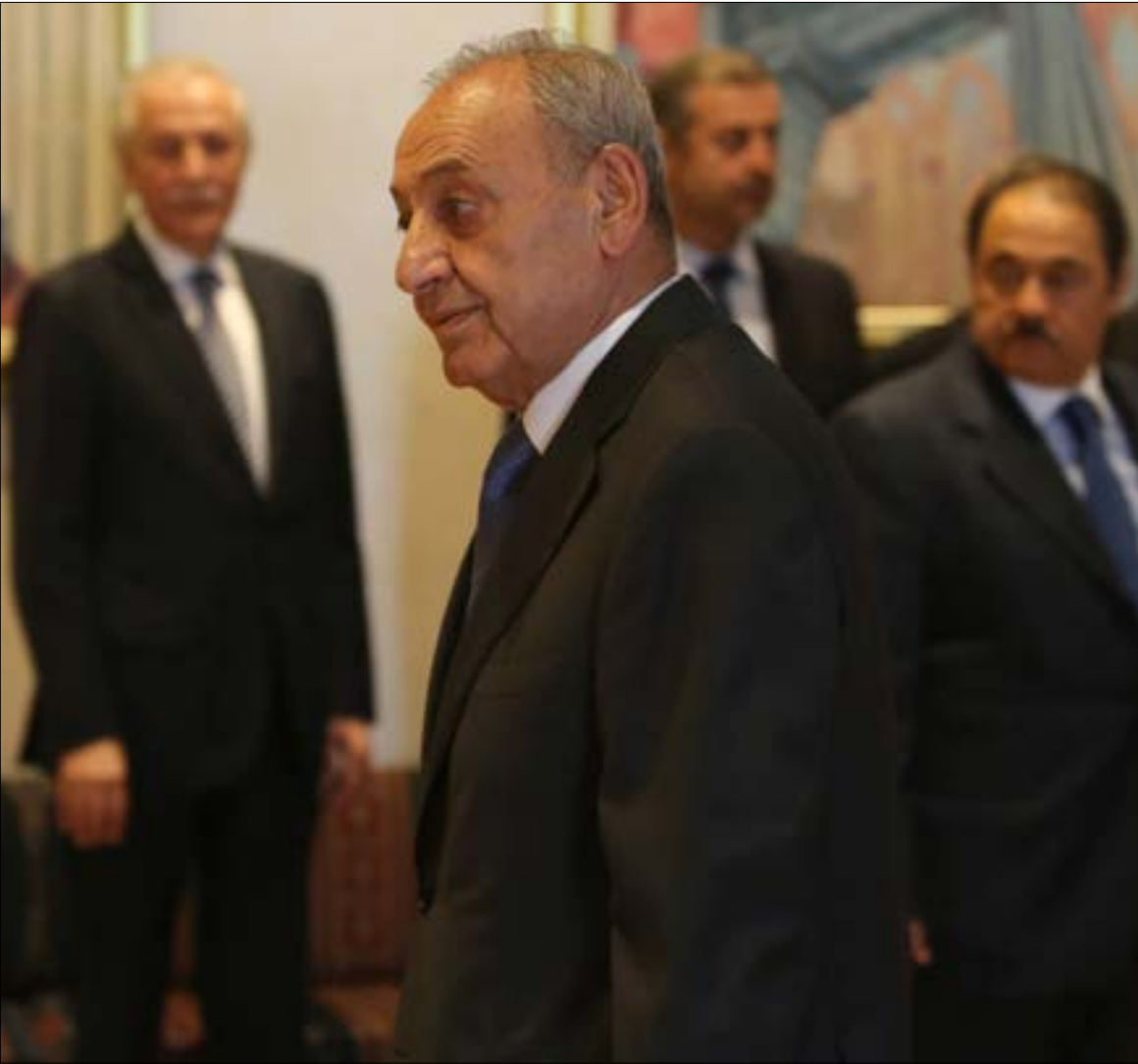
حزب الله في صدد القيام بمسعى بين بري وعمون لتذليل العقبات بين الطرفين

التسوية الرئاسية لا يصلح رئيس تكتل التغيير والإصلاح النائب ميشال عون دونها عقبة أساسية وضعها رئيس مجلس النواب نبيه بري. فلا تكاد الطريقة تفتح أمام عون التي بعدا حتى يزرعها بري بالألغام، معولا على تضييع الوقت التي حين فقدان التسوية بريقها والعودة إلى نقطة الصفر