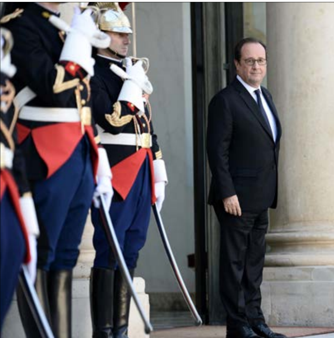
بحاول هولاند تأكيد ان اليسار لم يمت ولم يغير مفاهيمه