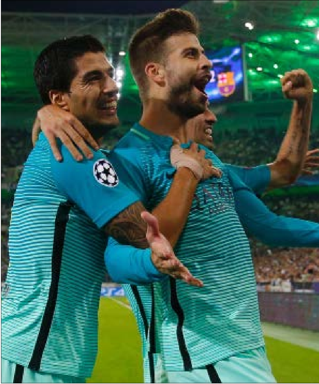
سجل جيرارد بيكيه هدف الفوز لبرشلونة

وتصدر أتلتيكو المجموعة بـ 6 نقاط، يليه بايرن بـ 3، ثم ايندهوفن بنقطة واحدة، وروستوف بنقطة أيضاً.