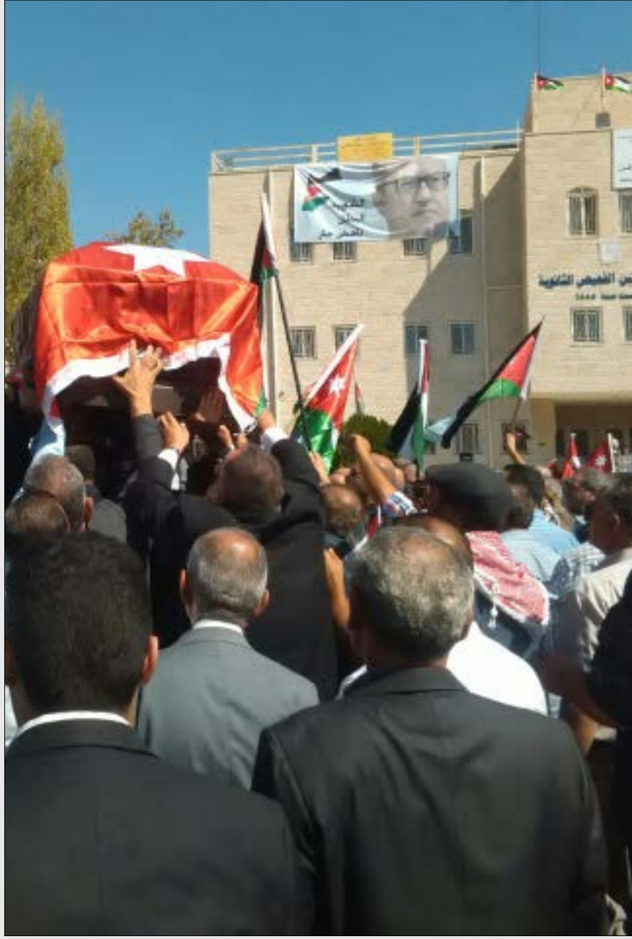
سجك حضور حرك لبعض المسؤولين السابقين والنواب