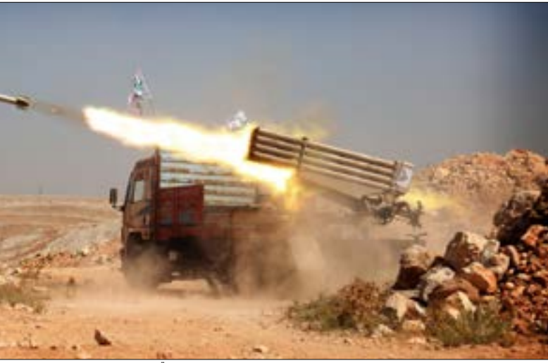
يظهر «جند الأقصى»، كاوله المستفيدين من دفعات السلاح التي «بشر» الأميركيون بها

روسيا مسؤولية الوضع، وخصوصاً استخدام قنابل حارقة في المدينة (حلب)، وهو تصعيد خطير يعرض السكان المدنيين لخطر أكبر».