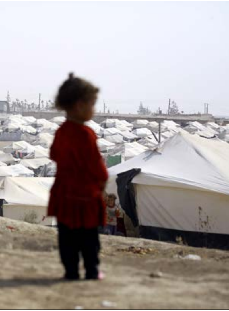
أليك التجيفي: لابد من الجوء إلى إنشاء إقليم نينوى

هي عضو فيه، كذلك ليس هناك أي عائق أمام مشاركتنا في غارات التحالف الجوية بالعراق، وطائراتنا مستعدة للمشاركة». ودعا أيضاً إلى «ضرورة عدم السماح لقوات الحشد الشعبي بالمشاركة في معركة الموصل بأي شكل من الأشكال، لأن سكان المدينة المحليين لن يقبلوا بأي قوة تأتي من الخارج».