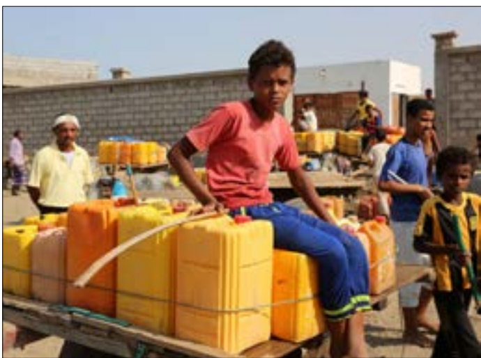
صادر «الإصلاح» مبالغ كبيرة قدمها «التحالف»، كدعم مالي للفصائل الأخرى