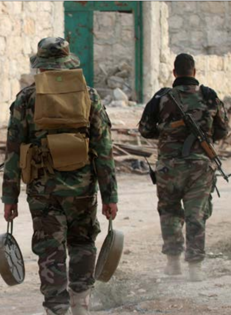
توغد قائد عمليات حلفاء الجيش أنقرة برّب «حازم» في حال تخطي الخطوط الحمراء (أ ف ب)

مع الأكراد من جهة، والجيش السوري وحلفائه من جهة أخرى. إذ تربط جميع الأوساط التركية في تصريحاتها، ما تجرّبه من تنسيق حول عملية «درع الفرات» مع موسكو، بتأكيد أنها هدف العملية المقبل هو مدينة الباب، وبعدها منبج.