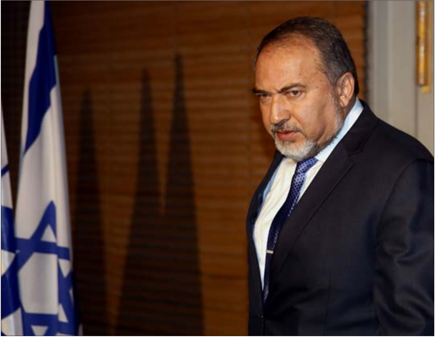
معادنة ليبرمان عرضتها صحيفة فلسطينية في لقاء استنكر شعبياً

وواقعياً، هم يتعرضون لضغوط سياسية غير مسبوقة، عبر الانفتاح العربي على إسرائيل، بهدف دفعهم إلى التنازل، وهو أمر يتكرر مع كل دعوة إلى تطبيع العلاقات مع العدو، إضافة إلى إحكام الطوق الشرقي والجنوبي الذي يحول دون إيصال ما يحتاجون إليه من إكانات وقدرات عسكرية. في هذه الأجواء بالذات، كان من الطبيعي أن ينتطح شخص مثل ليبرمان ليقدّم هذا العرض الوقح على شعب لم يعد لديه ما يخسره، بعدما خسر وطنه، ويُراد له تكريس هذه الخسارة عبر شرعنة الاحتلال.