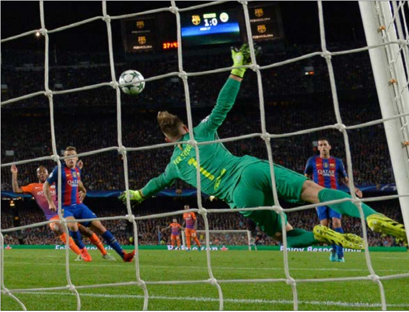
ينتظر حراس المرمى الألمان على نحو كبير مع الفرق المهمة في أوروبا

يتوزع الحراس الألمان على أكثر من بطولة أوروبية كبرى، وكان آخرهم اثنان هذا الموسم في الدوري الإنكليزي الممتاز. حراس يمثلون امتداد الجيك سابقه أبهر العالم بقدراته