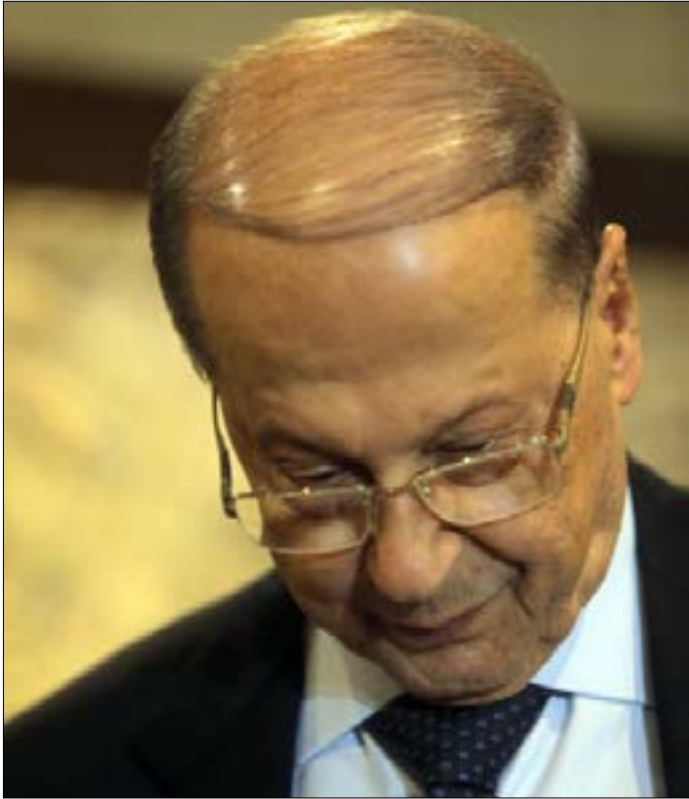
لم تكن «عون راجع، سوى اختصار لـ «عون راجع إلى بعداً» (هيثم الموسوي)

هذا الجنرال لم يكن يوماً رئيس حزب أو تكتل نيابي ووزاري أو جليس صالونات سياسية في نظر مؤيديه. فالوصوليون كان يكتفيهم موقع نيابي أو خدماتي يملأ بطونهم من فتات السلطة. أما الحالمون بعونيين، فلم تكن «عون راجع» بالنسبة إليهم سوى اختصار لـ «عون راجع