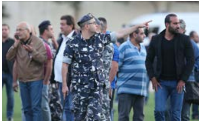
استند الاتحاد الى قرار القوى الامنية بعدم استكمال المباراة

واستند الاتحاد في قراره الى أن التقريرين لم يتضمنا أي ذكر لتعطيل اللقاء من قبل أحد الجمهوريين وتحديداً جمهور الإخاء الأهلي عاليه، وخصوصاً أن شريط الفيديو لا يظهر دخول الجمهور الى أرض الملعب رغم الأحداث التي شهدتها مدرجات الإخاء الأهلي عاليه. وعلمت "الأخبار" أن قرار إيقاف المباراة جاء من القوى الأمنية وتحديداً المقدم المسؤول عن الأمن داخل الملعب الذي سعى جاهداً للحصول على تعزيزات قبل أن يبلغ حكم المباراة جميل رمضان عدم إمكانية استكمال