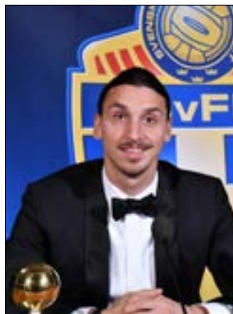
لنح زلاتان الى امكانته انتقاله الى الولايات المتحدة

وأضاف: "بعض الناس يمتثلون في مكان واحد طوال مسيرتهم لكني تنقلت في أماكن عدة مثل نابوليون في أوروبا وغزت كل دولة عشت فيها". وتابع: "ربما أعبّر المحيط الأطلسي في أحد الأيام لكي أغزو الولايات المتحدة".