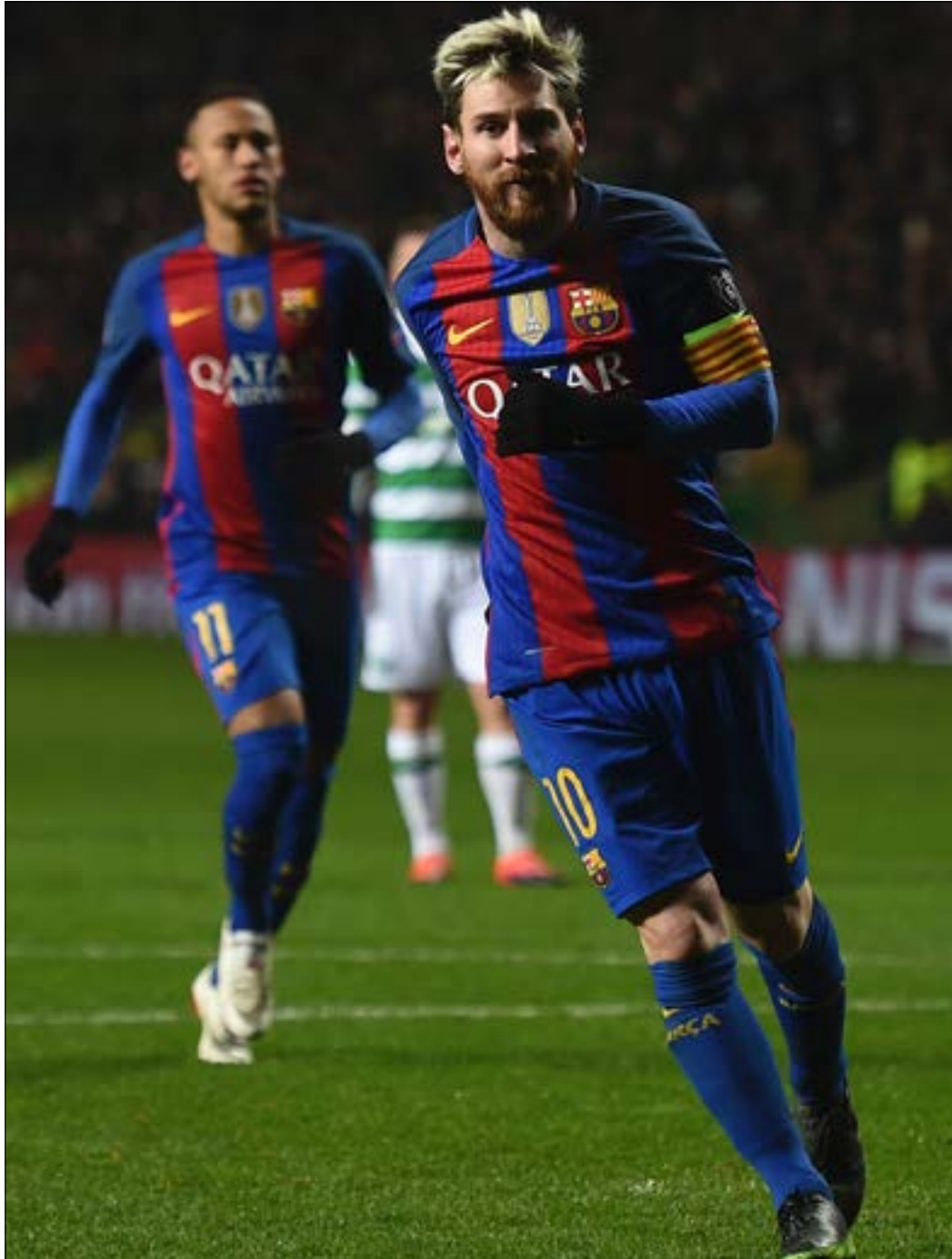
سجل ميسي هدفي التاهل لبرشلونة

وفي المجموعة الثامنة، عاد يوفنتوس من الأندلس ببطاقته الى الدور الثاني بعدما حول تأخره أمام مضيفه إشبيلية الى فوز 3-1. ورفع يوفنتوس رصيده الى 11 نقطة في الصدارة بفارق نقطة أمام إشبيلية الذي كان بحاجة الى التعادل من أجل ضمان تأهله. لكن عليه انتظار الجولة الأخيرة ضد مضيفه ليون الفرنسي الذي انعش أماله بعدما أصبح على بعد ثلاث نقاط من النادي الأندلسي بفوزه الغالي على مضيفه دينامو زغرب الكرواتي 1-0.