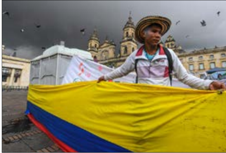
سيحك الاتفاق إلى مجلس النواب بدلاً من عرضه على الاستفتاء

الاتفاق الجديد «في أسرع وقت ممكن»، نظراً إلى «هشاشة» وقف إطلاق النار بين الجانبين، الذي دخل حيز التنفيذ منذ نهاية آب، لكن تخلله مقتل اثنين من مقاتلي «فارك» هذا الشهر، في ظروف غير معروفة تحقق فيها الأمم المتحدة. من جهتها، تحدثت «فارك» عن «إبادة جديدة جارية ضد قادة للمجتمع وفلاحين»، معتبرة أن الوضع «مقلق»، وذكّرت بالاعتقالات التي نفذتها ميليشيات يمينية متطرفة ضد ثلاثة آلاف ناشط في «حزب الاتحاد الوطني اليساري» في تسعينيات القرن الماضي. ومن المتوقع أن يكون احتفال التوقيع اليوم خافتاً أكثر من الاحتفال الذي جرى في أيلول عند توقيع أول اتفاق،