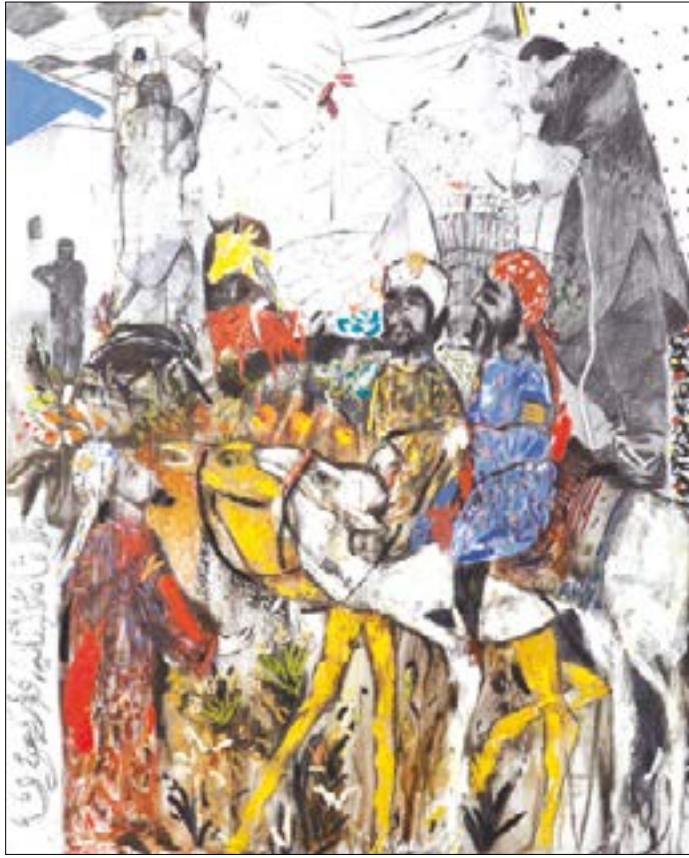
عبد القادري (26 فبراير 2015) (زيت وفحم على كانفاس - 200 × 160 سنتم - 2015)

نتابع في الاتجاه الذي كنا نفكر به أو لتغيير قلباً. ومن القرارات الهامة التي اتخذت، فتح الدعوة