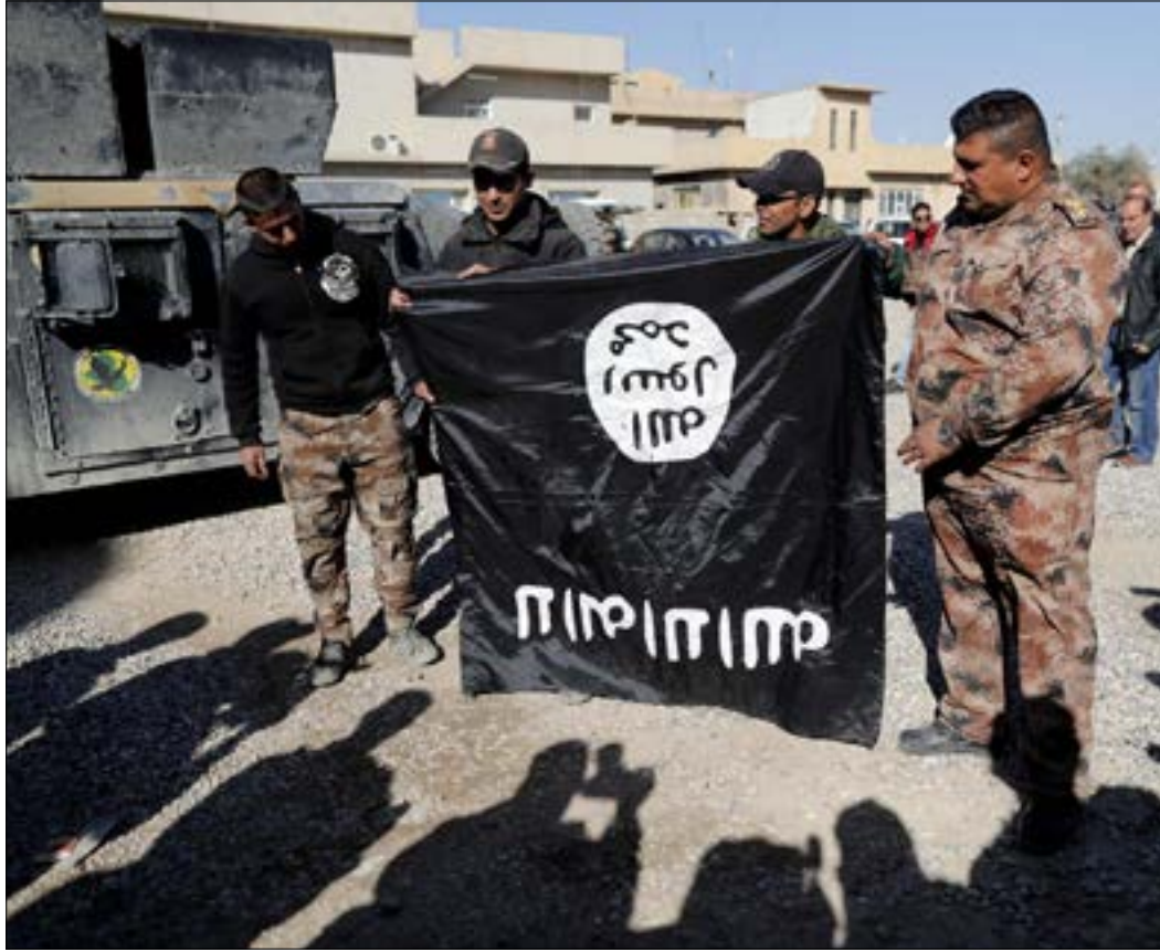
لم يهتم الإعلام الحكومي بإنجازات «الحشد» في قضاء تلعفر

مفصلي سيمز به في اليومين المقبلين. فأحد الأحاديث المتداولة، في الأروقة السياسية العراقية هو «تسريع قانون الحشد الشعبي»، أي «شرعته وتحويله إلى مؤسسة رسمية من مؤسسات الدولة العراقية ذات هيكلية، وموازنة، وشخصية قانونية». الأمر الذي يعني إلغاء قرار رئيس الوزراء حيدر العبادي (الداعي إلى تشكيل الحشد الشعبي)، وعدم إمكانية حل «الحشد» أبداً.