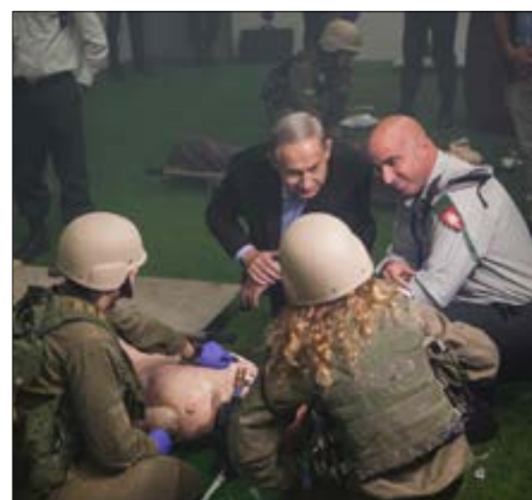
نتنياهو: عدد من الدول العربية تطلب منا تزويدها بتكنولوجيا متطورة (أ ف ب)

وأضاف الوزير الإسرائيلي: «أنا مؤمن بأن الرئيس ترامب سيمتلك الشجاعة التي أبداهها الرئيس تليين الموقف الأميركي الجديد من «حلفائها» العرب مقابل إيران وحلفائها. يشار إلى أن صحيفة «هارتس» كشفت عن لقاء جمع رئيس حزب «البيت اليهودي» المتطرف، وزير التعليم الإسرائيلي، نفتالي بينت، في نيويورك قبل أيام مع ثلاثة من أفراد طاقم الرئيس الأميركي المنتخب دونالد ترامب، طالباً منهم عدم تبني مبدأ حل الدولتين لشعبين سياسة رسمية، بل دراسة بديل آخر لهذا المبدأ. وفيما أكد مكتب بينت صحة ما نشر في «هارتس»، قالت مصادر إسرائيلية مطلعة للصحيفة إن بينت «اقترح أن تبحث الإدارة الجديدة خطته لإنشاء حكم ذاتي للفلسطينيين على أجزاء من الضفة الغربية، إلى جانب اتخاذ إجراءات لضم مناطق أخرى تدريجياً