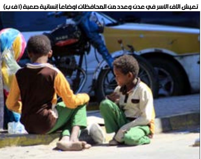
تعيش آلاف الأسر في عدن وعدد من المحافظات أوضاعاً إنسانية صعبة

في ظل غياب المساعدات الإنسانية والإغاثية للمنظمات الدولية، وفي مقدمتها تلك التابعة للأمم المتحدة في اليمن، يتهدد الجوع حياة عشرات الآلاف من الأسر اليمنية في العاصمة صنعاء والمحافظات الشمالية والجنوبية معاً. وفيما اتسع نطاق مظاهر المجاعة في المناطق الشمالية، ليمتد من مديريات محافظات الحديدة إلى مديريات محافظة إب والمديريات الحدودية مع السعودية في محافظتي صعدة وحجة، تعيش آلاف الأسر في عدن وعدد من