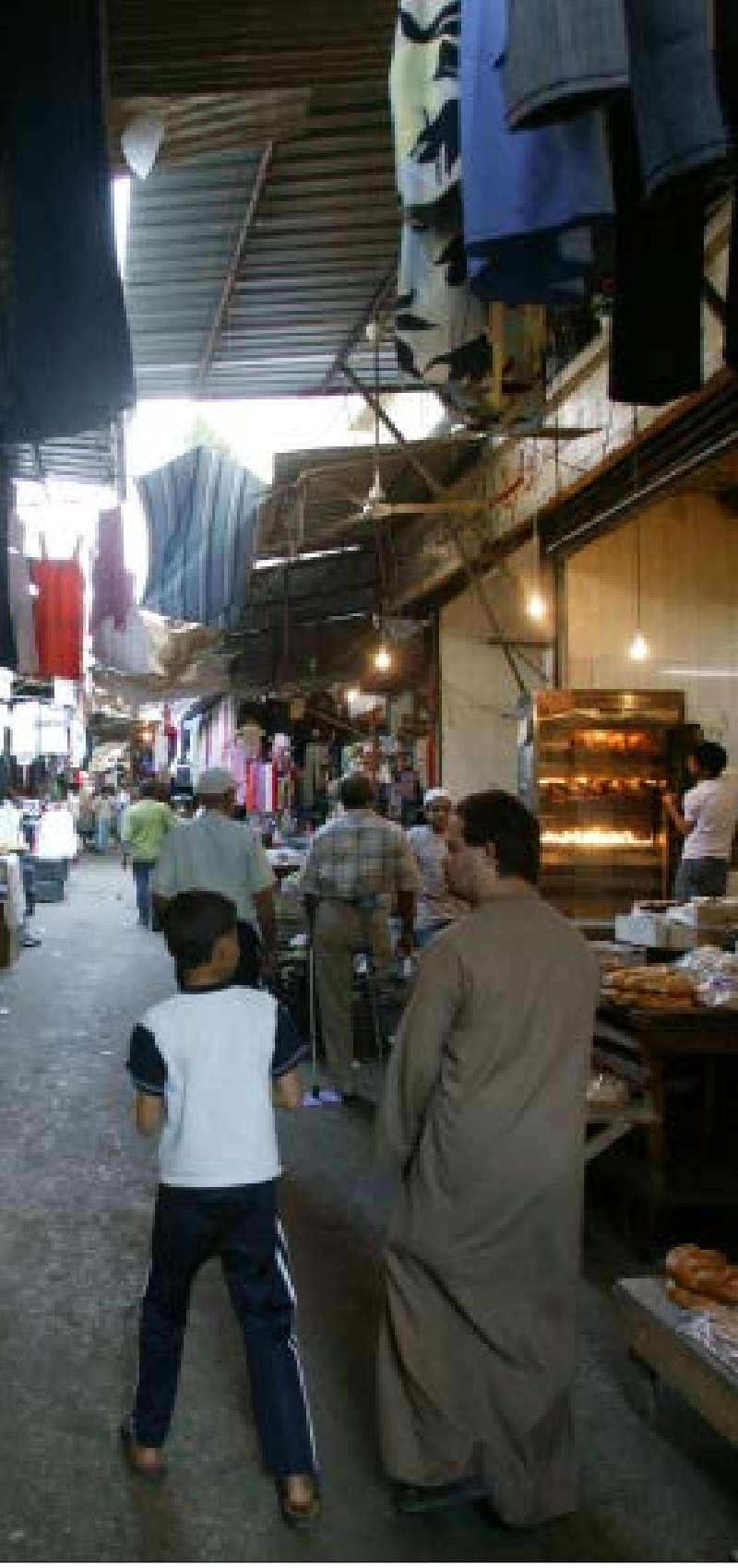
هك يقفل ان يؤخذ مئة الف انسان جبرية عشرات المطلوبين فقط؟ (هيلم الموسوي)

بل على هيئة جدران تقابلها شبكات متاكلة كانت تُسيج المخيم. وعزز المضي في تشييده تردّي الحالة الأمنية في المخيم على وقع الأحداث