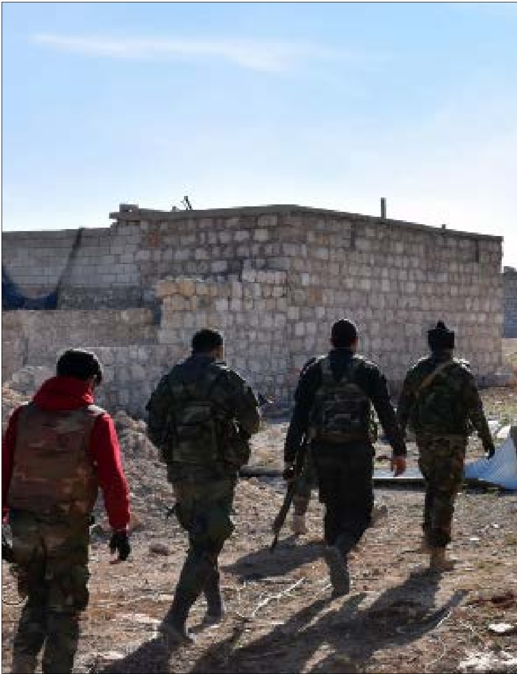
ساهمت المقاومة على نحو كبير في إدارة الهجوم المضاد على تخوم المدينة

جهة طريق الكاستيلو شمالاً. الكرمليين الذي كان مصمماً على قراره وقف الطلعات الجوية فوق مدينة حلب، وحيث كانت المعارك في مكان يحد من فاعلية سلاح الجو طلبت للمرة الأولى منذ حوالي الأسبوع لقاءً مع مسؤولين ميدانيين في حزب الله في حلب عبر القنوات العسكرية المشتركة، اثر رؤيتها للنتيجة النهائية لـ«غزوة أبو عمر سراقب».