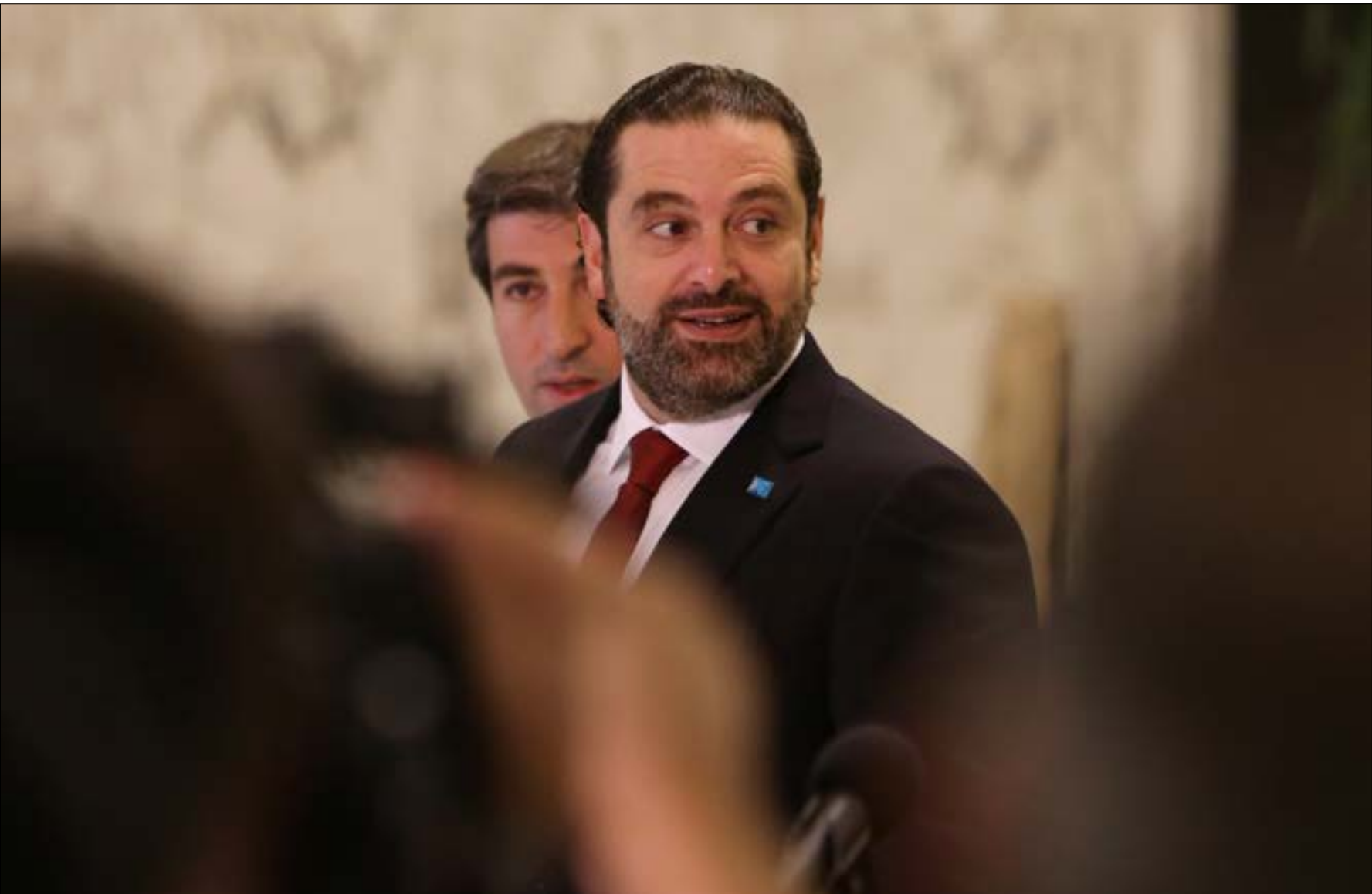
بعون العونيون على الحريري لتجاوز عقبة حقبية المردة. وفرنجية مصر على رفض التربية

دفع الرئيس ميشال عون جرس الإنذار الأخير قبل إعلان التشكيلة الحكومية دون الرجوع إلى أي من القوى السياسية الأخرى، في مهلة أقصاها أسبوع واحد. كلام الرئيس أتى بعد أن راوحت العقد الحكومية مكانها، خاصة لجهة «الفيثو» العوني على منح تيار المردة حقيبة غير وزارة الثقافة