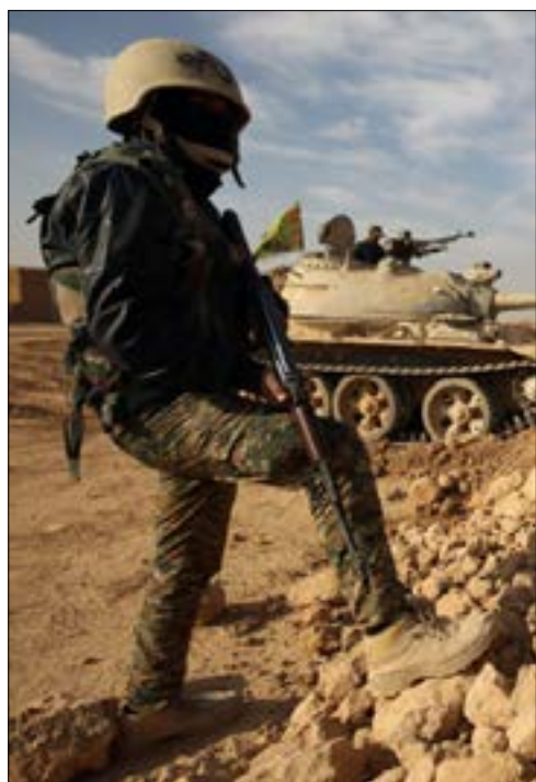
اعلنت قيادة عمليات «قادهون» بالنيوهي استعادة سهل نينوى بالكامل

نينوى بالكامل في تقدم ميداني بارز للقوات العراقية منذ أسابيع. ويتكون سهل نينوى من ثلاث مناطق رئيسية هي الحمدانية، والشبان، وتلكيف، وبعد الموطن التاريخي لمسيحي العراق، بالإضافة إلى حضور العرب، والشبك، والإيزيديين. أما «القوات المشتركة» و«جهاز مكافحة الإرهاب»، فقد تمكنا من تحرير أحياء المصارف، والقاهرة، والكصر شرقي الموصل، حيث رفعا العلم العراقي فوقها.