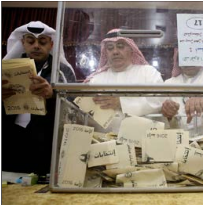
بلغت نسبة التصويت في بعض الدوائر 80%

قدم رئيس الوزراء الكويتي جابر مبارك الصباح، أمس، استقالة حكومته، إلى أمير البلاد صباح الأحمد الصباح، في خطوة إجرائية دستورية بعد ولادة «مجلس الأمة» الجديد. وجاء ذلك لدى استقبال أمير الكويت بحضور ولي العهد، نواف الأحمد الصباح، لرئيس الوزراء في «قصر بيان» في محافظة