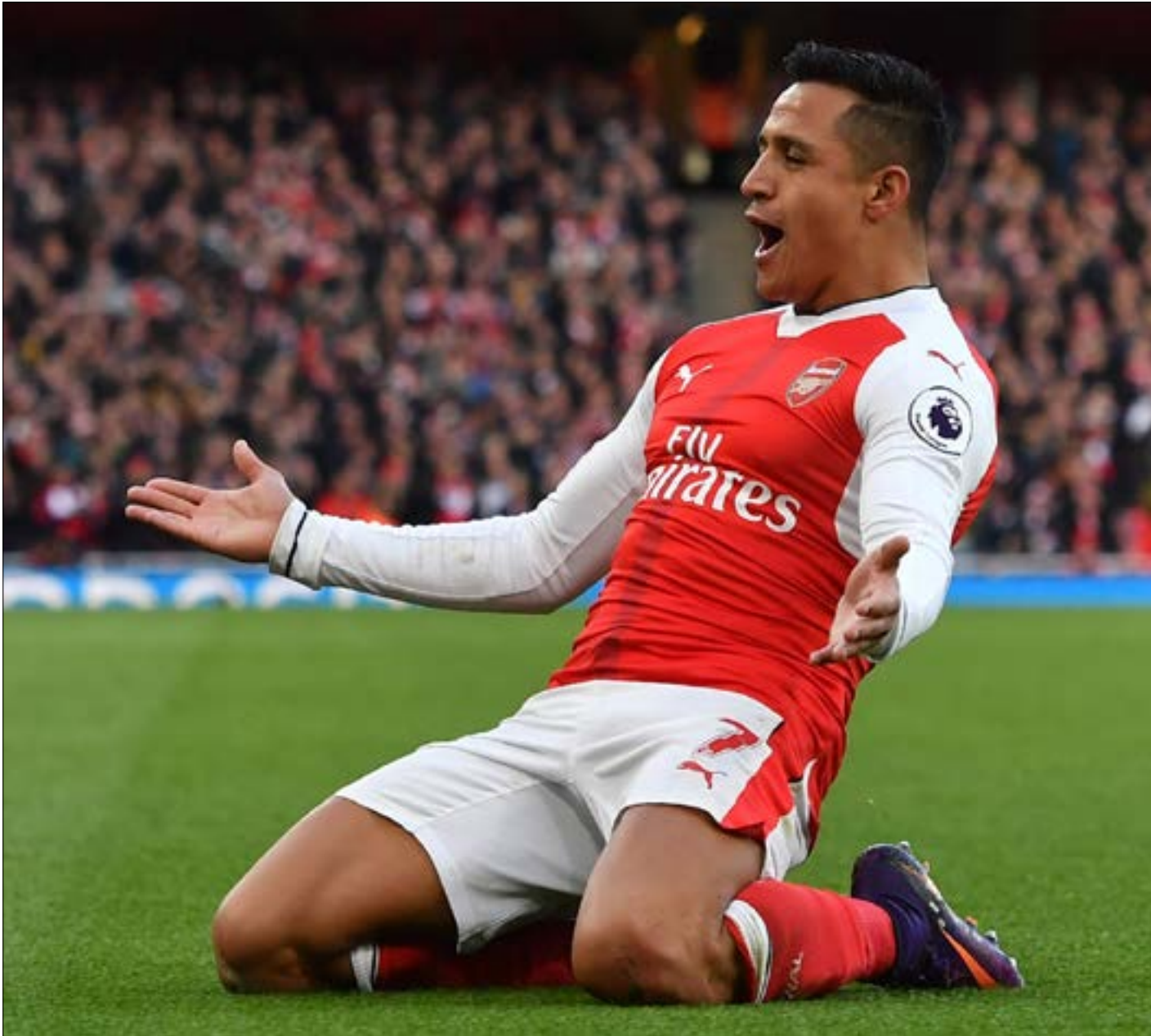
يحتك سانشير المرتبة الثالثة في لائحة ترتيب الهادفين في الدوري الإنجليزي

يقدم النجم التشيلياني أليكسيس سانشير مستوى مميزاً هذا الموسم مع أرسنال كان آخر تجلياته تسجيله هدفتين في المباراة الأخيرة أمام بورنموث. عواطف عديدة أسهمت في هذه الصورة المشرفة لسانشير حالياً في ملاعب الإنكليز