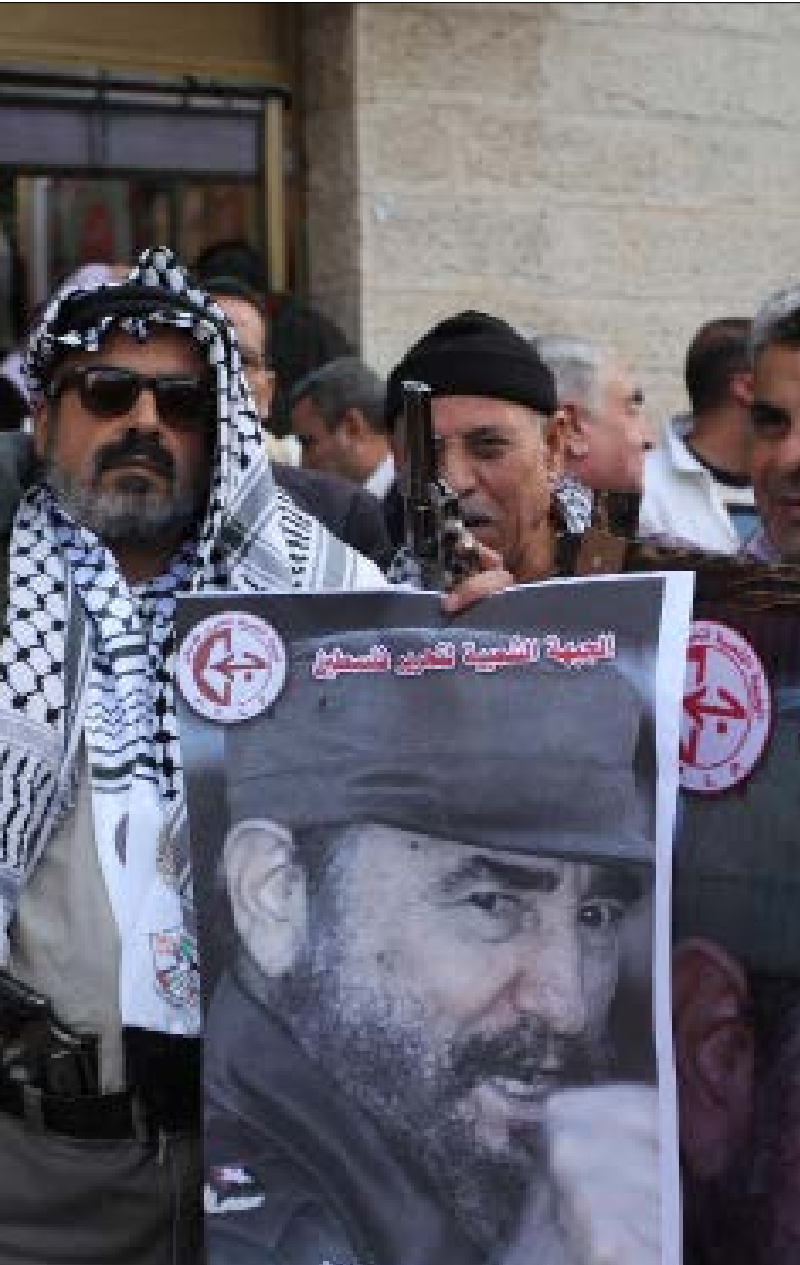
من مشاركة في فعالية حداد على فيديك كاسترو في غزة