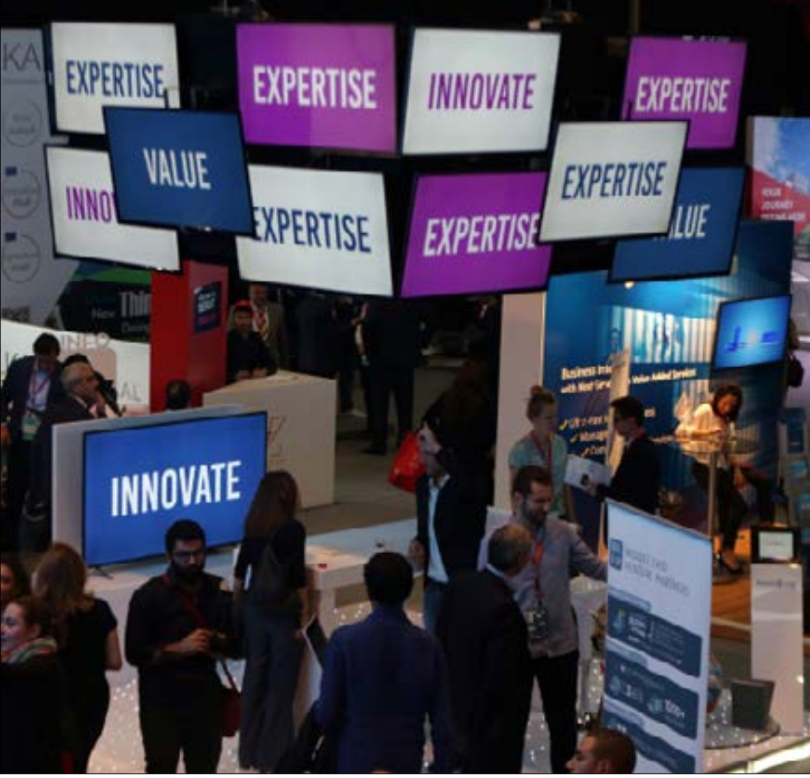
شخصية «رائد الأعمال» هي احد العوارض المنطقية للعالم الذي أنتجته السياسات النيوليبرالية

يشهد لبنان، كما معظم الدول المتخلفة اقتصادياً وتكنولوجياً، ترويحاً مكثفاً وهدفواً لمفهوم «ريادة الأعمال». يقدم هذا المفهوم كما لو أنه وصفة للنمو وتجاوز مشكلة البطالة المتسعة بين صفوف خريجي الجامعات... فمن هو رائد الأعمال؟ هل هو «الفرد الحر والمبدع» المحتر من قيود الاقتصاد والمتصارم مع الشركات التقليدية والحكومات والثائر على المنظومة؟ أم هو من عوارض العالم الذي أنتجته السياسات النيوليبرالية، كما يقول الفيلسوف، جييك وغيره؟