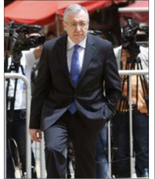
اجواء الاستياء من فتنت في صفوف تيار المستقبل بدت واضحة