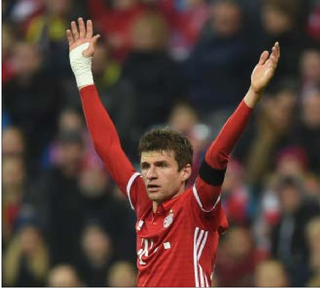
يستند مولر إلى محبة جماهير البافاري له

ما الذي يحدث مع توماس مولر نجم بايرن ميونيخ؟ 12 مباراة في الدوري الألماني منذ بداية الموسم لم يسجل فيها هذا النجم أي هدف، إذ إن هدفه الأخير في "البوندسليغا" يعود إلى 30 نيسان في الموسم الماضي خلال المباراة أمام بوروسيا مونشنغلادباخ. كل شيء يمكن تصديقه إلا أن يغيب هذا اللاعب مثل هذه الفترة عن التسجيل. هو الذي لا يخطئ الطريق نحو المرمى والذي يمتلك إنجازاً لم يحققه أي لاعب في تاريخ البطولة الألمانية بأن المباريات الـ 71 التي سجل فيها هدفاً على الأقل لم يخسر فيها فريقه، والذي سجل مجموع 155 هدفاً بقميص البافاري في 370 مباراة منذ أن لمع نجمه في صفوفه في عام 2009، والذي رفض يورو إلى بيعه مقابل 100 مليون يورو إلى