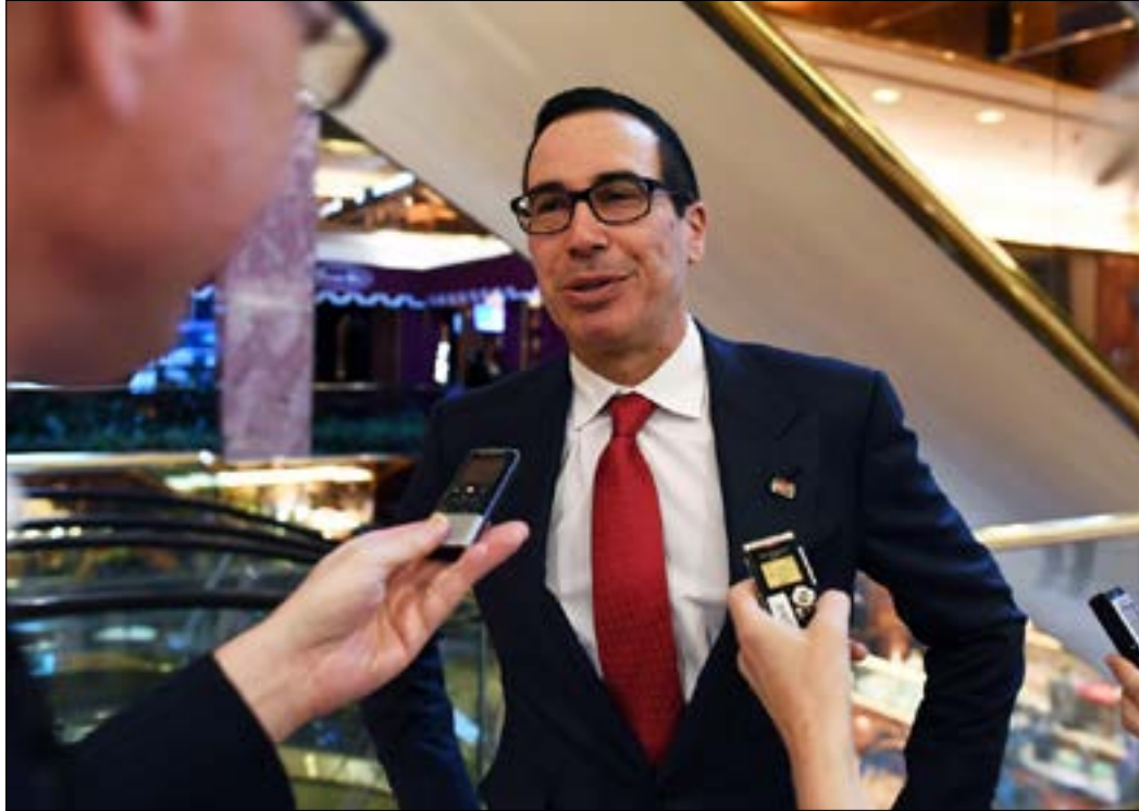
المرشح لوزارة الخزانة ستيفن منوتشين متحدثاً إلى الصحافيين خلال وجوده في برج ترامب

صبت وسائل الإعلام الأميركية كل اهتمامها على خيارات دونالد ترامب لمن سيشغل المناصب الاقتصادية الأساسية. لتشير إلى أنه فريقه مكون من كبار رجال الأعمال والأغنياء، الأمر الذي دفع إلى التساؤل عن مدى التزام هؤلاء بقضايا الطبقة العاملة، التي كان ترامب قد وعد بمعالجتها