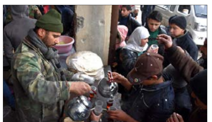
تبحث الأمم المتحدة مع موسكو فكرة إنشاء 4 ممرات لدخول الأغذية والإخلاء الطبي

بالتوازي مع تراجع الرئاسة التركية عن حديث الرئيس رجب طيب أردوغان حول إطاحة الرئيس السوري بشار الأسد، جاءت زيارة وزير الخارجية الروسي سيرغي لازروف إلى تركيا، كفرصة ذهبية لتحديد حجم الدور التركي وتأثيره على الملف السوري. وقد يكون إعلان موسكو، أمس من أنطاليا التركية، عزمها على «تحرير كامل مدينة حلب» أوضح رسالة علنية توجهها إلى أنقرة ضمن هذا السياق، بعد تأكيد مصادر تركية مسبقاً، أن الدفاعات الجوية السورية بالتنسيق مع موسكو، منعت الطائرات التركية على فترات متكررة من دخول الشمال السوري.