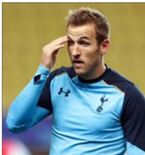
هاري كايين

أقل توتنهام الإنكليزي الباب بوجه مواطنه مانشستر يونايتد بعدما وقع المهاجم الدولي هاري كايين عقداً جديداً معه سيبقيه في صفوفه حتى سنة 2022، ليصبح آخر اللاعبين البارزين الذين يلتزمون بعقد طويل الأجل مع النادي اللندني.