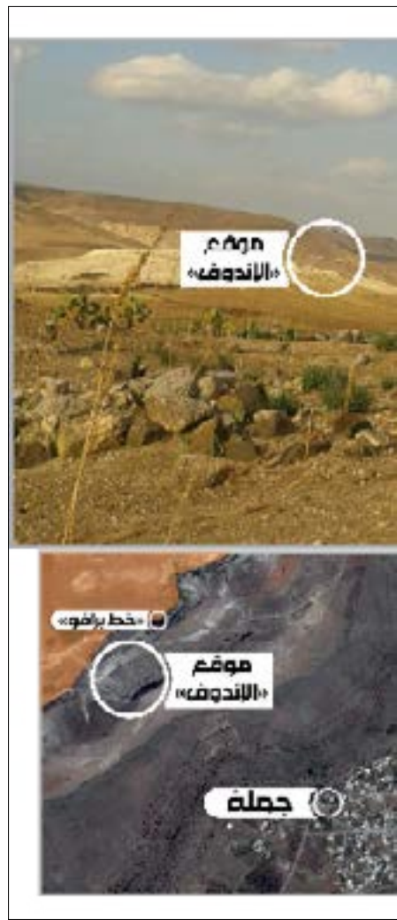
تصميم: سنان عيسى

الزراعية من دون الحصول على إذن إسرائيلي عبر القوات الدولية. ويأتي توغّل أمس استكمالاً لما أعلن عنه جيش الاحتلال يوم الأحد، عن استهداف طائرة من دون طيار آلية لـ«داعش» تحمل رشاشاً ثقيلًا وقتل ثلاثة عناصر داخلها، بذريعة إطلاق «داعش» النار على دورية إسرائيلية قرب حدود الجولان المحتل. إلا أن «الأخبار» علمت من مصادر متعددة، بينها مصادر أمنية ومن داخل حوض اليرموك، أن قوات الاحتلال طلبت من «داعش» إخلاء مقرّ القوات الدولية في كفرالما يوم الخميس الماضي، فقام عناصر «داعش» بإجلاء السجناء من المقر، والإبقاء على عناصر الحراسة ودوريات في المنطقة. وقالت المصادر لـ«الأخبار» إن إطلاق النار على دورية إسرائيلية جرى من مصادر مجهولة، ولم يتمكن العناصر من كشف الفاعل، في حين ردّت إسرائيل بتدمير المقر وقصف الدورية.