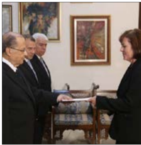
عون يتسلم اوراق اعتماد السفارة الاميركية اليزابيت ريتشارد

ولادة الحكومة». وقد أشار الرئيس بري لـ «الأخبار» إلى أن «الأمر لا تزال على حالها، وهو لن يفتح أي موضوع بشأن أي حقيبة مع رئيس تيار المرده سليمان فرنجية، لأنه لا وجود لأي عرض من الرئيس الحريري على عكس كل ما يشاع». وفيما نقلت قناة «أو تي في»، أمس عن مصادر مواكبة لتأليف الحكومة أن «البحث دخل جدياً في عرض حقيبة وزارية على تيار المرده، غير الحقائق الثلاث التي يطالب بإحداها حالياً، أي وزارات الاتصالات، الطاقة والأشغال»، سرت معلومات غير مؤكدة تفيد بأن «الرئيس عون مستعد لحل العقدة المتعلقة بحقيبة المرده، لكنه في انتظار الوزير باسيل لبت هذا الأمر». وقالت مصادر سياسية إن «باسيل سيزور رئيس القوات اللبنانية سمير جعجع، للتباحث في أمر حقيبة الأشغال»، بالتزامن مع ما تردد عن «زيارة سيقوم بها جعجع إلى قصر بعيدا». الى ذلك، دعت كتلة «الوفاء للمقاومة» إلى «الإسراع في تأليف الحكومة»، مشيرة الى أنه «لا مبرر للتأخير، وخصوصاً أن العقوبات ليست عصبية على الحل»، مطالبة بـ «توسيع قاعدة التمثيل لتشمل كل المكونات». وفي بيان لها بعد اجتماعها أمس، أعربت الكتلة عن استهجانها لـ «المماطلة في انجاز قانون الانتخاب، وكان المقصود احباط الشعب الذي يرفض التمديد وقانون الستين».