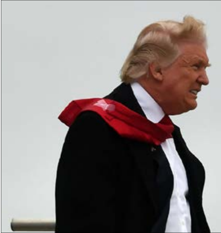
فوز ترامب صدم الألمان الداعمين للمرشحة الديمقراطية هيلاري كلينتون

فرنسا هي ثاني أهم شريك خارجي، فيما رأى 17 في المئة أن العلاقة مع روسيا أكثر أهمية. من جهة ثانية، قالت المستشارة الألمانية أنجيلا ميركل، أمس، إنها لن ترفض حذراً على عدد اللاجئين الذين ستستقبلهم ألمانيا، وذلك في كلمة لها في مؤتمر حزبي محلي في مونستر. وترفض المستشارة الدعوات المستمرة لـ «الاتحاد المسيحي الديمقراطي البافاري»، وهو فرع من فروع حزبها «الاتحاد المسيحي الديمقراطي» لتحديد عدد من سيمنحون حق اللجوء في ألمانيا ووضع حد أقصى لعدد المهاجرين الوافدين بـ 200 ألف مهاجر في العام. وقالت إنها لا تعتبر أن ذلك الاقتراح هو «الوسيلة الصحيحة، لعدة أسباب»، مضيفة أن «الوضع يختلف لو كان هناك سلام في سوريا والعراق». وتابعت أن ألمانيا لا يمكنها مساعدة سوى من هم بحاجة حقيقية للمساعدة، موضحة أن بلادها ترفض وترحل كل من لا يلبي المعايير الضرورية للحصول على الحماية الدولية.