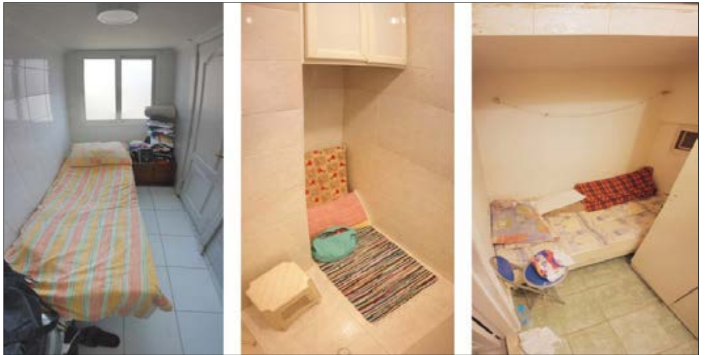
إعطاء عاملات المنازل من قانون العمل بنمط يعكس بإقصائهن أيضاً من الحصول على مساحات سكنية لائقة (هنا الدراسة)