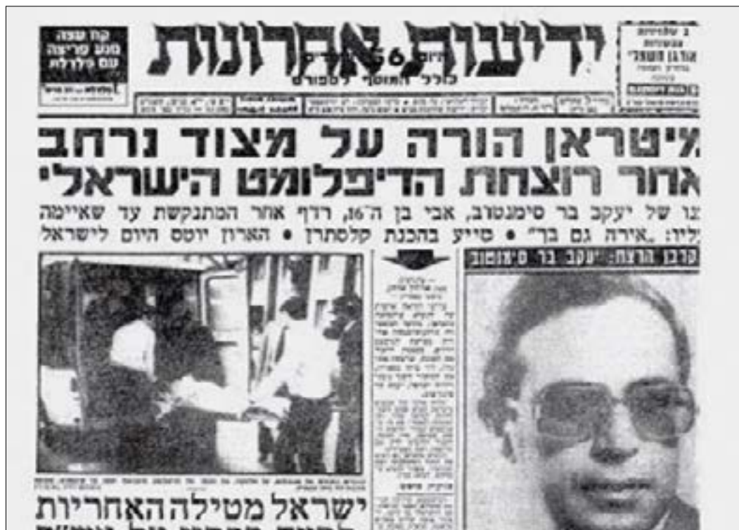
اغتيال باريسينتهوف، على الصفحات الأولى للصحف الاسرائيلية

جاكدين أن تهتم لتفاصيل التفاصيل في تحركاتها، وأن تبقى أقوى من كل أجهزة الاستخبارات التي تحاول اقتفاء أثرها. لم تستقر في منزل واحد أو منطقة واحدة. كانت هناك «بيوت آمنة»، لكن انتقالها الدائم بحركة مدروسة كان يكلفها الكثير من الأرق اليومي والحسابات الدقيقة. وبعد صدور الحكم الغيابي بحقها من قبل المحكمة الفرنسية في هذه العملية تحديداً، أصبحت السلطات اللبنانية أيضاً تشكل ضغطاً إضافياً عليها.