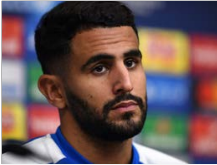
استبعد محرز رغم ترشحه لجائزتي الكرة الذهبية و«الفيفا» (أضرب)

برز في القائمة المختصرة النهائية للاعبين الـ 55 المرشحين لجائزة التشكيلة المثالية لعام 2016 التي أعلنها اتحاد لاعبي كرة القدم المحترفين، غياب الجزائري رياض محرز عنها، كما أنها لم تشهد اسم الإنكليزي واين روني.