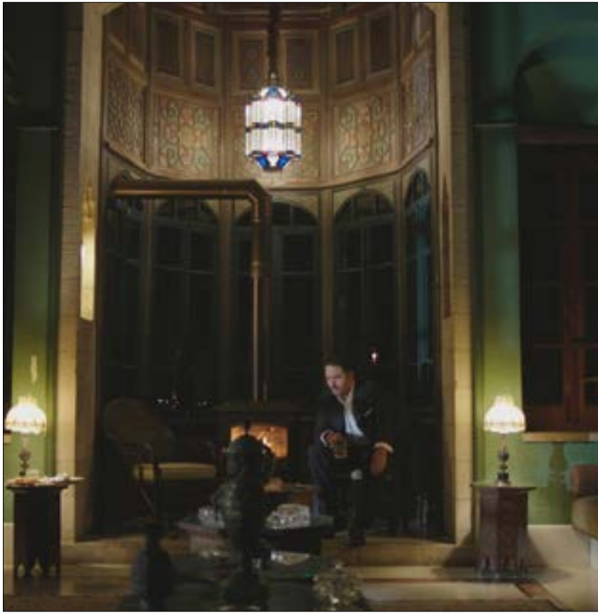
رامى عياش في مشهد من «أمير الليل»

أهمية الحلقة لا تكمن في اختيار الموضوع، فهذا البرنامج تحديداً كان سابقاً في خوض هذه القضية، وخصص لها في الماضي أكثر من حلقة أظهرت حالات قد يضعب على البعض تخيل مجرد وجودها. ما يميّز الحلقة فعلاً هو زاوية المعالجة، إذ جرى التركيز على مسألة «طلاق القاصرات» وأهمية التعليم. بادئها الهادئ والبعيد عن الإثارة التي تخيم على الشاشات المحلية، استقبل مكثبي ثلاث فتيات أرغمن على الزواج المبكر وهن لم يتجاوزن الـ 13 عاماً. «يسرا» (15 عاماً)، أم لولدين أصغرهما لا يزيد عمره عن أيام. 12