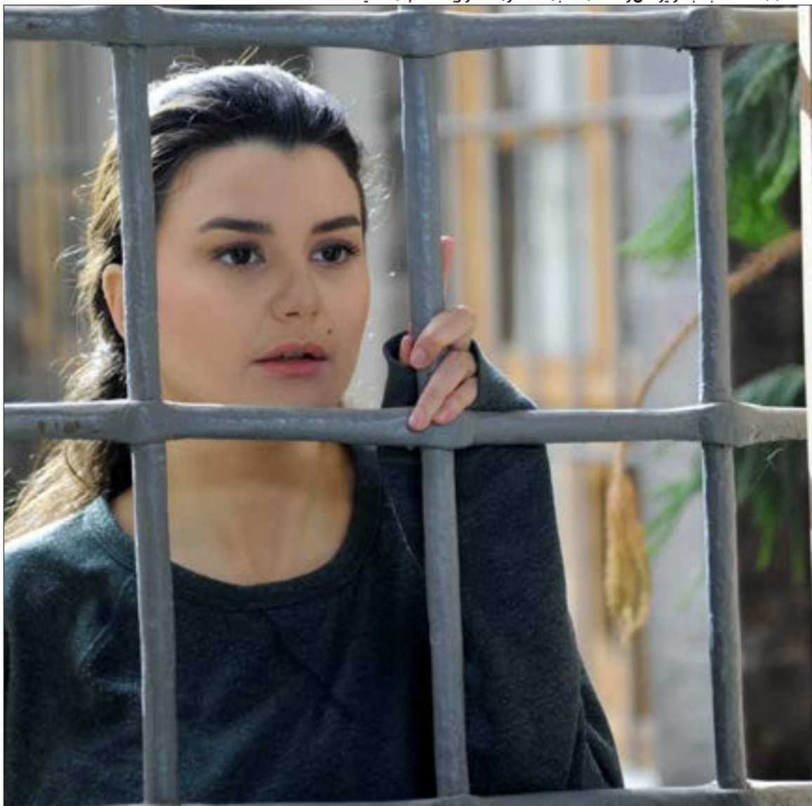
كانت الممثلة الشابة جفرا بونس واحدة من نجومات الدراما السورية العام الماضي