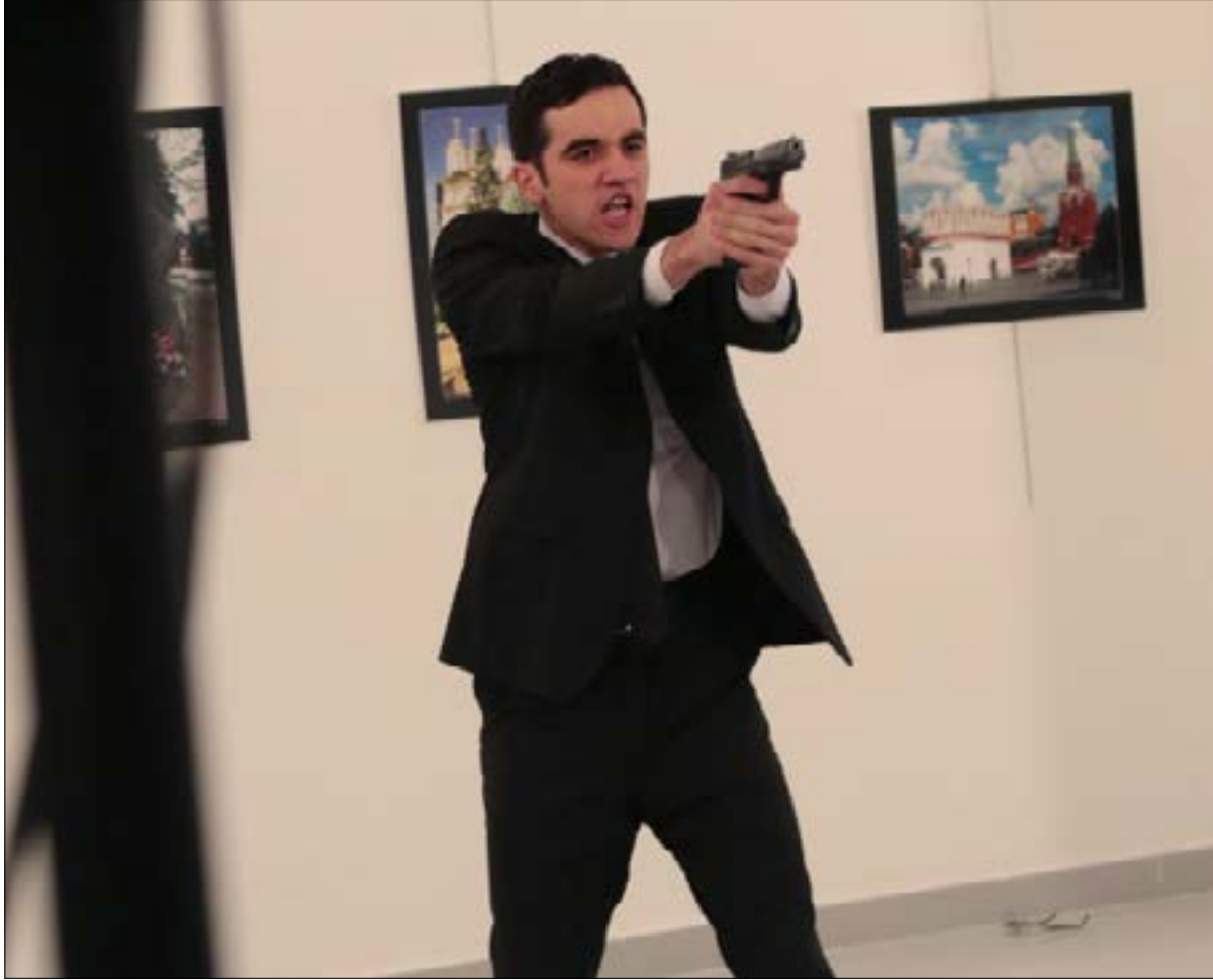
مولود مرت النطالان (بلمبيرغ)

توافق الصحافية على كلام المسؤول في هذه الحالة بالتحديد، غير أنها توضح: «... فُكروا في جثة الطفل السوري الغارق على أحد الشواطئ التركية (إعلان كردي). صور مماثلة قد تكون مؤذية للقراء الذين يفتحون الصفحة الأولى في الصباح ويجدونها من دون تحذير مسبق. هذا يعني أن القرارات بشأن طريقة استخدامها يجب أن تتخذ بحذر وعناية، وبدون تردد».