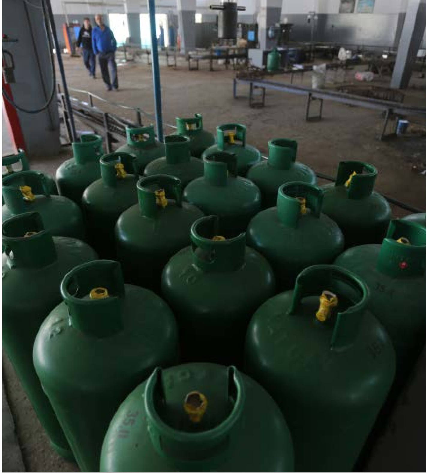
جدول تركيب الغاز اعلى بنحو 127 دولاراً من جدول تركيب البنزين