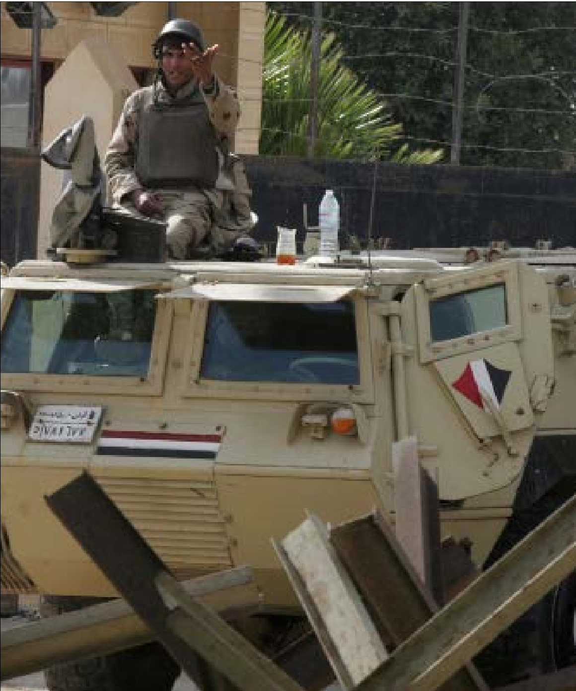
يسرق الجنود المصريون ما يحلو لهم من حقائب المسافرين