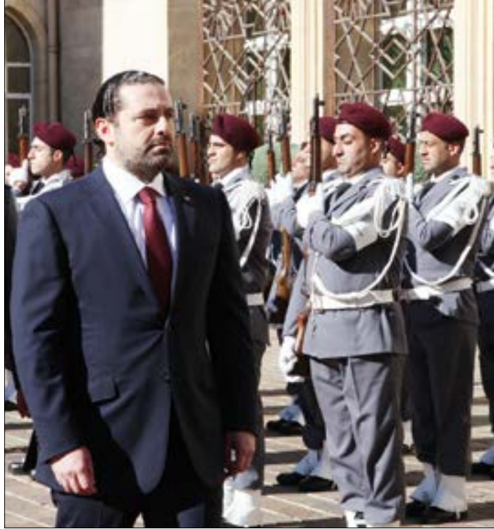
قبل التسليم والتسليم بدأ الكباش حول قانون الانتخاب والبيان الوزاري

لا شك في أن عملية التأليف في ذاتها، بعدما خلقت إرباكات كثيرة بفعل المحاصصة وتوزيع المغنم وارتفاع عدد الوزراء إلى ثلاثين، طرحت أيضاً إشكالية سياسية تتعلق بواقع هذه الحكومة بما رست عليه لائحة أعضائها. ففضلاً عن أن لقب وزراء الدولة استُخدم خطأ وفي غير محله والمقصود به دستورياً، فتحول إلى هدايا مجانية لفق العقد، دلت التشكيلة الأخيرة على أن القرار السياسي، في ما خص ملفات أساسية وحساسة، سيبقى خارج الحكومة. وسيكون على مجلس الوزراء ترجمة آليات هذا