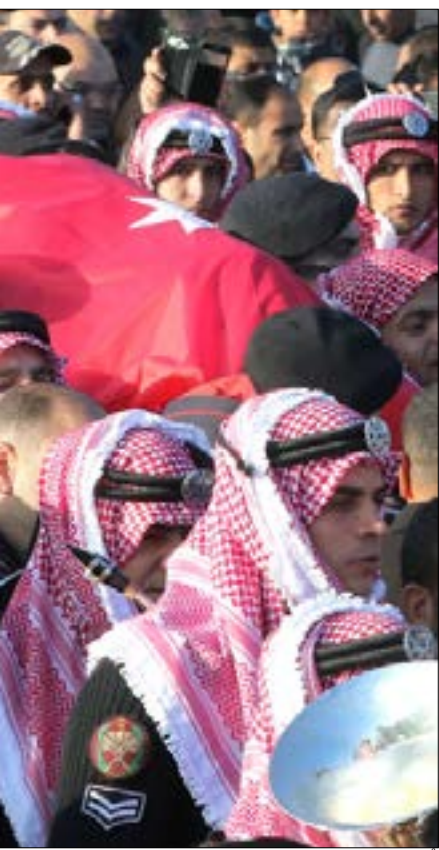
قتل أمس رجل أمن وأصيب آخر فيما اعتقل أحد المسلحين

بجانب التخوفات من تبعات على السياحة في المملكة، يرى محللون أن ما يحدث في الكرك سيمثل «عبئاً أمنياً ثقيلاً» يضاف إلى أزمة اقتصادية. وقد بدت شوارع العاصمة عمان في الأيام الماضية خالية من أزمات السير المعتادة، في إشارة قد تعكس الوجود الذي ساد المجتمع الأردني، خاصة أنه لم يتوقع أن يشهد مثل هذا الحدث الاستثنائي، رغم أن العام الجاري الذي يوشك على الرحيل، شهد عدة