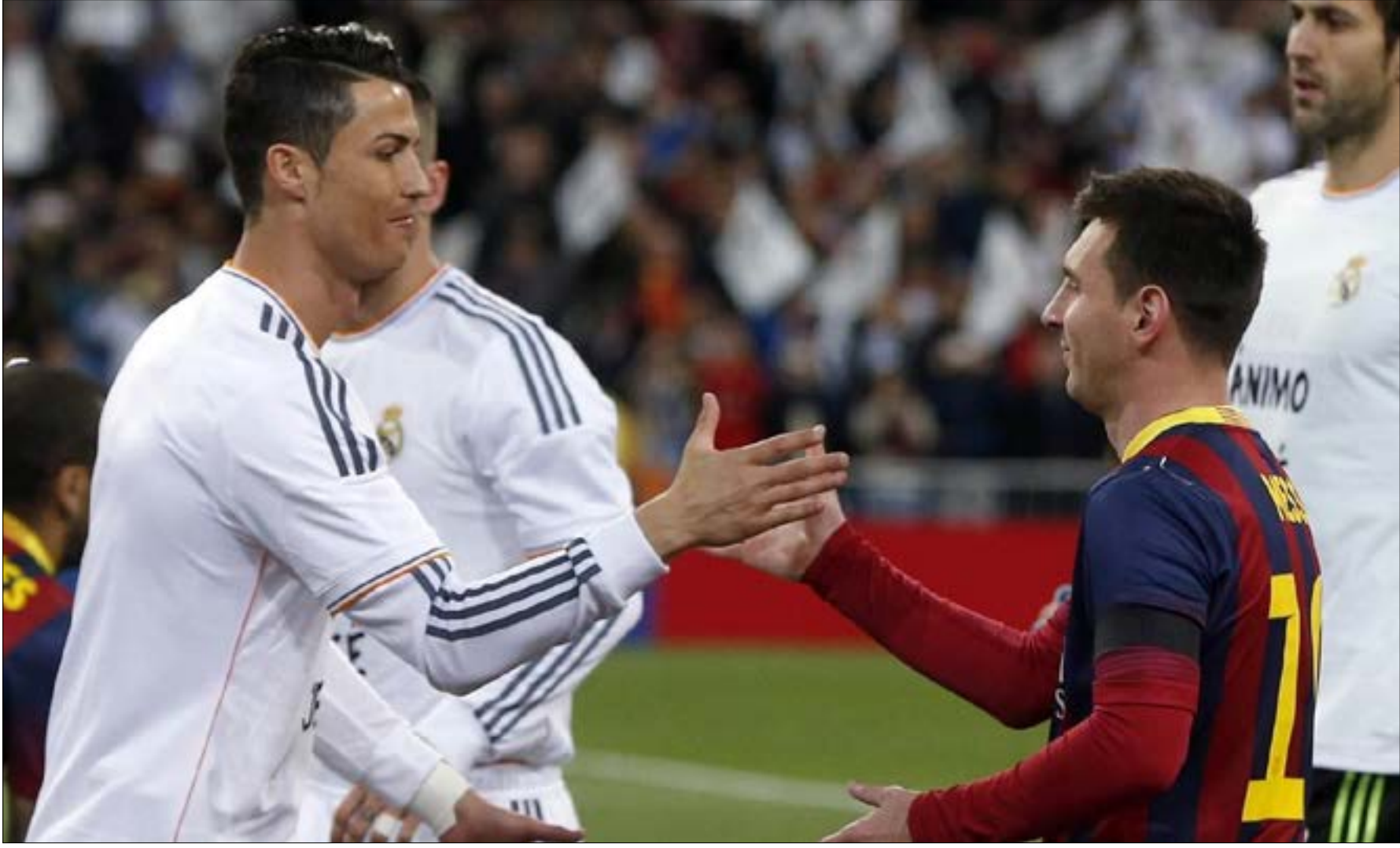
البت ميسي ورونالدو يوم الأحد الماضي عدم صوابية المقارنة بينهما (ارشيف)

أما لقطتا ميسي الساحرتان فتؤكدان أنه لا يوجد لاعب في العالم حالياً يضاهي الأرجنتيني في المهارة الفردية والمهوبة. ميسي معلم في هذا المجال. بكلام آخر، إن القدرات البدنية وقوة التحدي اللتين يمتلكهما رونالدو لا تتوفران عند ميسي. في المقابل، فإن المهارة الفردية التي يمتلكها ميسي لا تتوفر عند رونالدو، إذ من الصعب حتى لا نقول من غير الممكن أن يقوم "الدون" بلقطة الهدف الأول للأوروغوياني لويس سواريز الأحد الماضي عندما تخلى "ليو" ببراعة أربعة مدافعين في مسافة ضيقة. اليوم يلعب برشلونة في كأس إسبانيا من دون ميسي بسبب منحه عطلة الأعياد، كما أن رونالدو سيغيب لأن ريال مدريد لن يلعب بعد خوضه مباراته مسبقاً لانشغاله بمونديال الأندية. ميسي غير حاضر وكذلك رونالدو. إنها الخسارة بحد ذاتها.