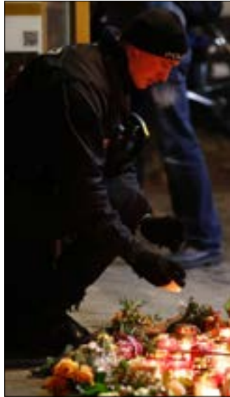
تبنى «داعش» هجوم برلين

لا يزال الارتباك سيد الموقف في ألمانيا عقب الاعتداء الذي وقع في برلين وأودى بحياة 12 شخصاً. وفيما عززت أمس الإجراءات الأمنية في العاصمة، أخلت السلطات محطة القطارات في وسط مدينة كولونيا لوقت قصير، وذلك إثر اتصال هاتفية كاذب، كان قد أفاد بوجود قنبلة.