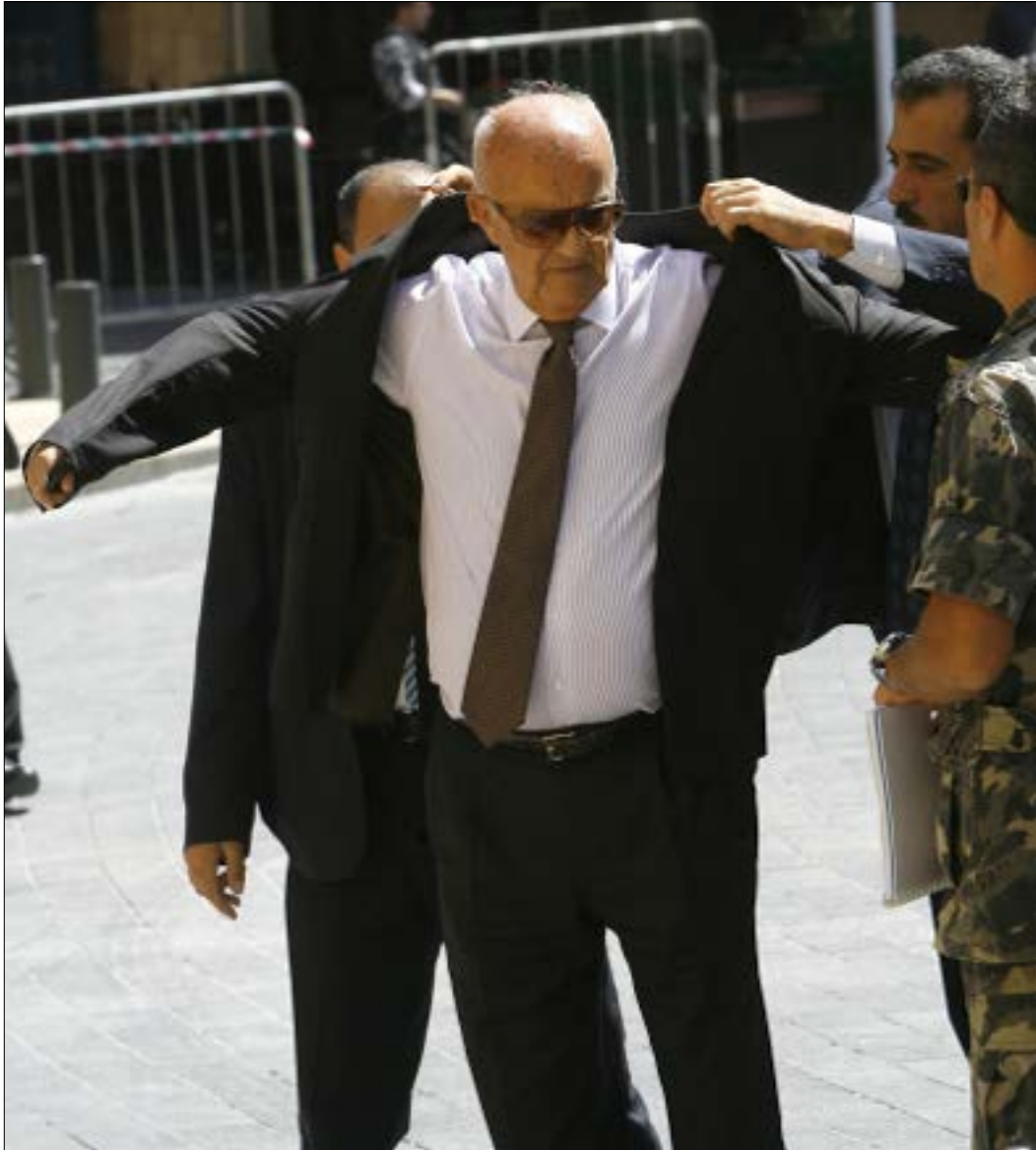
وزير المال أكد لوزير الدفاع السابق، ان لا مانع ماديا او تقنيا من تنفيذ العقود (مروان طحطد)

أهملك وزير الدفاع السابق، سمير مقربك عقدين لشراء الأسلحة من موسكو من دون سبب، سوى خضوعه للإهلاءات الأميركية التي تخدم المصالح الإسرائيلية. ومع أن لبنان يملك هامشاً أوسع للتعاون العسكري مع روسيا، من الأردن ومصر، بفعل وجودها في سوريا. إلا أن ثقة في بلاد الارز من يريد ان يحول الجيش إلى جزء من «الناتو»