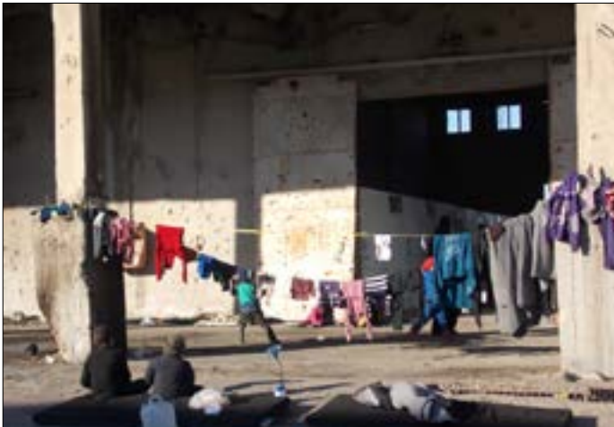
في المسكن المؤقتة لتأجزي احياء حلب الشرقية في جبرين (الاجبار)

وداعميه بعد انتصار عسكري في حلب. مصدر قيادي آخر يروي أنه «كان بالمستطاع إقفال ملفات مهمة عالقة بعد حسم حلب، من مسألة كفرنا والفوعة إلى المخطوفين والأسرى وصولاً إلى السيطرة التامة على طريقة إخراج المسلحين بلا سيناريو التحفّي والباصات المغلقة». السيناريو الأخير طرأ عليه بعض التعديلات من القوات على الأرض، وقطع الطريق أول من أمس نموذج لتصعيد مقابل «الفريق