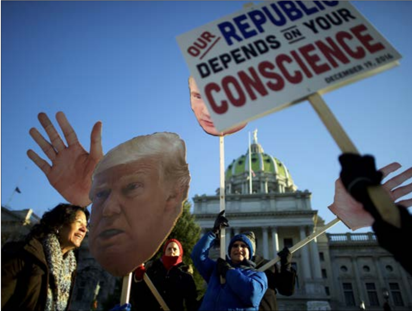
بنت المجمع الانتخابي، مساء أول من أمس، انتخاب رجل الأعمال السبعيني

أول من أمس، تخطى دونالد ترامب المرحلة الثانية في الانتخابات الأميركية، بحصوله على غالبية الأصوات في المجمع الانتخابي. ولكن كما في كل مرة، تثير الصيغة الانتخابية الأميركية انتقادات واعتراضات كثيرة تصل إلى حد المطالبة بإلغاء المجمع الانتخابي