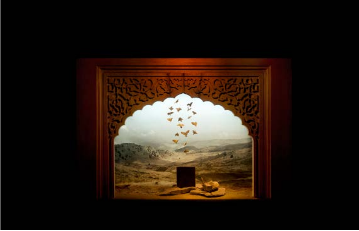
«عام الفيل» (105 × 70 × 75 سنتم - 2014)

أحد أعقد المواضيع المحرمة قاربت الفنانة اللبنانية في معرضها «الزهرة لم تولد في يوم واحد» الذي اختتم أخيراً في «غاليري تانيت»، «عام الفيل»، و«فينوس»، و«إساف» و«نائلة» و«اللات» استحات لوحات ثلاثية الأبعاد عن طريق الديوراما... تلك الصناديق الصغيرة التي تضم عناصر بصرية مختلفة مثل الفيديو، والمصور والمنحوتات والإضاءة والحفر إلى جانب توظيف التكنولوجيا