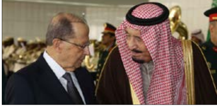
الرئيس عون وملك السعودية (دالاني ونهرا)

على الضفة الاشتراكية، سجلت مصادر جنبلات ارتياحه لموقف القوات ووصفت كلام جعجع بـ «الجيد». كذلك نقلت عنه ارتياحه أيضاً لمواقف القوى كافة في ما حُض «رفض النسبية، خصوصاً بعد طمانه حزب الله له». ففي رأي جنبلات، كما نقلت المصادر، «أن كلاً من تيار المستقبل والتيار الوطني الحر والقوات اللبنانية وحركة أمل وحزب الله يسعى الى تعزيز وضعه داخل بيئته، فلماذا يصبح الأمر مرفوضاً حين يصل الدور إلى وليد جنبلات ليحافظ على وجوده وكتلته؟». وأكدت المصادر أن لا مسودة قانون انتخابي ينطلق منها الاشتراكي لبحث قانون جديد، «فحتى الساعة لا يوجد سوى قانون 2008 ونحن نسمع الجميع، في انتظار الاجتماع التقني الجديد مع الوزير علي حسن خليل حتى نستفهم منه حول قانون التاهيل الذي طرحه بري». وللاشراكي ثوابته ودوائره التي يرغب في عدم المس بها، ومن بينها «دائرة الشوف وعاليه، إذ نفضل أن يبقى انتخاب مقاعد هذه الدائرة على الأساس الأكثر، لأنها أساس التمثيل والوجود الدرزي، والتي تنتشر فيها مع الطوائف الأخرى».