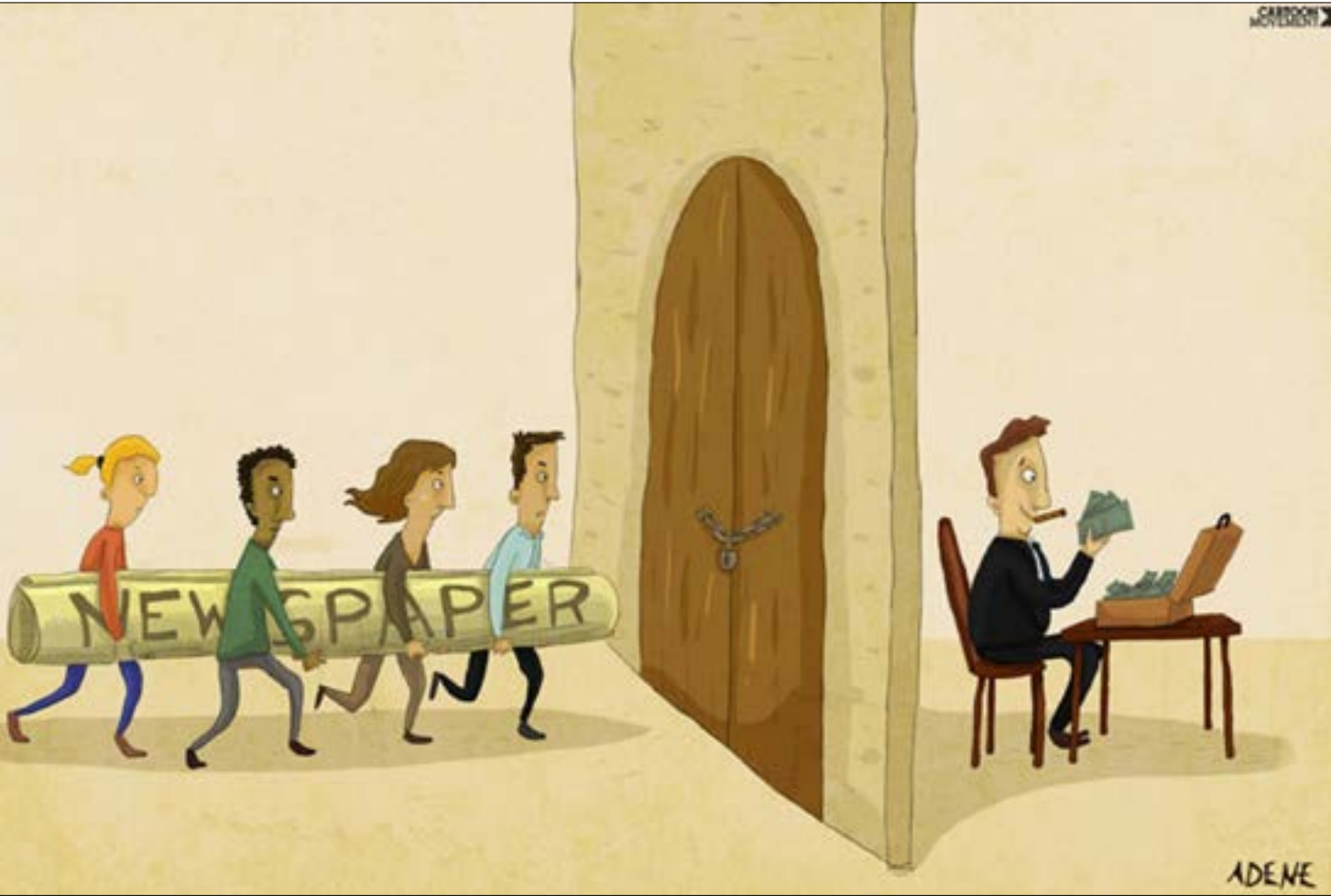
ADENE أنت دبيرت - فرنسا

بأي قرش. لكن العرض رُفض. ثم رُفضت عروض أخرى باستخدام اسم «السفير» ومعاودة الصدور بحلة جديدة، ما دفع عدداً من الزملاء العاملين فيها، مع أصدقاء للجريدة، يتقدمهم الزميل مصطفى ناصر، إلى بدء العمل على إصدار جريدة يومية، تراث «السفير»، وربما تلمح إلى ما هو أكثر. وهو مشروع مستحب، لا بل وجب دعمه، من كل من يقدر على دعمه، بما في ذلك الأفراد أو الجهات التي كانت تدعم «السفير»... مع