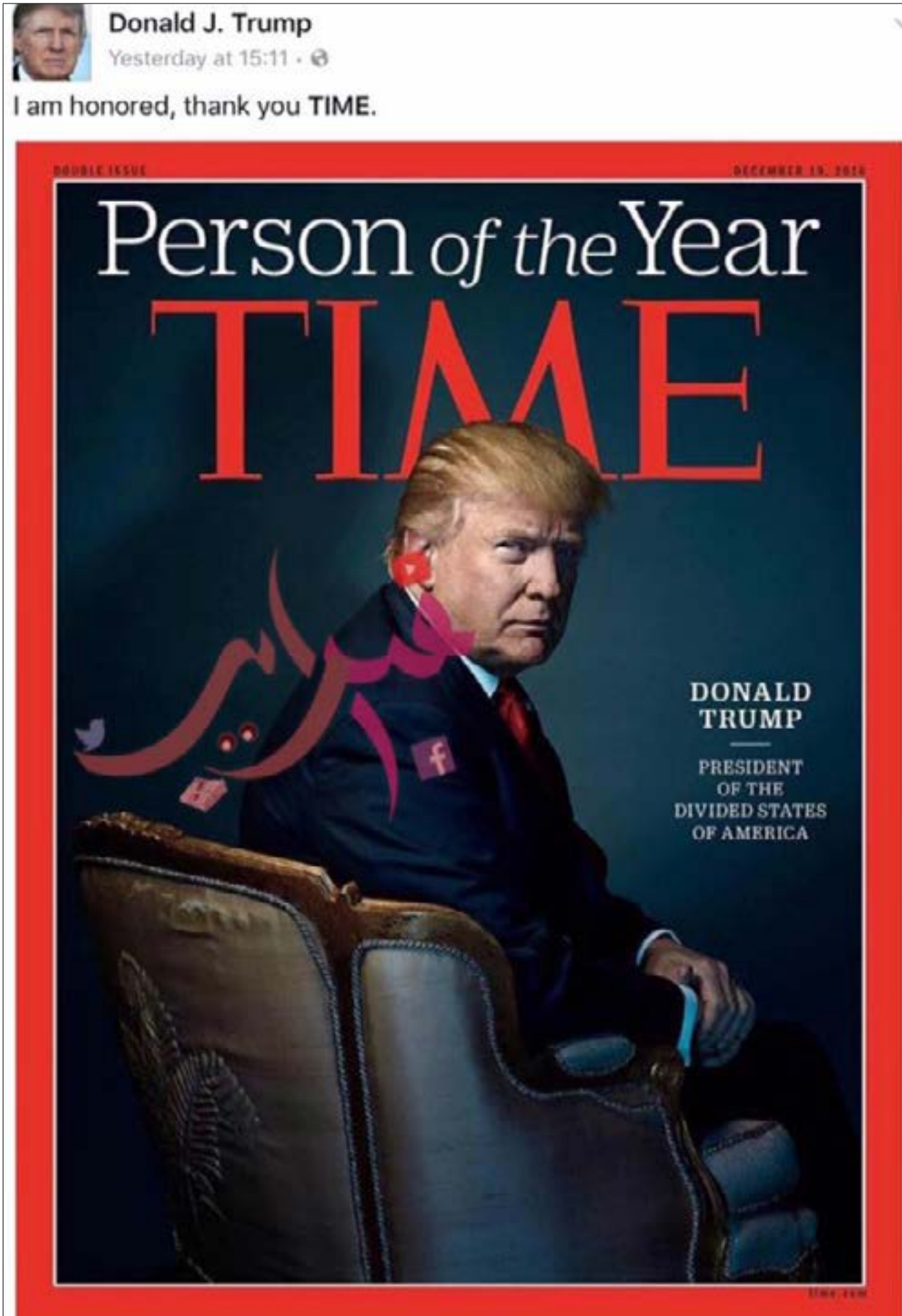
دونالد ترامب اعلن فعلاً على صفحته الرسمية أنه تُلغى بأن مجلة «تايم» اختارته لشخصية العام. لكن عنوان المجلة ساخر وهو «رئيس الولايات المتحدة المقسمة» (برنامج «30 فبراير»)

انطلاقاً من تجربة الشيخ الإعلامية والأكاديمية، كان لا بد من سؤاله عن مدى إفادة وسائل الإعلام العربي من مواقع التواصل الاجتماعي؟ برأيه، «حان الوقت للاستثمار أكثر في إعداد الصحفيين المتخصصين في مجال التواصل الاجتماعي». ويعطي مثالا أن هناك مؤسسات عربية تعتبر أقسام التواصل الاجتماعي مجرد وحدات تكميلية، وقد تسند هذه المهمة للصحافيين المبتدئين وهذا «خطأ كبير»، لأن «الصحافي المتمكن من وسائل التواصل الاجتماعي، قادر على القيام بمهام أي صحافي آخر، لكن العكس غير صحيح»، إضافة إلى أن التواصل الاجتماعي هو عنوان الإعلام اليوم، والفشل في مواكبته يلقي شكوكاً على مستقبل أي مؤسسة إعلامية.