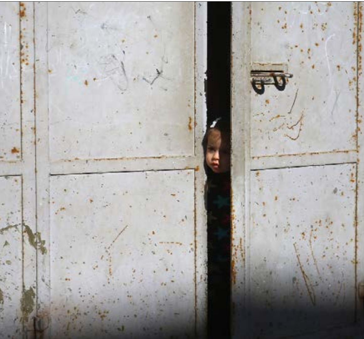
فتاة تراقب تظاهرة ضد انقطاع الكهرباء في غزة امس

لا تزال الشروط التي يضعها محمود عباس لدخول «حماس» و«الجهد» إلى المجلس الوطني في «منظمة التحرير» مرفوضة لدى الحركتين. لكن ذلك لم يمنح جلسات الاستكشاف والحوار. في وقت تتفاقم فيه أزمة الكهرباء في غزة. وتواصل إسرائيل تصعيدها بحق فلسطينيي الـ 48