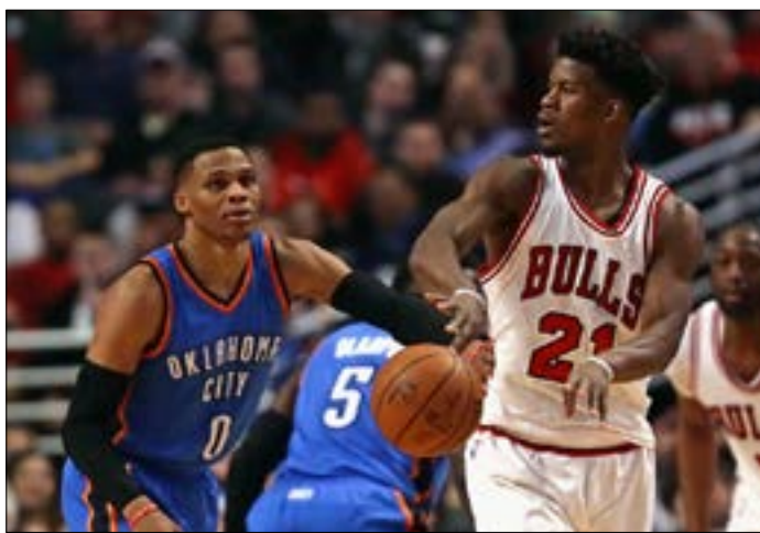
فاز وستبروك في مواجهته أمام باتلر

تصدرت مباراة نيو أورليانز بيلكانز ومضيفه نيويورك نيكس واجهة المباريات أمس في الدوري الأميركي الشمالي للمحترفين في كرة السلة، ليس فقط لأن الأول أسقط الثاني في ملعبه 110-96، بل لأنها كانت حافلة بالعديد من الأحداث اللافتة الأخرى.