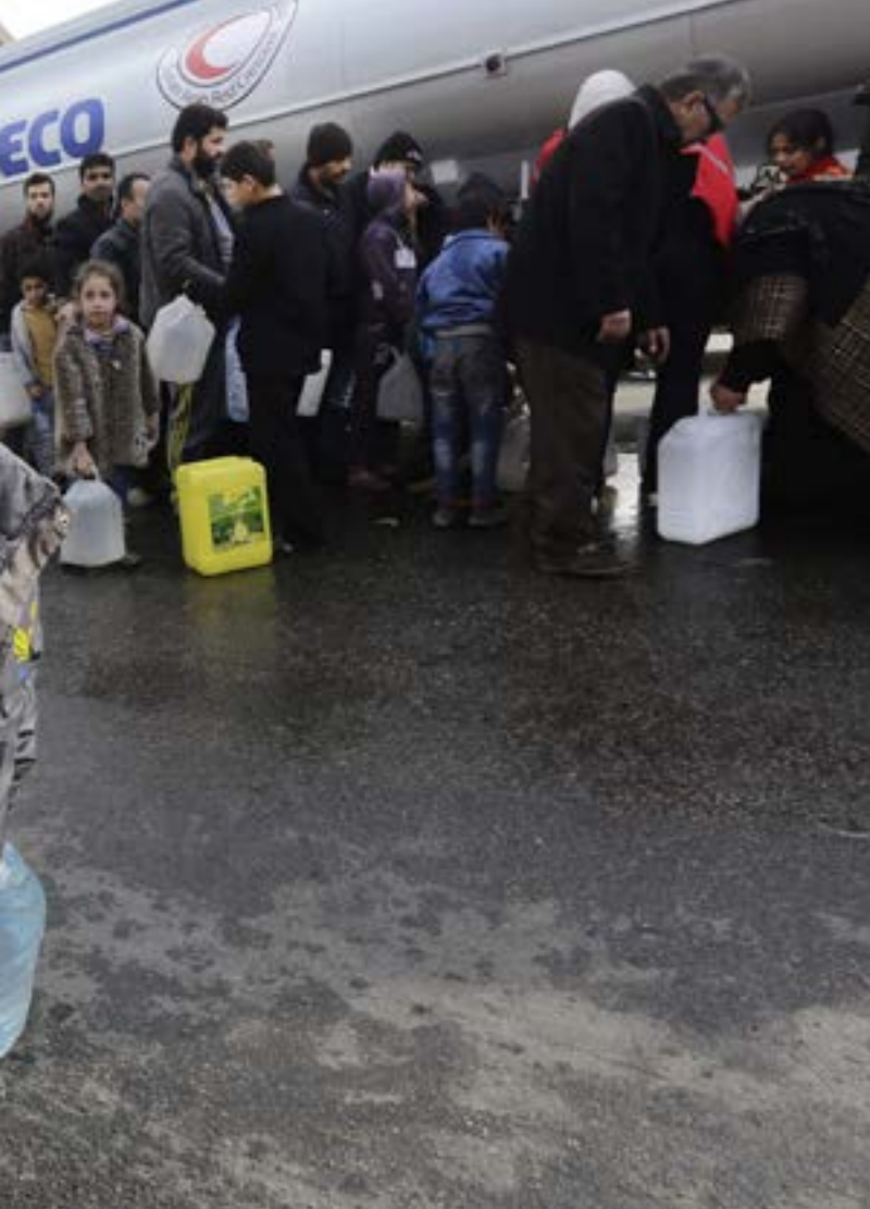
النساء توزيع الهلاك الاحمر السوري المياه لسكان دمشق

وربباً، أيضاً، بإطلاق العملية السياسية، أعلن وزير الدفاع الروسي سيرغي شويغو أمس أنّ قوات بلاده الجوية نفذت مهمتها الرئيسية، وهي تواصل تقليص وجودها العسكري تنفيذاً لقرار الرئيس فلاديمير بوتين. وبالتزامن مع تذكير شويغو بأن جهود بلاده وشركائها سمحت بالتوصل إلى الاتفاق حول عقد لقاء أستانة لتسوية الأزمة، أكد وزير الخارجية سيرغي لافروف ونظيره التركي مولود جاويش أوغلو ضرورة الإعداد المثمر والبناء لمفاوضات أستانة حول الأزمة