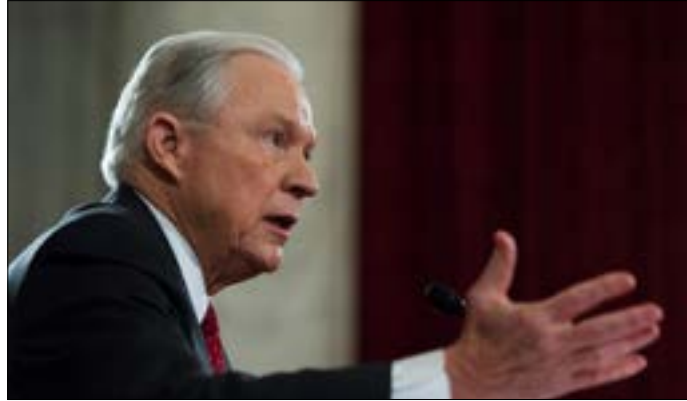
يجسد سيشنز تيار معارضة الهجرة في مجلس الشيوخ

هذه المواقف دون تثبيته في منصب قاضٍ فدرالي، إلا أن وزير العدل المعين، تعهد أمس حماية الأقليات، ولا سيما السود. ووعد بأنه سيقبل بقرارات المحكمة بخصوص زواج المثليين، بعدما كان قد عارضه. وقال إنه لا يؤيد إصدار قانون يمنع المسلمين من دخول الولايات المتحدة.