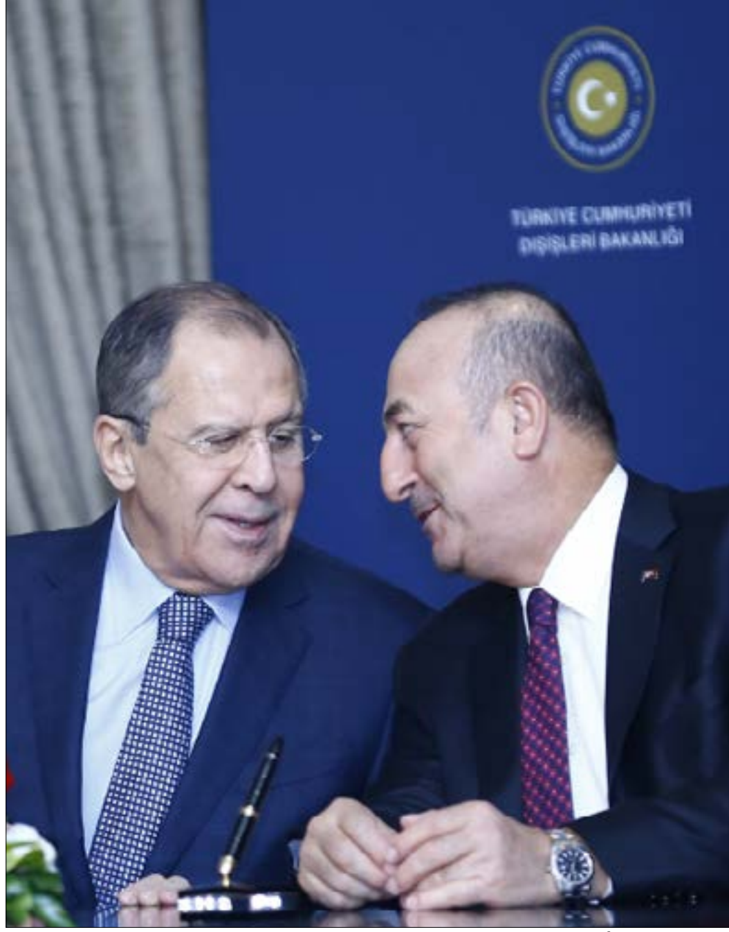
الاستانة لتكون بدلاً من جنيف حيث ستظهر نيات الإدارة الأميركية الجديدة

لكن هل مخاوف إسرائيل، كما يعبر عنها من تل أبيب، قد تدفعها إلى تغيير مقاربتها للساحة السورية؟ وهل تندفع إلى محاولة فرض أو توسيع الخطوط الحمراء ضمن دائرة أوسع، رغم أنها قد تفضي إلى مواجهة؟ أحد السيناريوات المقدرة قد يكون عبر توسيع تل أبيب رعايتها للجماعات المسلحة في الجنوب السوري، المسيطرة على أجزاء واسعة من الحدود، وتبنيهم بالكامل ومحاولة منع هزيمتهم العسكرية في حال اتخذت دمشق وحلفاؤها قراراً باجتماعهم، إلا أنه سيناريو يتطلب مزيداً من الترقب لتصريحات إسرائيل وأفعالها، في المستقبل من الأيام.