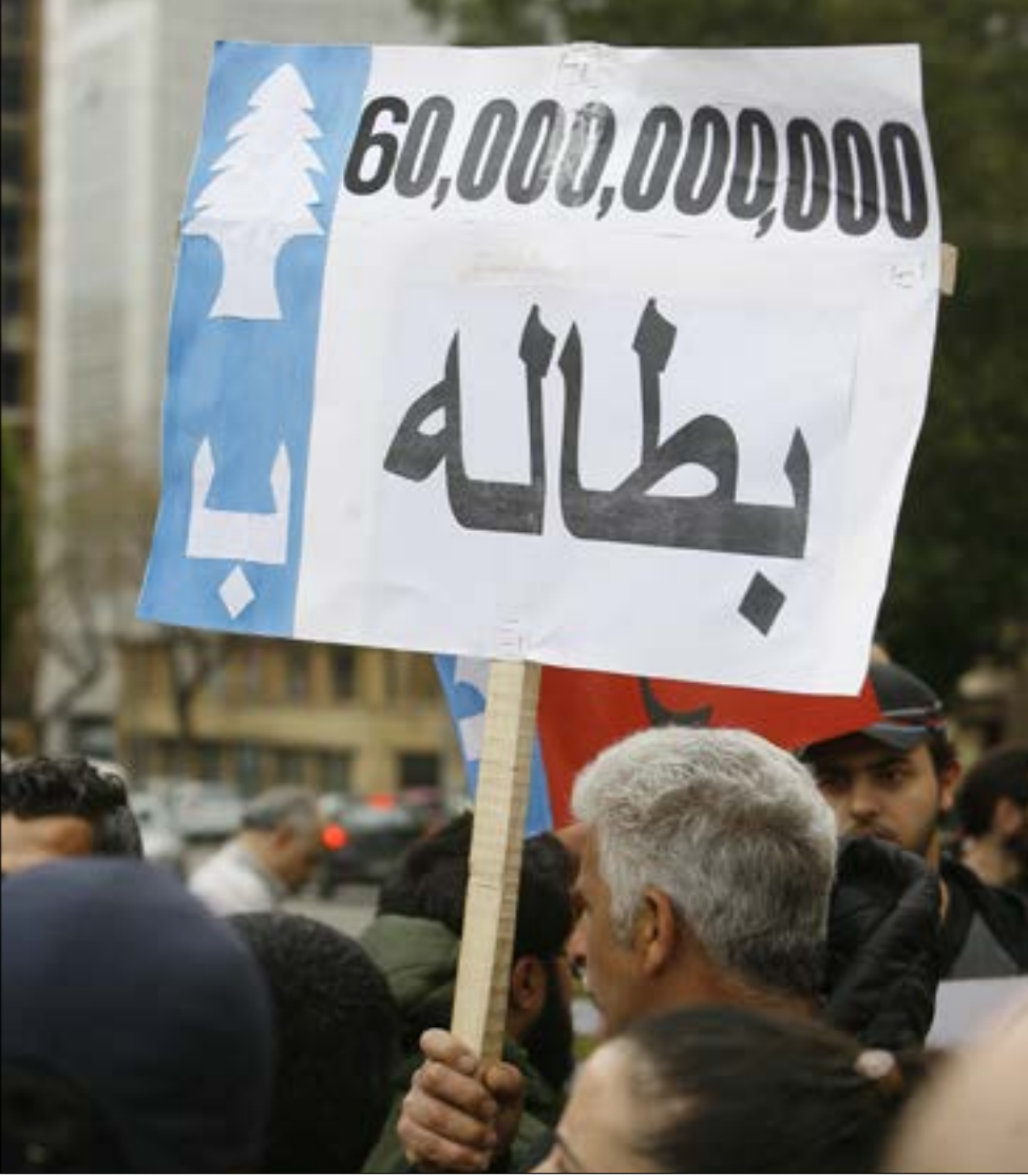
نحو نصف العمال في الاقتصادات الناشئة يعملون في مهن هشة

يقول المدير العام لمنظمة العمل الدولية غاي رايدر: «نحن نواجه مصاعب مزدوجة تتمثل في تلافي الأضرار الناجمة عن الأزمة