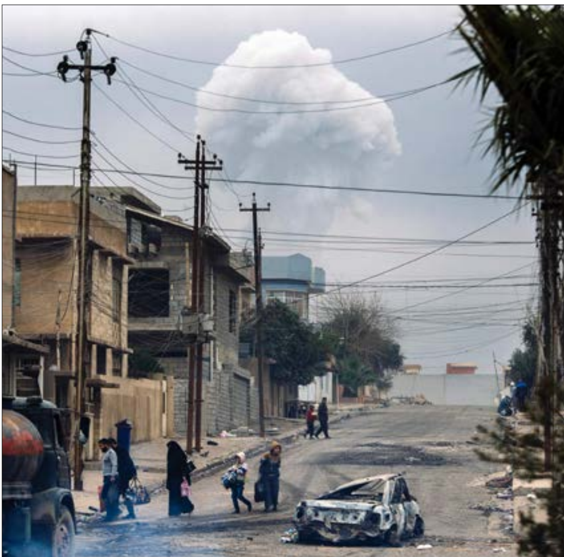
تبدلت حال الأولويات السنية منذ 2014 (الفب)

انعكس تغلغل هذه السردية، التي تبناها السنة العرب بعد 2003، على طبيعة تعاطي الزعماء والقادة السنة في الشؤون السياسية وتمثيل كونهم والدفاع عن مصالحه ومقدراته. وبرغم فتوى «هيئة علماء المسلمين» - أبرز مرجعية سنية في العراق الجديد -