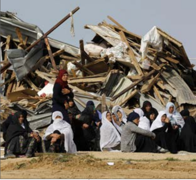
سقط شهيدٌ خلال التصدي لتدمير قرية بكاملها كذلك فنك شرطي للحدو (ا، ب)

مواصلة سياسة الهدم، بينما يمجّد (بنيامين) نتنياهو استخدام الدولة للقوة تجاه المواطنين العرب في أم الحيران وقلنسوة»، مكملاً: «الشرطة الإسرائيلية أثبتت مرة ثانية أنها ترى في الجمهور العربي كله عدواً، وأن من السهل الضغط على الزناد عندما يكون الحديث عن مواطنين عرب، في حين يحظى أفراد الشرطة، مطلقو النار، بالحصانة من جانب وحدة التحقيقات مع أفراد الشرطة». كذلك أوضح المركز الحقوقي من مقره في حيفا، أنه «في أعقاب القرار بإقامة المستوطنة اليهودية باسم حيران على أراضي القرية، طلبت دائرة أراضي إسرائيل إخلاء سكان القرية كافة الذين يصل عددهم إلى ألف نسمة، وهدم منازلهم وطردهم مرة أخرى، وذلك للمرة الرابعة». ومساء أمس، شارك المئات في مظاهرتين احتجاجيتين جانباً شوارع مدينتي حيفا والناصرة المحتلتين، ورفعوا خلالهما الأعلام الفلسطينية واللافتات المنددة بجريمة الهدم. كذلك أغلق المتظاهرون شارع «بن غوريون» في حيفا.