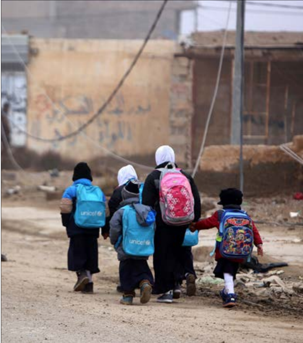
بات السؤال عن التمثيل السني ملحا مع بدء عمليات الموصل