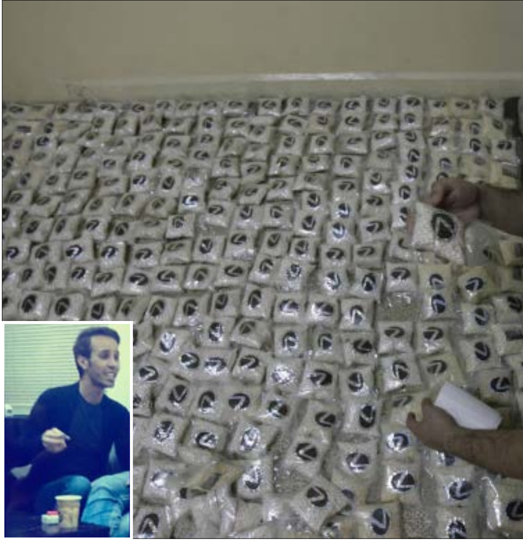
مضبوطات «كبتاغون»، وفي الإطار صورة لـ «أمير الكبتاغون» مسزبة من مكان توقيفه حيث يستقبل «ضيوفاً»