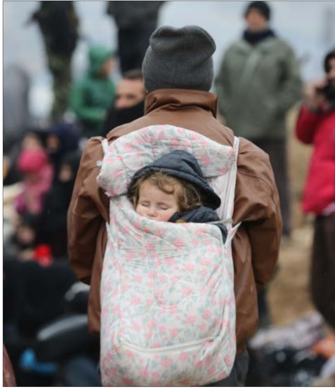
تحدث البعض عن 20 ألف طفل من «مجهولي النسب» في مدينة حلب وحدها