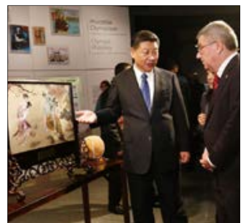
تعهد شي بان تنمية الصين سنوات تقديم العرض

يستكمل اليوم منتدى دافوس الاقتصادي أعماله، بعد يومين من اللقاءات ختم عليها التوتر والقلق من وصول دونالد ترامب إلى البيت الأبيض والخوف من تقدم «الشعبوية» في القارة الأوروبية، فيما لعبت الصين، ثاني أكبر قوة اقتصادية في العالم، دور المطمئن للحفاظ على النظام الاقتصادي القائم. ولطالما لعب منتدى دافوس، الذي أصبح مرادفاً للسوق المفتوح والعولمة، دوراً بارزاً في تقنين وتنويع الأحداث السياسية والاقتصادية في العالم، كونه يجمع النخب السياسية والاقتصادية من رجال الأعمال