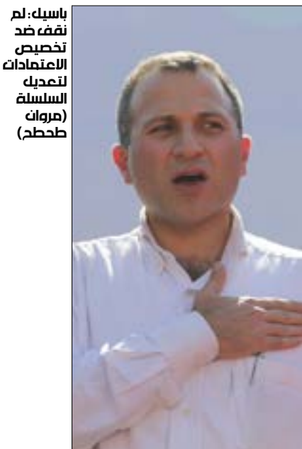
باسمك: لم نفض ضد تخصيص الاعتمادات لتعديل السلسلة (هروان طحطح)

«لا تخطئوا وتفرضوا ضرائب على الفقراء وأصحاب الدخل المحدود، هذه الضرائب لا تفعل شيئاً، هناك أموال تكسدت وتراكت، فوائدهم وأرباح طائلة تجمعت من حساب هذا الشعب ومن تبعه وعرق جبينه ومعاناته، تفضلوا جيّدوا الضرائب من هونيك، تفضلوا أوقفوا هذه المهزلة، عم تحكوا بالإصلاح، مين ضد الإصلاح؟ من هون بيبيلش الإصلاح!».