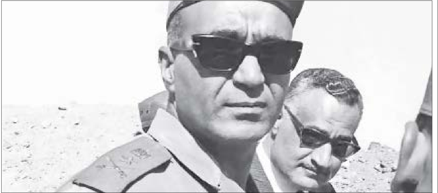
عبد الناصر وعبد المنعم رياض على جبهة القتال

رجال كبار. تحدث الشاذلي عن اجتماع خاص جرت وقائعه عام 1994 في بيت فوزي بضاحية مصر الجديدة حول ما إذا كانت هناك خطة أم لا؟ ضم ذلك الاجتماع الخاص فوزي والشاذلي والبديري.