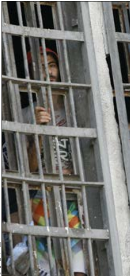
الحريري اقترح على عون النظر في شأن موقوفي طرابلس وعبرا

لم تحدّد بعد الجرائم التي سيشملها العفو. لكن علمت «الأخبار» أنّ رئيس الجمهورية العماد ميشال عون طلب دراسة قضائية عن طبيعة ملفات المحكومين والموقوفين، وفتات الجرائم المنسوبة إليهم. وفي هذا السياق، تؤكد مصادر سياسية وقضائية أنّ عون عازم على إقرار العفو، بعد استكمال الدراسة وتحديد من يمكن أن يشملهم. وكان رئيس الحكومة سعد الحريري قد اقترح على عون النظر في شأن موقوفي طرابلس وعبرا، ودراسة إمكان معالجة وضعهم. وعلمت «الأخبار» أنّ وزير العدل سليم جريصاتي طلب من المدعي العام التمييزي القاضي سمير حمود إعداد مسودة تُصنّف فيها الموقوفون إلى فئات، تُحدّد فيها أنواع الجرائم وعدد الموقوفين والمحكومين فيها. وكشفت المصادر أنّ هناك مجموعة عقد نُؤخّر إنجاز العفو، منها على سبيل المثال لا الحصر، كيفية التعامل مع الموقوفين بقضايا تسهيل تعاطي المخدرات، فهل هم مروّجون، أم أنهم متعاطون؟ ورات المصادر أن هناك وجهة لأنّ يشمل العفو من شاركوا في أي اقتتال داخلي في السنوات الأخيرة (كأحداث طرابلس)، ممن لم تلتطخ أيديهم بدماء لبنانيين، عسكريين ومدنيين. وشبّهت ذلك بالعفو الذي صدر بعد الحرب الأهلية، حين «أصدرنا قانون عفو عن الذين قاتلوا بعضهم بعضاً». ورجّحت المصادر أن يشمل العفو جرائم المطبوعات، مؤكدة أنّه سيستثنى جرائم القتل والاتجار بالمخدرات والجرائم الشائنة (الإغتصاب والتحرش بالأطفال...) ومن تلتطّخت أيديهم بالدماء.