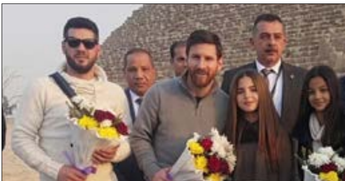
ميسي خلال زيارته لمنطقة الأهرامات

الإنكليزية: «ميسي يصل إلى مصر في حملة للقضاء على فيروس سي». وفي الصحف المصرية كتبت «الأهرام: ميسي يزور الأهرامات ويسأل عن توت عنخ آمون». وأضافت نقلاً عن عالم الآثار زاهي حواس قوله إن «ميسي أعرب عن سعاده بوجوده في منطقة الأهرامات واندهاره بعظمة بنائها وعبقريته قدماء المصريين».