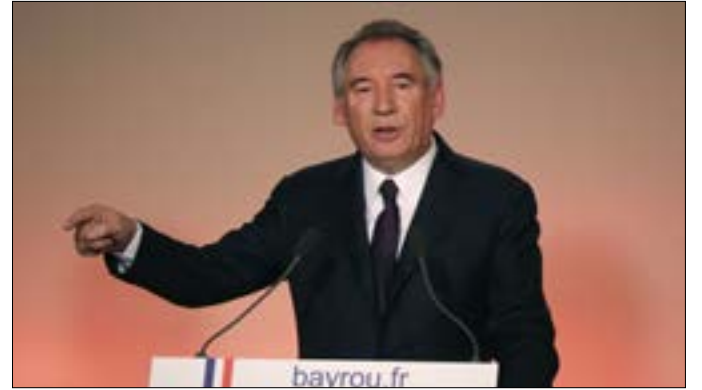
فرنسوا بايرو: يجب ان يشكك برنامج ماكرون تغييرا حقيقياً (ا ف ب)

تقرر بناءً للطلب تصديق محضر اجتماع جمعية الشركاء لشركة (مركز الأوتار الصوتية التخصصي) شركة مدنية المنعقد بتاريخ 2013/12/31 والمقدم في الملف بتاريخ 2017/2/1 وتقرير المصفي ضياء الدين الصروع بحل وشطب وتصفية الشركة شركة مركز الأوتار الصوتية التخصصي (شركة مدنية) من سجل الشركات المدنية في بيروت المسجلة برقم 153/2002 وبالتالي نشر القرار في الجريدة الرسمية وفي