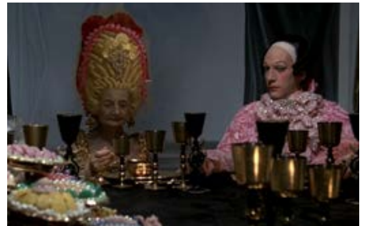
من فيلم «كازانوف» لنيلايني (1976)