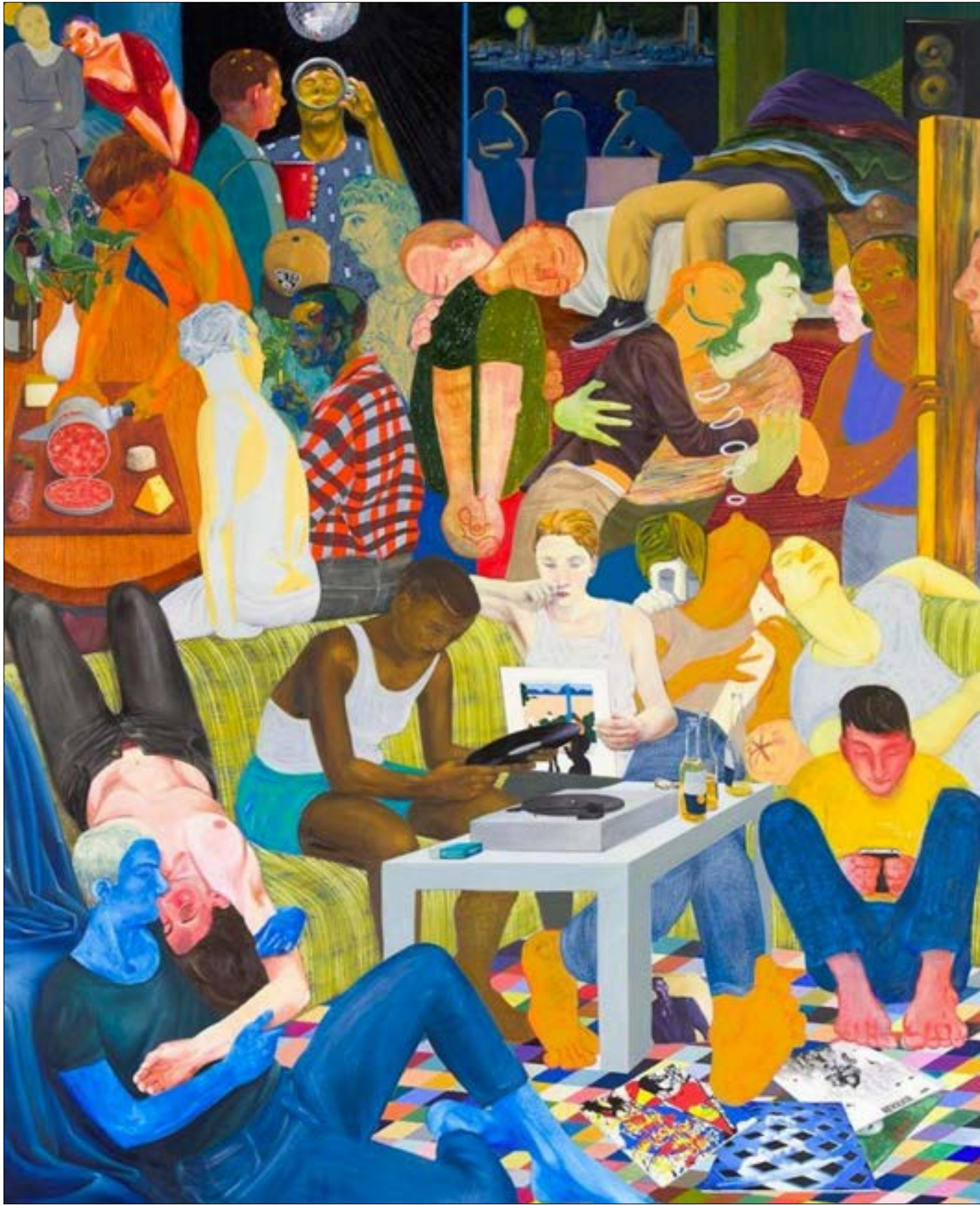
عمل للإميركية نيكول إيزنمت