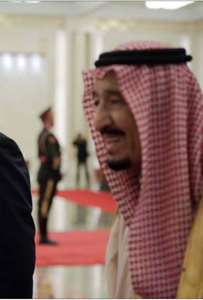
الرئيس الصيني شي جين بينغ يستقبل الملك سلمان في بكين أمس

الحدث شهد الأسبوع الجاري «انفراجات» عدة على مستوى العلاقات السعودية - المصرية المتوترة منذ أشهر. أهمها استئناف شركة «أرامكو» ضخ النفط إلى مصر، المتوقف منذ ستة أشهر، إلى جانب ترحيب عبد الفتاح السيسي ببقاء الملك سلمان نهاية الشهر الجاري في عمان