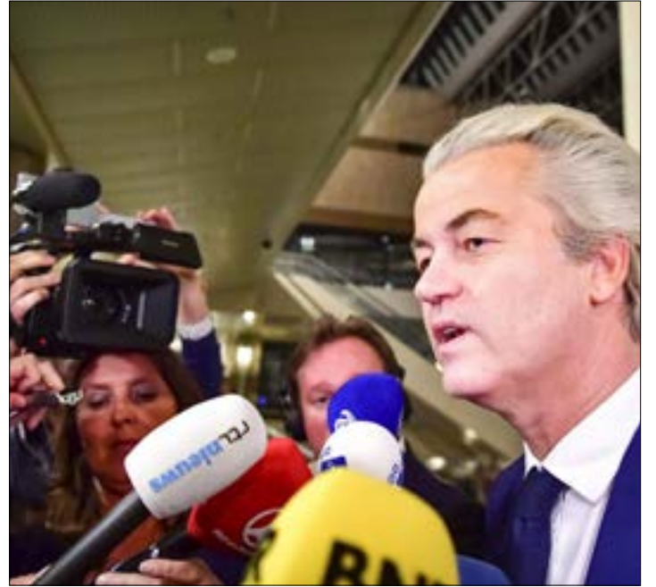
اعرب فيلدرز عن استعداده للمشاركة في ائتلاف حكومي

بدا ارتياح كبير لدى قادة الدول الأوروبية بعد إخفاق «حزب الحرية» بقيادة عبرت فيلدرز، بالفوز في الانتخابات التشريعية الهولندية، ومحافظة الليبراليين بقيادة رئيس الوزراء مارك روتي، على موقعهم كأكبر حزب في البرلمان.