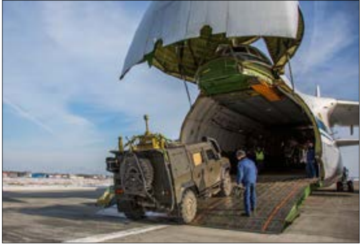
عزّزت موسكو وحدتها لإزالة الألغام من تدمر

وبالتوازي مع انتهاء الجولة التي فشلت في دفع الطرفين السوريين نحو مرحلة جديدة من وقف إطلاق النار، كان لافتاً ما أعلنه الرئيس الروسي فلاديمير بوتين، خلال مراسم تسليم أوراق الاعتماد من سفراء أجنبية جدد في موسكو، إذ قال