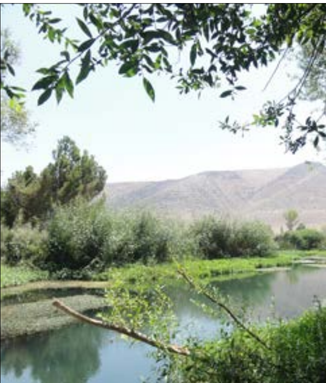
في حمى كفرزبد

المجتمعات المحلية في مناطق الحمى من منظار اجتماعي واقتصادي وطبيعي». وقد تقدمت الجمعية كثيراً في طرح ثلاثة مشاريع من أصل 18، هي بمثابة حمى طبيعية عملت جمعية SPNL على إنشائها وتطويرها واستدامتها بالشراكة مع المجتمعات المحلية. وهذه الحمى هي: عنجر - كفرزبد في البقاع الأوسط، الفاكية في البقاع الشمالي، وعين زبدة خربة قنفار في البقاع الغربي. يهدف هذا المشروع إلى تخفيف الضغط الاجتماعي والاقتصادي الناتج عن أزمة النزوح من سوريا إلى لبنان، من خلال تحسين ظروف المزارعين والرعاة وصيادي الأسماك، وتشجيع وإحياء الحرف اليدوية التقليدية والتعاونيات النسائية. وتشمل أهداف المشروع التخطيط والدعم الاقتصادي للمنتجات في مناطق الحمى.