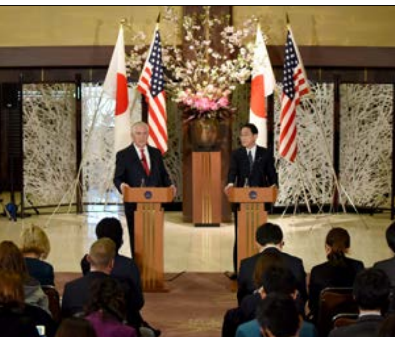
أعلنت تيلرسون أنه سيحث بكين على لعب دورها في كبح جارتها بيونغ يانغ

واشنطن، هو بدء الأخيرة بنشر منظومة الدفاع الصاروخية «ثاد» في كوريا الجنوبية، الأمر الذي أعلنت الصين معارضتها الشديدة له، وحذرت من القيام به، موضحة المناورات العسكرية الأميركية - الكورية الجنوبية المشتركة، لمنع حدوث مواجهة خطيرة، لكن واشنطن رفضت وقف تلك المناورات. وما يشعل التوترات أكثر بين بكين