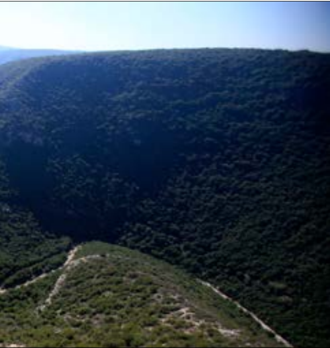
وادي زبقين قبل أن تدمره الطريق

وحشرات الماء سلاحف المياه العذبة وحنكليس نهري وأصناف الضفادع وسرطانات المياه العذبة والأسماك، تعيش في مستنقعات مياه الينابيع. من الحيوانات اللاحمة التي رصد وجودها في الوادي، الضباع المخططة والثعالب الحمراء والنيص والخنزير البرية والغريز والقطط البرية وابن أوى الذهبي والطبسون أو الوبير الصخري (ذكر شهود عيان بأنهم شاهدوا ثلاثة ذئاب).