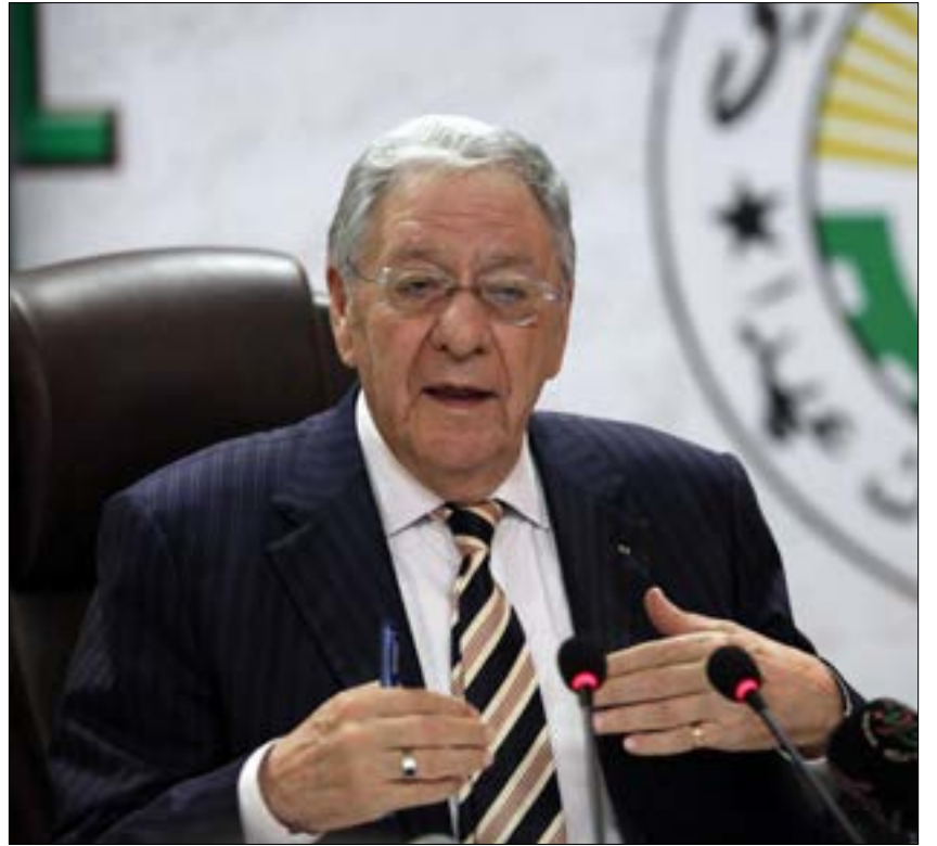
يُدرّك ولد عباس أنّ خلافة عمار سعيداني ليست بالأمر الهين (عن الويبر)

تزامن وصول الأمين العام الجديد على رأس الحزب الحاكم في الجزائر قبل نحو خمسة أشهر مع مرور البلاد في ظرف سياسي حساس، يدوّات الخطا ممنوع خلاله، وخاصة أنّ مؤشرات الصراع بين أجنحة السلطة تكاد تظهر واضحة