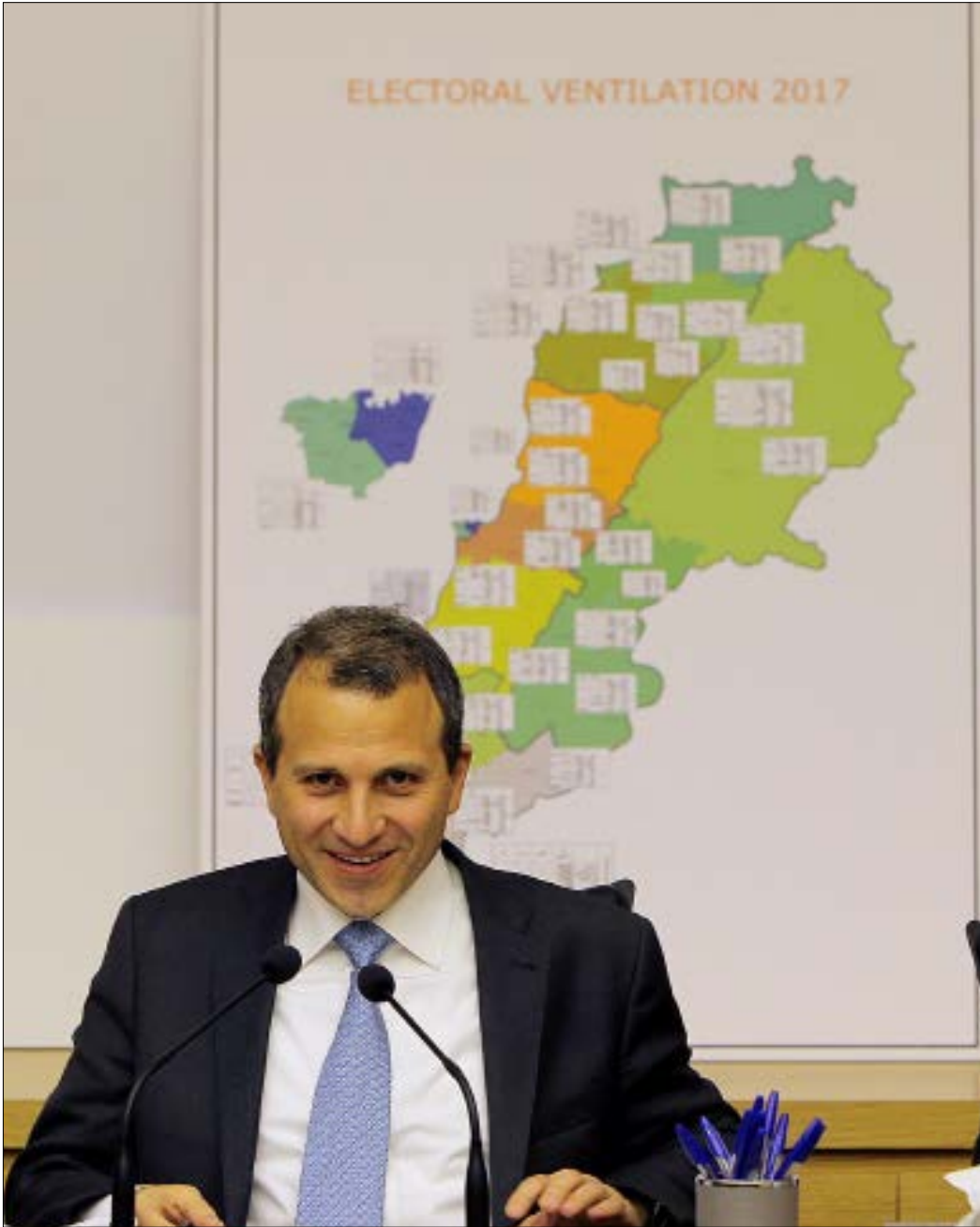
التيار: رفض كل المشاريع بعيدنا إلى طرحة الأساس الأرثوذكسي، أو نسبية كاملة في 14 دائرة مع ضوابط

بنتيجته بيان عن هيئة الشوف في التيار الوطني الحرّ أمس شدّد على أنه «في الذكرى 40 لاستشهاد المعلم كمال جنبلاط، تؤم الشوف الأحد المقبل وفود شعبية للإحتفال بهذه المناسبة، وبهم التيار الوطني الحر في الشوف أن يؤكد على احترامه الكامل لكل رجالات الشوف السياسية والفكرية والأدبية، وهو يشدّد على العلاقة المميزة التي تربطه ببني معروف والحزب التقدمي الاشتراكي». وأضاف أن «التيار يعتبر وحدة الجبل من أولى أولوياته والمصالحة تركزت بصورة نهائية بالزيارة التي قام بها رئيس التيار الوطني الحر آنذاك العماد ميشال عون، واللقاء الذي جمعه بالنائب وليد جنبلاط في المختارة». وطالب التيار «المحازبين والمناصرين والمؤيدين بعدم الانجرار إلى المساجلة أو الرد على صفحات التواصل الاجتماعي، ومسح كل ما من شأنه الإساءة إلى العلاقة المميزة والعيش المشترك، بيننا وبين جميع إخواننا في الشوف إلى أي جهة أو طائفة انتموا».