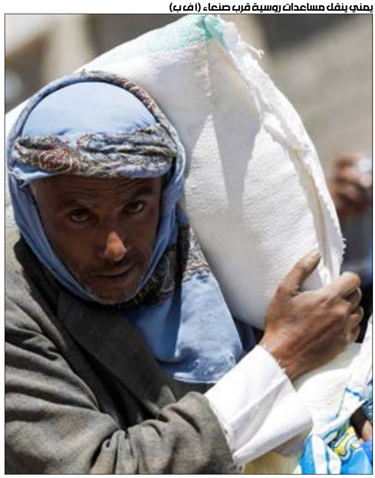
يعني ينقل مساعدات روسية قرب صنعاء

جراء ذلك، دعت «العفو الدولية» البرازيل إلى الانضمام إلى «الاتفاقية الدولية