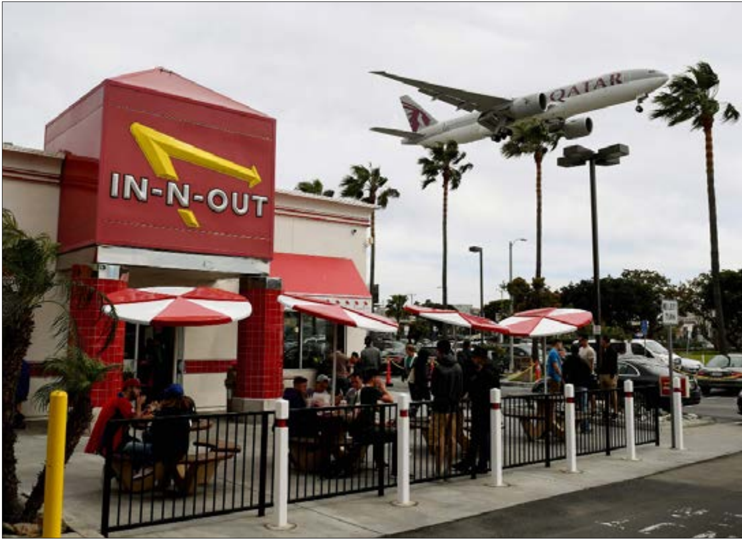
اعتبرت بعض الصحف الأميركية ان الاجراء «عنصرياً» ضد شركات الطيران «المسلمة» (اف ب)

لا ينبئ الحظر الإلكتروني الأميركي الجديد، فحسب، بخسارات كبرى لشركات الطيران المتمركزة في الخليج والشرق الأوسط، بل قد يكون بداية لسياسة حمائية جديدة في أميركا تراهب، يمثّل الحظر - الذي تسربك باعتبارات أمنية - أولى خطواتها. الشركات الخليجية «المعولمة»، التي تعتمد على الأسواق الغربية ونقل الركاب بين القارات، قد تكون الضحية الأولى لهذا العهد الجديد