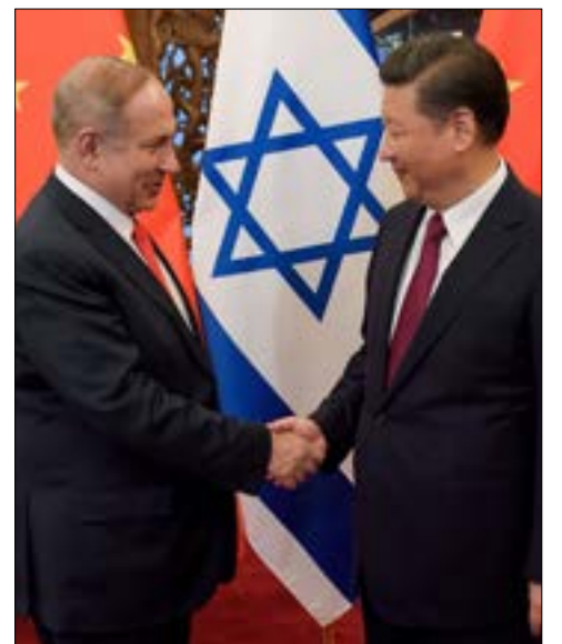
جره التوقيع على 25 اتفاقية

وقّعت الصين وإسرائيل، الأسبوع الجاري، على 25 اتفاقية تعاون خلال زيارة لرئيس الحكومة الإسرائيلية، بنيامين نتنياهو، لبيكين استمرت يومين. واتفق الجانبان على تسريع إقامة منطقة تجارة حرة بين الصين وإسرائيل. في هذا السياق، أوضح وزير الاقتصاد الإسرائيلي، إليي كوهين، الذي رافق نتنياهو، أن «الهدف في السنوات الخمس المقبلة هو زيادة حجم التجارة مع الصين ليصل إلى 20 مليار دولار». ووفق المعطيات الحالية، تبلغ حجم الصادرات الإسرائيلية إلى الصين نحو ثلاثة مليارات دولار سنوياً. وبالنسبة إلى إسرائيل، تشكل العلاقات الاقتصادية مع الصين، قدرة نمو لافتة، وخاصة أن تل