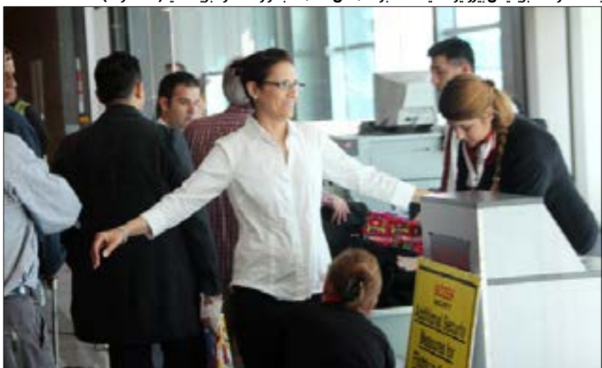
بدأت شركة «بريتيش إيرويز» في اسطنبول امس، العمل بقرار الحظر البريطاني

سيستمر، إلى الأقل، حتى تشرين الأول/أكتوبر 2017 وقد يُجدد. كذلك إن «أسوشيتد برس» قد نقلت عن مسؤولين أميركيين وبريطانيين - لم تسهم - أن الحظر ليس متعلقاً بأي تهديد مباشر أو معلومة جديدة، بل هو نتيجة «تقدير مستمر لوضع الأخطار».