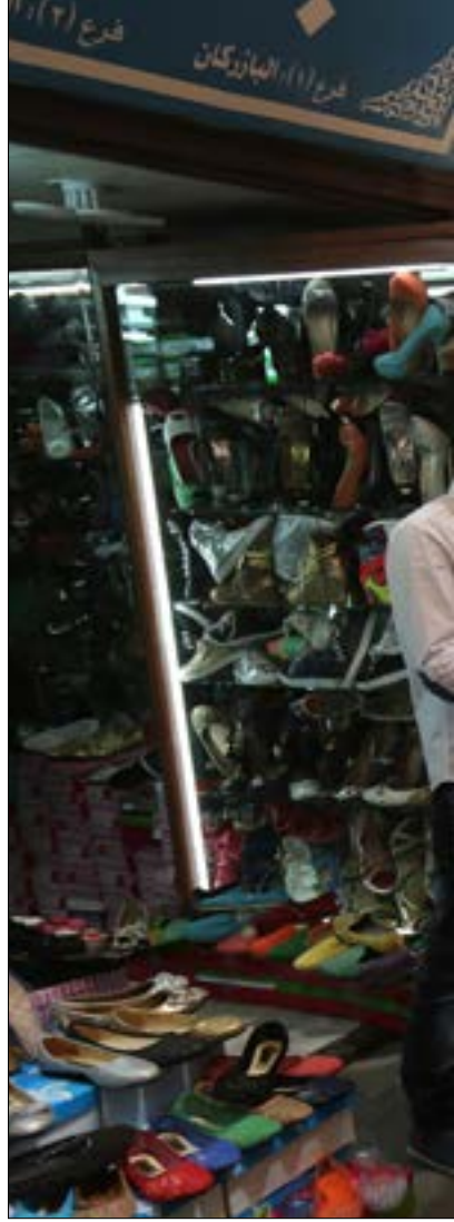
يسيطر المحتكرون على 60% من المبيعات في الأسواق اللبنانية (مروان طحطح)

هذه الأرقام تعتبر عن أرباح فاحشة يجنيها عدد قليل من المستوردين المحتكرين، وهؤلاء الذين يتفنون في الأساليب التهرب من الرسوم الجمركية وإغراق الأسواق بالبضائع الفاسدة، يتفنون أيضاً في أساليب التهرب من الضريبة على القيمة المضافة والتهرب من ضريبة الأرباح المعروفة واحد للضرائب والأخر لتراكم الثروة. يقف المحتكرون إلى جانب المصرفيين والمضاربين العقاريين سداً منيعاً ضد أي تعديل ضريبي يهدف إلى إصلاح الخلل، ولو بشكل طفيف. في حساب بسيط لنتائج عام 2016، يتبين أن مجمل ضرائب الأرباح ورؤوس الأموال والأرباح (ما عدا الضريبة على الأجور ورسوم التسجيل العقاري) بلغ 1,8 مليار دولار فقط، وهذا الرقم النهيل، بالمقارنة مع ما تجنيه الاحتكارات والمصارف والمضاربين العقاريين، يكشف طبيعة الصراع الدائر اليوم، فالرابحون باختصار يريدون أن يعظموا أرباحهم باستمرار من دون أن يتحملوا أي عبء ضريبي.