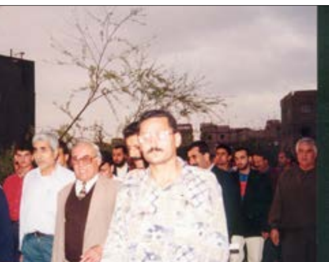
من تظاهرة أمام محرقة الصرورية التي احترقت العام 1997

وذلك بالرغم من الملاحظات الموضوعية التي قدمتها وزارة البيئة بهذا الخصوص، فضلاً عن تلك التي قدمها باحثون ونشطاء في هذا المجال.