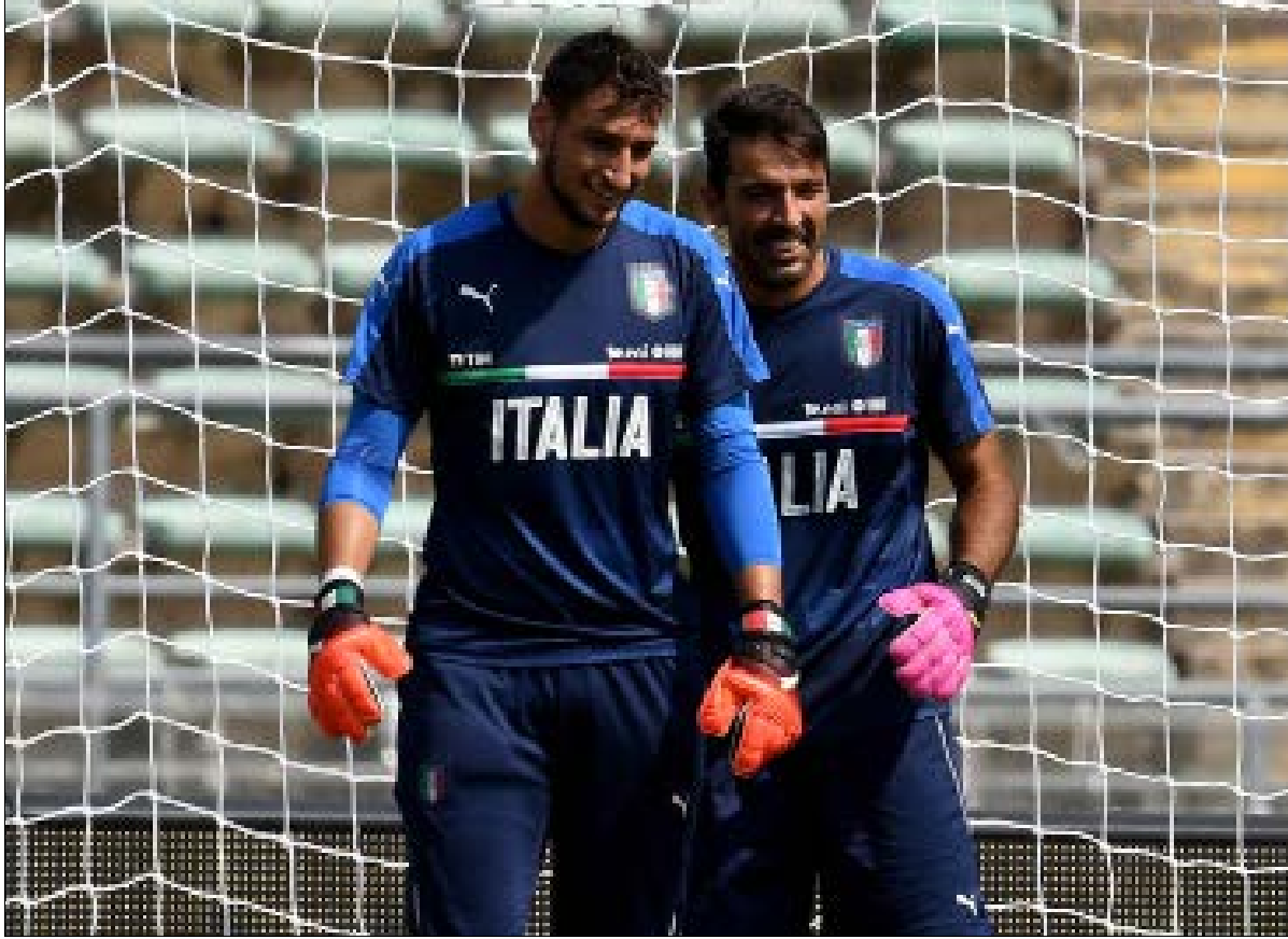
دوناروما بوفون خبر خلف لخبر سلفه

السير على خطاه، يبدو مفيداً جداً له نظراً إلى الخبرة الكبيرة والتاريخ الحافل لصاحب الـ 39 عاماً، إذ إن ما ينقص الحارس الشاب حالياً هو الخبرة تحديداً. في السابق، كانت مسألة إصابة بوفون قبل أي بطولة أو خلالها تصيب الطليان بالهلع، إذ إنه يمثل نصف قوة "سكوادرا أتزورا" دون مبالغة، أما الآن، مع صعود نجم دوناروما، فإن الإيطاليين يشعرون بالاطمئنان، إذ بوجود هذا الشاب فإنهم واثقون بأن مرماهم سيبقى بأمان.