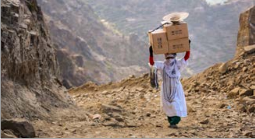
معاناة الشعب اليمني وصمة عار في سجل المنظمة الدولية وكل من صمت

الشؤون الإنسانية في اليمن في البيان، إن «النزاع الشديد في اليمن منذ آذار/ مارس 2015 تسبب بأزمة إنسانية واسعة، وأن ما يقدر بـ 18,8 مليون شخص بحاجة إلى شكل من أشكال المساعدة سواء على الصعيد الإنساني أو على صعيد الحماية». وأكد البيان أن ارتفاع مستويات انعدام الأمن الغذائي وسوء التغذية والنزوح، بالإضافة إلى تراجع الخدمات الصحية والاجتماعية تسبب في التأثير السلبي على حياة الملايين. واعتبرت الأمم المتحدة أن انهيار شبكات الأمن والحماية الاجتماعية والاقتصاد المتعثر يتطلب القيام بإجراءات فورية لتفادي وقوع كارثة إنسانية أكبر في اليمن. وأشار البيان إلى أن الأمم المتحدة والشركاء الدوليين والمحليين في مجال العمل الإنساني يهدفون خلال العام الجاري للوصول إلى 12 مليون شخص بمساعدات إنسانية مباشرة. فهل يكفي كل هذا الذي تشير له الأمم المتحدة؟ وهل يحتاج إلى شرح وتفسير، أم يليى وضوح الأخطار وعواقبها من تلك الوقائع القاسية؟! درعاً للكارثة أو استباقاً لها ناشدت الأمم المتحدة جميع الدول والمنظمات لجمع 2,1 مليار دولار لمساعدة نحو 12 مليون يمني يعانون بشكل مباشر جراء الحرب القائمة في البلاد، منذ ما يقرب من عامين، فضلاً عن تدهور حاد في مناحي الحياة كافة، وعن أوضاع إنسانية صعبة جعلت معظم السكان بحاجة إلى مساعدات، مع تسبب الحرب بمقتل وجرح الآلاف المواطنين.