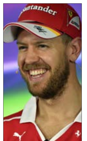
فيتيك خلاك الموتير الصحافي في حلبة "ألبرت بارك"

وكشف هاميلتون عشية التجارب الحرة للسباق، أنه يأمل حصول صراع متقارب طوال الموسم مع فيتيل، مشيراً إلى أن فيراري سيشكل الخطر الأكبر على مرسيدس الذي هيمن على