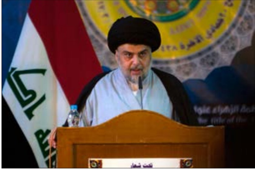
تقول مصادر إن الصدر سوف يشارك في التظاهرة (أضرب)

إلى الاستفسار من مصادر التيار عن صدقيتها، إلا أن المحاولات لم تفلح لنفي أو لتأكيد الحوار. غير أن مصدراً في "الإعلام المركزي" للتيار أكد وجود حوار كهذا، لكنه لم يكن 'يعلم بوجود تصريحات كهذه ودعوات فيه'.