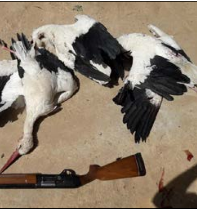
من الجرائم المرتكبة بحق طيور اللقلق المهاجرة