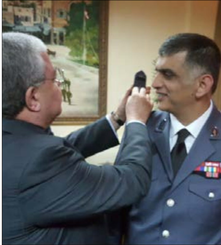
عقّم على ضباط معينين عدم التجاوب مع طلبات الحريري وعلمت