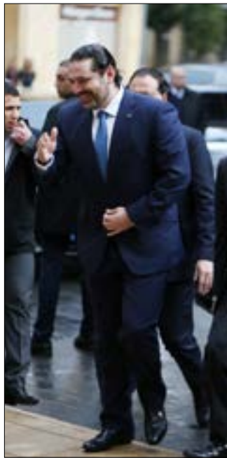
الحريري لم يستجب للمناشدات المصروفين