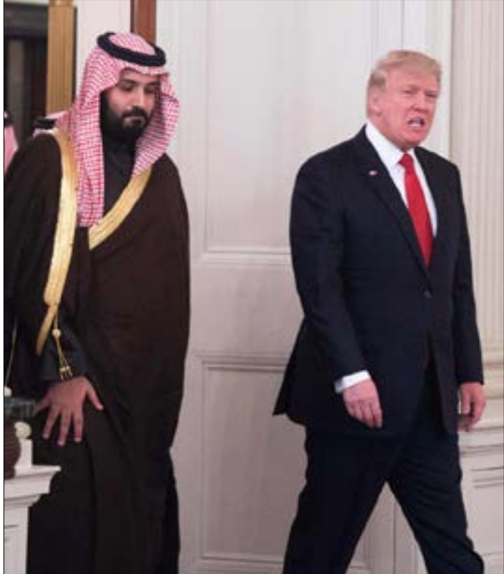
أشار الحكيم إلى أن عشقي أولويات ابن سلمان مواجهة إيران

أشار أيضاً في حديثه إلى مخاطبته، إلى أن «دوركم التاريخي في منطقتنا سيتأكد، وذلك في إطار مبادرة السلام العربية». وقال: «ستعزز هذه العملية تحقيق السلام مع إسرائيل في ظل المبادرة السعودية للسلام». إلا أن الأهم برأي الحكيم، وربما برأي عدد كبير من المسؤولين السعوديين، هو أنه «إذا ما تحقق ذلك، فإنه سيوفر المنطقة من النيران التي يغذيها النظام الإيراني، ويسمح أيضاً للمملكة العربية السعودية بأن تتشارك علناً مع التقدم التكنولوجي الكبير الذي تقدمه إسرائيل».