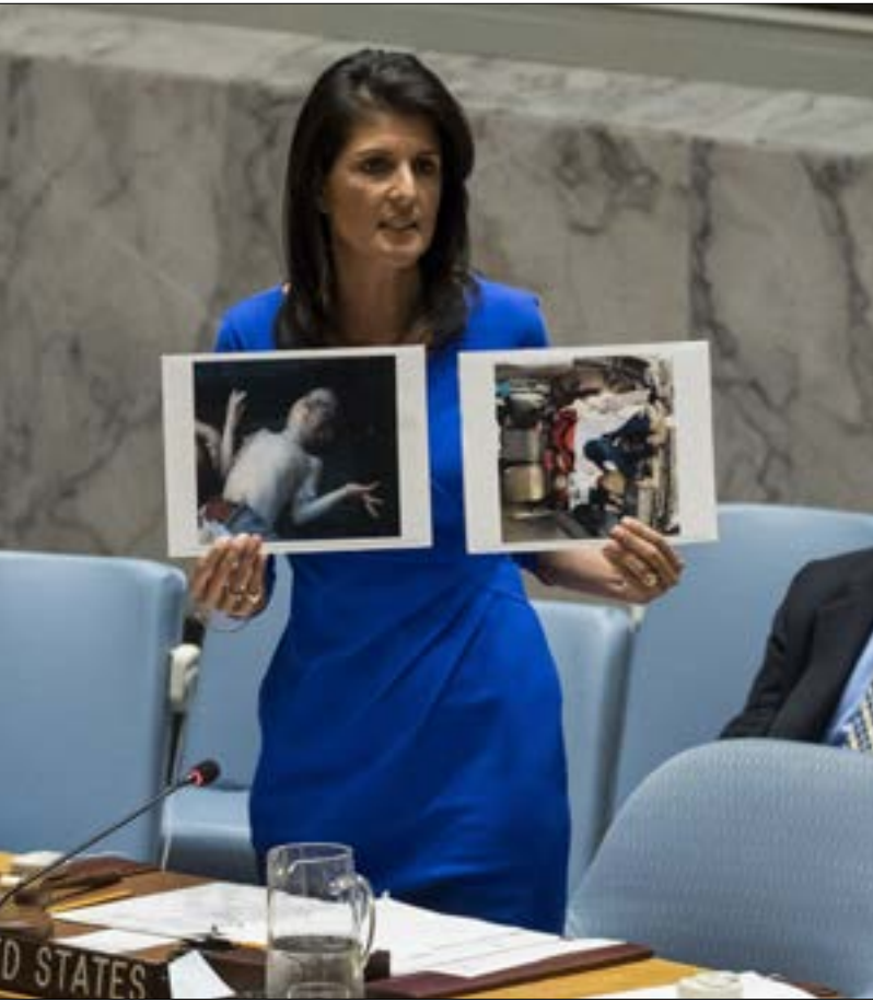
المخت هالي إلى ان بلادها سبق لها ان تحركت «مفردة» خارج إطار الأمم المتحدة

شهد مجلس الأمن الدولي جولة جديدة من الاتهامات المتبادلة بين روسيا والدول الغربية، في خلال الجلسة المخصصة لنقاش الهجوم الذي شهدته بلدة خان شيخون قبل يومين. ومع بقاء مشروع قرار صاغته واشنطن وحلفاؤها خارج أجنحة الجلسة من دون عرضه للتصويت، ذكرت المندوبة الأميركية بتاريخ بلادها من التدخلات المنفردة خارج إطار الأمم المتحدة، بينما خرج الرئيس الأميركي ليؤكد أن «الهجوم تجاوز العديد من الخطوط»