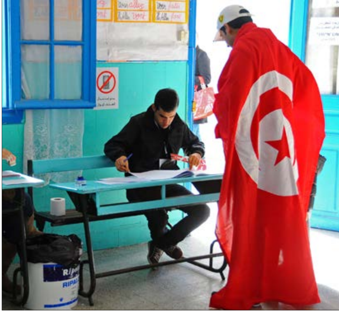
يحد الممولون من حرية الفاعلين المدنيين الجدد