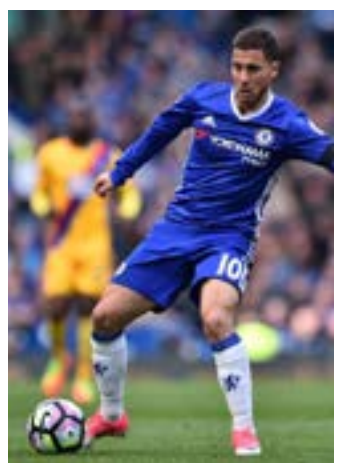
يتردد اسم هازار للانتقال إلى النادي الملكي

أحرزت ثانوية بر الياس ومركز عمر المختار المركز الأول في بطولة البقاع بكرة القدم، في إطار دورة الألعاب الرياضية المدرسية التي تنظمها وحدة الأنشطة الرياضية في وزارة التربية والتعليم العالي، وفي النتائج: 1999-2000: فازت ثانوية بر الياس على ثانوية مار أنطونيوس البدواني (0-2). 2001-2002: فاز مركز عمر المختار على ثانوية مار أنطونيوس البدواني بركلات الترجيح (6-5). بعد تعادلهما في الوقت الأصلي (1-1). وفي جبل لبنان، اختتمت بطولة جبل لبنان بكرة القدم المصغرة (مواليد 2004-2005)، التي أجريت على ملعب بئر حسن، حيث حلت مدرسة الشويفات الدولية أولى لدى الذكور أمام مدرسة الشانفيل ديك المحدي، ولدى الإناث، حلت مدرسة القديسة لويزا عجلتون أولى أمام مدرسة القليين الأقدسين.