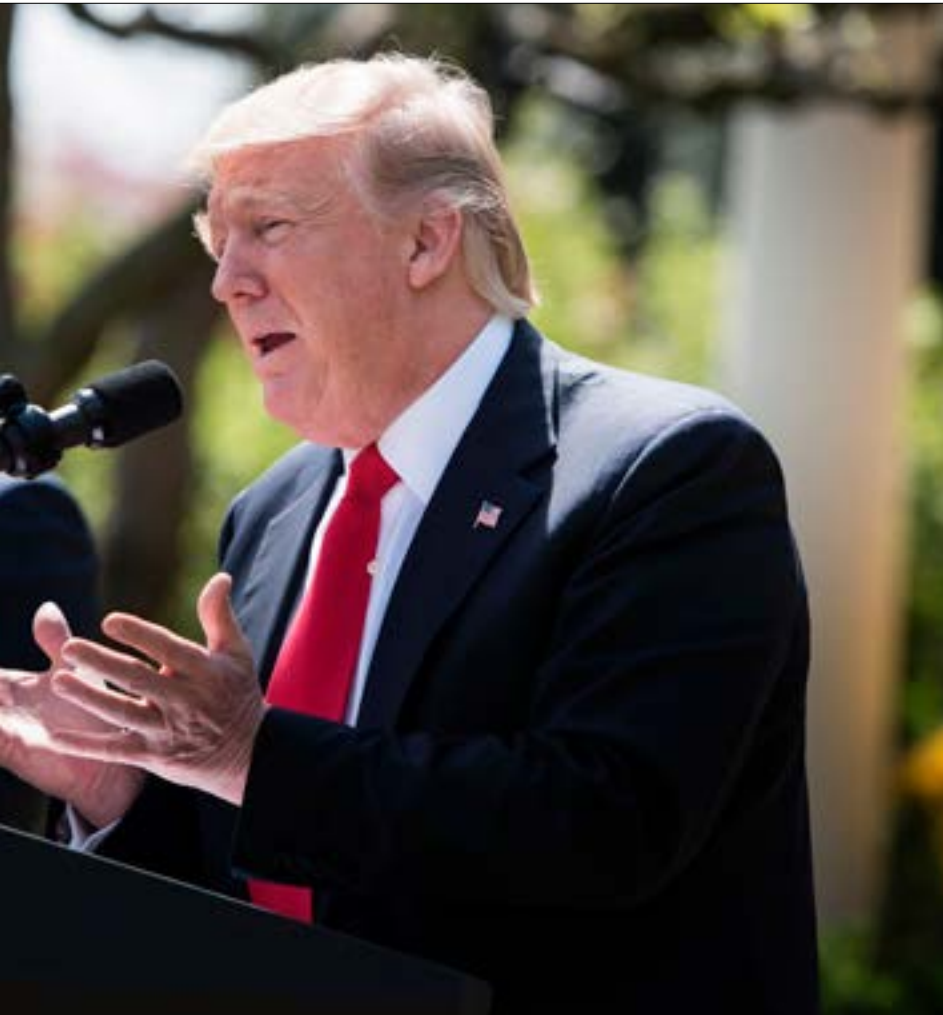
عبدالله: مهمة الأردن تسهّل المناخ بين الاسرائيليين والعرب لتتقدم معا

الحدث باتت دروب واشنطن تقود أكثر من أي وقت مضى ليس إلى تقارب أو «تطبيع» بين عواصم عربية وتلك أبيض فحسب. بل إلى ما هو أبعد: وضع «السلام بين الشعب الفلسطيني وإسرائيل» على سكة التنفيد. وذلك في ظل وجود إدارة أميركية تبدو أنها تدفع بشدة أكبر في هذا الاتجاه. مقارنةً بسابقتها