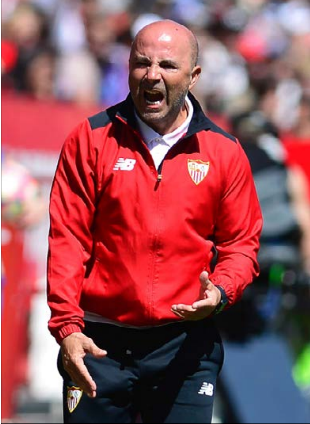
ترك سامباولي بصمة واضحة منذ وصوله إلى الليغا

النادي وجد خليفته، وكأنه أيضاً يعطي دعماً للمدرب القادم قبل رحيله، ويرمي مسحة رضاه عليه. كذلك، كان سامباولي يغازل مراكز القوة في "البرسا"، فهو سبق أن صوّب كلامه باتجاه مواطنه النجم ليونيل ميسي، مشيراً إلى أنه يرغب في تدريب "البلانكوغراننا" ليستمتع بوجود "ليو" يومياً. سامباولي ذكي على أرض الملعب في حساباته الفنية، وذكي أيضاً بعيداً منها، فهو يدرك بأن رضى ميسي أمر لا بد منه لكي يحمي نفسه في حال قدومه إلى "البرسا"،