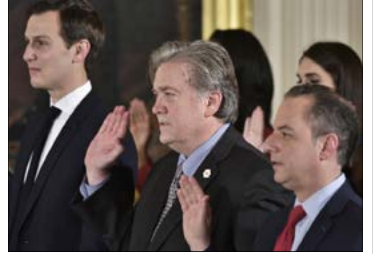
بانون بين صهر ترامب ورئيس موظفي البيت الابيض (أ، ب)