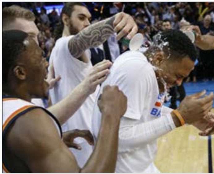
زملاء وستبروك يهنئونه على طريقتهم

وحذا ليبرون جيمس حذو وستبروك، محققاً "التريبيل دابل" الـ54 في مسيرته والـ12 هذا الموسم، لدى قيادته كليفلاند كافالييرز