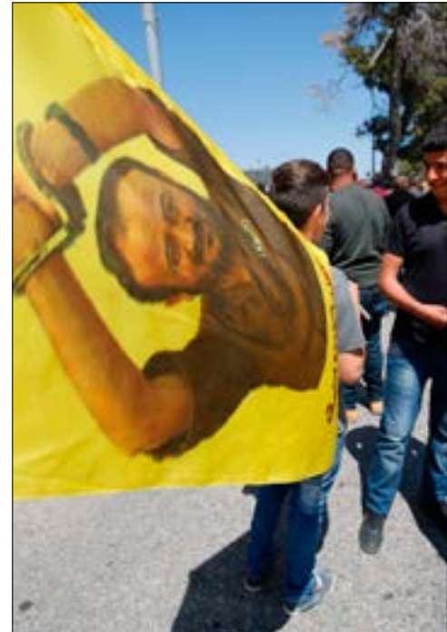
إضراب أيلول 1992، تحول إلى ما يشبه الانتفاضة في الشارع

ما يسعى إلى تحقيقه من خلال حرب معنوية خبيثة يشنها ضدهم منذ اليوم الأول. يعتمد، كما يفعل حالياً، إلى عزلهم أولاً عن العالم الخارجي من خلال قطع كل وسائل التواصل مع هذا العالم، بما في ذلك منع زيارات المحامين، ثم يبادر إلى تشتيت الأسرى المضربين بين السجون، وخلطهم بأسرى آخرين غير مضربين، والأهم، اقتياد قيادات الإضراب إلى العزل الانفرادي بحيث يبقى الأسرى المضربون من دون إدارة وتوجيه.