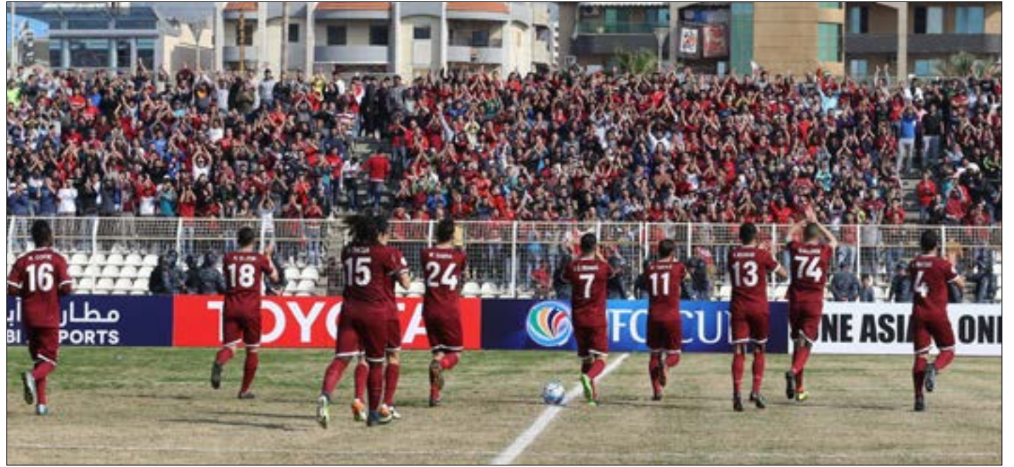
يتعمد بعض الجمهور القيام بأعمال تجلب العقوبات على النادي