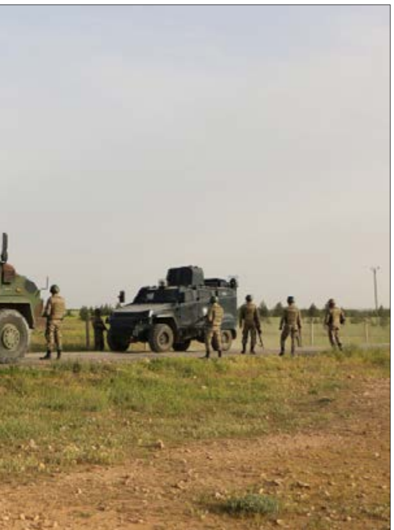
حضمت القوات التركية بتمزيقات إلى الحدود مقابل مدينة تك ابيض (الناضول)

إلى وجود 503 أفراد من القوات في سوريا، و5262 في العراق، غير أن «مئات من الأفراد المنتشرين في البلدين لم يسجلوا ضمن هذا العدد بسبب طبيعة مهماتهم المؤقتة».