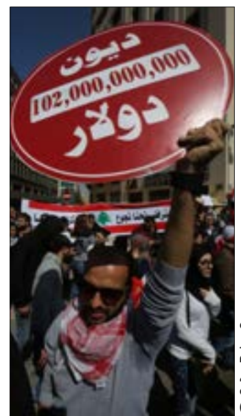
تضمنت النشرة انتقادات غير مسبقة للنموذج الاقتصادي (مروان حطّط)

فقط، بل يجب أن يكون هذا الخروج أمناً ولا تكون له مفاعيل سلبية على الناس. إزاء التعامل مع هذه القضية، تتحدد الإجراءات، وبالتالي فإن الأولويات اليوم هي لاتخاذ إجراءات احتياطية كي نكون أكثر استعداداً لعملية الانتقال إلى نموذج مختلف أو لعملية الصدمة التي سنتنتج من تغيير النمط أو لعملية التصحيح المطلوبة. هذا النظام أو النموذج يمنع عن الناس أبسط الخدمات العامة ليس لأنه غير قادر أو لأن القيميين عليه أغبياء ولا يمكنهم التوصل إلى حلول، بل لأنهم لا يريدون. على سبيل المثال، هناك عشرات آلاف الأوراق من الدراسات لإنشاء نقل عام، لكن النموذج يريد أن يبقى القطاع العقاري ناشطاً على