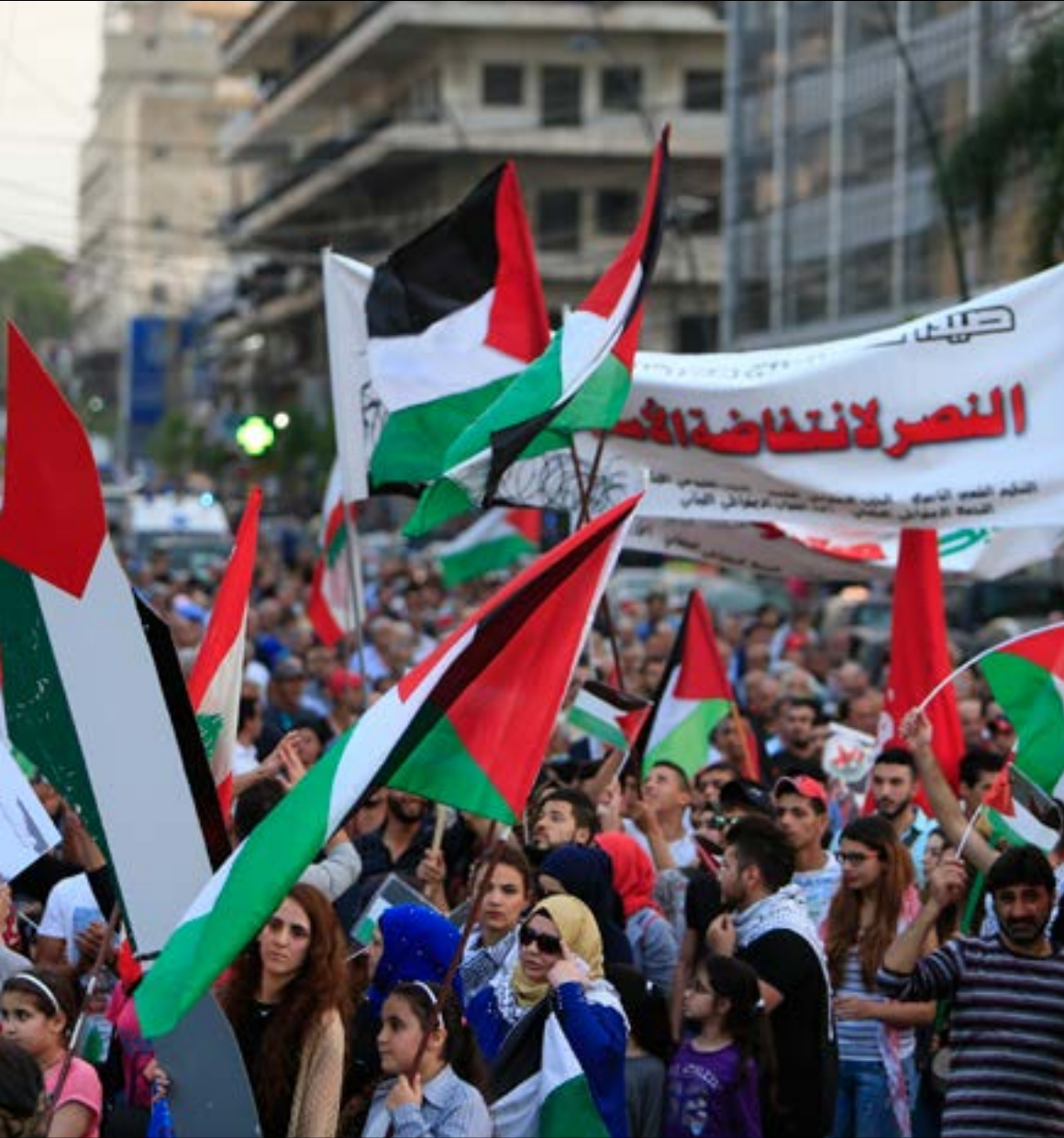
شهدت مدينة صيدا اللبنانية، أمس، مسيرة تضامنية مع إضراب الأسرى في سجون العدو (علي حشيشو)

اثنا عشر يوماً، وليس لهؤلاء الأبطال العزل إلا كرامتهم الإنسانيّة وعزّتهم الوطنيّة. ليس لهم سوى أجسادهم وإرادتهم وتصميمهم وتضامنهم على اختلاف الفصائل والانتماءات والعقائد. لكن، ربّما أمكننا أن نضيف شيئاً من الدعم والتضامن الذي لا يكلف شيئاً، في مدننا وبلداتنا العربيّة القابعة على البركان نفسه والتي تخوض معركة المصير نفسها من أجل الحرية والعدالة والكرامة، والحقوق الوطنيّة والقوميّة. على «تويتر» أيضاً علّق الناشط: «أنا من مواليد عام 1987، وكريم يونس وماهر يونس عمداً الأسرى الفلسطينيين معتقلون منذ عام 1983». ونقرأ: «الأسير عبدالله البرغوثي محكوم 67 مؤبداً و5200 سنة، إنه صاحب أطول حكم في التاريخ». وأيضاً: «الأسير أحمد كعابنة يدخل عامه العشرين في سجون الاحتلال، وهو محكوم بمؤبدتين وست سنوات». هؤلاء لا يطلبون شيئاً لأنفسهم، نحن من نحتاجهم وليس العكس. نحن نحتاج إلى الاستيقاظ من هذا الخدر الذي يشبه الموت. لنفكر بكل منهم، فرداً فرداً، بأهله وعائلته، في قلب هذه المعركة الشرسة، ونحن نستقوي بكلمات محمود درويش التي ختم بها السينمائي برهان علويّة فيلمه الشهير «كفر قاسم»: «إنني عدت من الموت لأحيا، لأغني/ فدعيني أستعز صوتي من جرح توهج/ وأعيني على الحقد الذي يزرع في قلبي عوسج/ إنني مندوب جرح لا يساوم/ علمتني ضربة الجلال أن أمشي على جرحي/ وأمشي...؟ ثم أمشي... وأقاوم!».