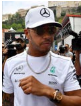
هاميلتون في التجارب الحرة الثانية في موناكو

لي غير حقيقي. أنا فخور جداً بكوني موجوداً بين الكبار». وأضاف بطل العالم السابق ووصيف البطولة الحالي: «لا أشعر بالضغط، إذا حصل هذا الأمر هذا الأسبوع (معادلة سينا) يكون قد حصل. إذا لم يكن كذلك فإنه سيحصل في النهاية». وعن فوزه في موناكو مرتين سابقاً قال هاميلتون: «أنا سعيد بما حققت، قلة من الأشخاص يمكنهم القول إنهم فازوا في موناكو، خصوصاً من خلال الطريقة التي يتحقق من خلالها الفوزان. أحياناً الكمية لا تصنع كل شيء، والتنوعية تكون الأهم، وأنا فخور بتحقيق انتصارات بنوعية حتى لو أنني أريد تحقيق المزيد».