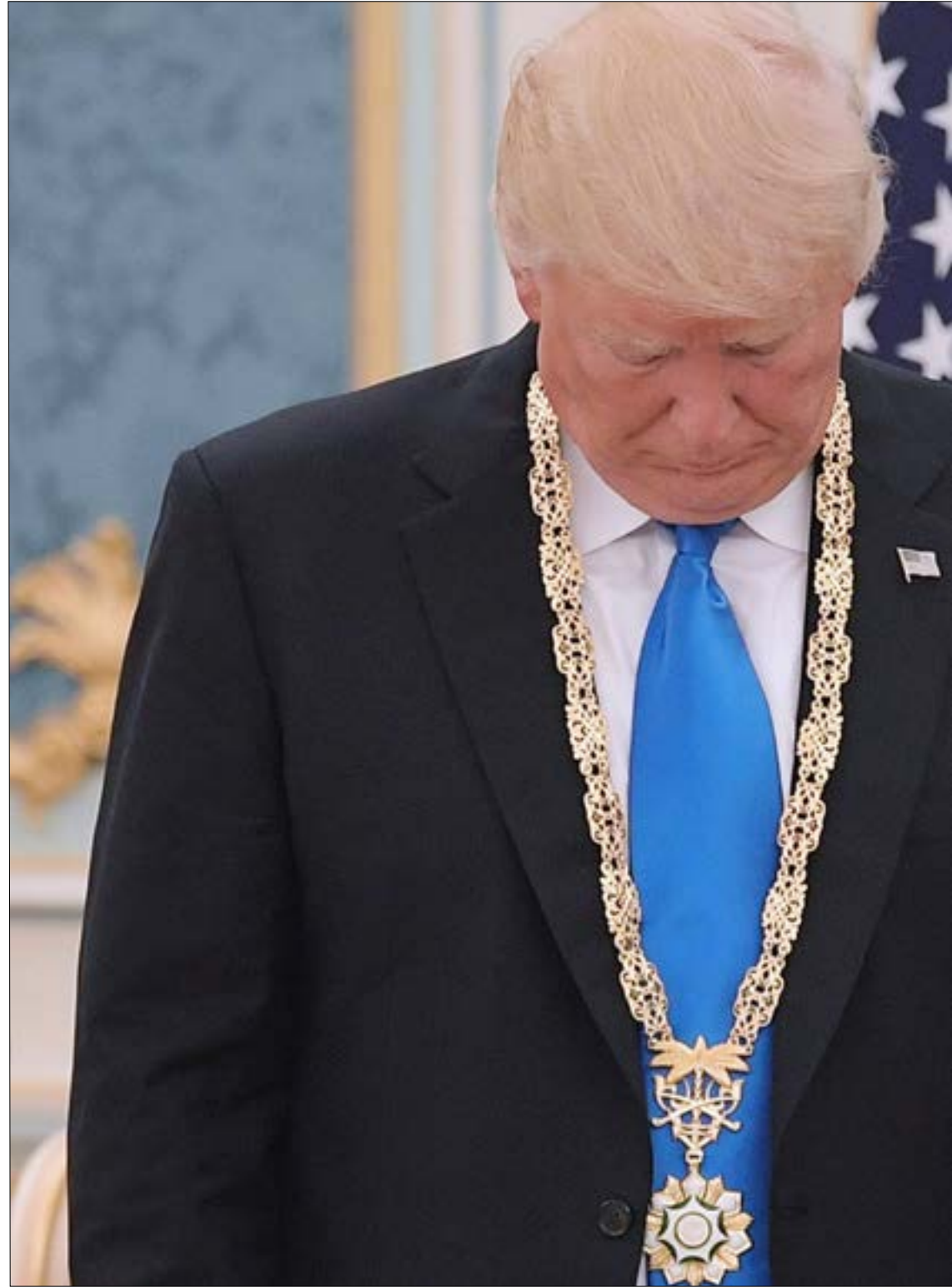
ترامب لا يابه للثبات في المواقف ولا التمسك بالمبادئ في السياسة

إدارة جديدة. ومراجعة التاريخ المعاصر من العلاقات الأميركية - السعودية تظهر أن هناك نمطاً سيقاً في موقف النظام السعودي من أي إدارة أميركية: هي تبدأ بالحماسة الكبيرة، وتنتهي دوماً بالخبية الكبيرة. كان النظام السعودي شديد التأييد لسياسة ريغان، وتشاركها في مكافحة الشيوعية حول العالم، لكن النظام السعودي خاب أمه من إمكانية قيام إدارة ريغان بشن حرب على إيران لتغيير نظامها. وحتى نظام جورج دبليو بوش: كان الحكم السعودي شديد التأييد لسياسات بوش في البداية،