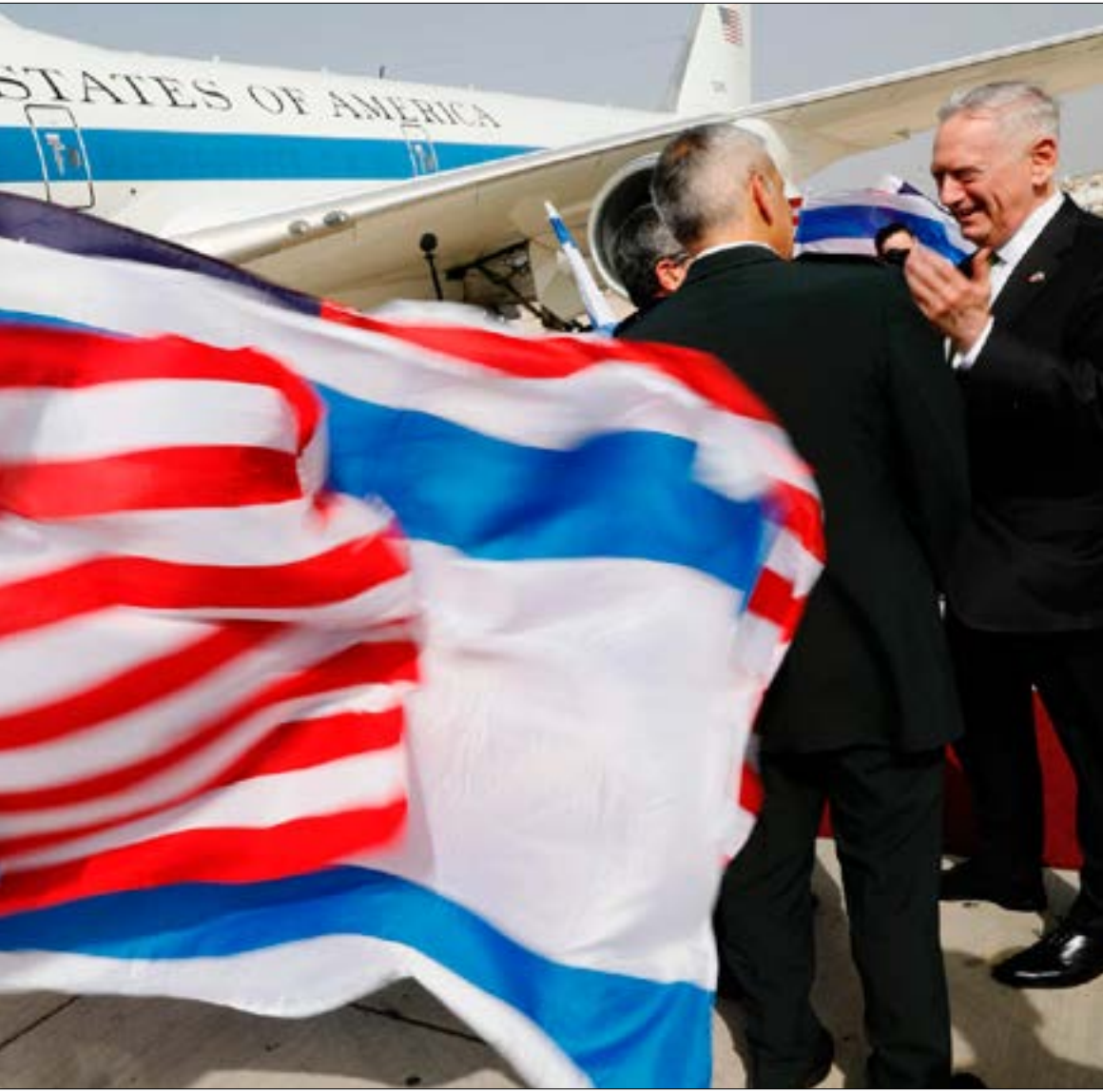
دخلت تل أبيب في مرحلة الاستعداد لتلبية متطلبات المسار الإسرائيلي - السعودي

مرة أخرى يسعى رئيس حكومة العدو بنيامين نتنياهو، إلى ضم «حزب العمل» إلى ائتلافه الحكومي، في محاولة منه لنيل دعم أحزاب «الكنيست» في أي تسوية جديدة ينوي الرئيس الأميركي دونالد ترامب، السير بها