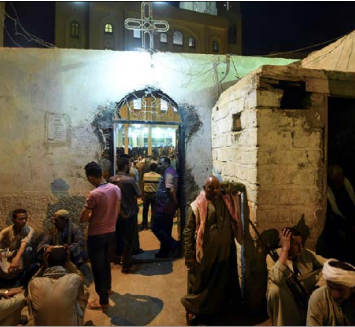
كانت غالبية الفتن الطائفية في المنيا تنتهي بجلسات صلح يُجر فيها الأقباط على التنازل

كنيسة طنطا والإسكندرية، نفذت القوى التكفيرية، أمس، هجوماً إرهابياً جديداً استهدف حافلات أقباط كانت في طريقها إلى زيارة دير الأنبا صموئيل في المنيا، في منطقة صحراوية تبعد عن الطريق السريع نحو 30 كيلومتراً في عمق الصحراء، في حادث تم تنفيذه عبر مجموعة ملثمين كانوا يرتدون ملابس تشبه ملابس الجيش، وقاموا بإيقاف الحافلات التي كانت متجهة إلى الدير، وسارعوا إلى إطلاق النار على الموجودين بداخلها، بعد سرقة الذهب والأموال الموجودة في حوزة السيدات. وإذ لا الإرهابيون بالفرار في الدروب الصحراوية، كان لافتاً أن عملية تعقبهم جواً لم تبدأ إلا بعد أكثر من ثلاث ساعات، فيما لم تصل قوة الشرطة إلى مكان الحادث إلا بعد أكثر من 30 دقيقة، بالرغم من أن أقرب نقطة إلى موقع الحادث لا تبعد سوى بضعة كيلومترات، ما قد يجدد الانتقادات إزاء المقاربة التي تنتهجها وزارة الداخلية تجاه العمليات الإرهابية المماثلة، على غرار ما حدث في التفجير الماضي، الذي سعى وزير الداخلية إلى احتوائه عبر إقالة مدير أمن طنطا. واللافت للانتباه، في سياق الحديث