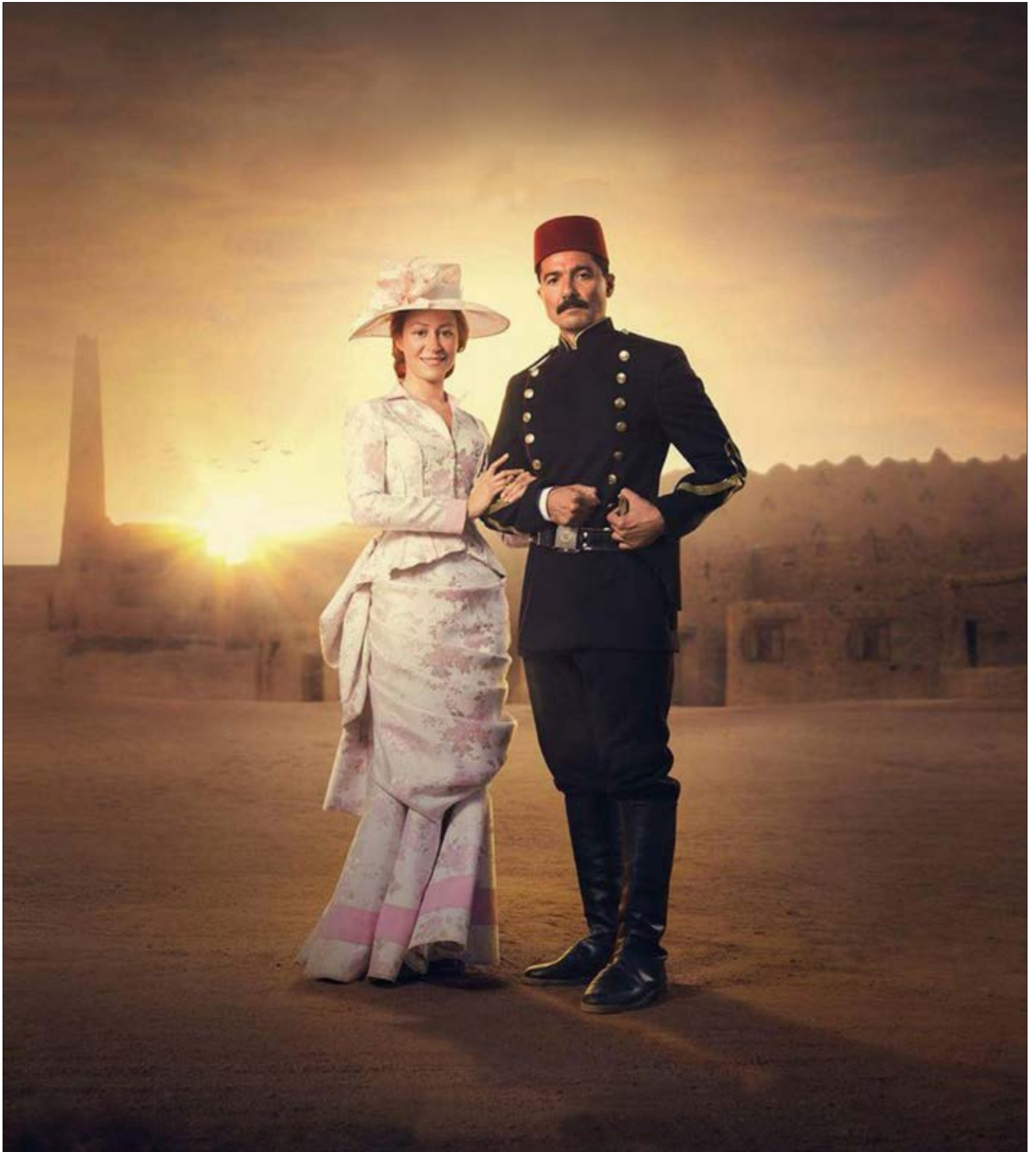
خالد النبوي ومنة شلبي في «واحدة الغروب»

شاشاتنا المحلية: إنه عصر الدراما اللبنانية • المسلسلات الخليجية: جرة «مدرسة» • روبي الابنة المتمردة... وهي فادوة الحارة • من بهاء طاهر إلى إحسان عبد القدوس: حروب... وثورات! • الكوميديا رثة الدراما المصرية • «آلة الزمن» تعيد اسمعك يس إلينا • الدراما السورية المعاصرة عاتمة على سطح المأساة • لا وقت للضحك في «الربيع الأسود» • البيئة الشامية تضيئها... «قناديل المشاق» • «أوركيدا» باقى على «العهد»... فماذا عن «لعبة العروش»؟