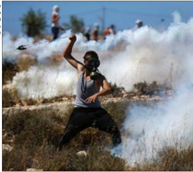
من تظاهرة داعمة للأسرى في قرية النبي صالح أمس

في هذا الوقت، حذرت «اللجنة الدولية للصليب الأحمر» من وفاة «معتقلين فلسطينيين مضربين عن الطعام». وطالب «الصليب الأحمر» في بيان، «جميع الأطراف والجهات المعنية، بإيجاد حل من شأنه تفادي