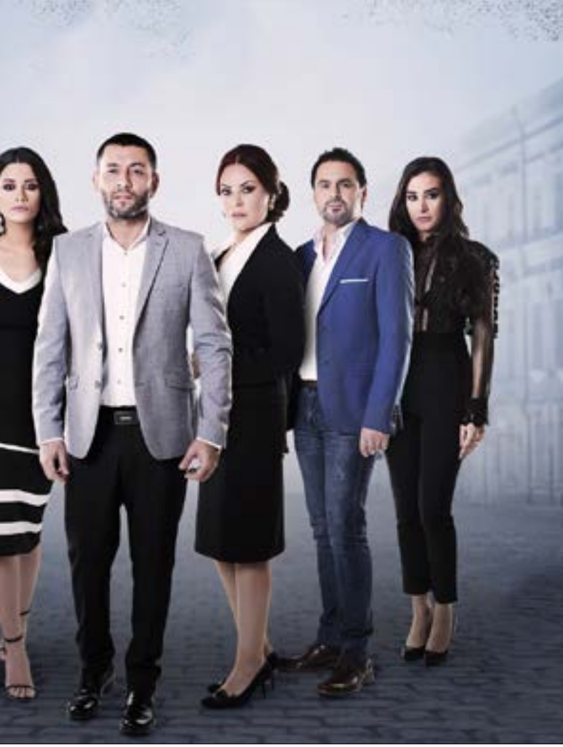
إبطاك مسلسل «بلحظة»