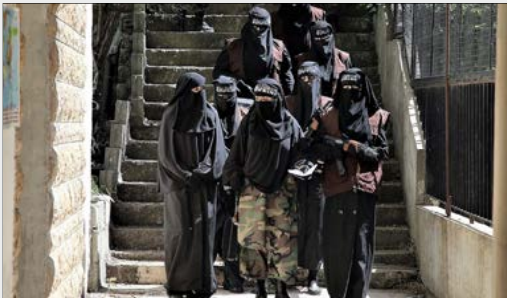
مشهد من «غرابيب سود»