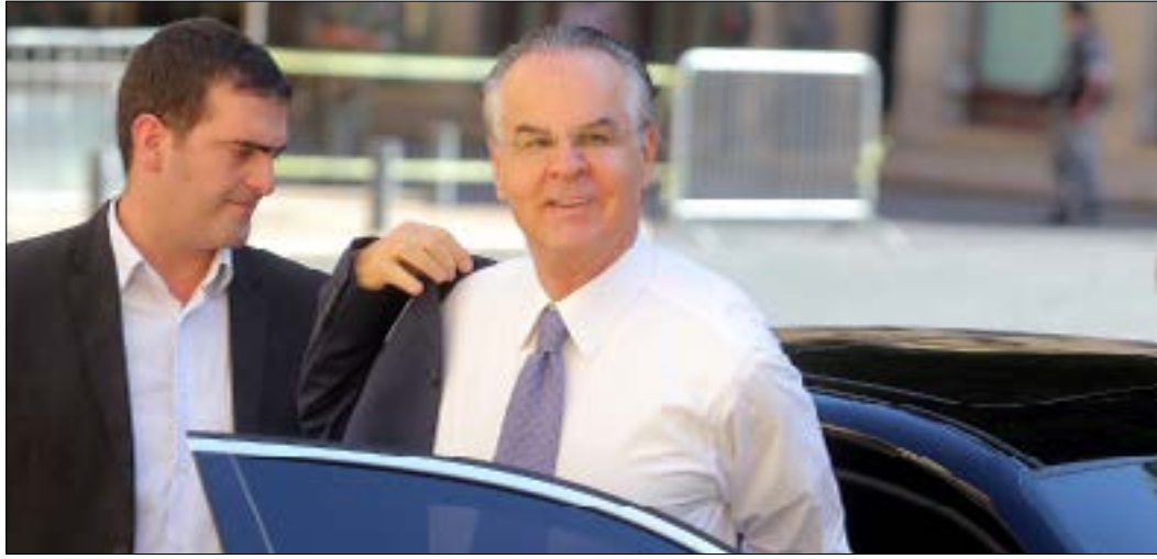
توصل عدوان إلى تفاهم مع جنبلاط لـ «تحسين» مصالحة الجبل

نجحت مبادرة النائب جورج عدوان في الوصول إلى اتفاق على العناوين العريضة حول قانون يعتمد النسبية على أساس 15 دائرة. الاتفاق لم يحسم بعد في انتظار «ضوابط التيار الحر» وبعض «الرتوش»، لكن الإيجابية التي يبديها مختلف الفرقاء قد تبعد شبح الفراغ المجهول عن البلاد