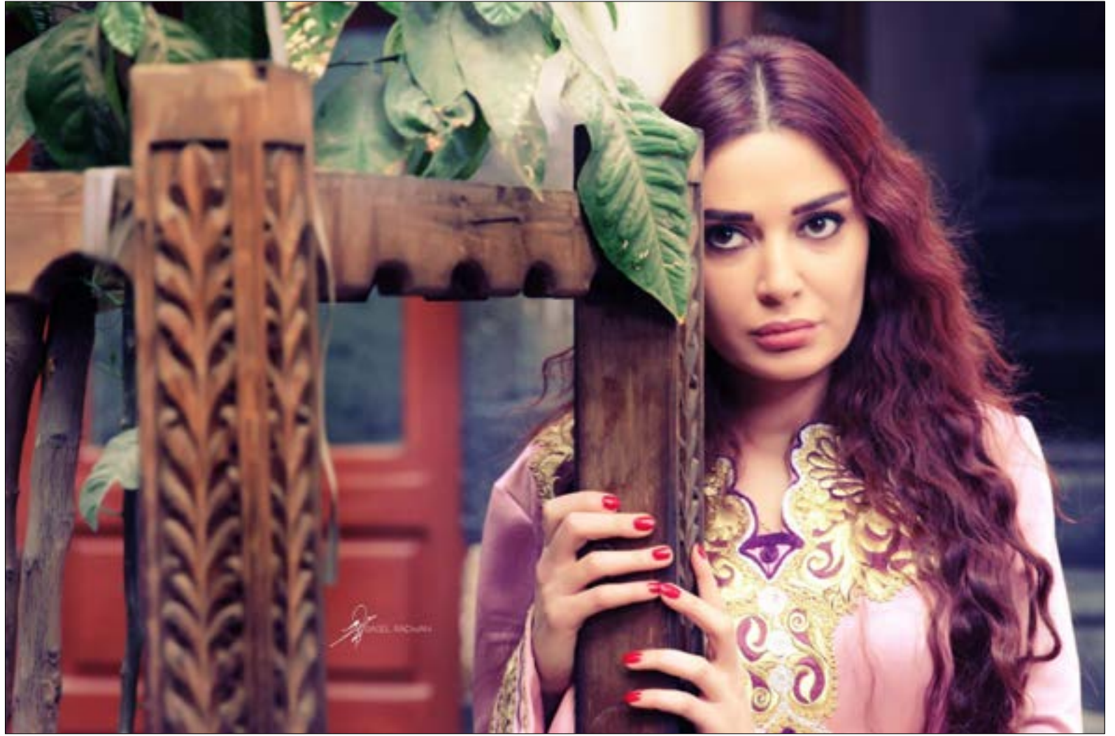
سيرين عبد النور في مشهد من «قناديل العشاق»