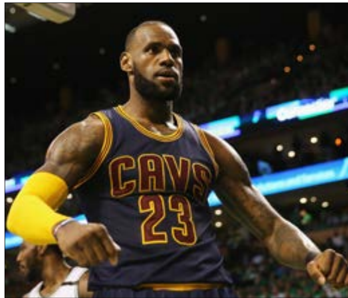
اصبح جيمس افضل مسجك في تاريخ «البلاي أوف»

بسبب ما كان بمقدوره تحقيقه. عندما كنت أشاهد مايكل جوردان، كان بمثابة الإله. فلم أعتقد باني سأصبح مثله». صحیح أن جيمس هو محط الأنظار في كل مباراة يخوضها كليفلاند أو