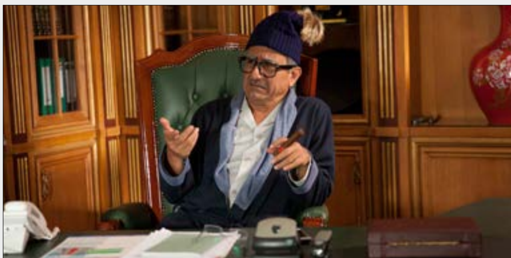
ناصر في القصبي سيلفي «3»