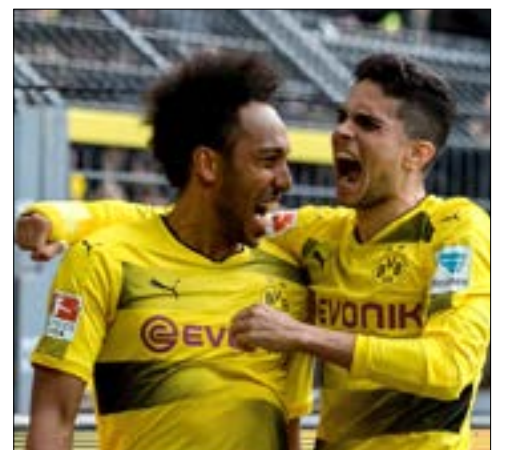
أبلغ أوباميانغ مسؤولي دورتموند بقراره الرحيل (أ ف ب)

برز أمس في تداولات سوق الانتقالات الصيفية المقبلة ما أوردته صحيفة «بيلد» الألمانية، أن الغابوني بيير-إيميريك أوباميانغ، أبلغ مسؤولي ناديه بوروسيا دورتموند الألماني، بقراره الرحيل عن صفوف الفريق. وُبط أوباميانغ البالغ من العمر 27 عاماً بالانتقال إلى باريس سان جيرمان الفرنسي، وتلقى عرضاً للانتقال إلى تيانججيان كوانججيان الصيني مقابل 85 مليون يورو. لكن تبقى معرفة رأي إدارة دورتموند بهذا القرار، خصوصاً أن هداف «البوندسليغا» هذا الموسم لا يزال يرتبط بعقد مع النادي حتى 2020. ولفت أمس ما ذكرته صحيفة