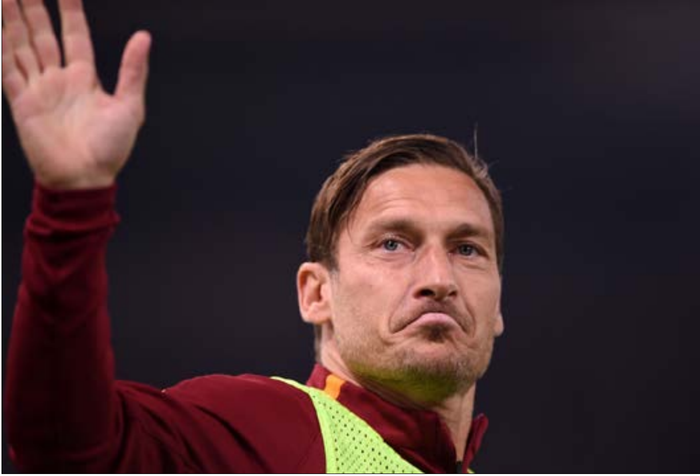
يخوض توتي مباراته الأخيرة مع روما غداً بعد ربع قرن قضاه مع فريق العاصمة (أ ف ب)

لن يكون بعد ظهر غدٍ عاديًا في العاصمة الإيطالية روما. فهي ستصبح بلا ملكٍ يرباعها. فرانشيسكو توتي سيكون للمرة الأخيرة مع فريق المدينة التي عشقها وعاشتته. فكانت وضيًا لها ودافع عن ألوانها ربع قرن