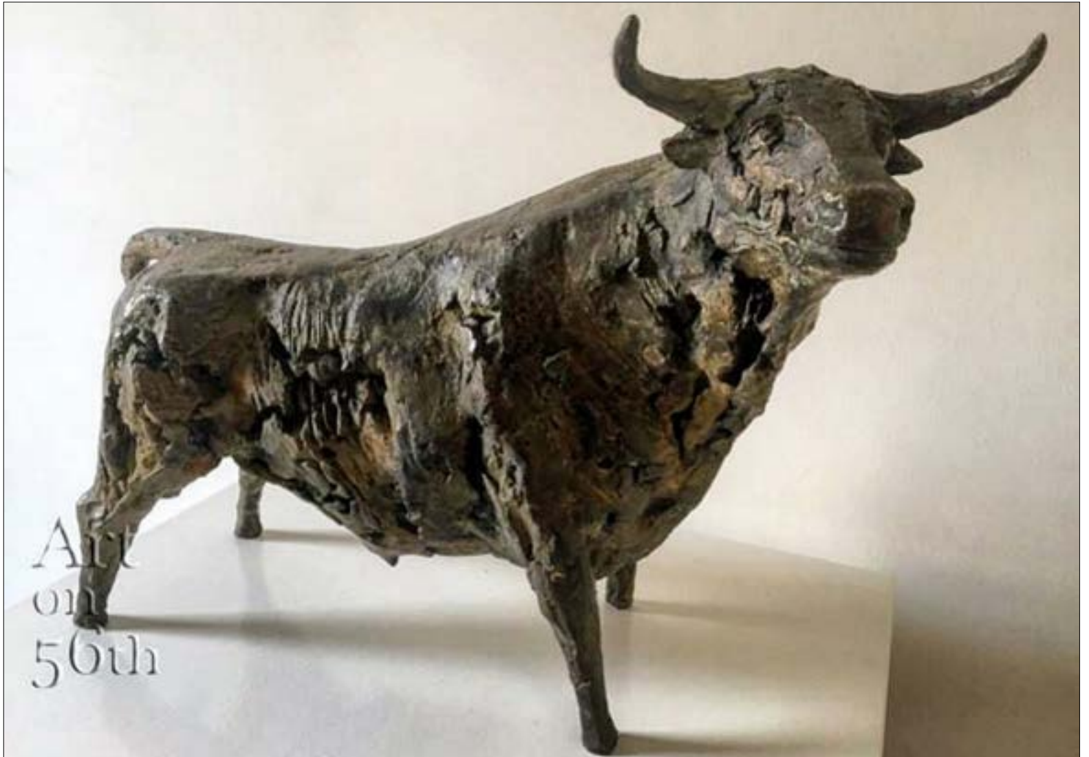
من دون عنوان 35 (برونز - 53 x 26,5 سنتم - 8/2 - 2017)