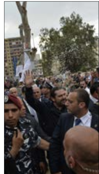
الحريري اعدّ للزيارة قبل اسبوع، واراد ان تكون نقلة في استعادة شعبيته

محسن والمنكوبين، وسط غياب تام لأي حضور شعبي، وهي للمفارقة المناطق التي شهدت أغلب جولات العنف التي بدأت بعد خروج الحريري من السرايا الحكومية عام 2011، ولم تتوقف إلا بعد خروج الرئيس نجيب ميقاتي من السرايا ودخول الرئيس تمام سلام إليها عام 2014.