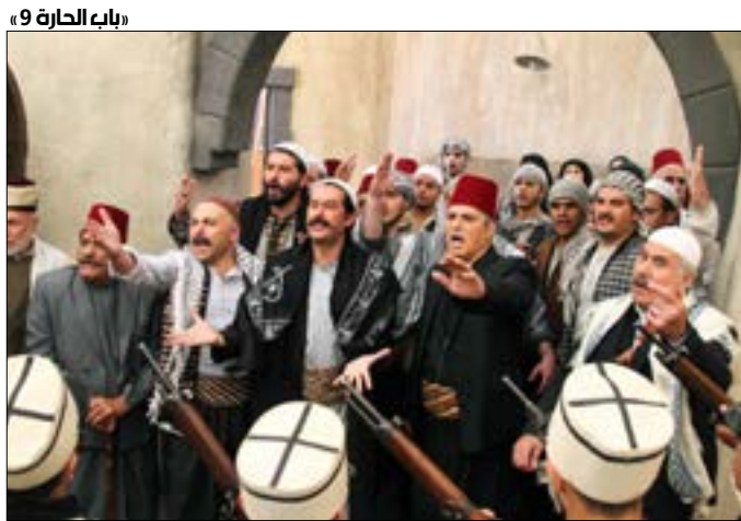
باب الحارة 9

تصنع فيه حكاية متخيلة تستند إلى مرحلة تاريخية هامة، فتخرج الصورة ما بين الحكائي المصنع درامياً، والتوثيقي المثبت تاريخياً.