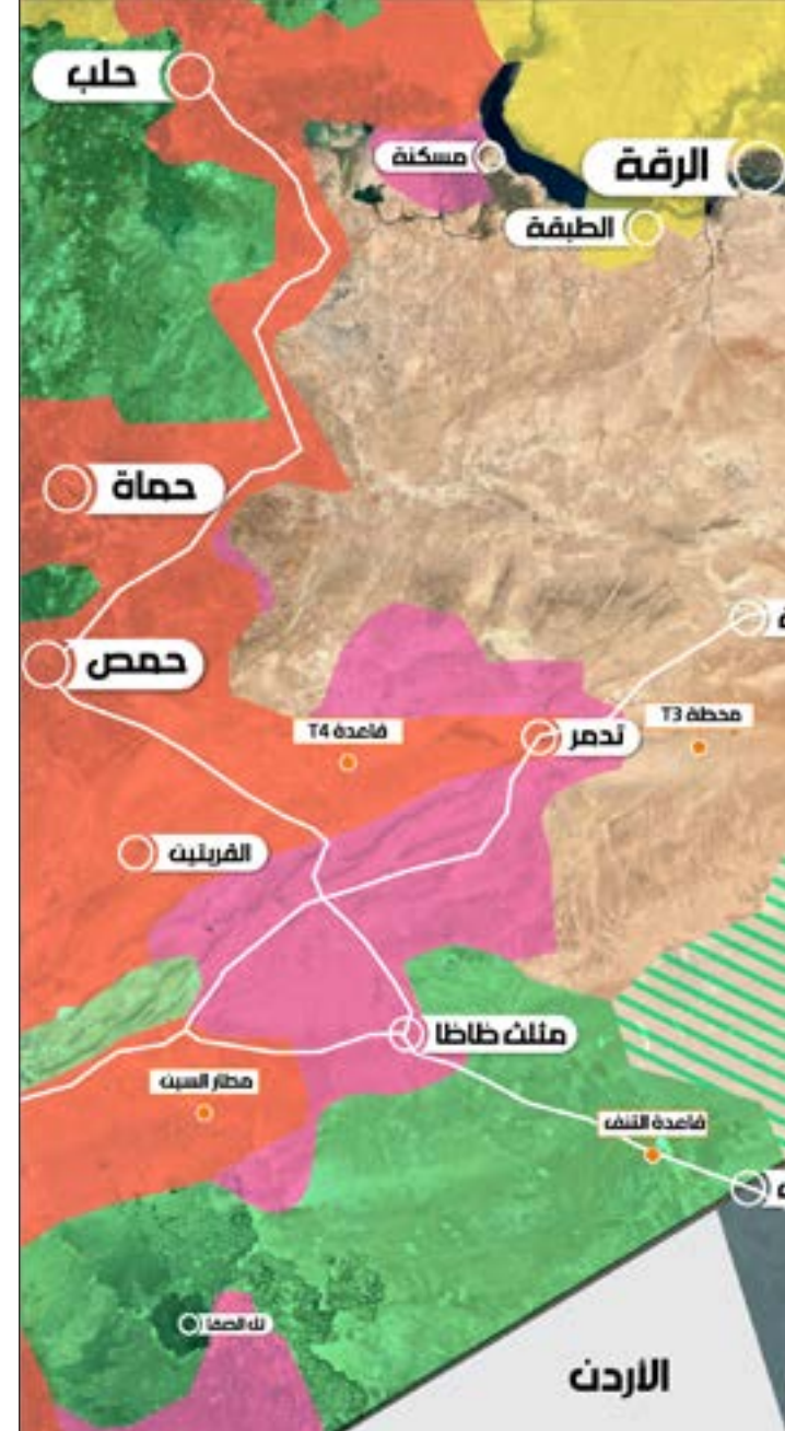
(تصميم سنان عيسى)

فمن جهة، يجري الاستعداد من جانب الجيش السوري وحزب الله لخوض معركة استعادة مدينة السخنة (شمال شرق تدمر) التي تفتح الباب أمام معركة باتجاهين متلازمين: فك الحصار عن مدينة دير الزور، واستعادة السيطرة على الجانب السوري من معبر القائم مع العراق. علماً أن النقاش قائم بقوة داخل العراق حول إمكانية خوض المعركة الفاصلة في غرب الأنبار، ما يقود القوات العراقية معها «الحشد الشعبي» إلى الحدود من جهة القائم، في خطة معاكسة لخطة أميركية تقوم على إنشاء تحالف بين عشائر سورية وعراقية تنتشر على جانبي الحدود بإشراف مشترك مع الأردن، تبقى هذه المنطقة بعيدة عن سيطرة أو نفوذ قوى المحور المقاومة في البلدين.