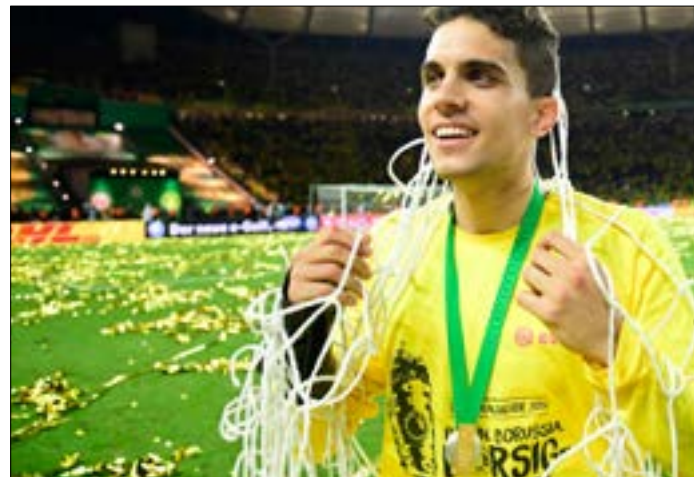
تعرض بارترا لإصابة بالغة وخضع لعملية جراحية

للمرة الأولى، روى المدافع الإسباني مارك بارترا تفاصيل المعاناة التي اختبرها جراء إصابته في التفجير