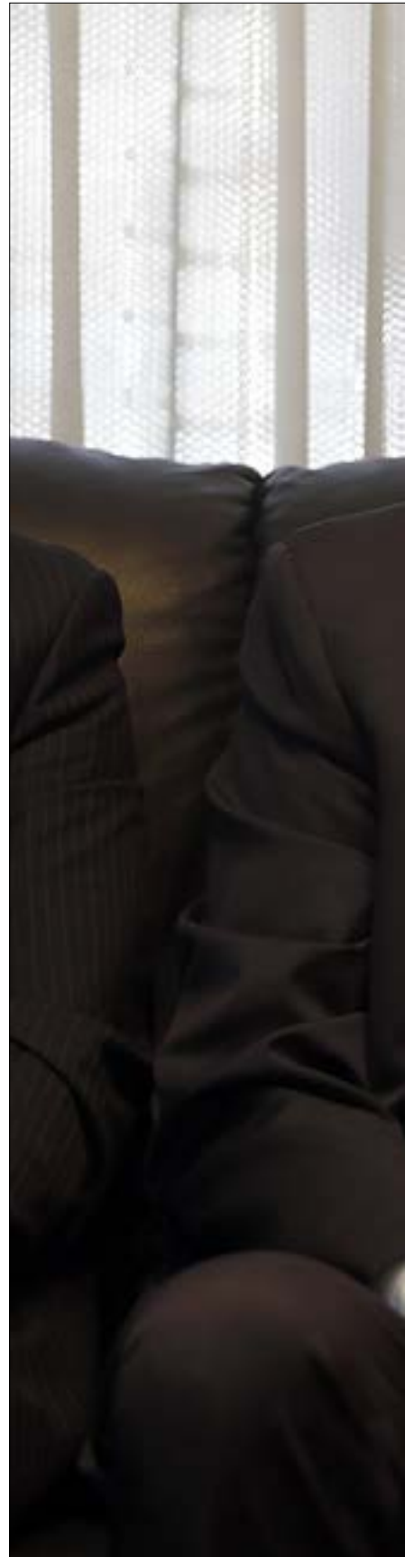
قول جريباتي أن الانهزام «ليبت» أنا غير صحيحة بسنيف التحقيقات القضائية (هيثم الموسوي)

استقرّ تشكيل المشاة الأساسي في أوروبا، منذ أواخر القرن السابع عشر وحتى أيام نابليون، على مستطيل مكون من ثلاثة صفوف، يطلق أحدها رشقة فيما باقي الجنود يذخر بنادقه، ويتحوّل هذا التشكيل إلى طابور في حالة السير والانتقال. مع ذلك، ظلت إدارة المعركة مسألة معقدة، وظل الجنود مضطربين لاعتماد تشكيلاتٍ متراصة ومتقاربة، حتى وهي تتعرض إلى القصف الشديد (من المهمات الأساسية لجندي المشاة في ذلك العصر كان أن تقف بثبات في موقع، طول النهار من دون أن تفعل شيء، فيما مدفعية العدو تحصد كل من حولك وكرات الحديد تنثر فوق رأسك، وقد نشأ تراثٌ كامل بين العسكريين يسرد هذه الحالات ويتفاخر بها).