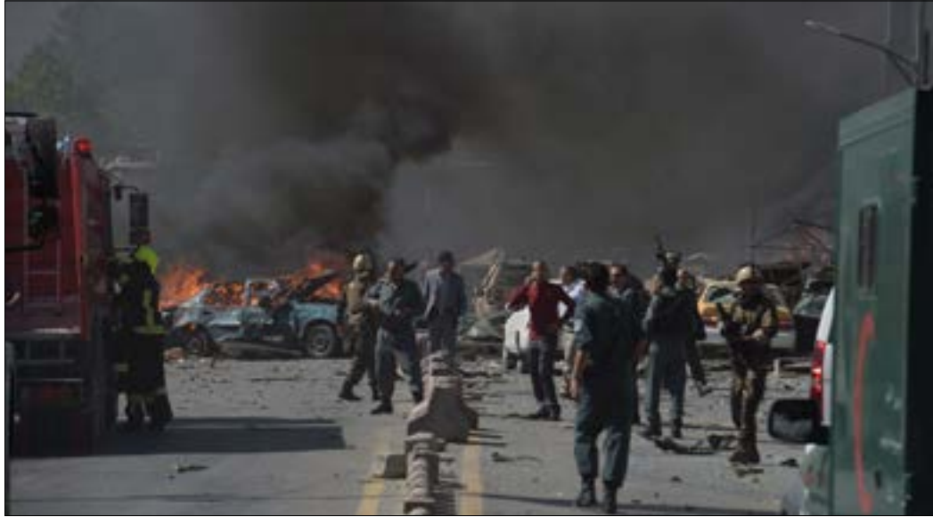
الشرطة: قنبلة ضخمة مخبأة في صهريج انفجرت في ساعة الذروة الصباحية

المتحدة». ورأى أن الولايات المتحدة «لا تريد انتهاء الأنشطة الإرهابية» في أفغانستان، مضيفاً أن «الوجود الأميركي أسهم في تعزيز داعش». وأعلن قرصاي أن «الهدف الرئيسي لداعش في بلاده يتمثل في زعزعة الاستقرار بالبلدان المجاورة». من جهة أخرى، وصف الرئيس الأفغاني أشرف غني، الهجوم بأنه «جريمة حرب»، فيما كتب رئيس الوزراء عبدالله عبدالله، على «تويتر»: «إننا مع السلام، لكن الذين يقتلوننا خلال شهر رمضان المبارك لا يستحقون أن ندعوهم لصنع السلام، ينبغي تدميرهم». وفي السياق، أدان وزير الخارجية الأميركي ريكس تيلرسون، في بيان، «العمل الأحمق والجبان»، مؤكداً أن «الالتزام الولايات المتحدة في أفغانستان ثابت».