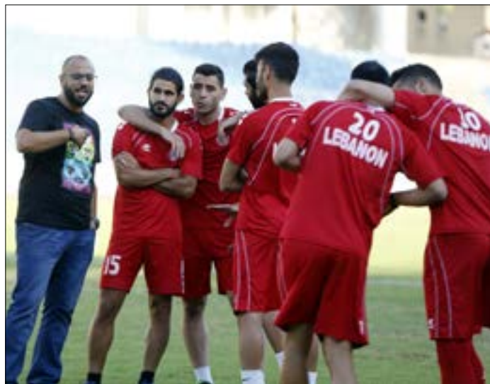
سيخضم اللاعبون لمعسكر في قطر بدلاً من ماليزيا (هروان بو حيدر)

ومن المقرر أن يخوض لبنان مباراته الثالثة أمام كوريا الشمالية في بيونغ يانغ في أيلول المقبل. وهناك علامة استفهام حول عدم إقامة المباراة بين كوريا الشمالية وماليزيا قبل مباراة لبنان، لما لهذا الأمر من أهمية للمنتخب اللبناني. فهناك فرق كبير بين مواجهة الماليزيين بعد لقائهم مع كوريا قبل خمسة أيام من المباراة، مع ما يمكن أن تحمل هذه المباراة من إصابات أو بطاقات صفراء وحمراء، وبين اللعب مع الماليزيين على أرضهم وهم مرتاحون ولم يلعبوا مع الكوري القوي بعد.