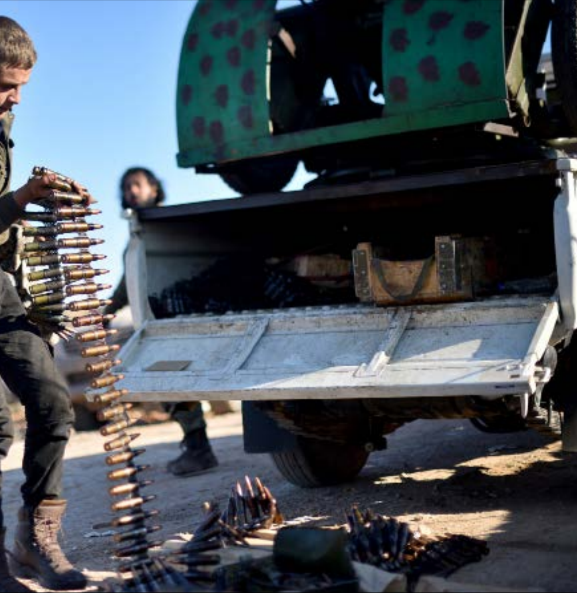
تشير مصادر كردية إلى وجود خطط تركية لفتح الطريق بين ريف حلب الشمالي والغربي (الناضول)

في آب 2016 وجدت أنقرة في معارك الحسكة التي اندلعت بين الجيش السوري و«الوحدات» الكردية فرصة سانحة سرعاتها واستغلتها واطلقت «درع الفرات» قبل انصرام الشهر. وليس من المستبعد ان تسعى إلى تكرار السيناريو في محاولة لاستغلال التوتر الذي خلفته أحداث ريف الرقة الجنوبي قبل أقل من أسبوعين بين الجيش و«قسد». تحركات تركية مكثفة سجلت في خلال الأيام الأخيرة. تنظر إليها «قسد» بوصفها «تهديدات جديدة» لعفرين ومحيطها. وتنتظر من موسكو «القيام بشيء ما لردم أنقرة»