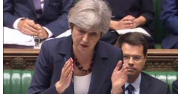
وافقت ماي على زيادة الإنفاق على «الشمالية»، بمقدار مليار جنيه استرليني