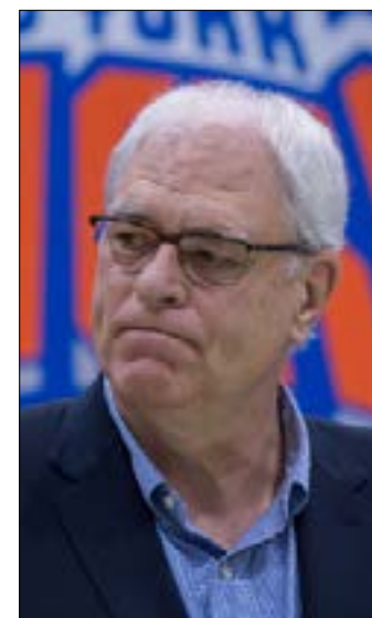
مَدَم فيك جاكسون استقالته من رئاسة نيويورك نيكس (أرشيف)

وتابع: «فيل جاكسون أحد أكثر الأشخاص نجاحاً وشهرة في تاريخ الدوري الأميركي لمحتري كرة السلة. إرثه في لعبة كرة السلة لا مثيل له. نتمنى له الأفضل ونشكره على خدماته لنيكس كلاعب واداري». وكان جاكسون (2,03 م) يلعب في المركز رقم 4 مع نيكس عندما توج بلقب الدوري مرتين في 1970 و1973، رغم غيابيه عن التتويج الأول بسبب خضوعه لجراحة في عموده الفقري. وقاد جاكسون كمدرّب شيكاغو بولز وأسطورته مايكل جوردان إلى 6 ألقاب في الدوري في التسعينيات ثم توج خمس مرات مع لوس أنجلوس لايكرز.