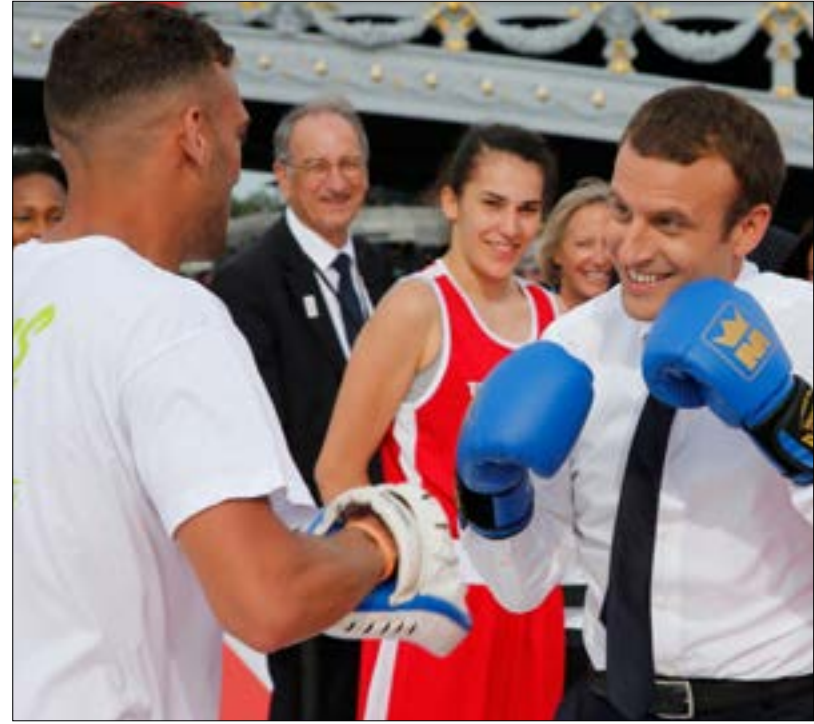
الصورة الجميلة للرئيس الفرنسي إيمانويل ماكرون لا تلغي أزمات أوروبا وواقعها

فدرالي، وهو أمر إذا ما حصل فسيكون آخر فرصة لإنقاذ «حلم» الحصول على اتحاد أوروبي «جيد».