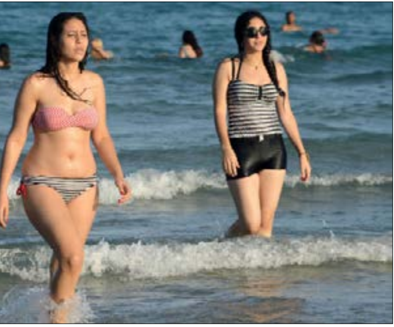
واقعة «ميرامار» كشفت أن العدد الأكبر من المنتجعات يمارس الحظر

المصرفيين بالحفاظ على التوزيع الحالي تحاشياً لحصول انقسامات، وبالتالي بات على كل مجموعة مصرفيين من طائفة واحدة الاتفاق في ما بينهم للمداورة في تمثيلهم في مجلس الإدارة. يتبين أن عدد الأصوات التي يحق لها الانتخاب في الجمعية العمومية للمصارف يبلغ 64 مصراً. وبحسب مصادر لائحة القرار، فإن حصتها الصافية من هذه الأصوات تبلغ 30 صوتاً بالإضافة إلى حصتها من أكثر من 15 صوتاً لن تنتخب اللائحة كاملة. وفي المقابل، تقول مصادر لائحة التغيير إن عدد الأصوات الصافية هو أكثر من 20 صوتاً، فيما