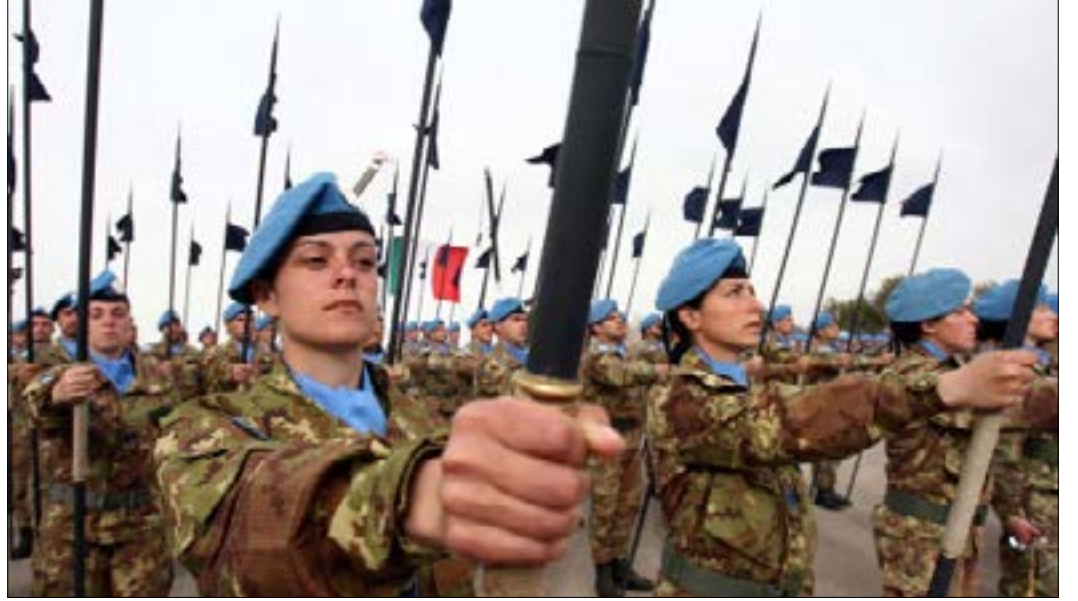
تريد إسرائيل اليونيفيل أداة للتحريض على حزب الله (أرشيف)

حادثتان متصلتان رفضت اليونيفيل مجازاة إسرائيل فيهما، وتميزت عنها، الأمر الذي دفع تل أبيب إلى شن حملة انتقادات ضدها، وكانت كافية لتضع القوة