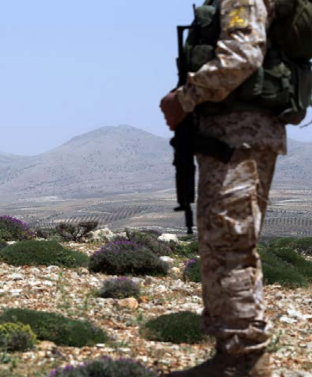
لته يجري التفاوض بعد انطلاق المعركة إلا بالطريقة التي يريدها حزب الله