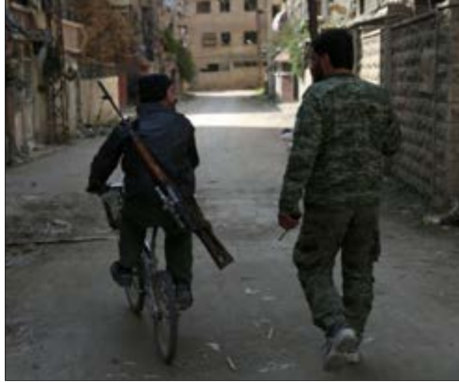
برز التداخل المعقد بين «النصرة» وسائر المجموعات بوصفه عقبة أساسية في طريق «العزل»