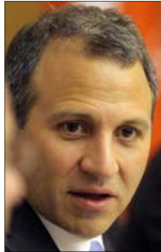
التعيين من خارج الملاك يستبب تأخير التصنيفات