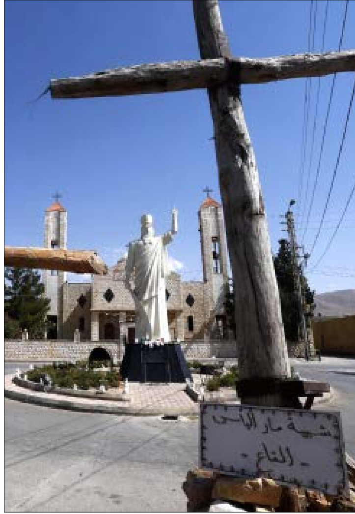
القاع تنتظر التحرير بفارغ الصبر (هيثم الموسوي)