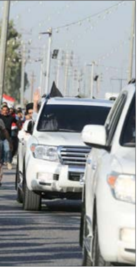
صورة نشرها موقع الصدر لـ «الحشود الجماهيرية» التي أتت لاستقباله في مطار النجف

والمصالح المشتركة بين البلدين والشعبيين»، إضافة إلى «مناقشة العلاقات الثنائية مع دول الجوار والتشديد على استقرار المنطقة». ويعكس اهتمام ولي العهد السعودي محمد بن سلمان بالشباب العراقي، هدفاً تسعى إليه الرياض، وهو تقويض النفوذ الإيراني في بلاد الرافدين، من طريق الشريحة الاجتماعية الأكبر في هرم الأعمار العراقي، خصوصاً مع قابلية هؤلاء لتغيير بعض «قناعاتهم» في ظل حالة التملل من الخطاب الديني، وبحثهم عن بديل يوفر لهم فرصة «تحقيق الذات والقناعات الشخصية».