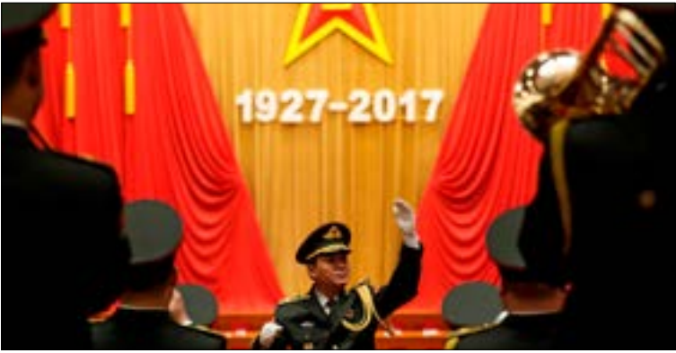
تزامن افتتاح القاعدة مع الذكرى التسعين لتأسيس الجيش الأحمر الصيني (أ ف ب)