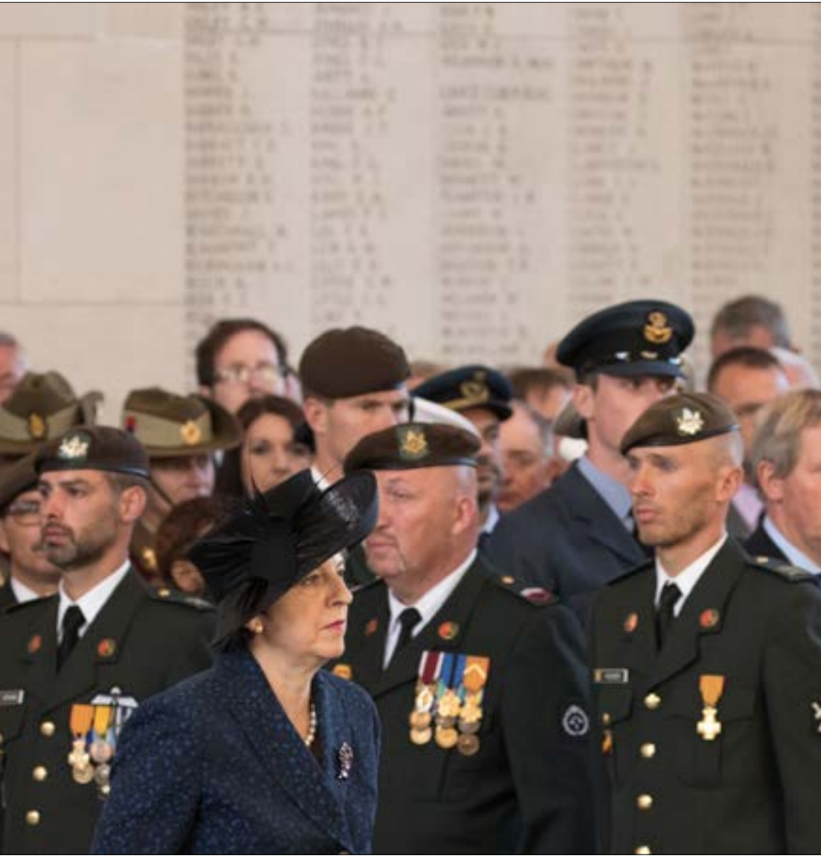
يملك تحالف كهذا اسوا كابوس لتيريزا ماي

لم يرشح الكثير بعد من تفاصيل زيارة مقتدى الصدر للسعودية. ورغم محاولات إلياسها ثوباً إنسانياً. خدمياً اقتصادياً. فإت نمة إشارات تؤكد أن المباحثات ذهبت أبعد من ذلك، لتشمل الحديث عن تثبيت الحضور السعودي في العراق