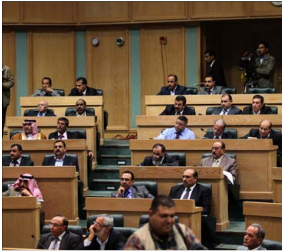
لا يرى معارضو المادة 308 المعتدي عليها بعفتصبا بفسط الحق العام (الاناضود)

تفاوتت مواقف النواب الأردنيين من المادة 308 من قانون العقوبات على نحو سجد فيه بعضهم مواقف متقدمة، فيما فاجأ آخرون الجمهور بـ«مواقف رجعية» من نص قانوني كان يؤقت للمغتصبين مخرجاً قانونياً من جريمتهم بمجرد الزواج بالمعتدي عليها نحو اربع سنوات!