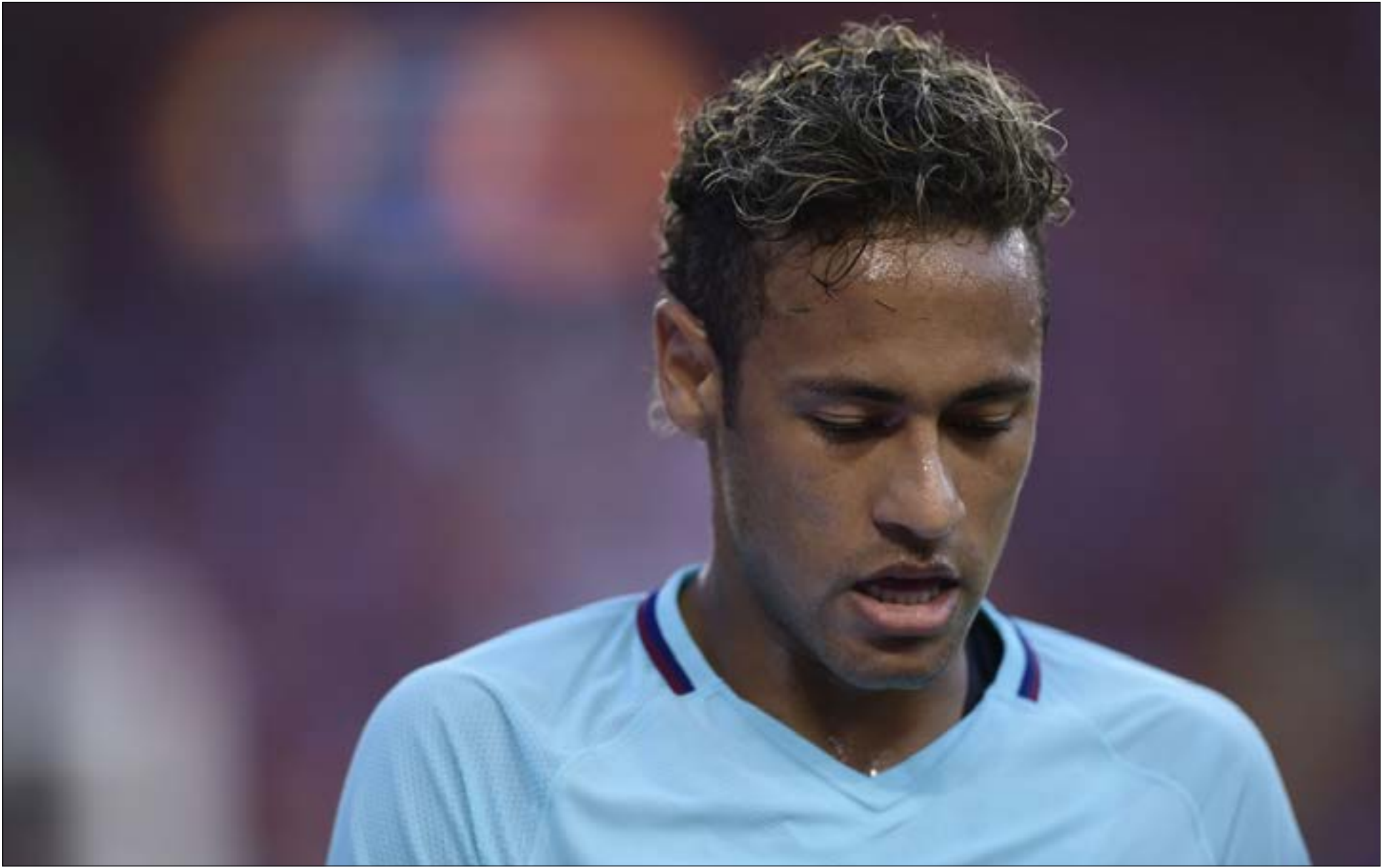
نيمار في حال انتقاله سيستجيب لنداء المال على حساب الوفاء