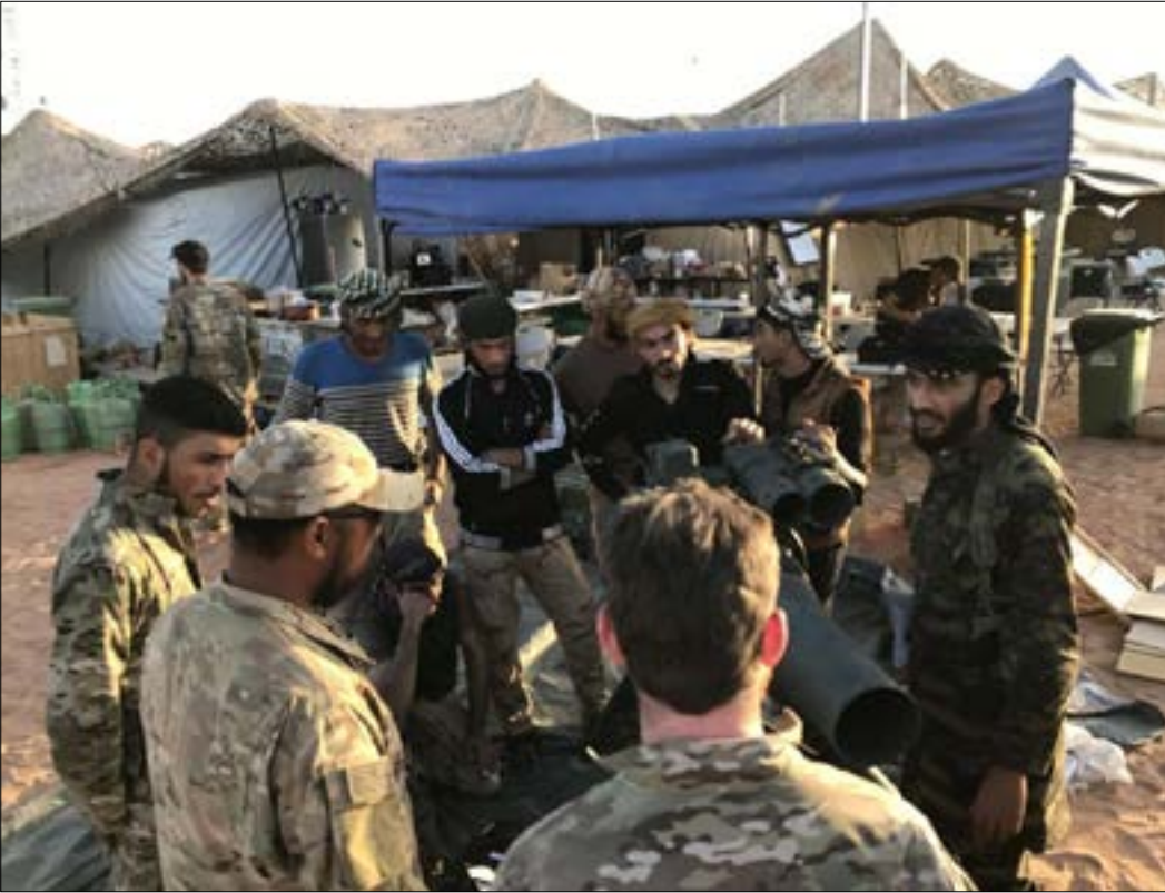
صورة نشرها «مقاوير الثورة» قبل اسابيع لتدريبات عناصرها مع القوات الاميركية

مجموعة العشرين، وفي أول لقاء يجمع الرئيسين دونالد ترامب وفلاديمير بوتين أعلنت «منطقة تخفيف التصعيد» في الجنوب السوري. هذا الاتفاق الذي حيك في هامبورغ بعد محادثات طويلة استضافتها العاصمة الأردنية عمان، ظهر بعده أيضاً توتر غير مسبوق بين البلدين إثر عقوبات جديدة أقرها مجلس النواب الأميركي على روسيا، فيما ردت الأخيرة بقرار ترحيل مئات الدبلوماسيين الأميركيين. هذه العقوبات التي لا تحوز موافقة البيت الأبيض، لم تمنع استكمال المسار الفخائي مع موسكو في سوريا، إذ ما زال ترامب ووزير خارجيته ريكس تيلرسون يعارضان تشريعات العقوبات التي وافق عليها الكونغرس، وفقاً لما ذكره «ديبلوماسي كبير» أمس لمجلة Washington examiner. وفي هذا السياق، قال تيلرسون خلال مؤتمر صحفي عقده في وزارة الخارجية أمس، إنه «غير سعيد، لا هو ولا الرئيس ترامب، بقيام الكونغرس بتطبيق تلك العقوبات وبالطريقة التي اتبعها للقيام بذلك»، مضيفاً: «كنا واضحين أننا لا نعتقد أن قرار الكونغرس سيكون مفيداً لجهودنا، ولكن هذا هو القرار الذي اتخذوه».