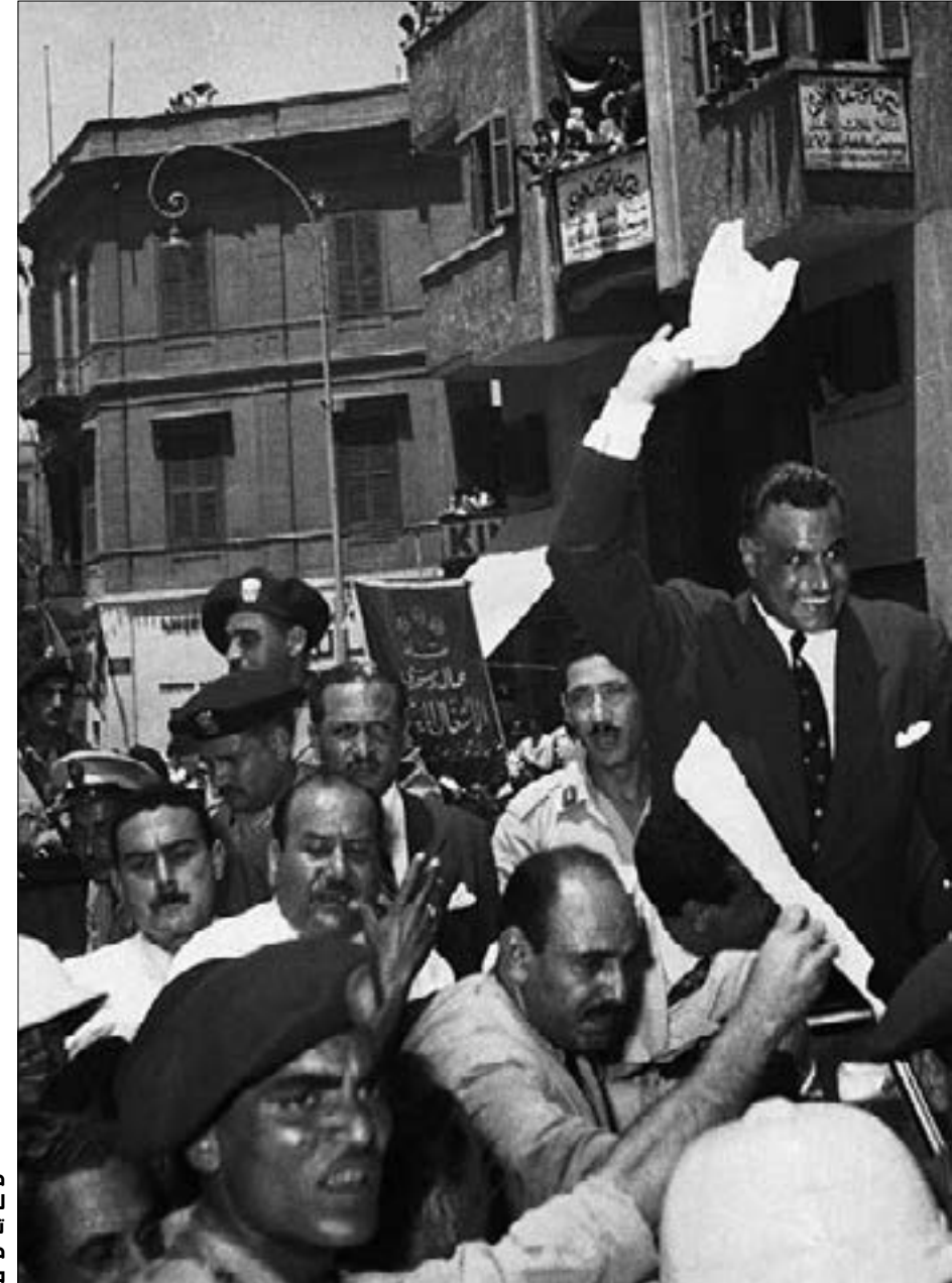
هناك تشويه دائم لعبد الناصر عبر تحميله مسؤولية كل ما جرى قبله وفاته وبعدها

ويذكر ميتشل أن الاحتلال شكّل «لجان قطع الطرق» لسحق الجماعات المسلحة في الريف ولجأ إلى شن الغارات العسكرية واستخدام البوليس السري والمرشدين والسجن الجماعي حتى امتلأت سجون البلاد باربعة أضعاف طاقتها. وحين انتقلت قيادة الحركة الوطنية إلى