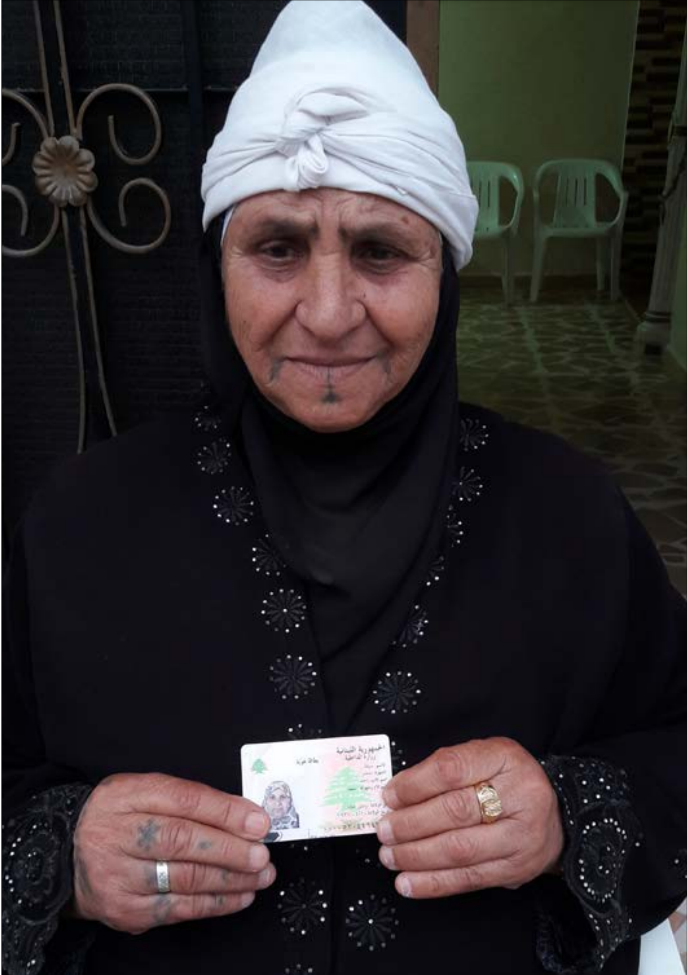
بعض العائلات جنس نصف أفرادها والنصف الآخر غير جنس

عام 1994، قرّرت الدولة أن تمنح على أهالي الوادي من حاملي وثائق «قيد الدرس» «نعمة» الجنسية اللبنانية. لكن فرحة الـ 2000 عائلة (نحو 15 ألف شخص) شابتها غصة حرمان نحو 60 عائلة (حوالي 600 شخص آنذاك) من أبناء الوادي من هذه «النعمة».