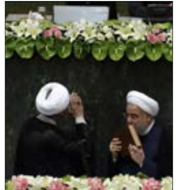
روحاني: الاتفاق النووي يملك نموذجاً من الوفاء الوطني

أسلحتنا هي أصوات شعبنا». وتابع أن «الشعب الذي أدلى بأكثر من 41 مليون صوت في صناديق الاقتراع، لن يصل إلى طريق مسدود، وهذه الأصوات ليست فقط دعامة للحكومة والبرلمان، بل إنها أيضاً دعامة للجيش والحرس الثوري». وكان الرئيس الإيراني الذي من المتوقع أن يُقدّم تشكيلته الحكومية يوم غد الثلاثاء (يُقال إنه سيبقي فيها على وزير النفط بيجن نامدار زنگنه، ووزير الخارجية محمد جواد ظريف)، قد أعلن في اجتماع خاص مع فيديريكا موغيريني قبل مراسم أداء اليمين، أن موقف الولايات المتحدة قد يعرقل تنفيذ الاتفاق النووي، مشيداً في الوقت نفسه بوجود شخصيات أوروبية كبرى في المراسم، ما يُظهر وفقاً له أن أوروبا عازمة على توسيع علاقاتها مع بلاده.