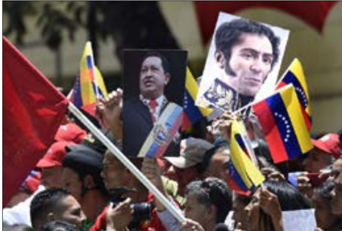
تحولت اتهامات «سمارتاتك» بالتلاعب بنتيجة الانتخابات إلى ما يشبه الحقيقة