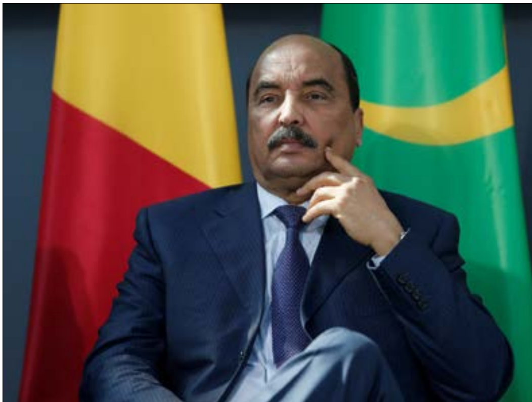
وصل ولد عبد العزيز إلى السلطة للمرة الأولى في انقلاب عام 2008

انقساماً سياسياً في البلاد الواقعة في منطقة «الساحل» المتوترة في أفريقيا، ورأى طيف واسع من قوى المعارضة أن الاستفتاء يعكس «مبدأ خطيراً إلى الاستبداد» وسعياً من الرئيس «للتعميد لنفسه في الحكم»، وهو ما ينفخه الأخير. وترى المعارضة الموريتانية التي احتشدت ضد الاستفتاء، والمشكلة من تحالف «المنتدى الوطني للديموقراطية والوحدة» إلى جانب أحزاب «تكتل القوى الديموقراطية» وحزب «الصواب» و«القوى التقدمية للتغيير»، أن التعديلات تمثل «مغامرة غير مجدية وانقلاباً على الدستور»، فيما شهدت الحملة التي سبقت الاستحقاق، مظاهرات حاشدة من قبل المعارضين، كما شهدت أيضاً اشتباكات، بينهم وبين قوات الأمن أدت إلى إصابة كثيرين بجروح. ومساءً أمس، تداول صحفيون موريتانيون عبر مواقع التواصل الاجتماعي نتائج غير نهائية للاستفتاء، تشير إلى أن المشاركة في الاستحقاق قاربت نسبة 59 في المئة، بينهم 87 في المئة صوتوا بـ«نعم».