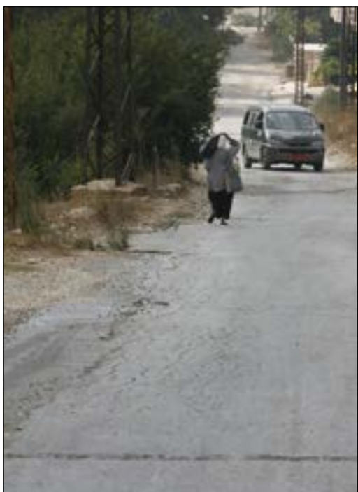
الطرق الموحدة إلى 22 قرية وبلدة تبدو كأنها شُقت بحكم الضرورة