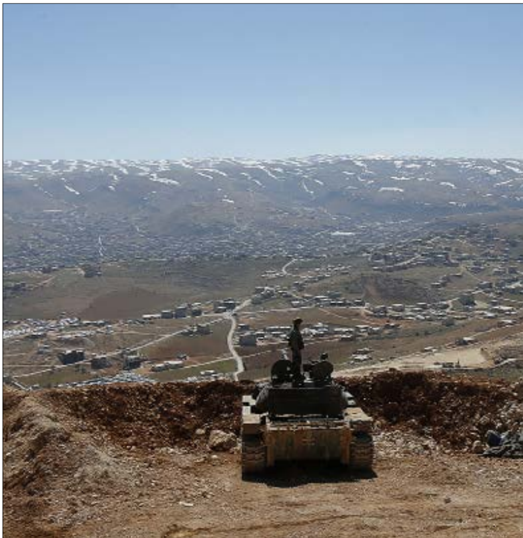
مصادر عسكرية: الطائرات المسيّرة يشغلها لبنانيون لا أميركيون (هيلم الموسوي)

بالنار، بدأ الجيش اللبناني والمقاومة إعداد العدة لمعركة تحرير الجرد التي يحتلها تنظيم «داعش». قيادة الجيش تبدو غير مستعجلة لإعلان انطلاق المعركة، كونها تنتظر اكتمال التحضيرات اللوجستية، بينها انتقال نازحين ومسلحين من عرسال إلى سوريا