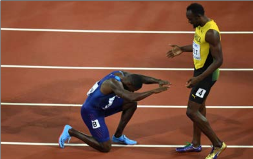
غاتلين ينحني امام بولت بعد تغلبه عليه في موندiale العاب القوى

ولعل ما قاله بولت بعد انتهاء السباق يختصر المشهد: «انطلاقتي تقتلني. عادةً تحسن مع مرور الجولات، لكنها لم تنجح. لست معجباً كثيراً بحواجز الانطلاق. أعتقد أنها الأسوأ التي اختبرتها في مسيرتي. لم يكن هذا أفضل مواسمي، ولن أعود عن قرار اعتزالي». وختم: «للمرة الأولى أشعر بأن قدمي متعبتان بعد أحد السباقات».