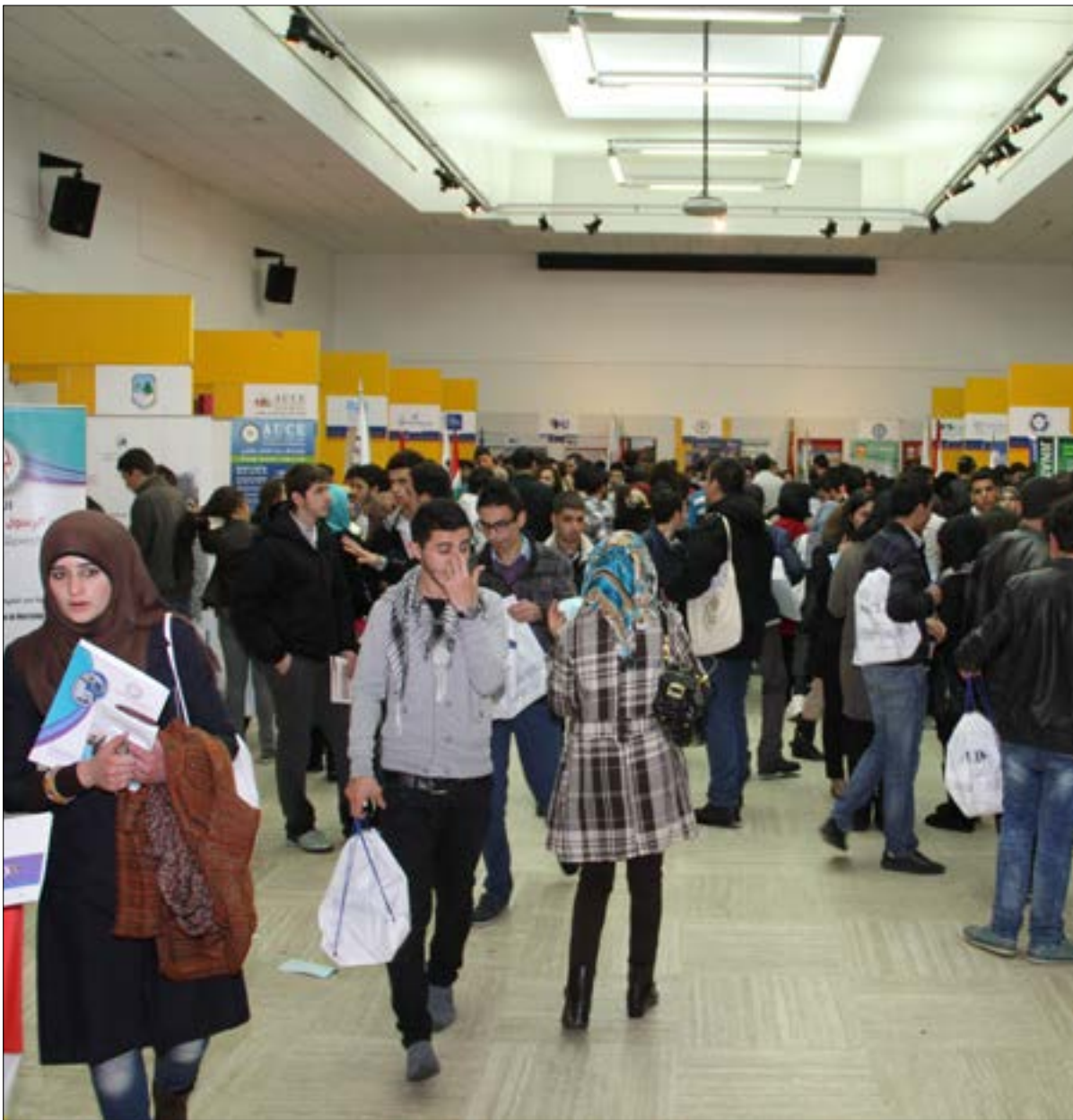
(من معرض المركز الإسلامي للتوجيه والتعليم العالي)

*أستاذ محاضر في كلية التربية في الجامعة اللبنانية الدولية