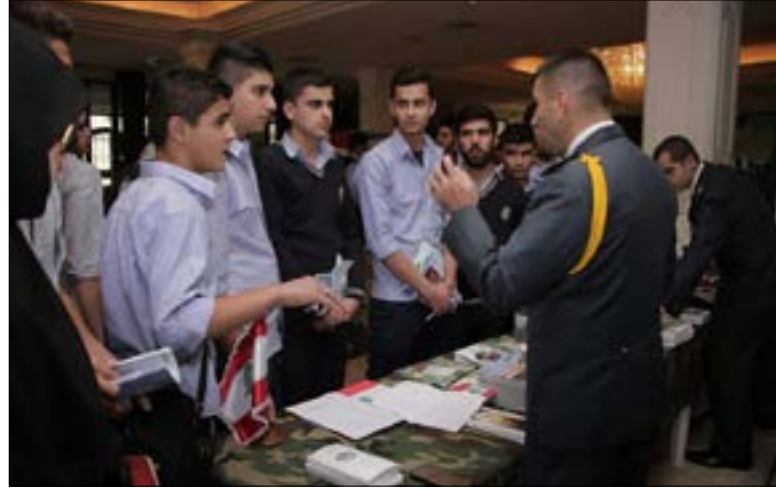
يتراجم الطومح عند عتبة القسط الجامعي

على مشارف عام دراسي جديد، يقف طلاب البكالوريا أمام خيار مؤثر في حياتهم، فالدراسة المناسبة باب للمهنة المستقبلية. حجم الارتباك غالباً ما يكون كبيراً بين المؤهلات والطموحات. فمن هؤلاء من يكون قد اطمأن إلى اختيار اختصاص المستقبل منذ أن يحسم أياً من فروع الثانوية العامة الأربعة سيدرس: العلوم العامة، أو علوم الحياة، أو الاجتماع والاقتصاد، أو الآداب والإنسانيات. نظرياً، يؤدي فرع من الفروع تلقائياً إلى نوع محدد من الاختصاصات والقطاعات المهنية. هؤلاء يبحثون عما يقنع طموحهم الذي يتراجع لأسباب تبدأ عند قيمة القسط الجامعي، ولا تنتهي على أعتاب المقررات والدروس ومقر الجامعة. الأسئلة الثلاثة الأكثر تداولاً بين الناجحين: ماذا سآدرس؟ كم يبلغ القسط؟ هل سأجد عملاً؟