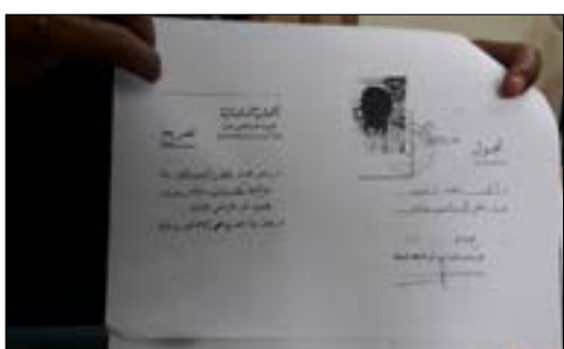
تصريح تجوله يحمله مكتومو القيد في وادي خالد

لكنها فوجئت بعدم ورود أسماء بعض أفرادها. وبعد مراجعات حثيثة، قيل لهم إن الملفات الخاصة بهم ضاعت في الداخلية! وبلغت المختار الوريدي إلى «حجم الكارثة الاجتماعية التي يعانيها مجتمع وادي خالد على كل الصعيد». مشيراً إلى أنه «حتى بطاقة التعريف منع المختار من إصدارها وحصر الأمر بالأمن العام منذ عام 2011. رغم ذلك، ولغاية اليوم، لم يفتح مركز للأمن العام لهذه الغاية. ونحن كمختار نعطيها على مسؤوليتنا، متجاوزين القانون». ويضيف: «هناك كارثة فعلية في حال توقيف أحد مكتومي القيد، أو ارتكابه جناية ما، لأن الكارثة هنا تقع عليه وعلى عائلته وعلى المختار الذي عليه أن يتعرف إليه ويتعهد بذلك أمام السلطات الرسمية»، مؤكداً «أن هناك أزمة على مختلف الصعيد. فالمرأة المكتومة القيد، حتى لو تزوجت مواطناً لديه هوية، لا يمكنها تسجيل الزواج، إذ توضع إشارة مكتومة القيد على الوثيقة وتعامل كما لو أنها أجنبية».