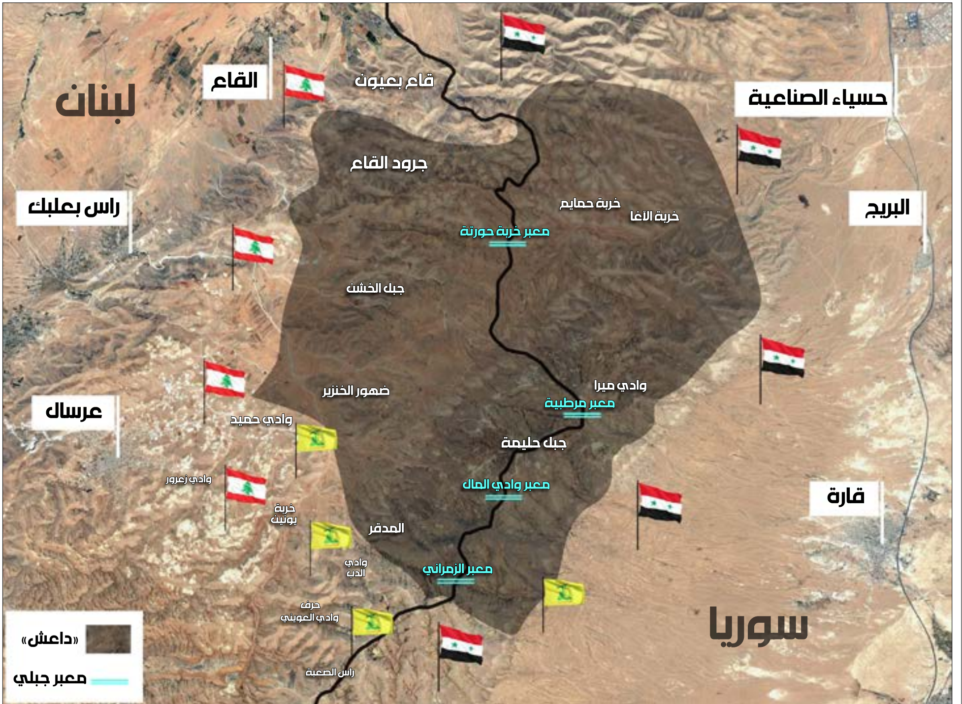
المنطقة الجردية التي يحتلها تنظيم «داعش» على طرفي الحدود اللبنانية - السورية (تصميم سنان عيسى)