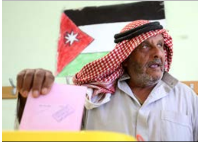
انسحب «الإخوانيون» من انتخابات عام 2007 احتجاجاً على «شبهات تزوير»