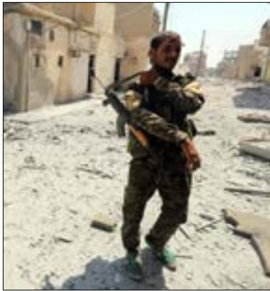
يكتشف تصميم وتيرة المعارك ضد «داعش» في العراق وسوريا عن صراعات دولية وإقليمية هدفها تقاسم النفوذ والمصالح

صراعات دينية في الظاهر، ووظيفية في الجوهر، ليسا طارئاً أيضاً على مجتمعاتنا الإسلامية. ونشير إلى أن اختلاف تجليات ومستوى التطرف والعنف الراهن، لا ينفي ارتباطها بجذور التطرف الديني ومقدماته التاريخية والموضوعية. وجميعها يعتمد في بنائه الأيديولوجي التمثلي على توظيف نصوص قرآنية لتبرير أعماله العدائية بحق المخالفين لهم في الدين والمذهب والطائفة.