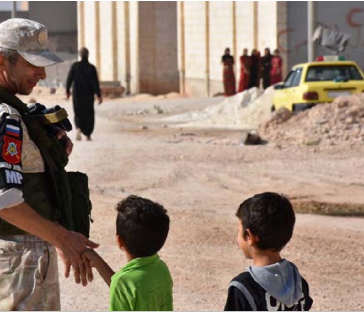
أحد أفراد الشرطة العسكرية الروسية في محيط مراكز الإيواء المؤقتة في منطقة جبريت في حلب

القدير التي حررها عبر إنزال جوي، نفذه قبل أيام، ليصبح على بعد أقل من 30 كيلومتراً لإتمام الحصار. ولم يكتف الجيش بنشاطه على هذا المحور، إذ كثف نشاطه العسكري على محورين متقابلين آخرين، وهما شمال جبل الشاعر؛ وجنوب شرق إثريا. وتمكّن من التقدم لمسافة 25 كيلومتراً انطلاقاً من المحور الأخير، مسيطراً على عشرات المواقع والتلال الممتدة بين إثريا وجبل الخشابية. وتأتي أهمية هذا التحرك لكونه قد يفضي إلى حصار «داعش» في المنطقة المحيطة بقرية عقيربات، وهي منطقة جغرافية صغيرة نسبياً مقارنة مع حجم نفوذ التنظيم على طول ريفي حمص وحماة الشرقيين وصولاً إلى دير الزور. ووفق المعلومات الأولية عن نقاط سيطرة الجيش، فإن قرابة 25 كيلومتراً فقط، تفصل تلك المواقع عن وحدات الجيش شمالي جبل الشاعر في ريف حمص الشرقي. كذلك أشارت المعلومات الميدانية إلى أن التنظيم يدي مقاومة شديدة لتحرك الجيش هناك، نظراً لأهمية تلك المنطقة من جهة؛ ولكونها شكّلت لسنوات قاعدة تدريب لعناصره من جهة ثانية. وبالتوازي، استمرت عمليات الجيش وحلفائه في محاذاة الحدود الأردنية، ضد «فصائل البادية». وتمكنوا من السيطرة على عدد من المخافر الحدودية الممتدة من النقطة 154 إلى النقطة 160. وبهذا التقدم، يكون الجيش قد حرر كامل النقاط الحدودية في ريف السويداء، إلى جانب عدد من النقاط ضمن حدود ريف دمشق، والتي تبدأ عند النقطة 155. وفي ضوء تحضيرات اجتماع «أستانا» المقبل، التي انطلقت في طهران، تشهد أنقرة حراكاً لافتاً لشخصيات أمنية وعسكرية رفيعة المستوى من إيران وروسيا. إذ التقى رئيس الأركان الإيراني محمد باقري، كلا من الرئيس التركي رجب طيب أردوغان ونظيره خلوصي أكار، خلال زيارة لأنقرة على رأس وفد عسكري رسمي. ويأتي ذلك في وقت ينتظر فيه