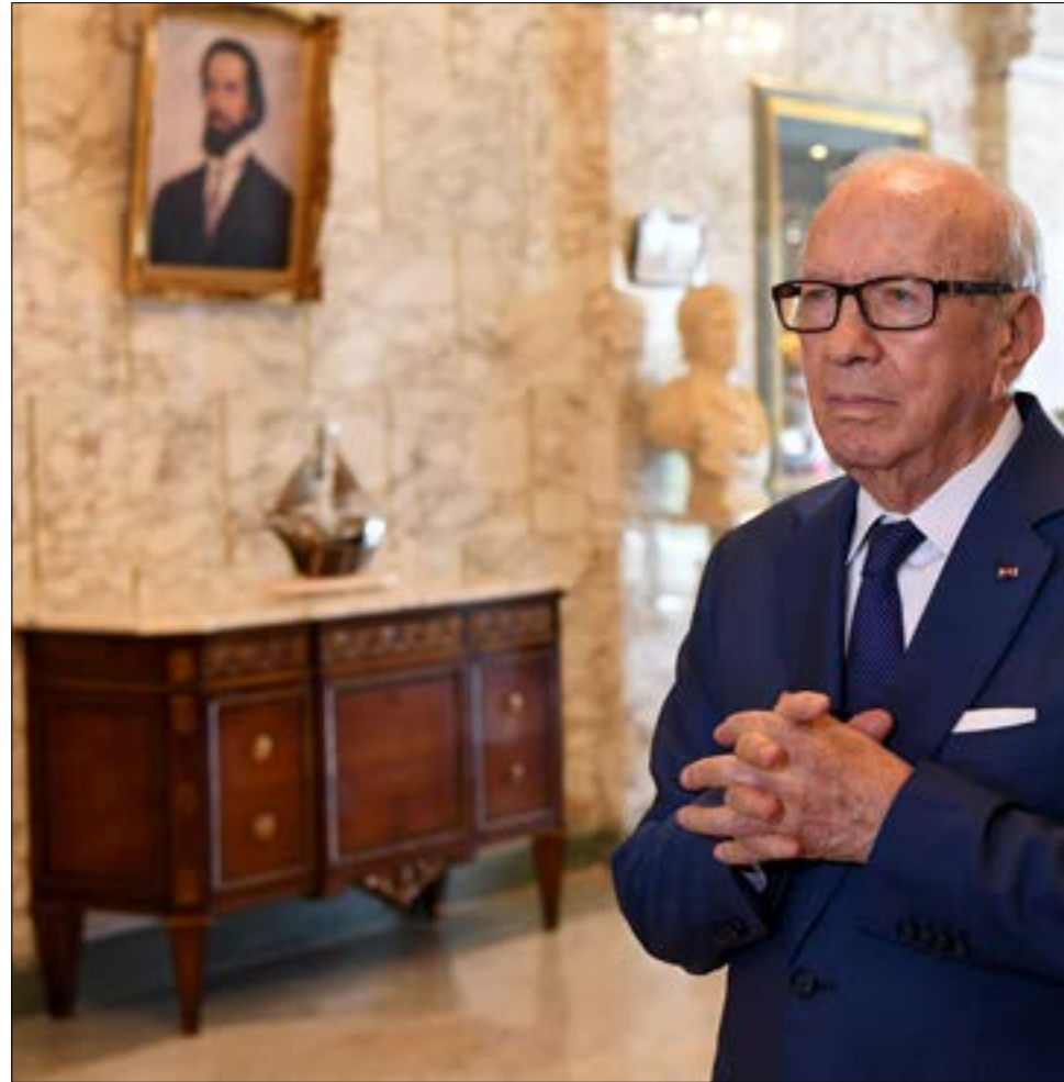
كان الحجر الذي القاه السبسي بوجهين، إذ فتح أيضاً مسألة زواج التونسيات بغير المسلمين