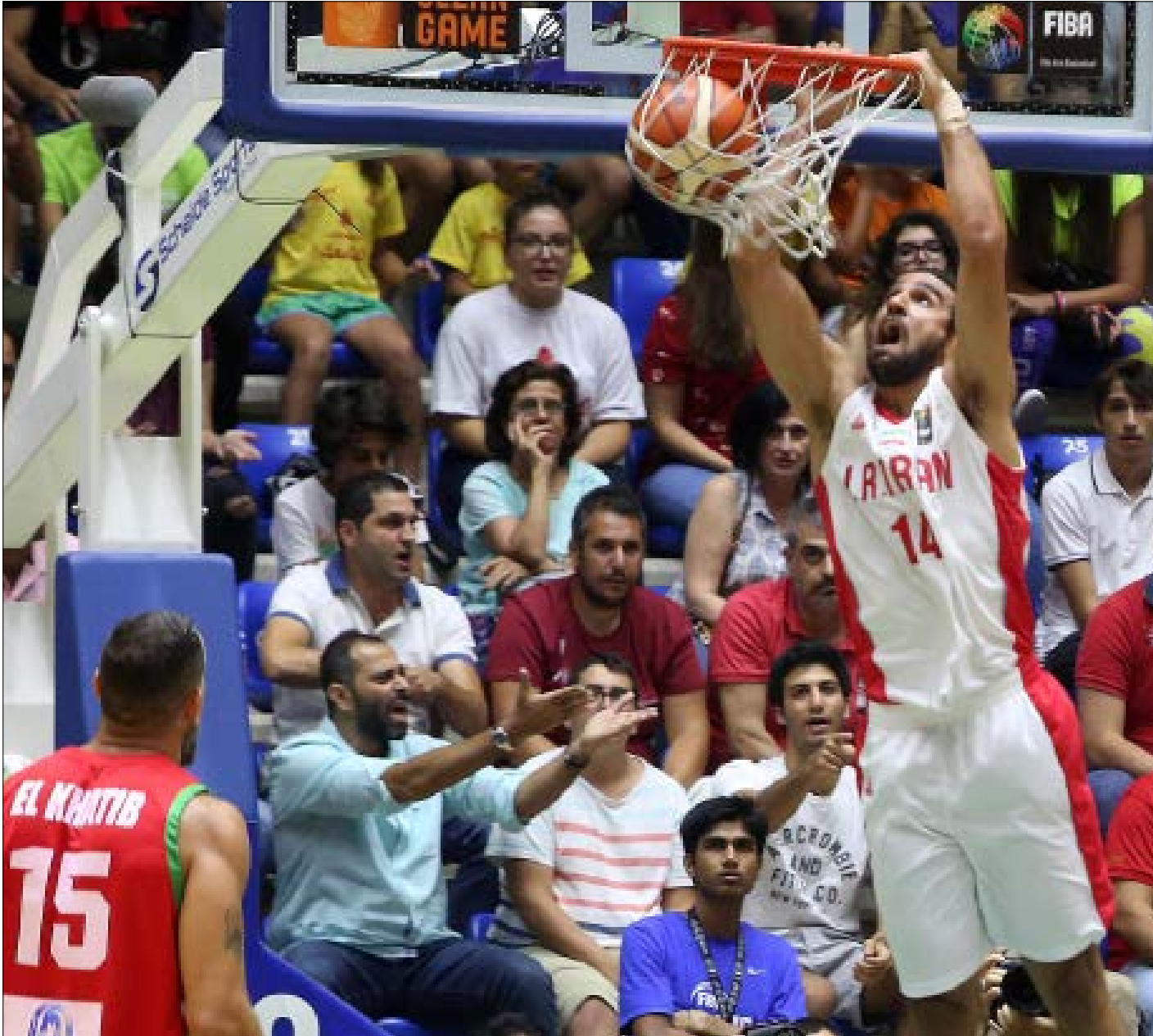
كثيرة هي الاسئلة التي يمكن طرحها بعد خروج لبنان امام ايران مساء امس

لم يتمكن منتخب لبنان لكرة السلة من تحقيق الحلم الذي كان اللبنانيون في انتظاره، فسقط امام منتخب إيران بنحو مؤلّم 70-80، في ريم نهائي كأس آسيا. لينترك ملعبه لمنتخبات أخرى ستكمل المشوار من دونه باتجاه منصة التتويج