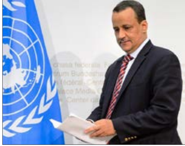
زيارة ولد الشيخ هي الثالثة لظهران منذ بدء العدوان على اليمن (ارشيف)