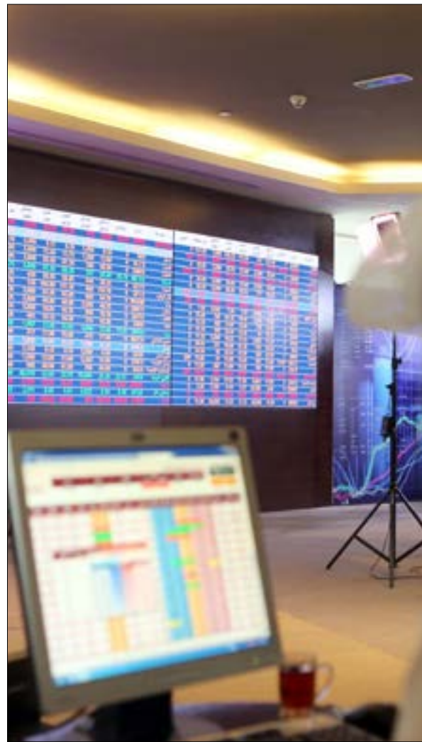
هي المرة الأولى التي يختبر فيها القطريون إدارة الأزمة من موقع المدافع، لا من طرف المصخر للإزمات (أضرب)

في منطلقات الحملة وامتدادها الزمني وتكتيكاتها، أثبتت عواصم «الرباعي»، منذ اللحظة الأولى لبدء الهجوم، خفة ونزقاً لا يضاهيان. إذ إنها عمدت إلى الإدلاء بجميع ما في دلوها في أيام معدودات، حتى إن جزءاً كبيراً منه ألقى في الليلة الأولى من الأزمة (23 - 24 أيار)، التي ظهر فيها الخطاب الشهير المنسوب إلى أمير قطر، تميم بن حمد آل ثاني. كان من الطبيعي أن تنخرط الوسائل الإعلامية المصرية، سريعاً، في جوقة لم تبقي ولم تذر، على اعتبار أن علاقتها ومن تمثل بقطر متوترة في الأصل، وأن التحاق القاهرة بركب المقاطعة ومزايدها على قائديه لم تكن تحتاج إلى كثير تخمين وتحليل. إلا أن العجاجة والصلف اللذين ظهرت عليهما الوسائل الإعلامية السعودية والإماراتية فور صدور أمر الهجوم، هما اللذان أثارا استغراب كثيرين، واستدعيا، خلافاً لما أرادته الرياض وأبو ظبي، تعاطفاً مع الدوحة، التي صورتها عجرفة قائدتي الحملة «حملاً» وديعاً» يريد «الذئاب» المحيطون به التهامه. هكذا، خسر السعوديون والإماراتيون، بأسرع مما كان متوقعا، ميزة التكنيك والتدرج التي تتيح لهم محاصرة الخصم وإمكانية المناورة، وأسدوا، من حيث لا يشعرون، خدمات دعائية للدوحة. الخطأ نفسه ارتكبه دول المقاطعة على مستوى مضمون الحملة الإعلامية، والتي تركزت على اتهام قطر بـ«دعم الإرهاب» و«التحالف مع إيران». تهمتتان لم يكن عسيراً دحضهما على أساس قاعدة واضحة و«خبثية» أساها الأميركي بقوله «إنه طريق ذو اتجاهين... لا توجد أيدي نظيفة»، بحسب تعبير