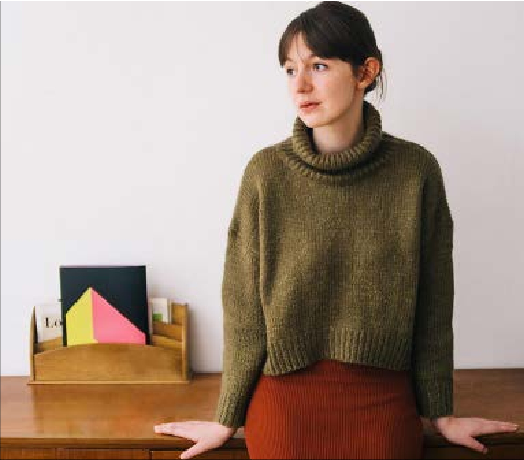
قصتها Mr. Salary وصلت إلى اللائحة القصيرة في مسابقة «صنادي تايمز»