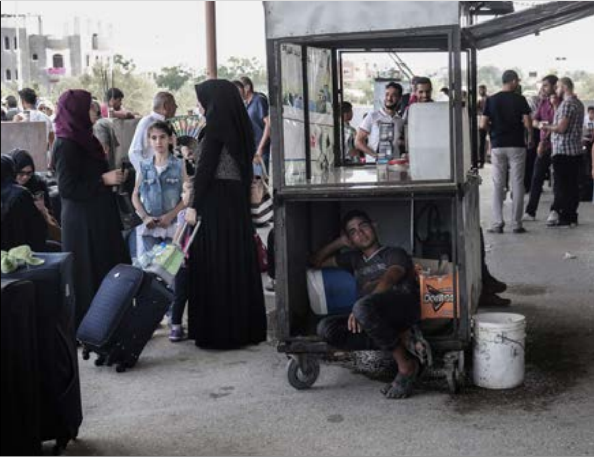
تكدس نحو ثلاثين ألف عالق خلال خمسة شهور من إغلاق المعبر

اقتصرت على القيادي المفصول من حركة «فتح» محمد دحلان وفريقه، وكذلك مع مسؤولي «الملف الفلسطيني» في المخابرات المصرية. خلال اللقاءات، لم تعد القاهرة بفتح معبر رفح بصورة يومية أو شبه يومية بعد عيد الأضحى كما يشاع، بل دارت النقاشات حول ضرورة استكمال حركة «حماس» التزاماتها على الحدود، رغم «تتمين» المصريين هذه الإجراءات.