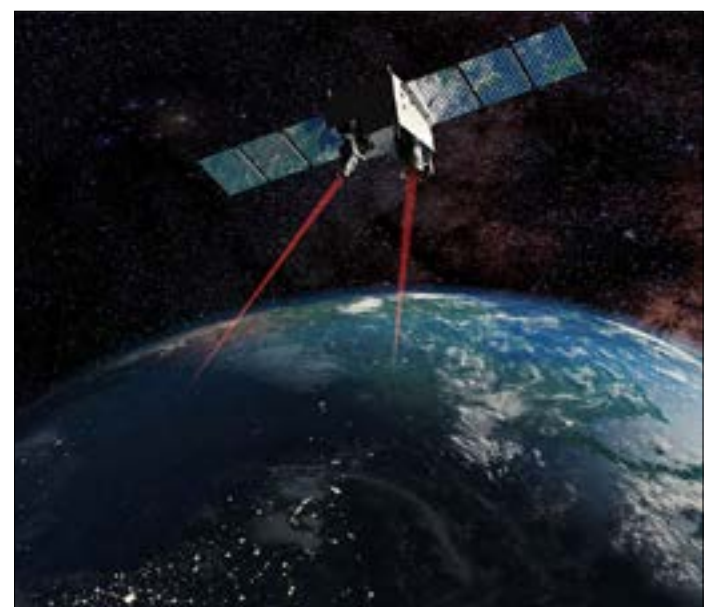
الصين تنجح في إرسال بيانات غير قابلة للكسر، من الفضاء إلى الأرض

لأول مرة في العالم، نجحت الصين منذ أيام في إرسال بيانات سرية غير قابلة للاختراق من الفضاء إلى الأرض من خلال تقنية «التشفير الكمومي» Quantum cryptography. هذا الإنجاز