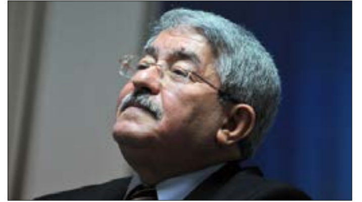
تأثير شخصية احمد اويحيى وتوجهاته الكبير من الأراء المتضاربة

تقبل التعازي يومي الخميس والجمعة 17 و 18 آب 2017 في صالون كنيسة مار عبدا، بلاط ابتداءً من الساعة الحادية عشرة قبل الظهر ولغاية الساعة السابعة مساءً.