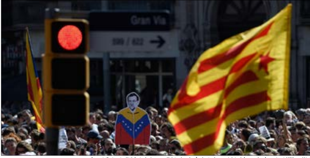
تظاهر الآلاف في شوارع برشلونة أمس احتجاجاً على اعتقال مسؤولين كاتالونيين

وقد حذرت حكومة راخوي بتصرفاتها «النقاش عن أحقية الانفصال أو عن أحقية القيام بالاستفتاء إلى تساؤل جدي بشأن القيم الديمقراطية في الدولة الإسبانية»، فيما «تبعدها عن دعم بعض الأحزاب السياسية بشأن الاستفتاء»، مشكلة في الوقت عينه