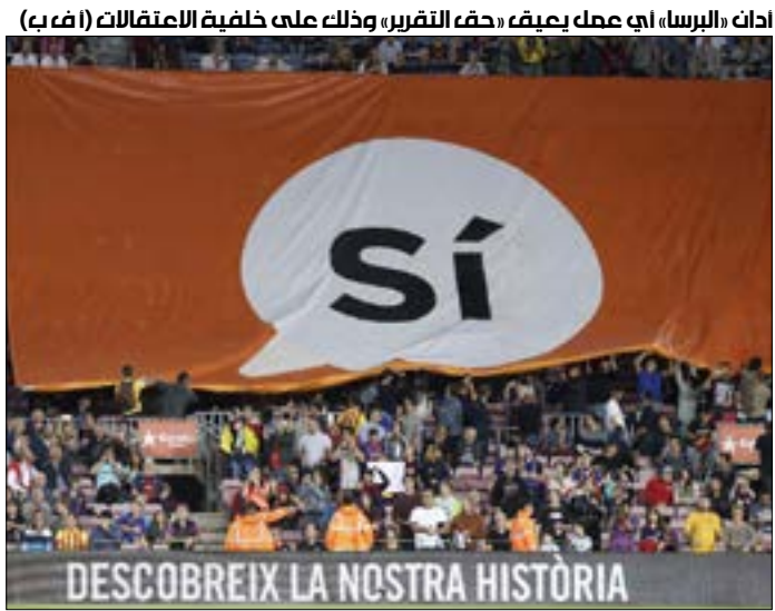
إحداث «البرسا» أي عمل يعيق، «حق التقرير» وذلك على خلفية الاعتقالات

على ضمان هذه الحقوق. سيواصل نادي برشلونة، في إطار احترامه الكامل لأعضائه المتنوعين، دعم إرادة أغلبية الشعب الكاتالوني، وسيطبق ذلك بطرق مدنية وسلمية ومثالية.