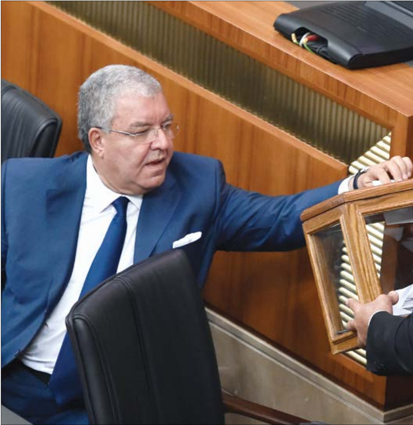
مصادر الداخلية: إلغاء البايومترية يعطك فرصة لتطوير الأحوال الشخصية (هيلم الموسوي)

مصير اعتماد البطاقة البايومترية في الانتخابات النيابية معلق بجلسة مجلس النواب وإقرار تمويك الانتخابات، في جلسة لن تعقد قبل عشرة أيام على أقل تقدير، وهو ما يضع وزارة الداخلية أمام استحقاق صعب لإنجاز البطاقة في الموعد المحدد. أكثر من طرف سياسي بات مقتنعاً بأن البايومترية «طارت»