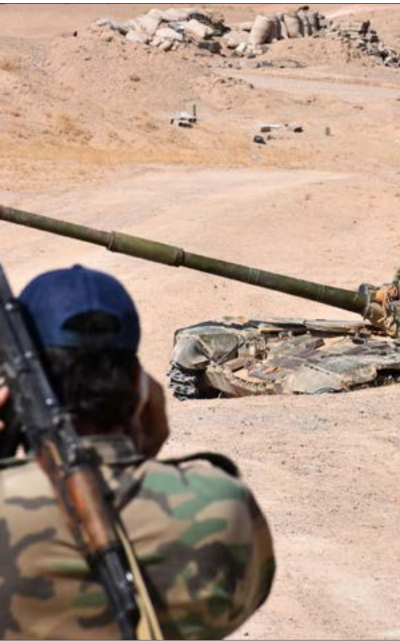
لعبت خطوة عبور الفرات دوراً محورياً في نسف المقاربة الأميركية لمعركة دير الزور

مهاجمة مناطق تخضع لسيطرة تنظيم «داعش» المتطرف وتحريرها منه، شريطة ألا تكون تلك المناطق مسرح عمليات للطرف الآخر». ورغم أنّ هذه التفاهات قد تسهم في منع الصدام بين الطرفين (أقله في المرحلة الراهنة)، غير أنّها تفتح في الوقت نفسه الباب أمام سباق متسارع بينهما للسيطرة على «تركة داعش». وضمن هذا السباق تبرز الحقول النفطية والغازية بوصفها الهدف الأثمن، لا سيما أنّ نجاح أي من الطرفين في السيطرة على أحد موارد الطاقة تعني احتفاظه به إلى أن «تدق ساعة الحقيقة» فإرضة إيجاد تسوية ما، أو تفجير معارك قد تكون غير مسبوقة في مشهد الحرب السورية. وتحوي دير الزور عدداً من أكبر حقول النفط السورية، مثل التنك (بادية الشعيطات) والعمر (شمال شرق الميادين)، علاوة على معمل غاز كونيكو (ريف دير الزور الشرقي). ويعدّ الأخير واحداً من أهم مصادر الغاز السوري، وسيطر عليه التنظيم المتطرف في أيار 2014. وتضاربت الأنباء أمس حول تنفيذ إنزال جوي في المعمل، كما حول هوية الجهة التي نفذت الإنزال. وقالت بعض المصادر إنّ الإنزال سوري روسي، فيما أكدت مصادر أخرى أنه إنزال أميركي. وفيما تحفّظت مصادر «قسد» على الإدلاء بأيّ معلومة في هذا الإطار، أكدت مصادر سورية لـ«الأخبار» أنّ «العلم السوري سيرتفع فوق المعمل، وسيتم الكشف عن التفاصيل رسمياً في الوقت المناسب». وعلاوة على