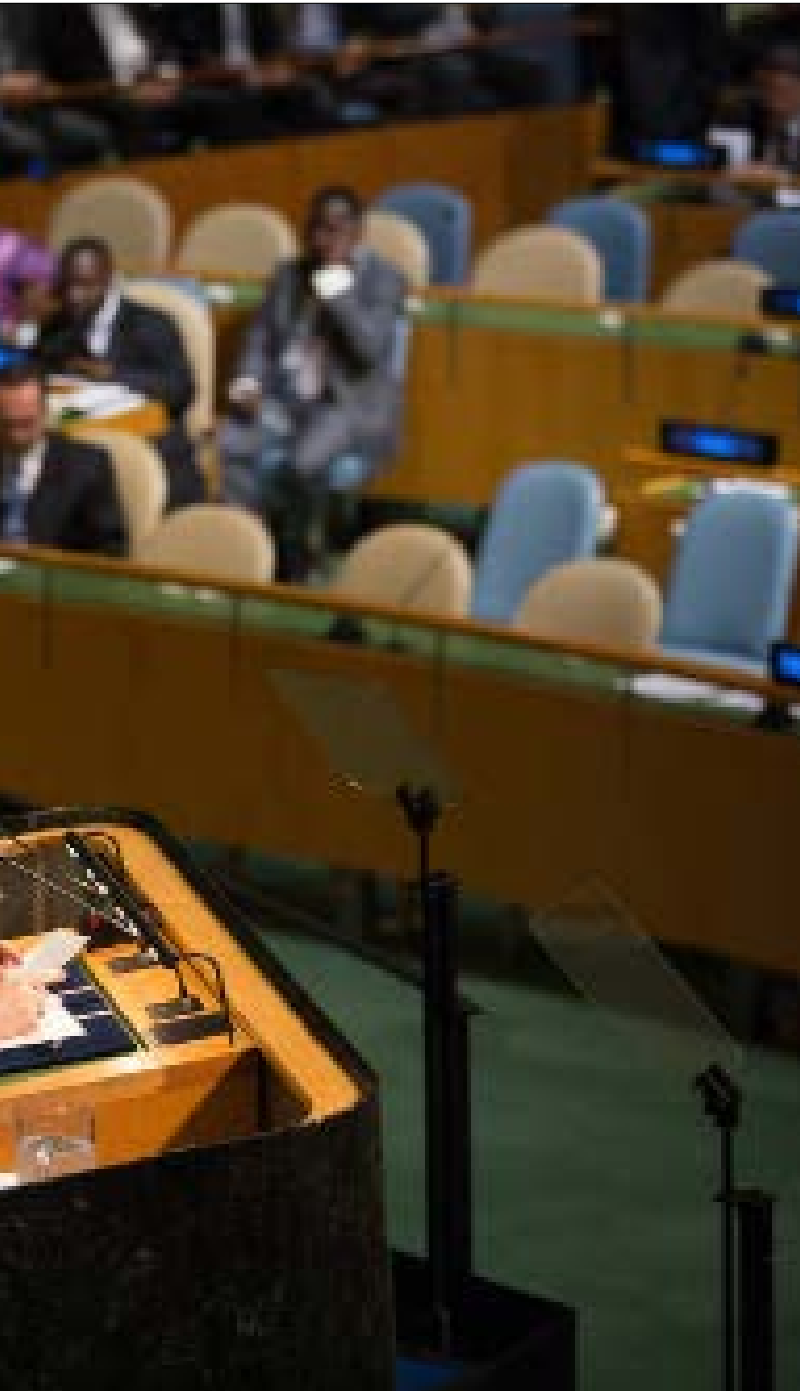
روحاني: خطاب ترامب جاهل وقبيح وحاقد ومليء بالمعلومات الخاطئة

في الشمال، وجدت الدعاية السعودية من يتصدى لها، ويعمل على إطلاق حملات مضادة لإبطالها وتبيان الأهداف الحقيقية للعدوان. ساعد في ذلك نبات الجبهة الداخلية، وتكاد