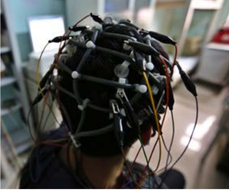
«في المستقبل القريب سيكون بالإمكان نقل المعلومات في كلا الاتجاهين: من وإلى الدماغ»

Wits للهندسة الكهربائية والمعلومات والمشراف على مشروع "Brainet"، أن هذا المشروع هو حدود جديدة في أنظمة واجهة الدماغ والحاسوب. هناك نقص في البيانات التي يسهل فهمها حول كيفية عمل الدماغ البشري ومعالجة المعلومات. Brainet يسعى إلى تبسيط فهم الأشخاص لأدمغتهم وأدمغة الآخرين وهو يفعل ذلك من خلال الرصد المستمر لنشاط الدماغ وكذلك تمكين بعض التفاعل. إلا أن هدف المشروع أبعد من هذا، إذ يقول باننانويتز في المستقبل القريب سيكون بالإمكان نقل المعلومات في كلا الاتجاهين: من وإلى الدماغ.