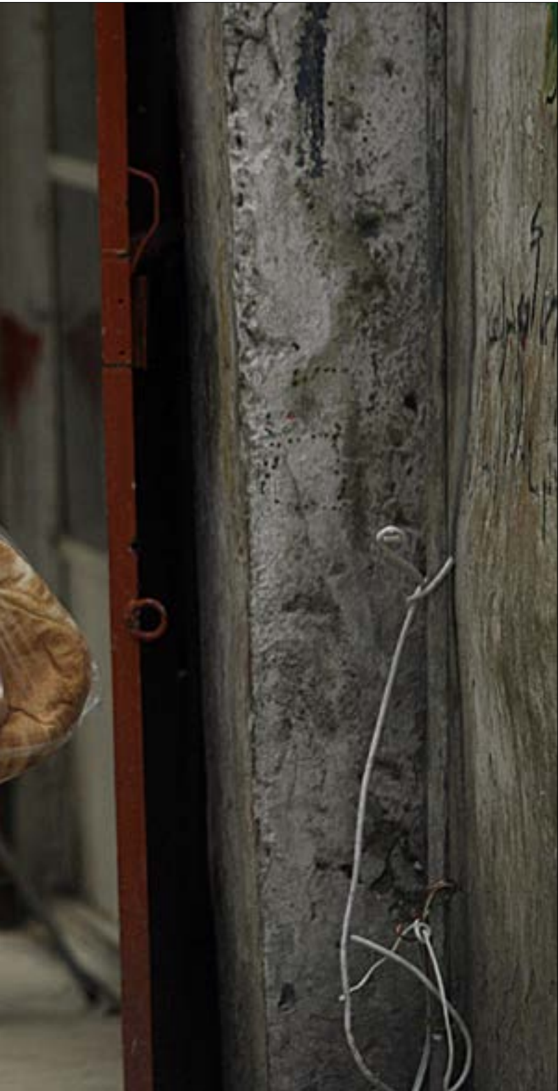
22 ألف شخص من القوى العاملة الناشطة في الشمال عاطلون من العمل

إنّ تفاقم تحديات التوظيف في الشمال بالنسبة إلى الفئات الأكثر فقراً سببه هشاشة النظام في لبنان، وتاريخ الصراعات فيه، فهناك عشرات الآلاف من البالغين في سنّ العمل والمتعلمين نسبياً العاطلين من العمل أو خارج القوى العاملة،