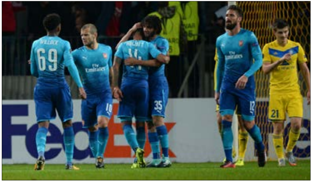
لاعبو ارسنال يحتفلون بالهدف ضد باتي بوريسوف