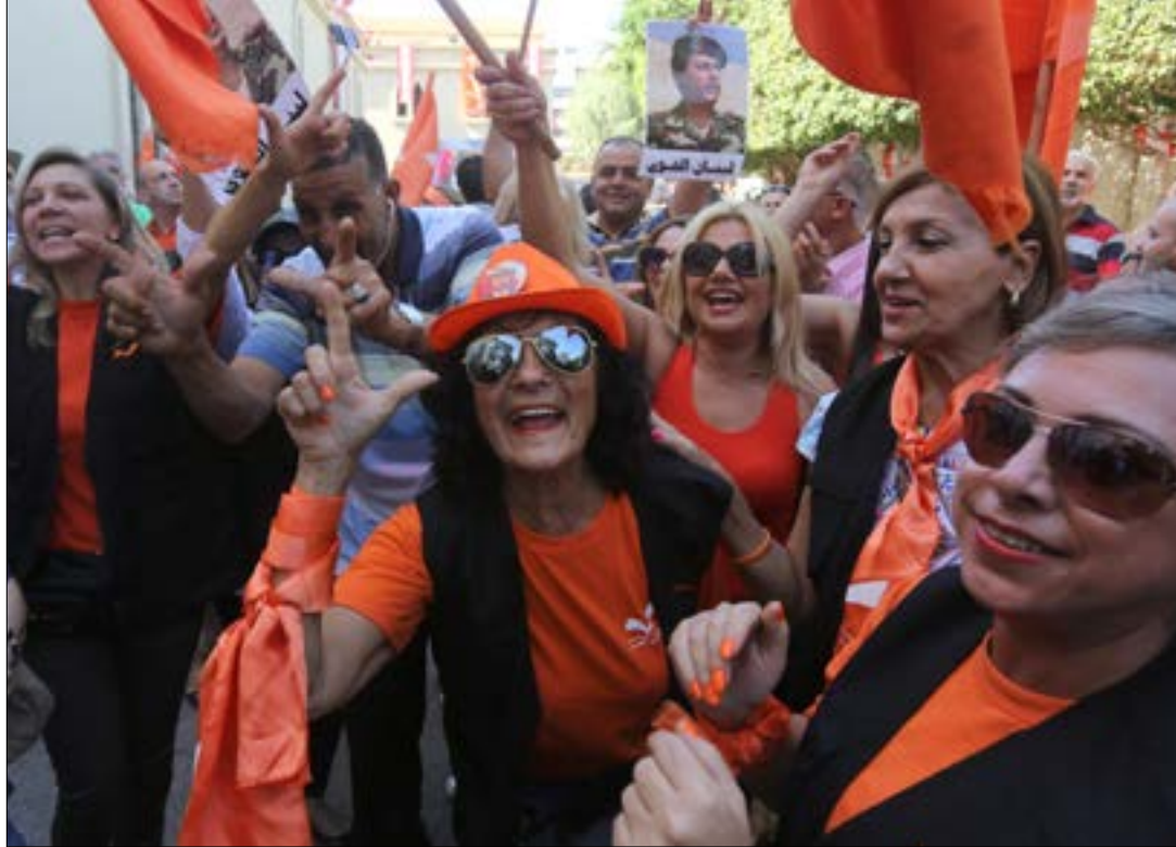
يجري التحضير لتوقيع وثيقة سياسية بين «التيار» وفاعليات سنّية في البقاع الأوسط