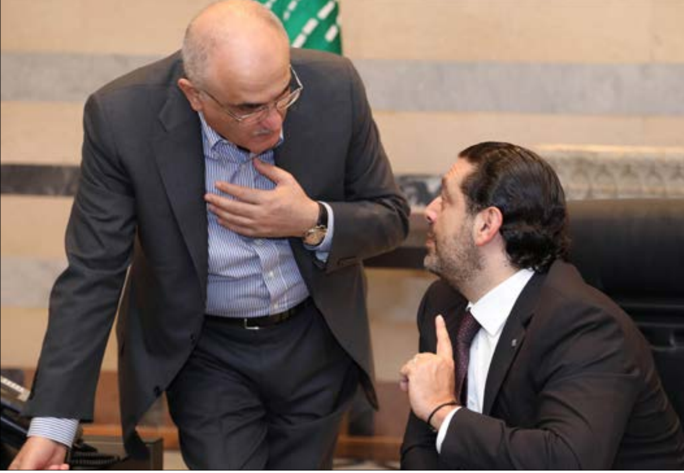
إذا استمر الاشتباك السياسي حتى الانتخابات ستكون مكونات الحكومة في مواجهة بعضها بعضاً (دالاتي ونهرا)

كلما اشتدت الأزمة الداخلية، يطرح مصير الحكومة في ظل تباين وجهات النظر حول بقائها وهدفها له مصلحة في استقالتها. لكن تطهير الحكومة لن يكون بمثابة عن إطاحة الانتخابات، فمن له مصلحة في ذلك؟