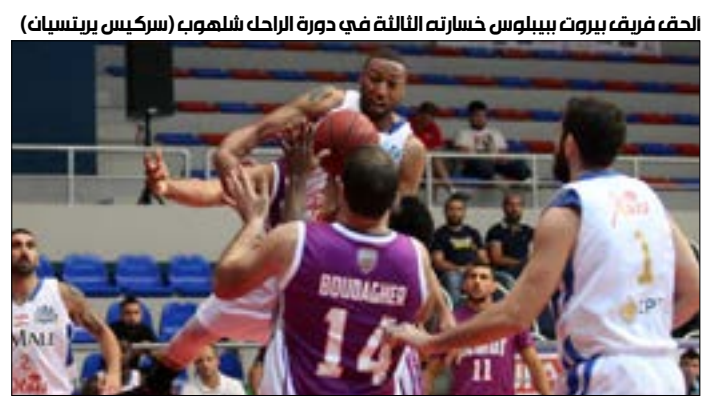
الحق فريق بيروت بيبيلوس خسارته الثالثة في دورة الراحل شلهوب (سركيس برنيسيان)

تأهل الرياضي إلى نصف نهائي بطولة آسيا لأندية لكرة السلة المقامة في الصين بعدما اكتسح مونو فامبيرز التايلاندي 73-110. وكان أمير سعود أفضل المسجلين ب 30 نقطة، منها 18 نقطة من ست ثلاثيات. وأضاف الأميركي كوينسي دوبي 23 نقطة، واستحوذ على ثلاث كرات مرتدة ومرر ثلاث كرات حاسمة. وكان تيراوات شناساوشون أبرز لاعبي مونو فامبيرز بتسجيله 19 نقطة. كما صعد بيتروشيمي الإيراني لهذا الدور بفوزه على داسين تاجيرز التايواني 80-97، كما تأهل تشينغيانغ الصيني بفوزه على شوكس تو جو الفلبيني 70-86، وفريق أستانا من كازاخستان على الشباب الأهلي الإماراتي 83-53. وسيلتقي الرياضي في الدور نصف النهائي اليوم الجمعة مع بيتروشيمي، كما سيلعب تشينغيانغ مع أستانا. محلياً، حجز فريق الأنطوني مقعده في الدور نصف النهائي لدورة الراحل هنري شلهوب لكرة السلة بفوزه على