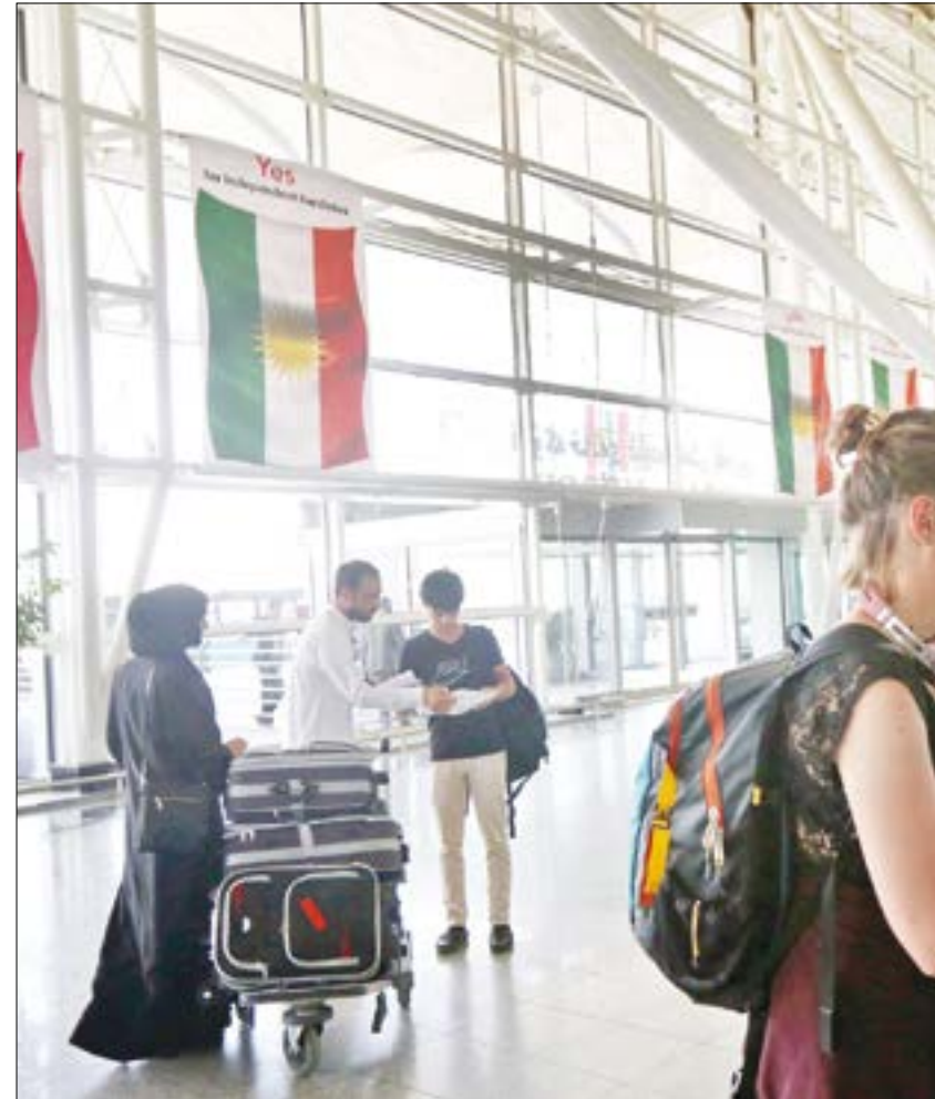
سعى اجانب يعملون في كردستان إلى المغادرة قبل وقف عدد من الرحلات اليوم

وكتف كل من العراق وتركيا وإيران الاتصالات في الأيام الماضية، فأنصل يلدريم أمس، بنائب الرئيس الإيراني إسحق جهانغيري، غداة مكالمة هاتفية مع رئيس الوزراء العراقي حيدر العبادي. وجرى ذلك في وقت أوصت فيه الخارجية التركية رعاياها «الذين لا يُعتبر وجودهم ضرورياً» بمغادرة كردستان العراق «قبل تعليق