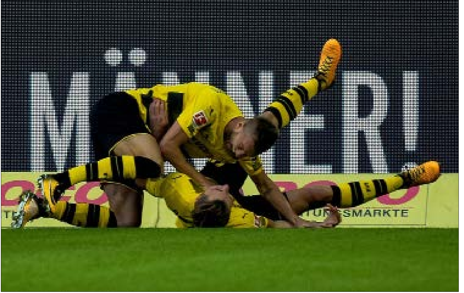
سجل دورتموند 19 هدفاً مقابل دخول هدف واحد في مرماه في 6 مباريات في الدوري