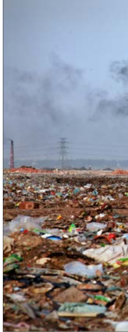
عندما يغزو التلوث كوكب الارض

ويتسبب التلوث البحري أيضاً فقدان التنوع البيولوجي ويعوق وظائف النظام الإيكولوجي وخدماته. ويمكن أن تتشابك معدات الصيد التي جرى التخلص منها، وتقتل الحياة البحرية وتخلق موائل الحياة البرية. كذلك بالنسبة إلى المبيدات والسموم الأخرى الملتصقة بجزيئات البلاستيك الصغيرة الموجودة في عبوات البلاستيك التي جرى التخلص منها (اللدائن الدقيقة)، والتي يمكن تناولها من طريق الخطأ من قبل الحياة المائية الصغيرة. وبمجرد تناولها، تتكاثر السموم مع انتقالها إلى السلسلة الغذائية، التي تتراكم في الطيور، والحياة البحرية وربما البشر.