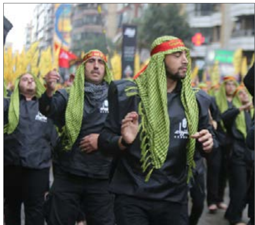
هك ببقي عاشوراء في خزنة الذاكرة التاريخية المفعمة بالحزن أم نخرج بها إلى الحاضر (مروان بو حيدر)

إذاً، هي فرصة ذات فريدة وإنسانية كبرى. لكن إلى أي حدّ يمكن الإستفادة منها ومن قيمها وثقافتها لتكون رسالة مفتوحة إلى الإنسان المنتمي واللامنتمي على حد سواء، ونخص المنتمي بفيض يعمق