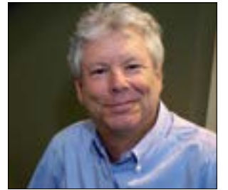
«نوبل» الاقتصاد: ثالر آخر العقنود

محاضرة بعنوان «الواقع الاقتصادي وسياسة التثبيت النقدي»: الخميس 12 تشرين الأول (أكتوبر) الحالي - الساعة السادسة مساءً - قاعة «المجلس الثقافي للبنان الجنوبي» في بيروت (نزلة برج أبو حيدر - خلف محطة «توتال»). للاستعلام: 01/703630 أو www.althakafi-aljanoubi.com