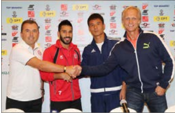
المدربات مع قائدي المنتخبين قبل المؤتمر الصحافي

يدخل منتخب لبنان لكرة القدم اليوم إلى ملعب المدينة الرياضية لمواجهة ضيفه الكوري الشمالي عند الساعة 17,30 ضمن تصفيات كأس آسيا وعينه على نقاط المباراة كي تكون بطاقة سفره إلى الإمارات عام 2019 حيث ستقام النهائيات. يعتبر المدير الفني لمنتخب لبنان المونتينيغري ميودراغ رادولوفيتش أن اليوم قد يكون تاريخياً في سجلات الكرة اللبنانية حين يتاهل لبنان إلى النهائيات للمرة الأولى عبر التصفيات في حال فوزه على الكوري الشمالي.