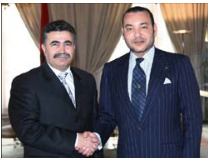
زار بيريتس المغرب عام 2006 واستقبله حينها الملك محمد السادس

كتل «حزب العدالة والتنمية» الذي يقود الحكومة، ونقابة «الاتحاد المغربي للشغل» (أكبر نقابة بالبلاد)، ونقابة «الكونفدرالية الديمقراطية للشغل»، وجاء في البيان أن تلك الكتل «تلقت باستهجان كبير خبر حضور وزير الدفاع الصهيوني السابق، ومجرم الحرب بيريتس إلى جانب صهاينة أعضاء في الكنيست، للمشاركة في أعمال المناظرة الدولية» التي تجري تحت عنوان «تسهيل التجارة والاستثمارات في منطقة المتوسط وأفريقيا».