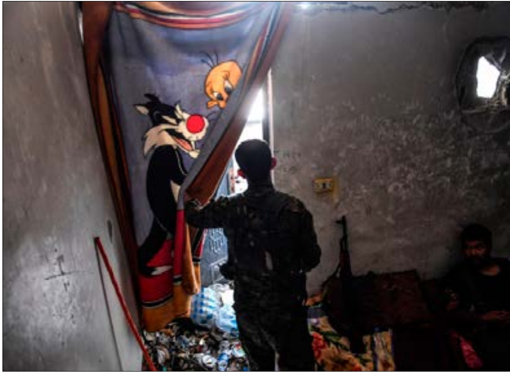
وسمعت «قوات سوريا الديمقراطية»، سيطرتها جنوب شرق، حقل الجفرة في ريف دير الزور الشرقي

مع الإعلان الرسمي التركي عن بدء الجيش نشاطه الأوّلي في منطقة «تخفيف التصعيد» المقررة في إدلب ومحيطها، دخل «داعش» في تطور لافت، على خط إدلب ومحيطها، بعد سيطرته على محيط منطقة الرهجان في ريف حماة الشمالي الشرقي، على حساب «هيئة تحرير الشام»