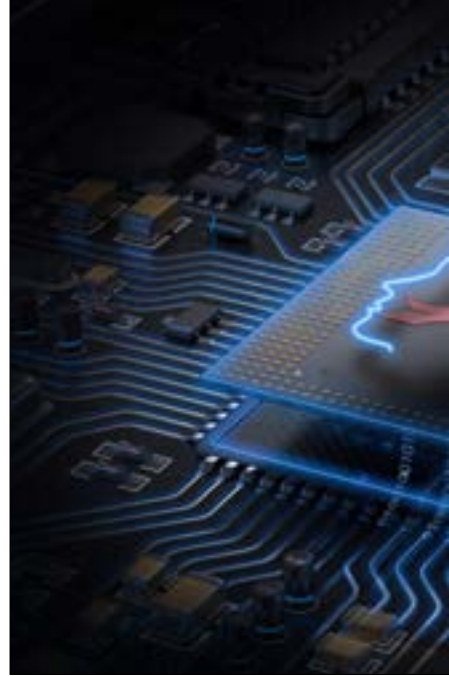
تحوي الشريحة على 5,5 مليار ترانزستور في ستيتمتر مربعاً واحداً!

وهو أسرع بالمقارنة مع الرقاقات الأخرى في السوق.