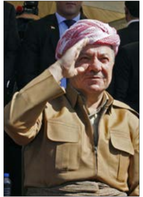
يقابل التمهيلات البغدادية «برود» كردي، ودعوات البرزاني إلى حل الأزمة بالحوار (أ ف ب)

بيدو حيدر العبادي غير حاسم في مواضعه إزاء أزمة «كردستان»، فهو يواصل إصدار قرارات تصعيدية ضد حكومة «الإقليم» دون التماس الطبقة السياسية العراقية والعراقيين أي أثر حقيقي لها. المراوحة سيّدة الموقف اليوم، تقابلها برودة مسعود البرزاني في استيعاب غضب الساسة العراقيين، وإلزامهم على الحوار وفق شروطه