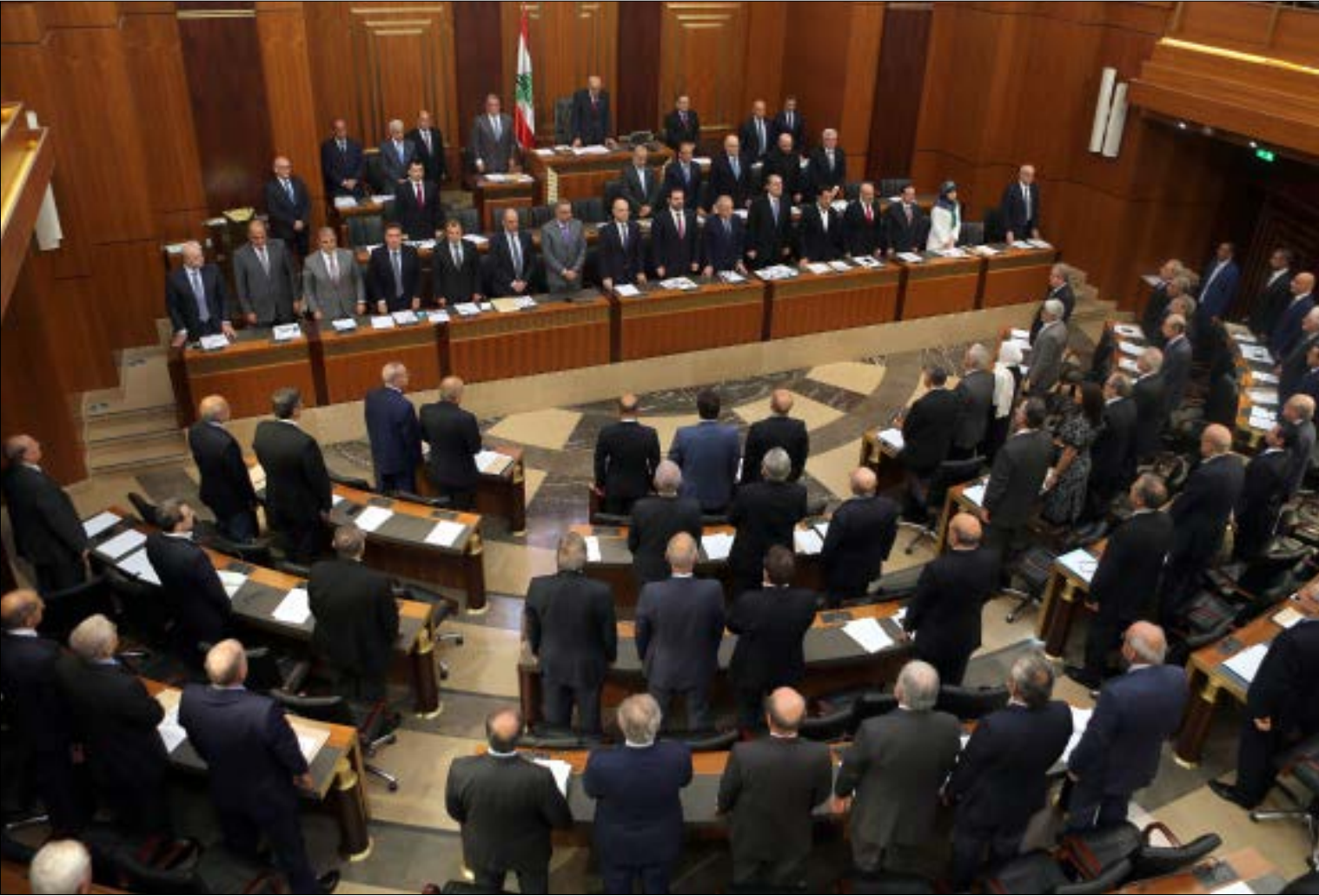
اعتراض السنيورة على زيادة الضريبة على ارباح الشركات وطالب برفض ضريبة 10% على الاتصالات (هيلم الموسوي)

في الحصيلة، لم تفلح الضغوط الكثيفة التي مارستها المصارف بتطير قانون الضرائب، كما لم تفلح بتعديله بما يتيح لها البقاء معفاة من موجب تسديد الضريبة على الفوائد، وكان لافتاً جداً أن المادة التي تعارضها المصارف لم يجر أي نقاش بشأنها ولم يعترض عليها أحد، علماً بأن جمعية المصارف تقدّمت باقتراح يرمي إلى رفع الضريبة على أرباح الشركات إلى 20% بدلاً من 17%، في مقابل أن تبقى المصارف معفاة من الضريبة على الفوائد، وهذا الاقتراح طرحه رئيس الحكومة سعد الحريري على وزير الخارجية جبران باسيل، فيما رفض الرئيس بري أي نقاش فيه... كذلك لم تفلح اعتراضات حزب الله وحزب الكتائب في إلغاء زيادة الضريبة على القيمة المضافة من 10% إلى 11%، ولكن جرى تخفيض الرسم على بطاقات الخلوي المسبقة الدفع من 2500 ليرة إلى 250 ليرة وبقي الرسم بقيمة 2500 ليرة على فواتير الاتصالات الأخرى، وتمت إعادة رسم المغادرة عبر المطار على الدرجة السياحية إلى قيمته السابقة من دون تعديل، أي 50 ألف ليرة بدلاً من 60 ألف ليرة وردت في القانون المبطل.