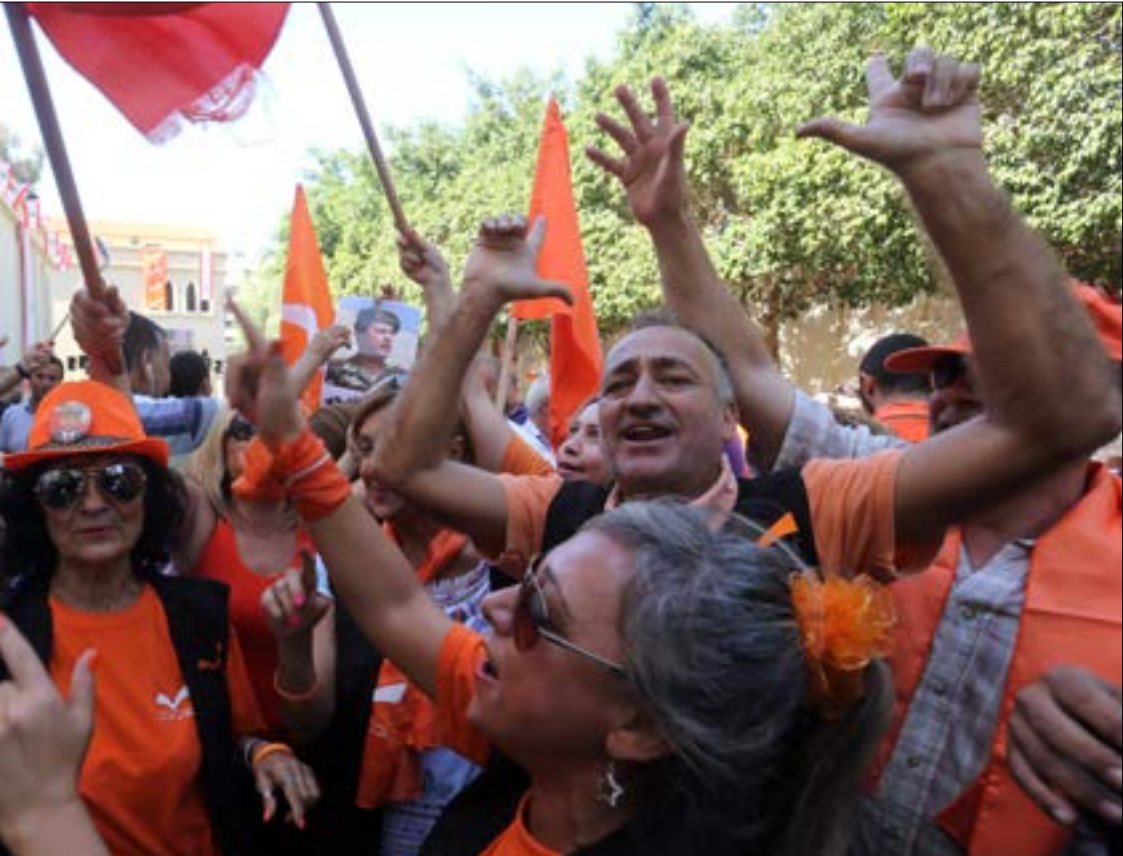
هيئة الشوف تخضع لامتحان جدي على الأرض نهاية الشهر الجاري لتحديد مصيرها (هيثم الموسوي)

جيدة ويتقابلان دورياً. وفيما ينتظر تيار الأشرفية قرار الوزير جبران باسيل بشأن المنسّق والهيئة بعد إعطاء متني مهلة معينة لتصحيح الخلل، يتداول هؤلاء ثلاثة أسماء لخلافة متني: المحامي الياس عباس، المحامي عماد جعارة، والمنسق الحالي في المدور المهندس حميد دياب (على اعتبار أن القانون الجديد ضمّ المدور إلى الأشرفية). فيما بادر متني أخيراً، بحسب المصادر، إلى استئجار مسرح في الأشرفية ليكون مقراً للماكينت الانتخابية.