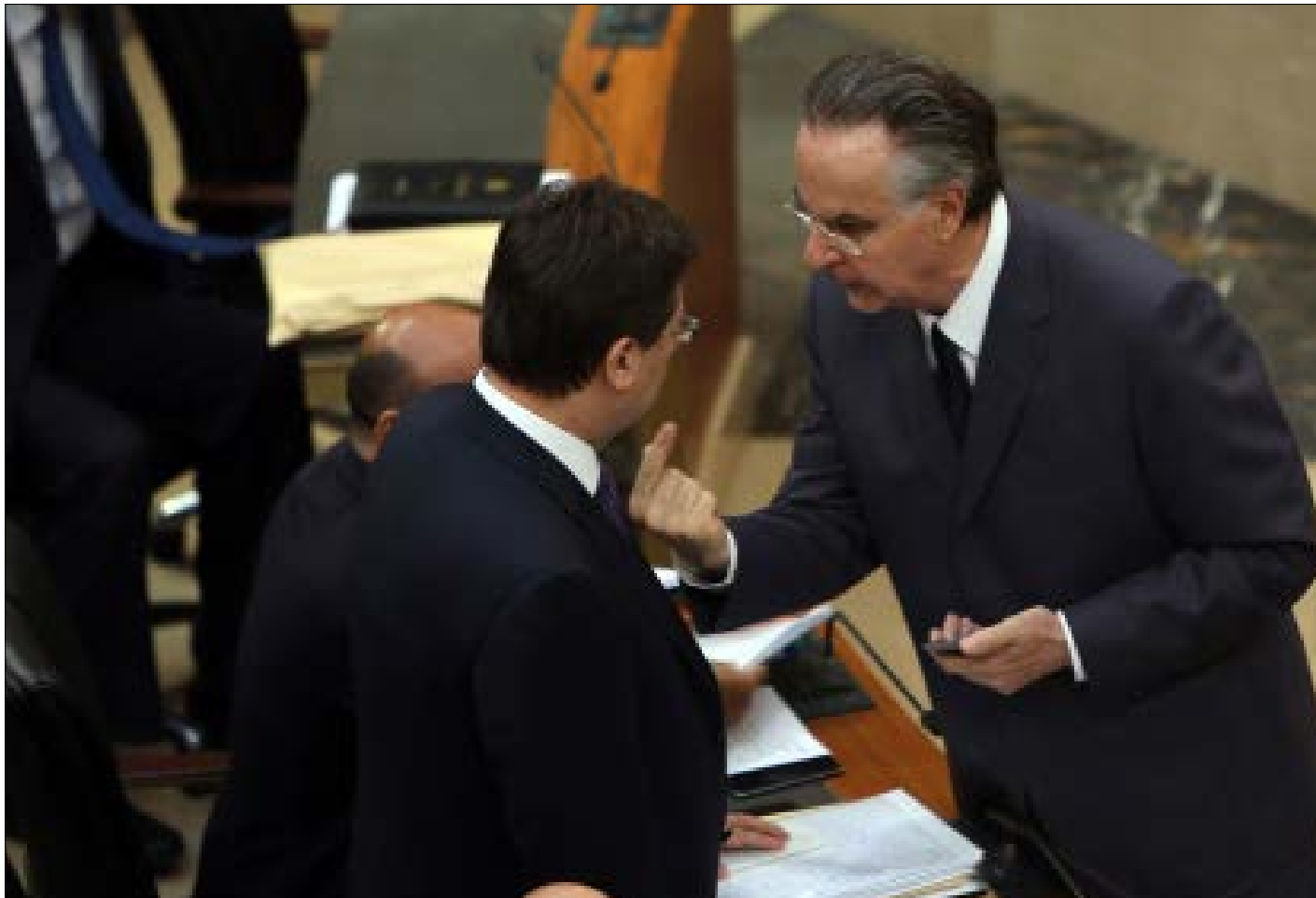
لا يحول مصرف لبنان إلا مبلغاً مقطوعاً بقيمة 40 مليون دولار سنوياً منذ عام 2009 (مروان طحطح)

خلافاً للمزاعم المتكررة بأن هذه الكلفة والخسائر لا ترتب أي أعباء على المال العام ولا تسهم في زيادة الدين العام. في هذا الشأن، قال عدوان إن المراقبة والمحاسبة غير موجودتين «لأن مصرف لبنان لديه علاقات أكبر من أن يتخطاها أحد»، ملفحاً إلى منافع تمنح للسياسيين والإعلام، ومتحدثاً عن قروض للتلفزيونات بقيمة 15 مليون دولار بغائبة صفر تقريباً، وقال «فيما نحن مشغولون بالضرائب، كان على مصرف لبنان أن يدخل مليار دولار سنوياً إلى الخزينة العامة وليس العكس»، وأعطى مثلاً أن مصرف لبنان دفع