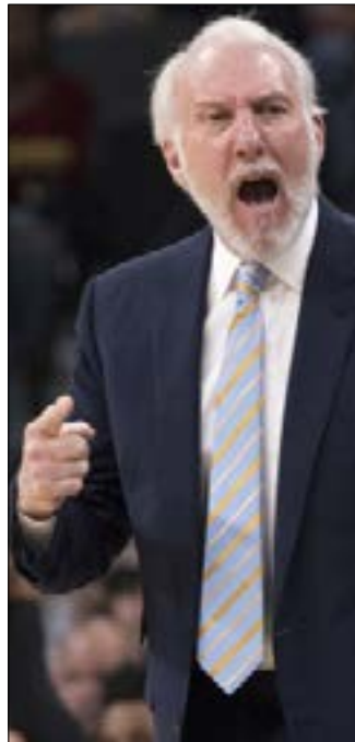
ووفق بوبوفيتش الرئيس ترامب بـ «الجبان»

ولم يكن بوبوفيتش، الذي كان ولا يزال من أشد المنتقدين لسياسة الرئيس الجديد، راضياً على الإطلاق حيال تصريح الرئيس، ما دفعه إلى الرد، قائلاً: «إن هذا الرجل الموجود في المكتب البيضاوي هو جبان بلا روح يعتقد أنه ليس بإمكانه أن يصبح كبيراً إلا من خلال إهانة الآخرين... والكذب بشأن طريقة تعامل الرؤساء السابقين مع مقتل الجنود، يشكل انحساراً غير مسبق».