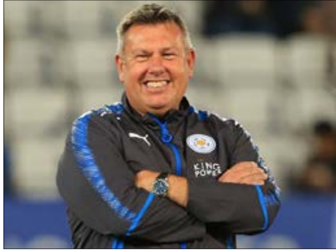
قرر ليستر إقالة مديره كرايغ شيكسبير لسوء النتائج

قرر نادي ليستر سيتي الإنجليزي إقالة مديره كرايغ شيكسبير من منصبه بسبب النتائج المخيبة التي حققها الفريق بإشرافه منذ مطلع الموسم الحالي.