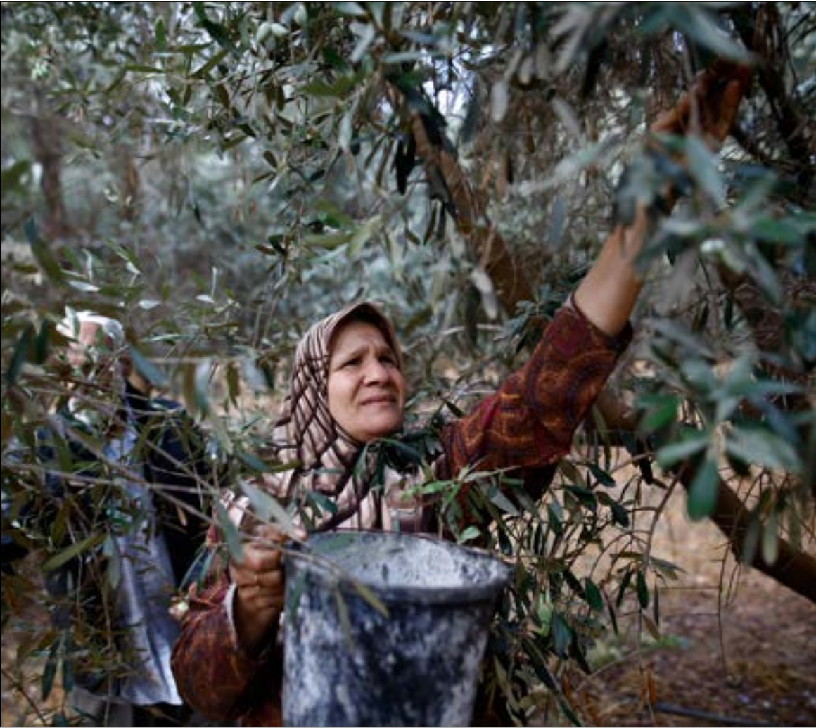
فلسطينيون يقطفون موسم الزيتون في غزة

حكومية أن «غالبية الوزارات بدأت تجهيز قوائم بأسماء الموظفين العاملين في وزارات غزة، سواء الذين عملوا قبل سيطرة حماس على القطاع أو الذين عيّنتهم الحركة عقب ذلك تمهيداً لدمجهم»، وفق اتفاق المصالحة الأخير في القاهرة، إضافة إلى ذلك، أعلنت «التوافق» البدء في «إعادة هيكلية الوزارات والدوائر الحكومية في غزة، وعمل اللجان المختصة بالمؤسسات والمعابر والأمن».