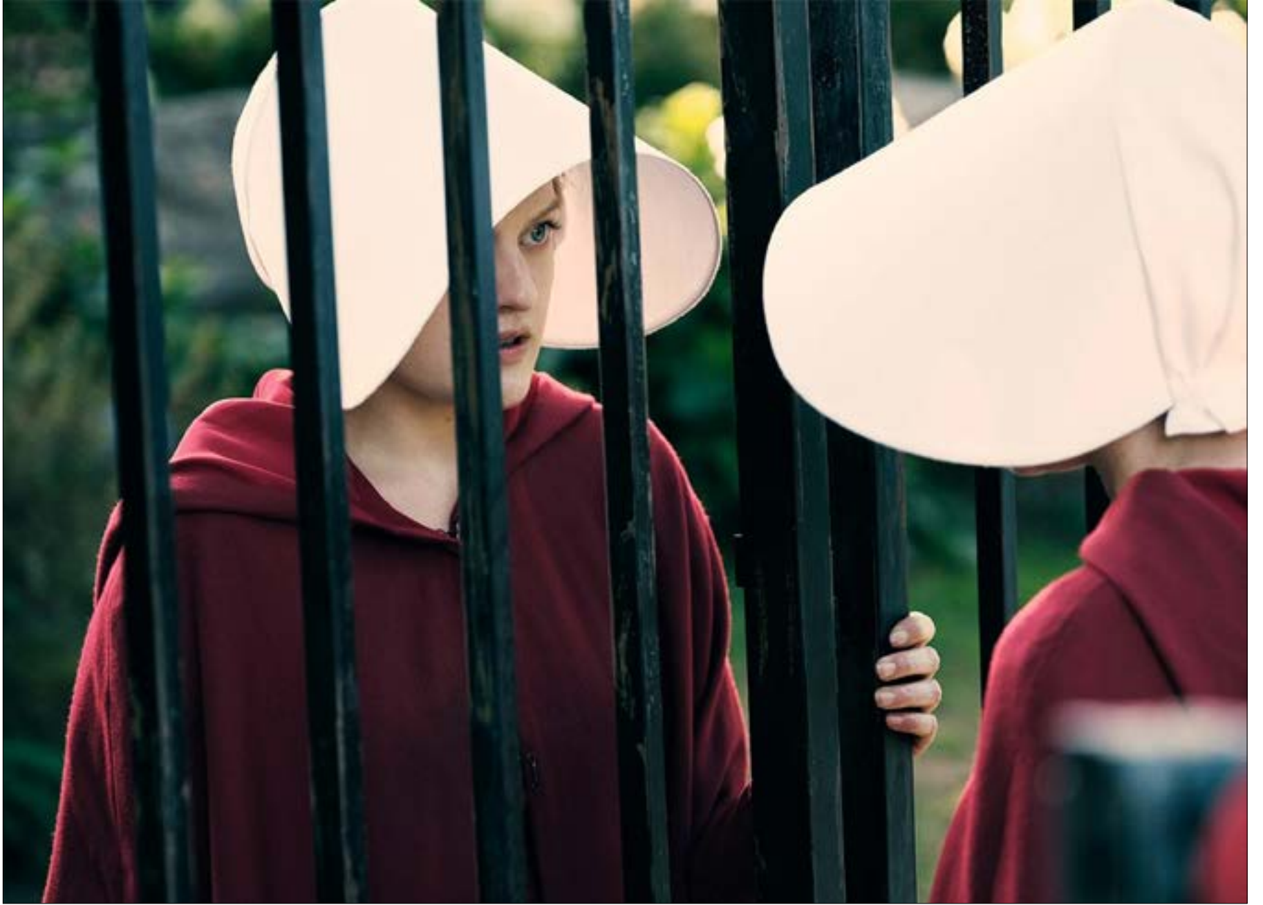
جشدت إيزابيث موس شخصية «جون» (أوفريد) التي تتحول إلى خادمة مخضصة للانجاب