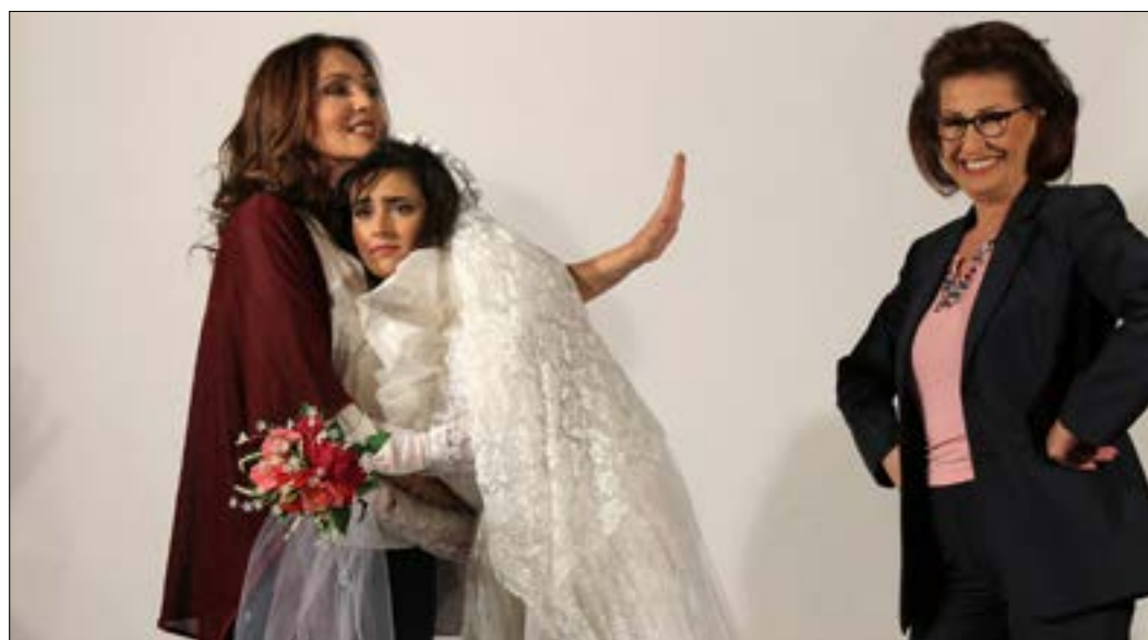
من عرض «ولو داريت عنك حبي»، من إخراج غابريال يمين

«ولو داريت عنك حبي»: بدءاً من الغد (س: 20:30) حتى 26 تشرين الثاني (نوفمبر) - «مسرح الجميزة». للاستعلام: 76/409109