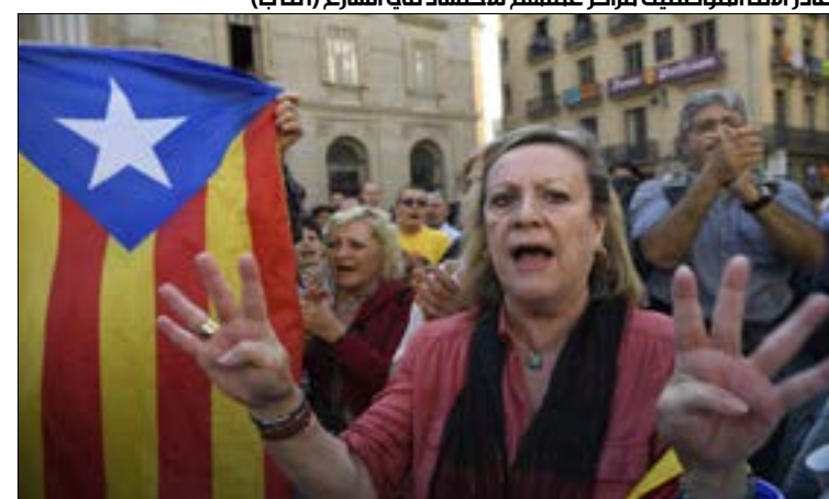
غادر آلاف الموظفين مراكز عملهم للاحتشاد في الشارع

في المئة من الأصوات و43 في المئة من المشاركة. وأعلنت أدا كالو أن «وجود السجناء السياسيين لا مكان له اليوم في الاتحاد الأوروبي». ومع معارضتها إعلان الاستقلال من جانب واحد، انتقدت «إضفاء الطابع القضائي على الحياة