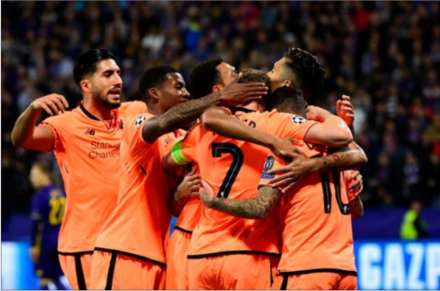
اكسند ليغروبك ماريبور في ملعبه 0-7

قال الإنكليز كلمتهم أمس في دوري أبطال أوروبا. حيث خطف ليغروبك الأنظار بسباعية. وحسم مانشستر سيتي موقعه أمام نابولي. وأسقط توتنهام بأداء قوي ريك مدريد في فخ التعادل في معقله «سانتياغو برنابيو»