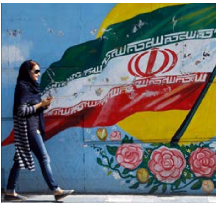
أكد سلامي أن تصريحات ترامب كانت مليئة بالعجز والفشل (اف ب)

الاستراتيجي الحالي، وخصوصاً المخاوف المتعلقة بالبرنامج الباليستي الإيراني والقضايا الأمنية الإقليمية».