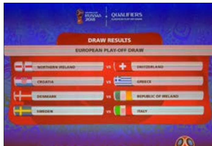
قرعة الملحق الأوروبي المونديال 2018

لن يكون المنتخب الإيطالي في منأى عن الخطر في الملحق الأوروبي المؤهل إلى نهائيات كأس العالم 2018 لكرة القدم التي تستضيفها روسيا، وذلك بعدما أوقعته القرعة التي سحبت في زيوريخ، أمام عقبة نظيره السويدي. وكانت إيطاليا قد حلت ثانية في المجموعة السابعة بفارق 5 نقاط خلف إسبانيا، وقد صنفت في المستوى الأول مع منتخبات سويسرا وكرواتيا والدنمارك. وستلقتي في المواجهات الثلاث الأخرى، إيرلندا الشمالية مع سويسرا، وكرواتيا مع اليونان، والدنمارك مع جمهورية إيرلندا،