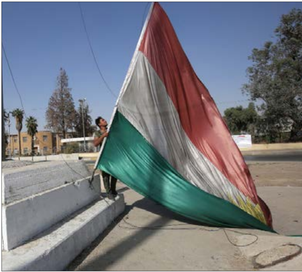
سيطرت القوات العراقية على معبر بروجين خان الدولي مع إيران، وقضاء خانقين وسنجان، وناحية جلولا وبمشيقية

سياسية في الإقليم (في إشارة منه إلى بافل جلال الطالباني، نجل مؤسس الاتحاد الوطني)، وهو أمر أدى إلى تحويل خط التماس الذي تم الاتفاق عليه قبل عملية تحرير الموصل في 17/10/2016 بين بغداد وأربيل إلى أساس للتفاهم حول كيفية نشر القوات العراقية والقوات في الإقليم». وأضاف في بيانته أننا «لم نرغب بالحرب يوماً، لكنها فرضت علينا، ولم نبادر إلا إلى الحلول السلمية في سبيل بقائنا، ووصولنا لأهدافنا»، مؤكداً