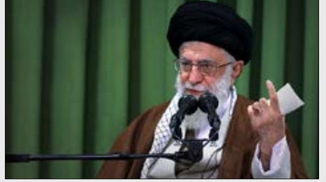
يجب ألا تلهينا حماقة ترامب عن خدام أميركا