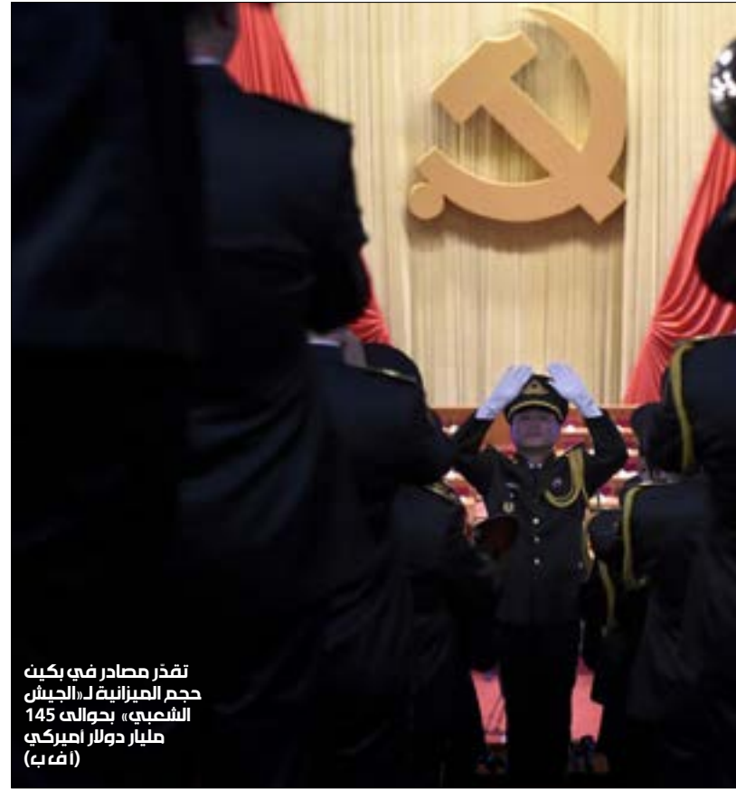
تفخر مصادر في بكين حجم الميزانية لـ«الجيش الشعبي» بحوالي 145 مليار دولار أميركي (اضرب)