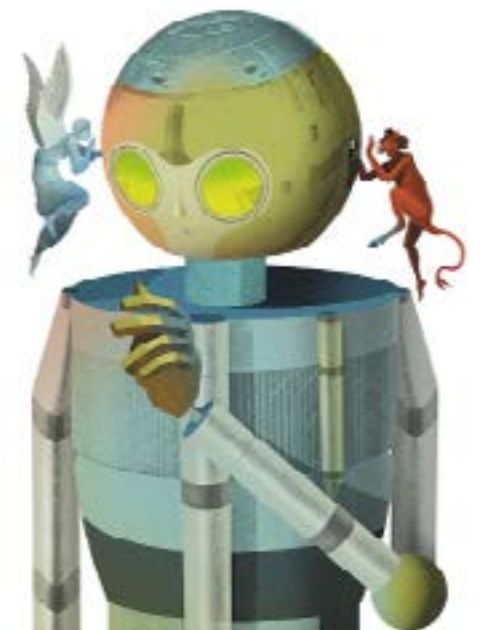
ما هي المخاطر الرئيسية التي يتعرض لها المجتمع جراء فشل أنظمة الذكاء الاصطناعي؟

في ظل التطورات التكنولوجية السريعة التي تحصل في العالم، وخاصة المتعلقة بالذكاء الاصطناعي، بات من الضروري ضبط الأمور ووضع قواعد ومعايير أخلاقية لها. فالكثيرون يتخوفون من الذكاء الاصطناعي الذي قد يسيطر يوماً ما على البشر، وبالمقابل هناك كثيرون يرون في الذكاء الاصطناعي تطوراً رائعاً للبشرية قد يؤدي إلى تحقيق حلم خلود الإنسان. الفريق الأول لا يقف ضد التطور، بل يطالب بمعايير تنظم هذه العملية وتسمح بالاستفادة من الذكاء الاصطناعي من دون تدمير البشرية. أبسط الأمثلة على مخاطر هذا التطور تتعلق بتدمير الذكاء الاصطناعي للوظائف وتركيز الثروات في أيدي من يملكون الكمبيوترات الأقوى. فالثورة التكنولوجية حتى اليوم لم تخلق وظائف بقدر ما دمرت. مثال آخر يتعلق بتدمير