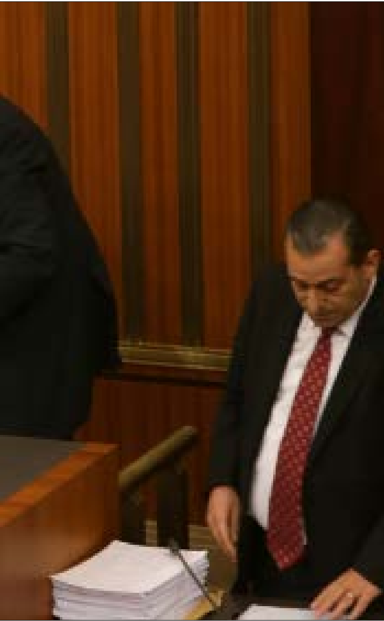
اعتبر كنعان أن اقتراح حرب والجميل لا يحد المعضلة الدستورية والقانونية (مروان طحطح)

في عام 2011، باشرت وزارة المالية بإعادة تكوين العناصر الأساسية في مديرية الخزينة ومديرية المحاسبة العامة، ومعالجة آثار ترتبت عن مخالفات في مسك القيود أدت إلى تداخل بعض الحسابات الرئيسية