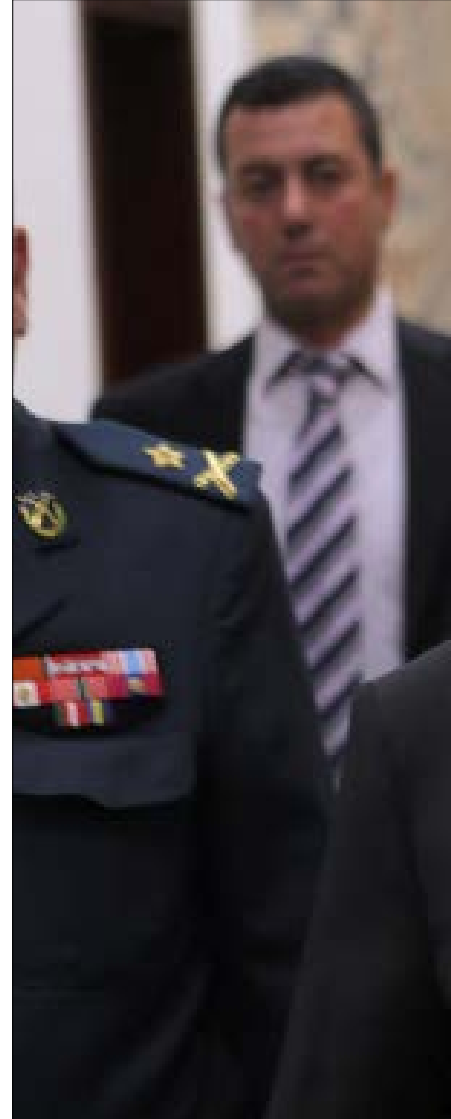
عون بعد بنلية الدعوة لزيارة طهران (هيلم الموسوي)

الروسي، إلى تحييد القوات العسكرية الروسية، وهو ما يسهم أيضاً في تعزيز الجدية حول خياراتها... هذا وأكدت التقارير الإعلامية أن نتنياهو وبوتين تابحا في البرنامج النووي الإيراني، والتهديدات في سوريا والاستفتاء الكردي في العراق. من جهته، قام ليبرمان بدور من يرد على الموقف الإيراني الداعم لسوريا، بإطلاق التهديدات. ورأى أن مواقف الجنرال الإيراني «دليل» على أن إيران «تحاول التمرّك في سوريا لتثبيت حقائق في الأراضي السورية وتهديد إسرائيل من هناك»، متجاوزاً حقيقة أن الموقف الإيراني أتى في سياق دعم الموقف السوري في مواجهة الاختراقات الإسرائيلية للأجواء السورية. في السياق نفسه، يبدو أن إسرائيل تحاول التعامل مع الموقف الإيرانية التي عبر عنها رئيس أركان الجيش، كفرصة لتعزيز حملتها على مخاطر تكريس الوجود الإيراني في سوريا، وتأكيد رفضها هذا الوجود، بالقول إن «الإيرانيين يحاولون السيطرة على سوريا، ويريدون التحول هناك إلى قوة مهيمنة، ويوجد لدينا كل الأدوات لمواجهة هذا التحدي».