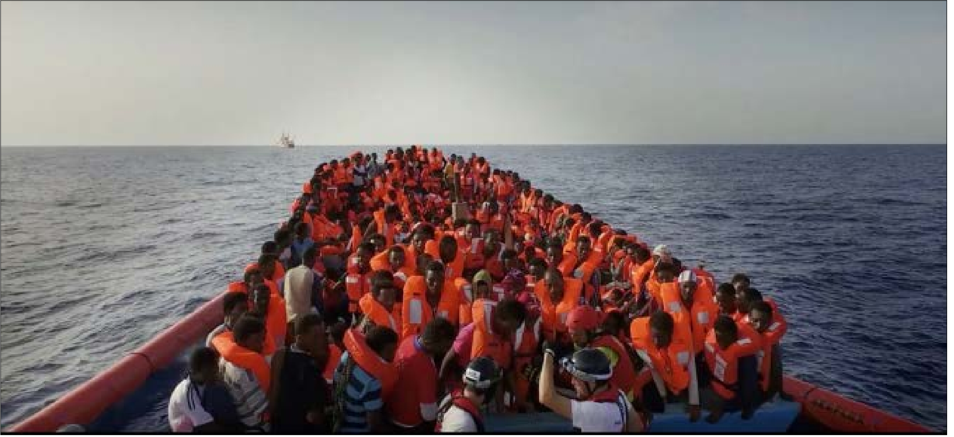
مشهد من Human Flow