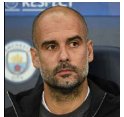
جبر غوارديولا لاعبه على تعلم اللغة الإنجليزية (أ ف ب)

أكد الأرجنتيني نيكولاس أوتاميندي، مدافع مانشيستر سيتي الإنجليزي، أن مدربه الإسباني جوسيب غوارديولا يجبره وزملاءه على الخضوع لدروس إلزامية في اللغة الإنجليزية، فضلاً عن تناول الطعام بعد المباريات في النادي. ونقلت صحيفة «ليكيب» الفرنسية عن أوتاميندي قوله: «بعد المباريات، يجبرنا على تناول الطعام في النادي. الطعام والراحة مهمان جداً لأننا نتعب في المباريات. إنه حريص جداً على نظامنا الغذائي وعلى تعلم اللغة الإنجليزية لأنها تستخدم في اجتماعاتنا. في كانون الأول لدي امتحان».