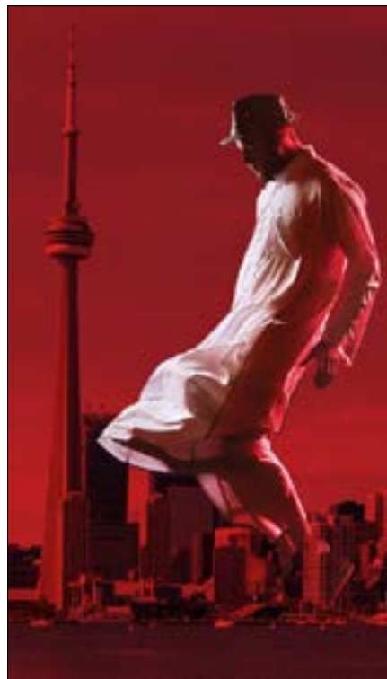
من «شيخ جاكسون» للمصري عمرو سلامة