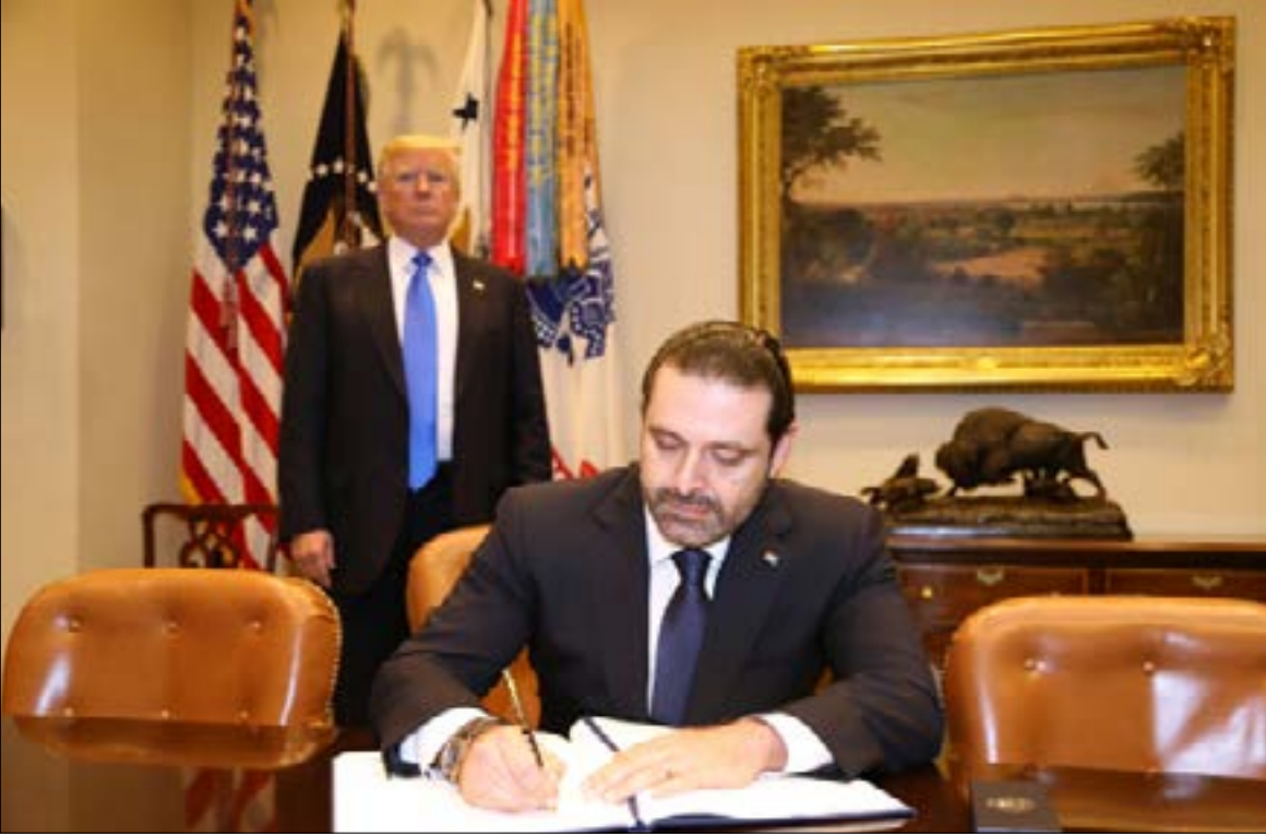
فهد الحريري (يساراً) في واشنطن مع ترتيبات لقاء ترامب (اليمين)

الحكوميين، ولا سيما حزب الله، على المقلب الآخر في الرياض، كان محمد بن سلمان يطبخ صفقة مع دونالد ترامب، الذي دخل البيت الأبيض بداية العام وفي جعبته مشروع مخالف لسياسة أوباما التفاوضية مع إيران. السعودية كما كيان العدو الإسرائيلي، في صلب مشروع ترامب الذي تحركه أيادي المحافظين الجدد في أروقة البيت الأبيض.