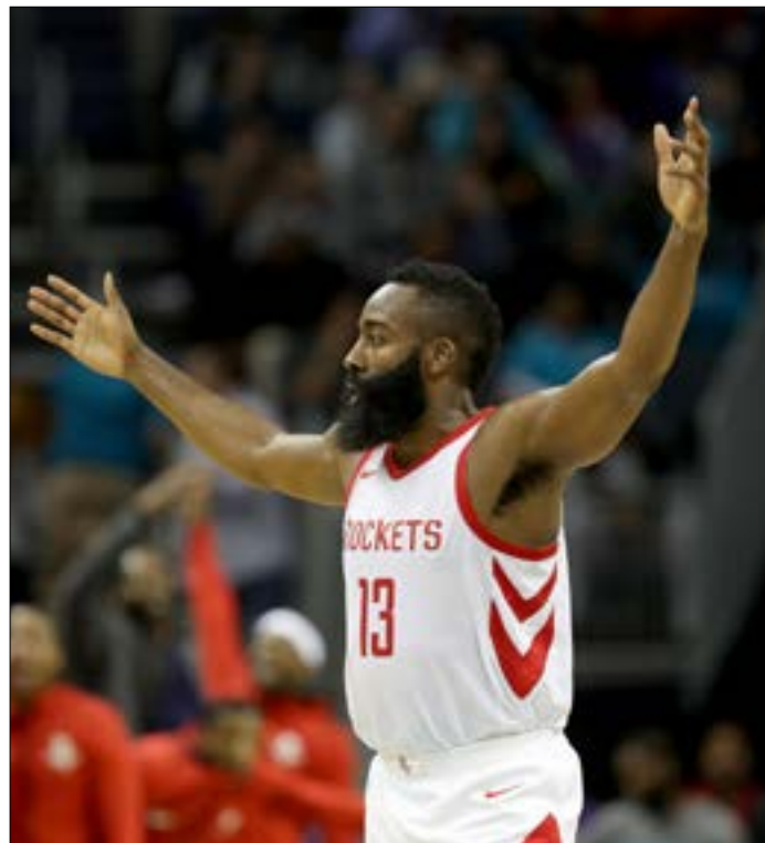
تألق هاردن بتسجيله 56 نقطة في سلة يوتا جاز

نقطة والبرازيلي هيلاريو نيني 13 نقطة. وتنافس هوكس عند 8 مباريات متتالية، وذلك من خلال الفوز على