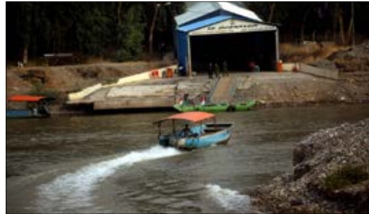
قارب في نهر دجلة عند مصر - سيمالكا، قرب مثلث الحدود السورية - العراقية - التركية

الإدارية نحو النواحي (كما معدان) في ريف الرقة الجنوبي، عوضاً عن مركز المحافظة الذي يسيطر عليه «قسد». وفي سياق متصل، أعلنت الأخيرة أنها سمحت لعدد من سكان حي المشلب في الرقة، بدخول حيزهم بموجب تصاريح دخول، وبعد موافقتهم على تعهد بمسؤوليتهم الشخصية عن أمنهم وعن التعاون مع السلطات الأمنية في المدينة. وفي موازاة التحضير لخوض «معارك الحدود» الأخيرة، يتابع الجيش عملياته في ريف حماة الشمالي، شمال منطقة السعن. وتمكن أمس، من