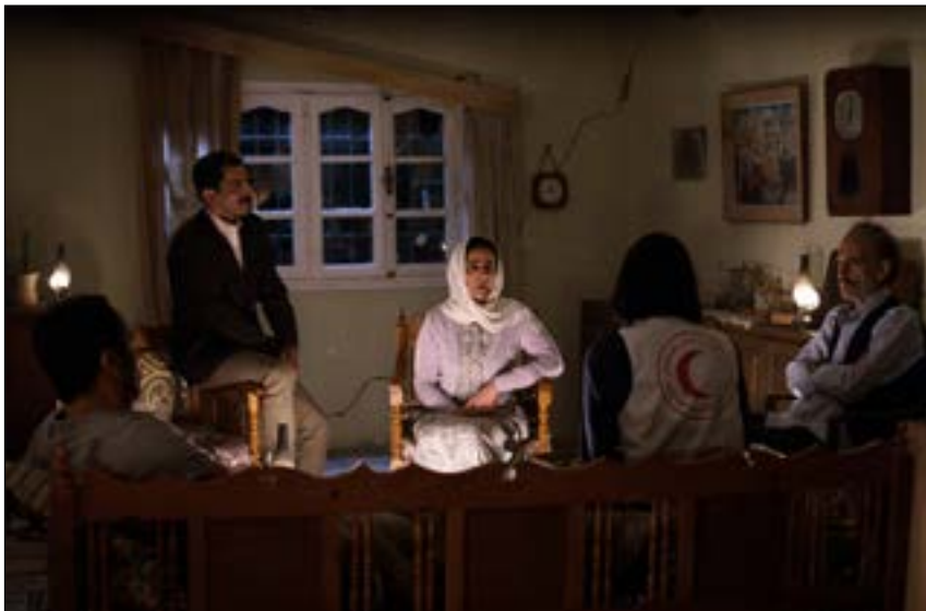
مشهد من شريط الافتتاح «كتابة على الثلج» للفلسطيني رشيد مشهراوي

جوائز وتجوال دولي، كما أعمال أولى لصناعها، وأخرى متفاوتة المستوى. أمر طبيعي بحضور 180 فيلماً موزعاً على عدّة فئات. «المسابقة الرسمية للأفلام الروائية الطويلة» (14 فيلماً، من بينها 3 تونسية)، «المسابقة الرسمية للأفلام الروائية القصيرة» (15 فيلماً)، إذ يتولى ميشال خليفي رئاسة لجنة تحكيم المسابقتين. للوثائقي مسابقتان كذلك: طويلة (14 فيلماً)، وقصيرة (8 أفلام)، يترأس لجنة تحكيمهما تيري ميشال. أيضاً، يضطلع حكيم بن حمودة برئاسة لجنة تحكيم «مسابقة العمل الأول جائزة الطاهر شريعة». كذلك، لدينا 8 أفلام خارج المسابقة، تنقسم بالتساوي بين الطويل والقصير. في التظاهرات، لا بدّ من «نظرة على السينما التونسية» التي تشهد موجة لافتة بعد الثورة، مع إنجازات كبيرة في أبرز المهرجانات. هذا العام، ثمة فورة إنتاجية، بإنجاز 78 شريطاً (37 روائي، 41 وثائقي). القسم يعرض 5 عناوين روائية طويلة، و7 وثائقية طويلة، و10 قصيرة تتوزع على النوعين، إضافة إلى عروض خاصة لـ «الجديدة» لسلمى بكار، و«همس الماء» للطيب الوحيشي، و7 أعمال طلابية ضمن «قرطاج السينما الواعدة»، واستعدادات من السينماتيك التونسي. المجهز بجول سينمات الجزائر (12 فيلماً) التي يعمل فيها اليوم عدد كبير من الفئتين التونسيين، وجنوب أفريقيا (10 أفلام) والأرجنتين (10 أفلام)