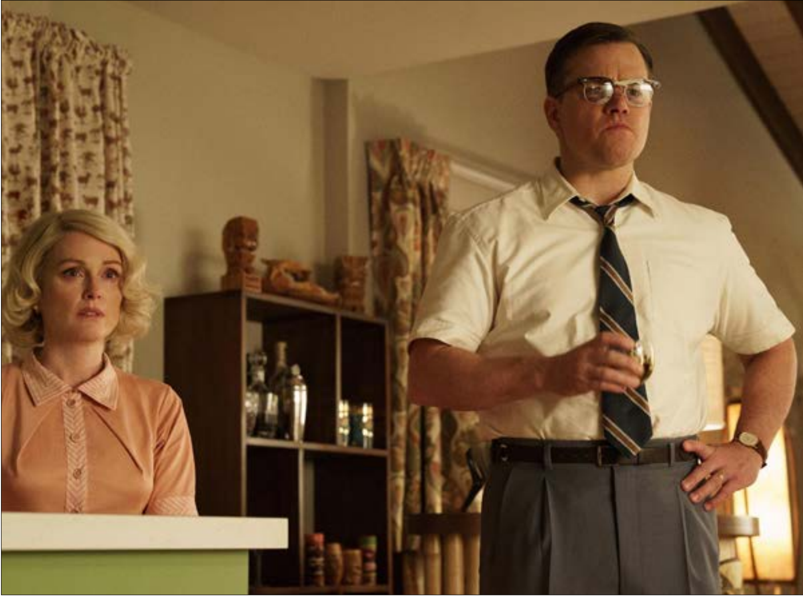
مات ديمون وجوليان مور في مشهد من الفيلم

يبدو أن الجمهور لم يعد مقتنعاً بالنجم الأميركي كمخرج. فيلمه الخامس Suburbicon تعرض لافتر استقبال حظي به عمله سينمائي أميركي خلال السنوات الثلاث الأخيرة، إذ ولد كمحاولة من قبله للعب دور المعلق السياسي على مرحلة تراب و سياساته الانعزالية في بناء الأسوار وتقيد الهجرة واضطهاد الأقليات