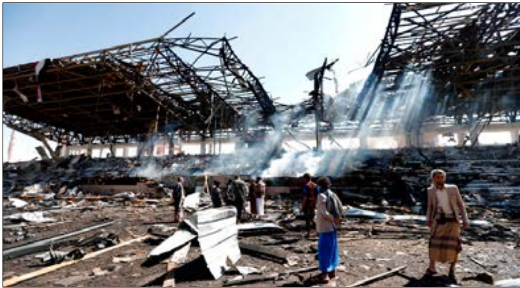
بعد غارة سعودية في العاصمة اليمنية صنعاء قبل يومين

أثار قرار السعودية إغلاق ما تبقى من المنافذ اليمنية مفتوحاً رجود فعل ساخطة، بلغت حد تلويح «أنصار الله» باستهداف البوارج التابعة لـ«التحالف». جاء ذلك في وقت واصلت الرياض هجومها التصديدي على طهران على خلفية الصاروخ الباليستي الذي استهدف مطار الملك خالد، والذي أكلت «أنصار الله» مشهديته، أمس، بالكشف عن منظومة صواريخ بحرية محلية الصنع