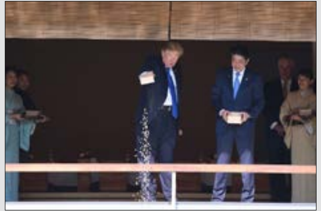
حافظ الرئيس الأميركي على أداء بروكولي جيد، لكنه أخطأ في طريقة إطعام أسماك الإمبراطور