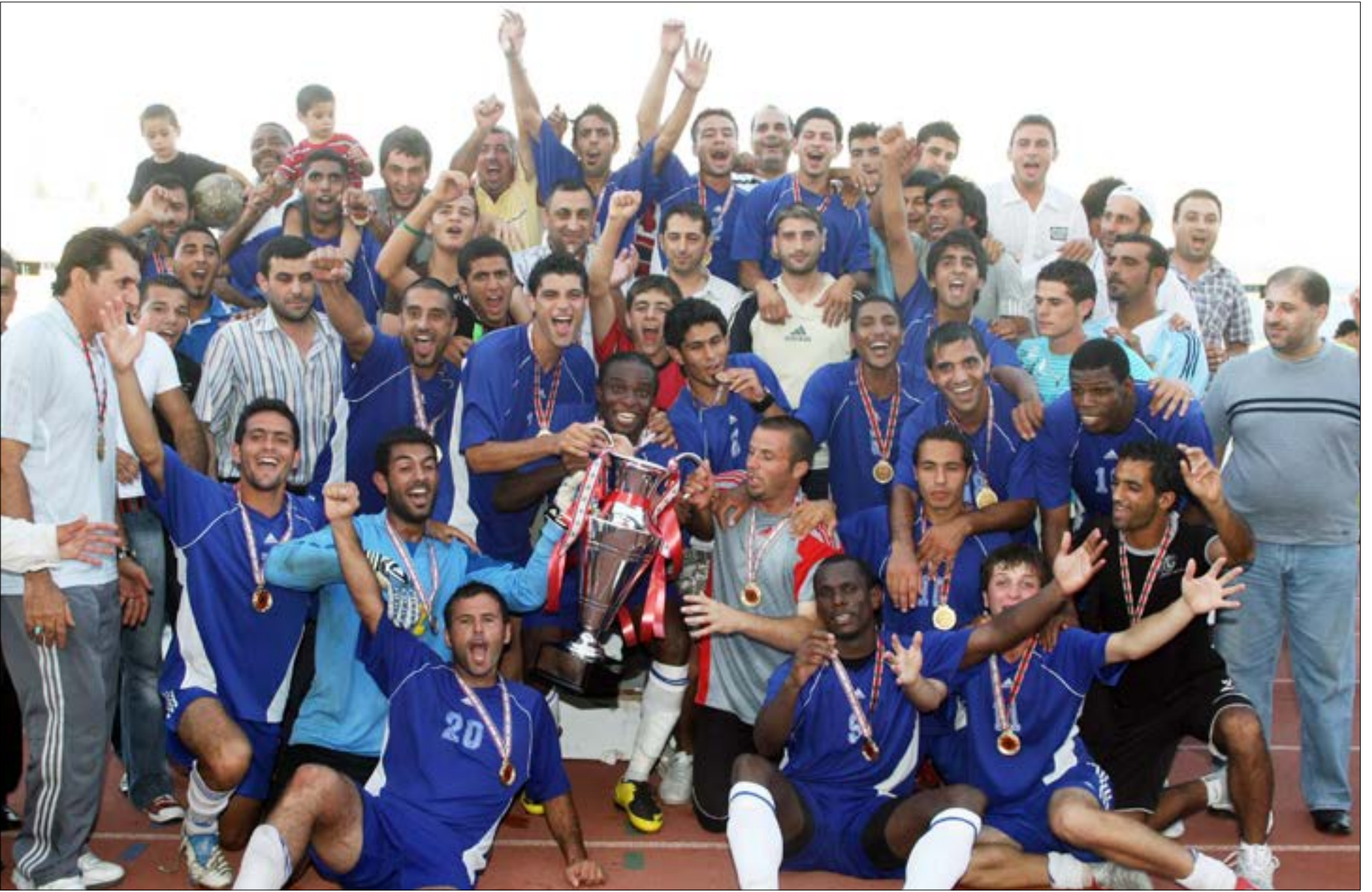
يسمى المبرة الى المودة الى الدرجة الاولى (ارشيف)