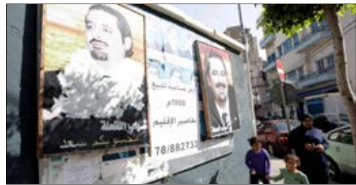
ما زال سكان المنطقة تجاه موقفهم تجاه الرئيس، لا يك ينظرونه (أضرب)