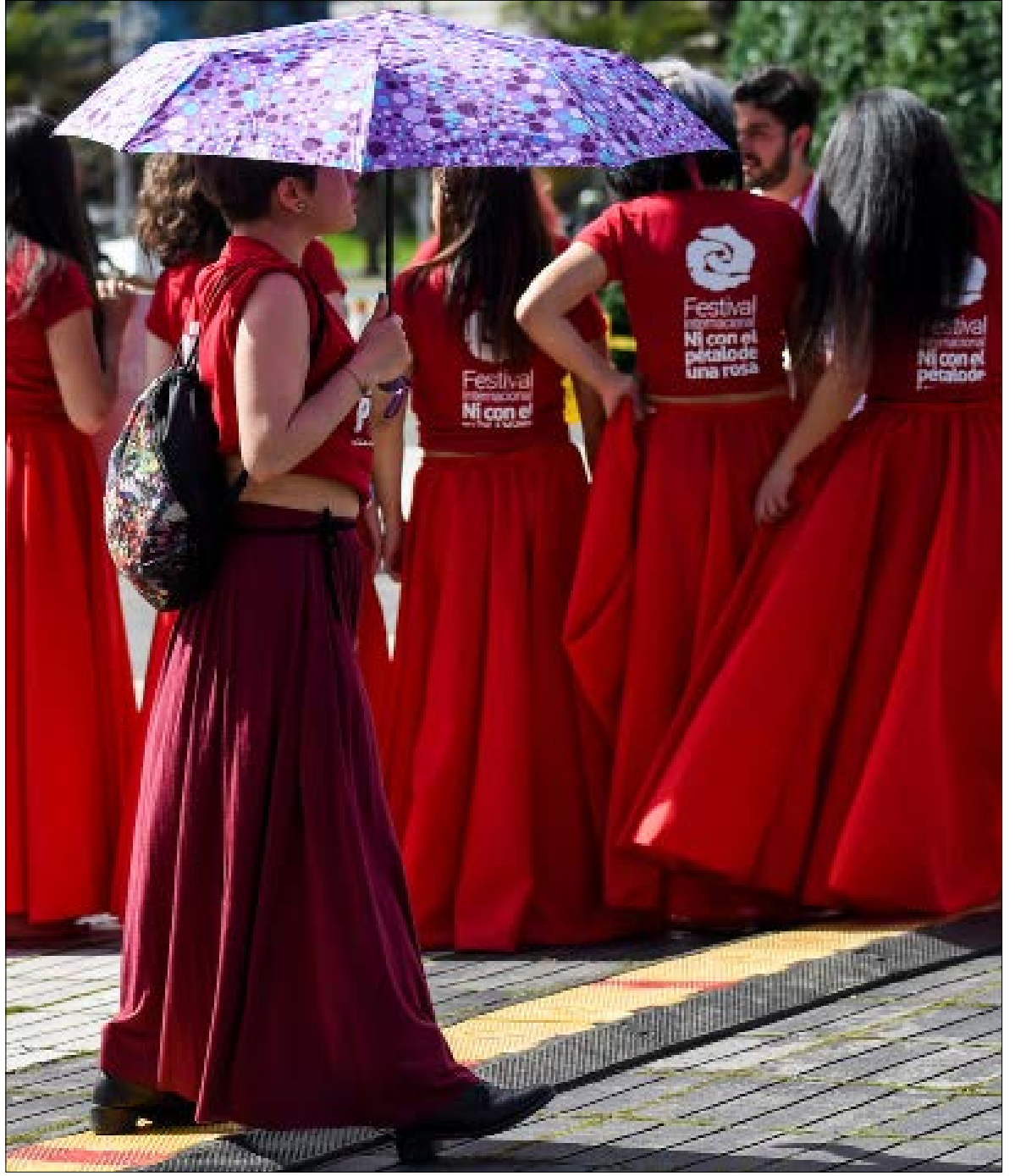
في مناسبة اليوم العالمي للقضاء على العنف ضد المرأة، تجمعت مئات النساء في بوغوتا ضمن الدورة الرابعة من مهرجات «لا ترهما حتى بوردة»، في تظاهرة تذكّر بالمعاملة اليومية والصامتة التي تعيشها نساء كثيرات في العالم