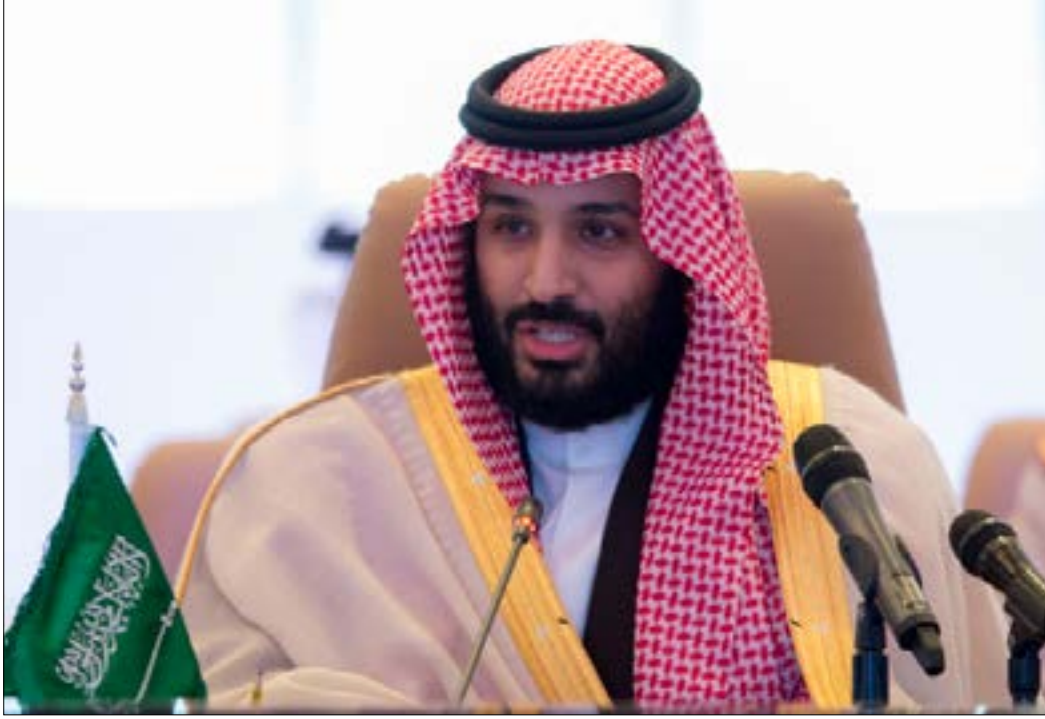
ابن سلمان: الخطة ستتركز على التنسيق المالي والعسكري والسياسي المميز بين الدول الإسلامية (الناضول)

بين الدول»، مشيراً إلى «تشكيل رد فعل جماعي ضد الإرهاب». ويضمّ «التحالف الإسلامي» 41 دولة عربية وغير عربية، مثل مصر والإمارات والبحرين وأفغانستان وباكستان وتركيا وماليزيا ونيجيريا، ولكنه لا يضم سوريا والعراق، الدول الأكثر تضرراً من هذه الجماعات، ولا إيران، الدولة التي تعتبرها الرياض «الراعي الأول للإرهاب في العالم». على الرغم من تأكيد المملكة «تدخل طهران» عسكرياً وسياسياً في المعارك ضد التنظيمات الإرهابية في الدول العربية.