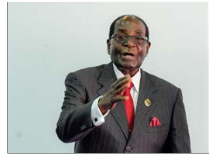
مند موغابي حسانة تمنع محاكمته

سيتمكن رئيس زيمبابوي السابق، روبرت موغابي (93 عاماً)، وزوجته غرايس، من أن يعيشا حياة مرضية، بفضل تسوية عقدت مع الرئيس المستقبلي قبل مغادرته السلطة، فيما تطرح جهات في المعارضة نقاط استفهام حول اعتبار القضاء، الانقلاب الذي حصل «قانونياً»