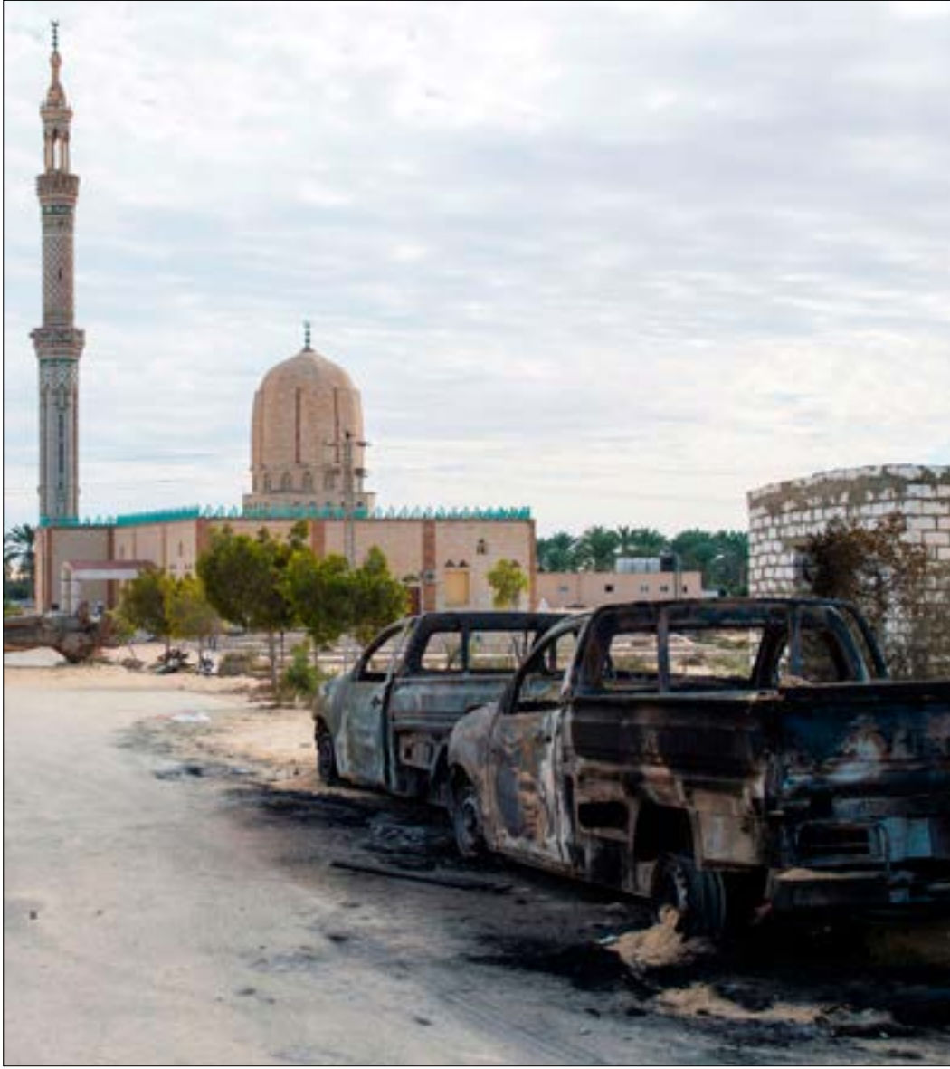
كان لافتاً مستوى التحفظ المصري في استحضار العامل الصوفي

محللون آخرون، داخل مصر وخارجها، يربطون المذبحة المرعبة بالتحركات الأخيرة للدبلوماسية المصرية في بعض الملفات الإقليمية