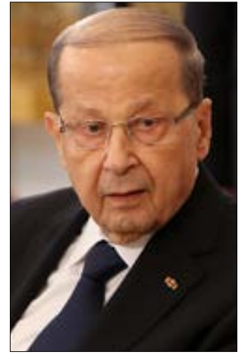
سيحصل عون على تعهد من السياسيين ليؤكد النأي بالنفس، اتفاق الطائف، العلاقات المبررة (هيلم الموسوي)

مع بدء المشاورات السياسية في قصر بعبدا، تنطلق اليوم مرحلة جديدة من تثبيت الاستقرار اللبناني. ودفعت «الانقلاب» على التسوية الرئاسية الذي حاولت السعودية تنفيذه. وتأتي هذه الخطوة بمباركة أميركية - فرنسية - مصرية، للجهود اللبنانية التي ستؤجج بعودة الحكومة إلى الحياة