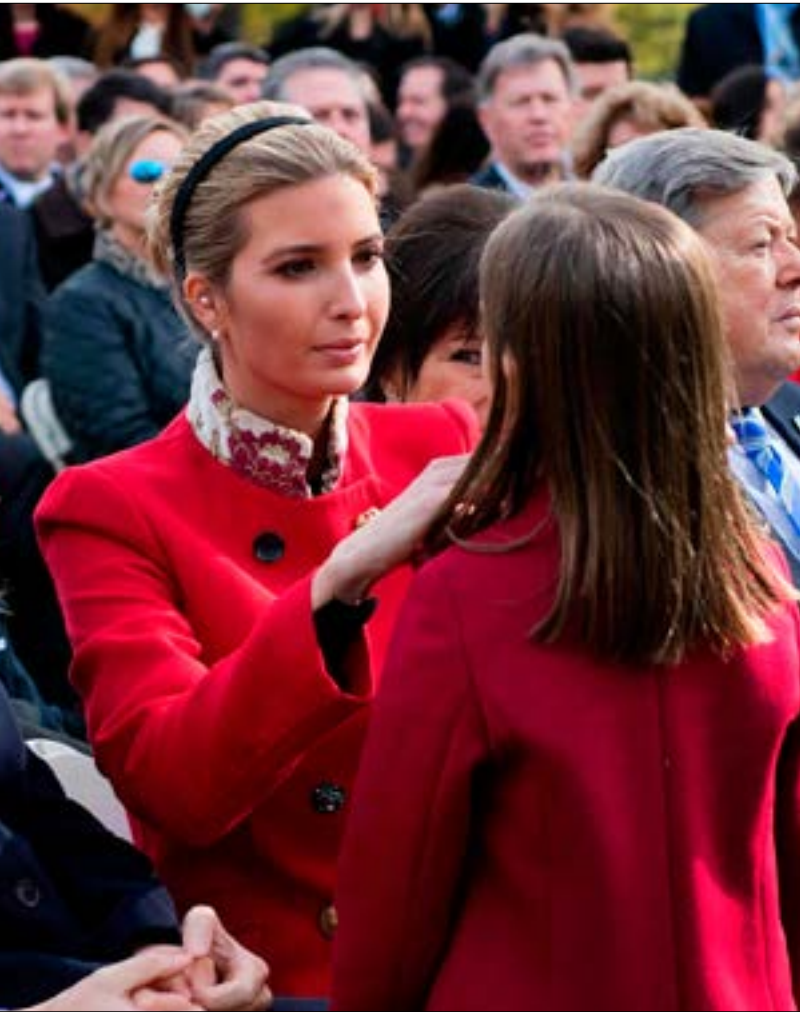
مرض تيلرسون إرسال كبار دبلوماسيينه إلى منتدى في الهند بسبب ترويس إيفانكا للوفد

جاردار كوشنر، صهر الرئيس الأميركي دونالد ترامب وكبير مستشاريه، الذي كان يظهر في كل اجتماع تقريباً وفي كل صورة، اختفى أخيراً من المشهد العام ووفق زملاء له، أعطي دوراً محدوداً خلف الكواليس. لكنه لا يزال يعمل على خطة من أجل إنهاء النزاع بين إسرائيل والفلسطينيين، فيما كان له الفضل في التركيز على الحاجات التقنية للحكومة الأميركية.