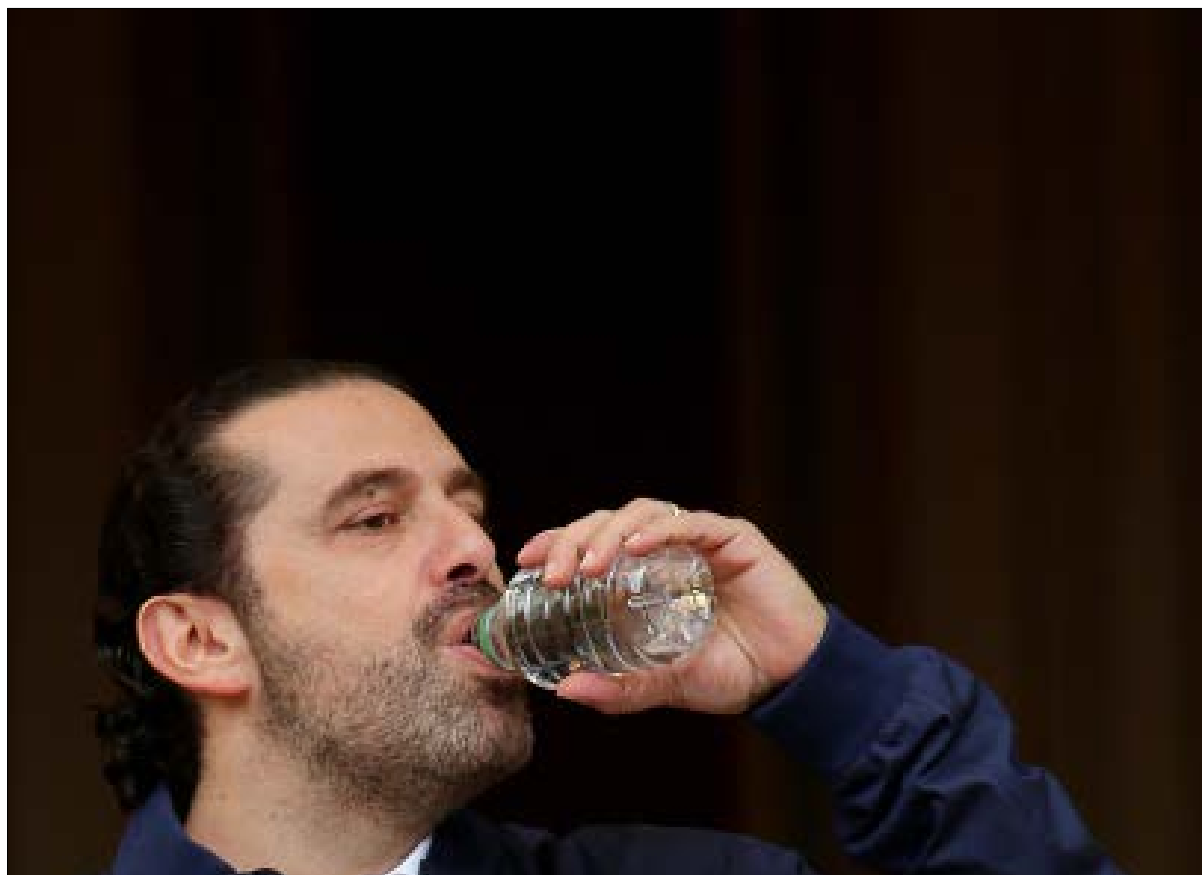
قد يكون من الصعب على الحريري وفريقه رفع الغطاء عن المتورطين إعلامياً دفعة واحدة

التي تنتظر إدارتها القرار النهائي لـ«شويري غروب» حيال الأمر نفسه. المشكلة مع الشويري لا تقتصر على ما يطاول العقد مع المؤسسات التلفزيونية السعودية، بل قد يصل إلى وقف عملها في السعودية، وسط تزايد «الضغوط» على الحكومة السعودية لإنشاء شركة سعودية تتولى إدارة الملف الاعلاني لجميع وسائل الإعلام في المملكة، على أن يجري تشكيلها من خلال دمج بعض الشركات المحلية، والاستعانة بفريق من المتخصصين، بينهم من عمل سابقاً لدى الشويري. وكان لافتاً في هذا السياق النشاط المتزايد لرجل الاعلانات اللبناني ج. ر.، الذي تولت شركته إدارة مراسم الاحتفالية بإعلان مشروع «نيوم» الذي أعلن محمد بن سلمان نيته إنجازه قبل عام 2030.