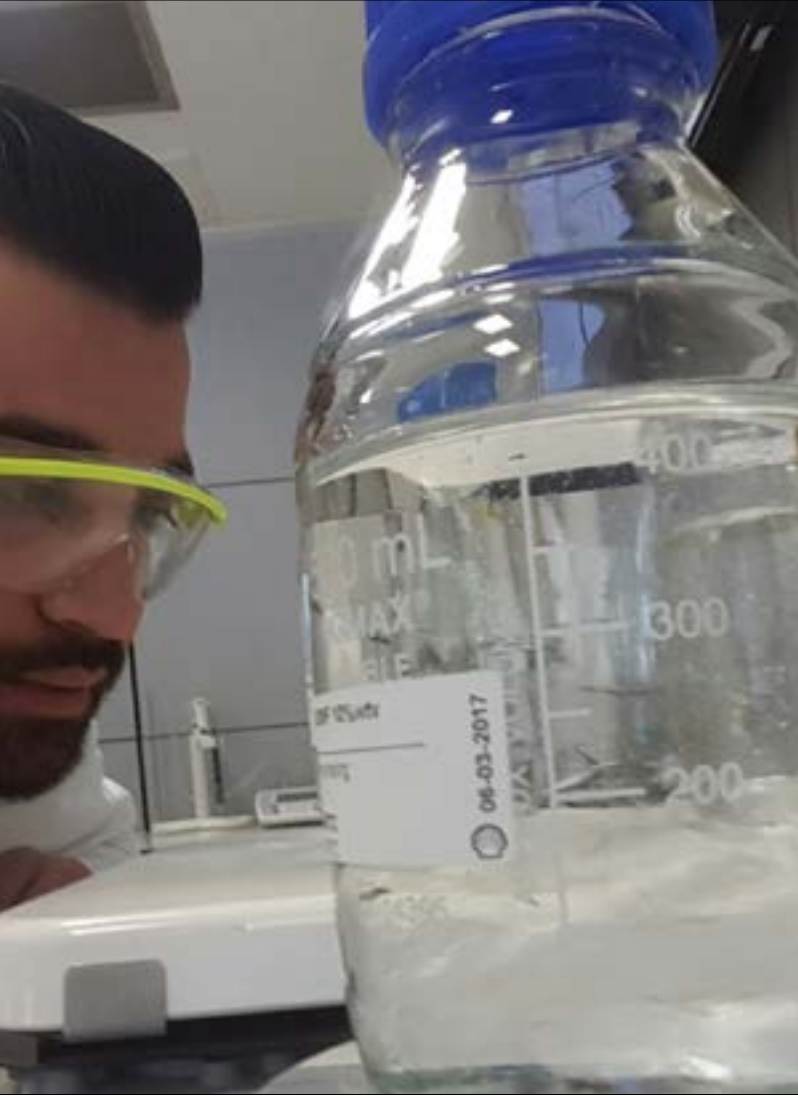
مقصود: الشهرة ليست هدفاً للعالم ولا تدخل ضمن أولوياته