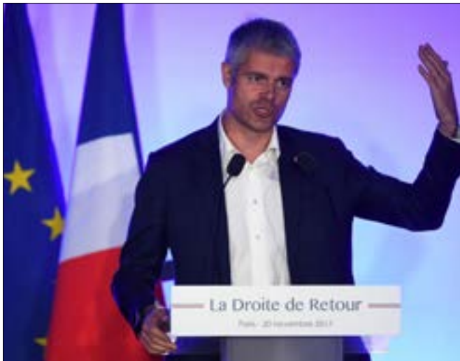
بعد لوران ووكيز، الرجل الأبرز في الحزب الجديد

يأتي إطلاق الحزب الجديد فيما اختار عدد من السياسيين، من بينهم وزير البيئة سيباستيان لوكورنو والنائب المحافظ البارو تييرى سولار، الانضمام إلى حزب ماكرون، بعد إبعادهم عن «الجمهوريين» وفق صحيفة «لو جورنال دو ديمانش».