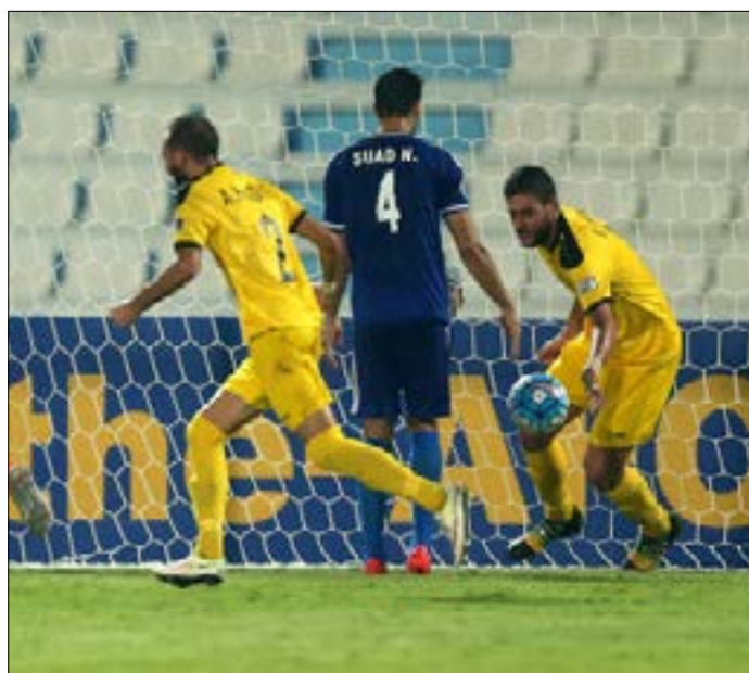
وصل العهد إلى نصف نهائي المسابقة قبل موسمين