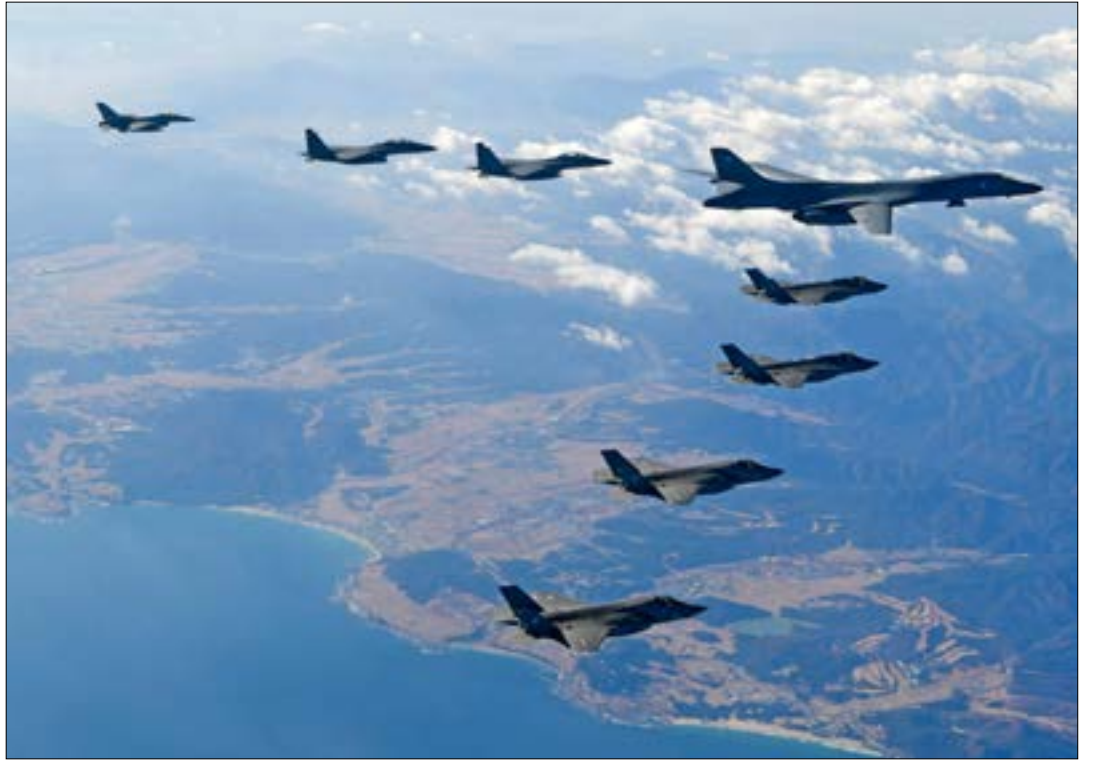
تنتهي غدا المناورات المشتركة بين سيول وواشنطن