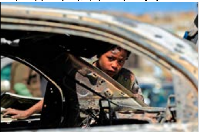
استشهاد 14 مدنياً في صعدة وطفلة في حجة جراء الغارات السعودية

الأمينة، ونفت المصادر أن يكون العواضي قد تعرض لأي إصابات، لأنه لم يشارك في المواجهات العسكرية التي شهدتها العاصمة مطلع الأسبوع الجاري، ولم يكن طرفاً فيها. وفي مشهد يعكس حجم الانقسام في «المؤتمر»، المنقسم أصلاً، قدم ولي عهد أبو ظبي محمد بن زايد آل نهيان، التعازي لنجل الرئيس السابق، أحمد علي عبد الله صالح، في مقر إقامته الجبرية في الإمارات، التي منذ عام 2014 فرضت، بطلب من الرياض، قيوداً على تحركاته ومنعته من مغادرة أراضيها. كذلك قدم «المجلس الانتقالي الجنوبي» العزاء بمقتل الرئيس السابق، وأضعا التعازي بسياق «الوفاء للحليف المشترك المتمثل بدولة الإمارات ودول التحالف العربي».