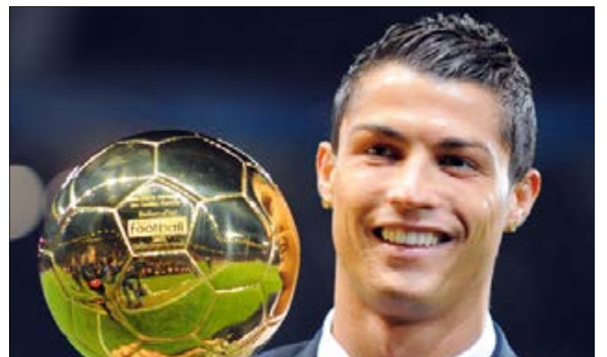
سعاد رونالدو رقم ميسي في حاك فوزه بالجائزة (أرشفيف)

وتوقفت مكاتب المراهنات البريطانية عن تسجيل المراهنات على رونالدو المرشح للفوز