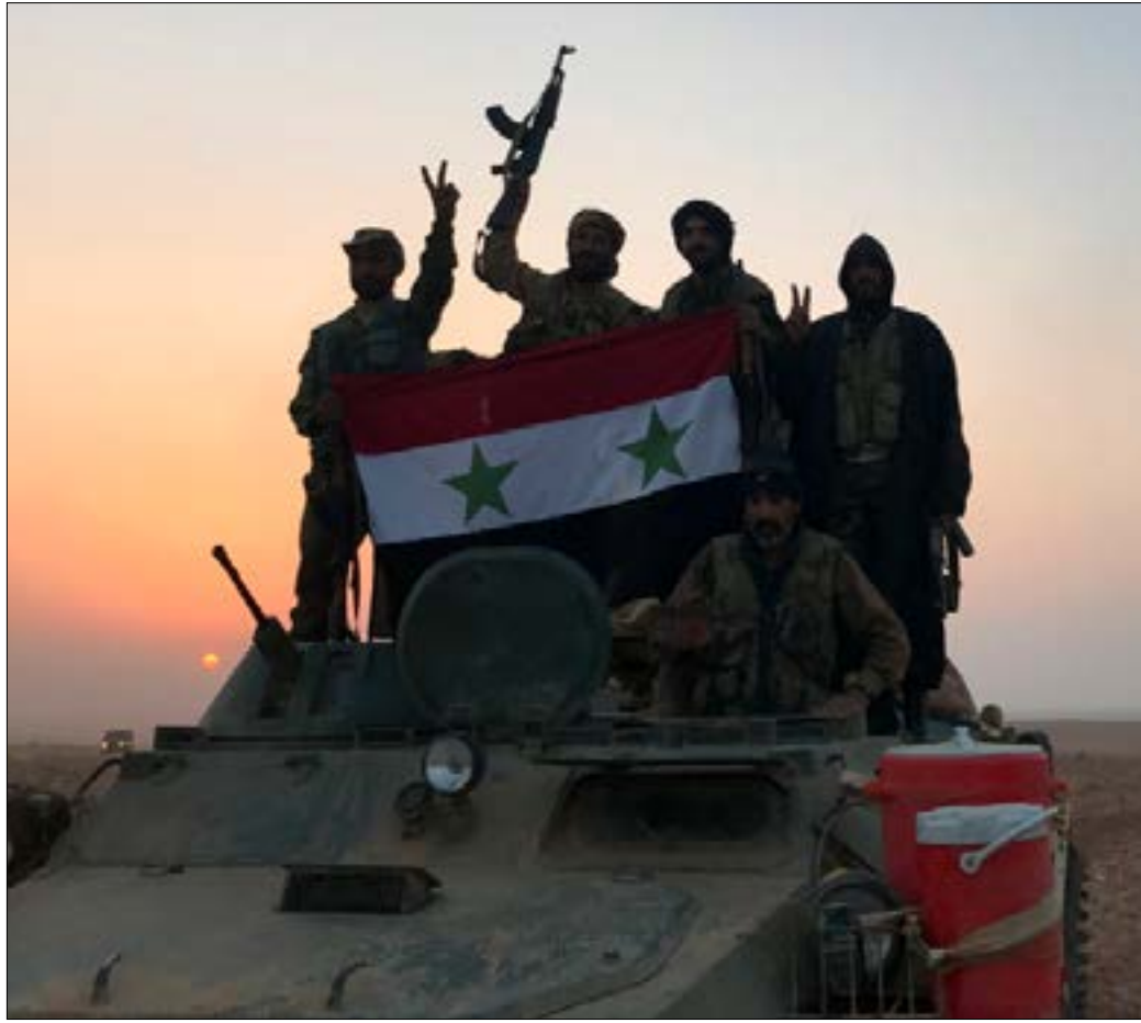
طرد التنظيم من آخر نقاط سيطرته التي تضم تجمعات سكنية

ثانية - انتهاء العمليات العسكرية على ضفتي الفرات بـ «هزيمة تامة للإرهابيين»، برغم «وجود بعض الجيوب المعزولة» للتنظيم. وبدأ لافتاً أن بوتين كرّر ما طرحه خلال استقباله نظيره السوري بشار الأسد، عن ضرورة «الانتقال إلى المرحلة التالية»، وهي العملية السياسية، منوهاً بالجهود المبذولة لعقد مؤتمر «الحوار الوطني» في سوتشي. وأشار إلى العمل الجاري على «دستور جديد» لسوريا، ليجري بعده «الانتقال إلى