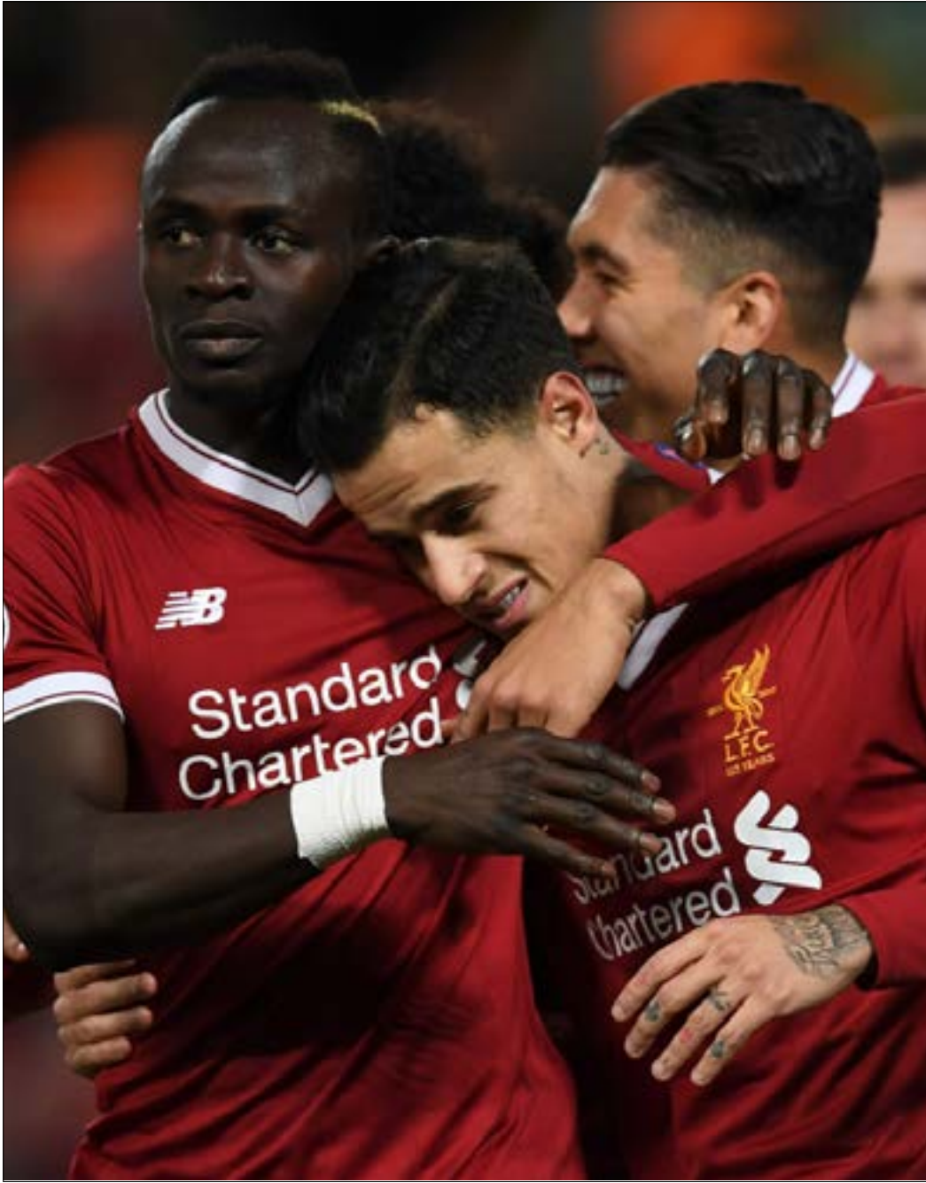
سجل كوتينيو «هاتريك» لليفربول

أوباميانغ بكرة رأسية (43) ثم سجل اللاعب نفسه هدف التعادل (49)، لكن لوكاس فاسكير منح الفوز للريال في الدقيقة 81.