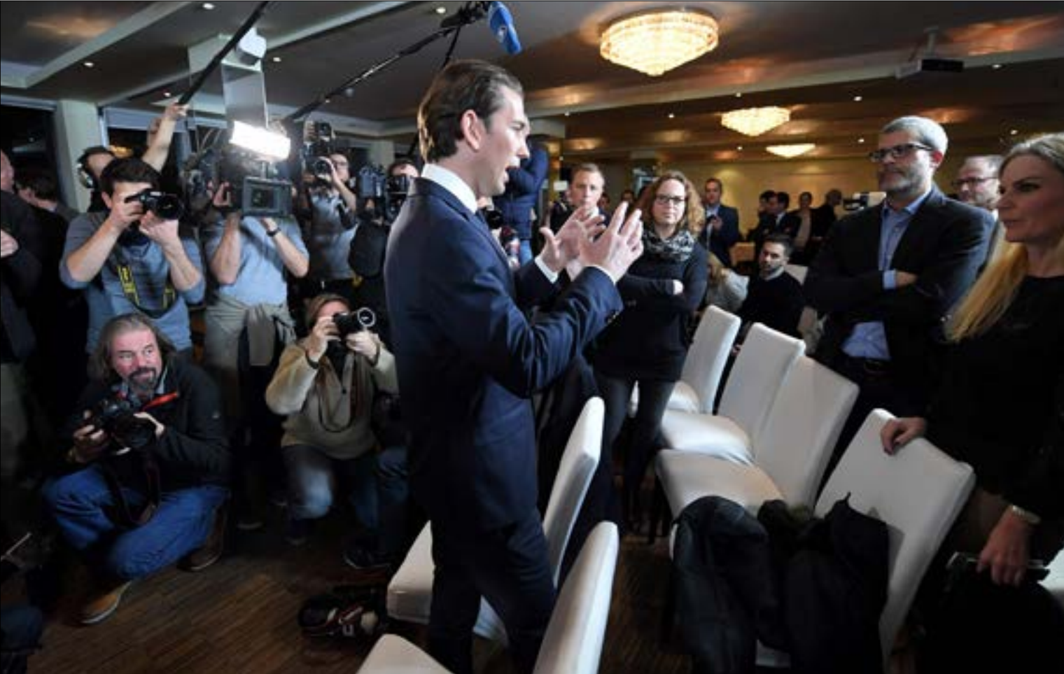
يعد كورتز أصغر قادة العالم سناً

اقتصادنا، ما من شأنه تحسين نظامنا الاجتماعي»، ولكن «في المقام الأول، نريد تحسين الأمن في بلادنا، على أن يشمل ذلك التصدي للهجرة غير الشرعية». وكانت قضية الهجرة والإسلام قد هيمنت على حملة كورتز البرلمانية في تشرين الأول الماضي، إذ تقاربت مواقف زعيم المحافظين الشباب الذي يتباهى بأنه أحد المهندسين الرئيسيين لإغلاق طريق البلقان بوجه المهاجرين عام 2016 عندما كان وزيراً للخارجية، بشكل وثيق من «حزب الحرية» في هذه المسألة. وعرضت الحكومة الجديدة