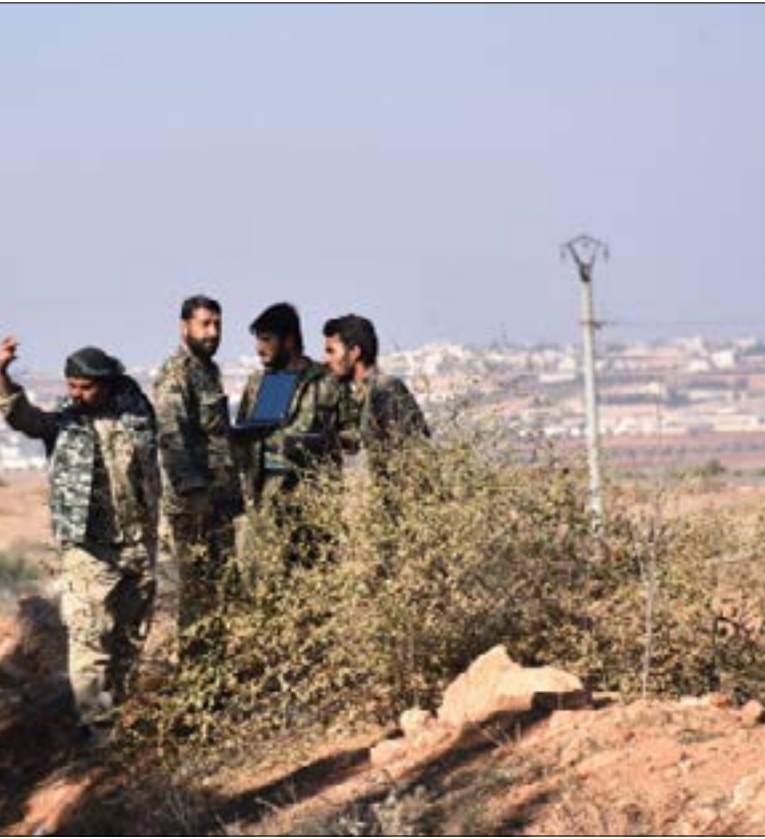
قتل الجيش القائد السابق لجيش المهاجرين والانتصار، صلاح الدين الشيشاني

مصادر مصرية تتحدث عن ربط موسكو عودة السياحة بكامل قوتها إلى القاهرة لاستقبال الشريحة الأولى من قرض المفاعل النووي في «الضبعة»، الذي يتوقع أن يفضي قبل نيسان المقبل وفق الاتفاق بين البلدين إلى بدء التنفيذ عبر