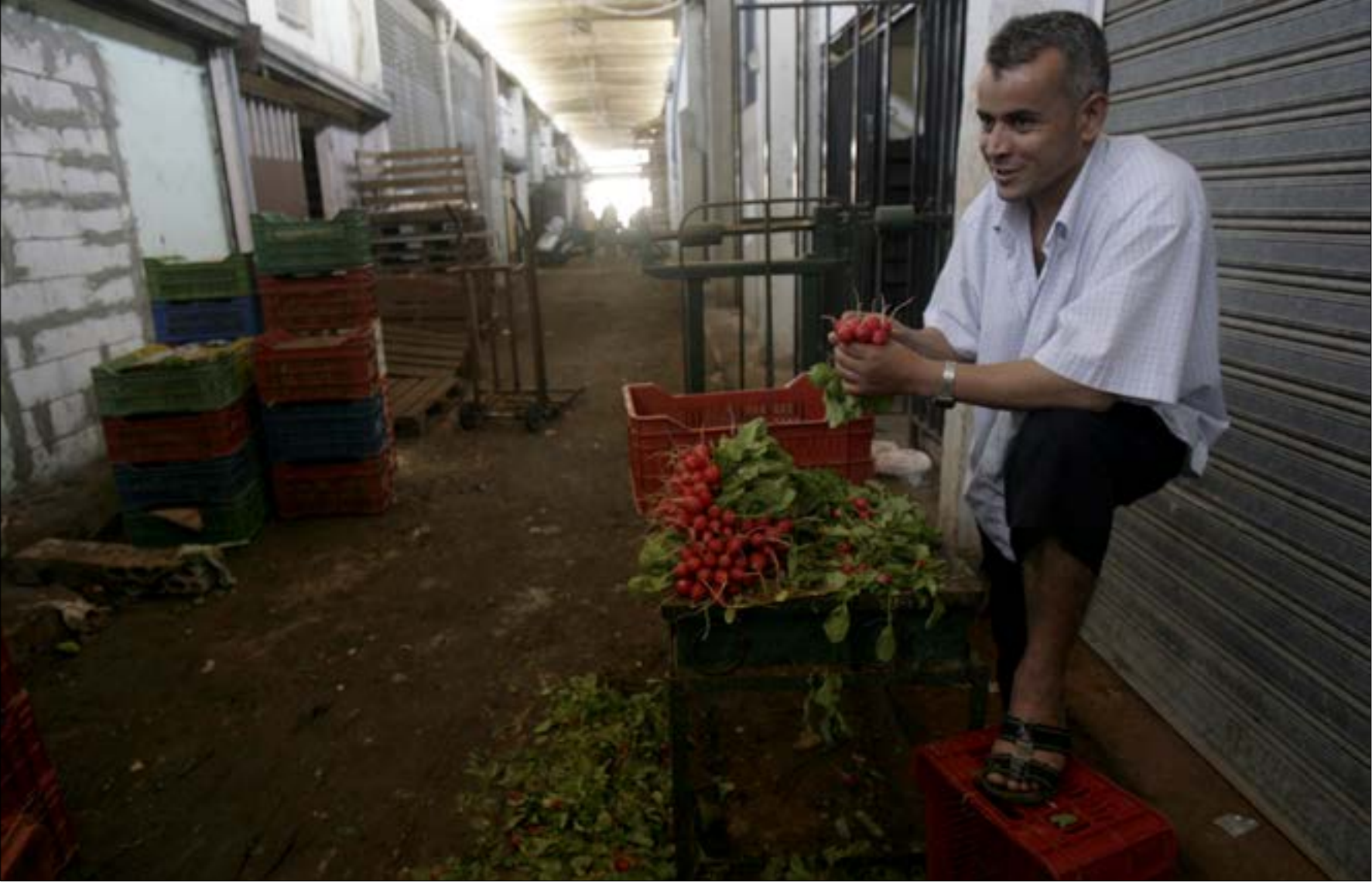
اعتراض اعضاء بلديون على «مبالغة» الاستشاري في تقدير كلفة المشروع بنحو 42,8 مليار ليرة

هذه تلاميذ الدراسات والاشراف على التنفيذ بالتراضي، بدأ المسار الملتوي لملف تلزيم مشروع إنشاء سوق الخضار والفاكهة بالمفرق في بيروت، لينتهي بمناقصة جوبهت باعترافات على دفتر شروطها «المفصل على القياس». أخيراً حظ المشروع في ديوان المحاسبة حيث يتردد أن الموافقة المسبقة جاهزة، ضمن المسار الملتوي نفسه!