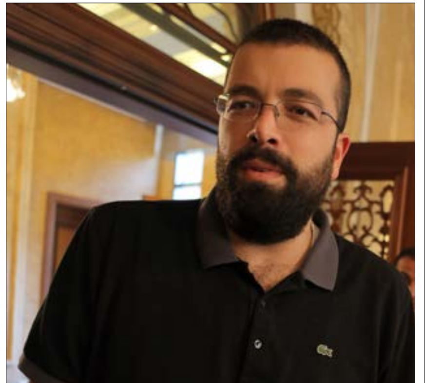
لمس الحريري وضع تياره الصعب من خلال ضعف الاستقبال (هيلم الموسوي)