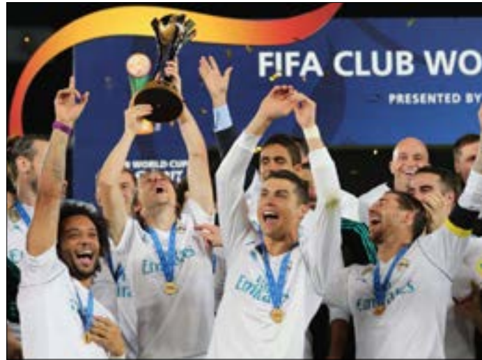
أول فريق يحتفظ بلقب مونديال الأندية محققاً خماسية غير مسبوقه

وأصبح باتشوكا الذي سبق أن نال المركز الرابع في نسخة 2008، ثالث فريق مكسيكي يحرز المركز الثالث بعد نيكاسا (2000) على حساب ريال مدريد بركلات الترجيح 3-4) ومونثيري (2012) على حساب الأهلي المصري (0-2).