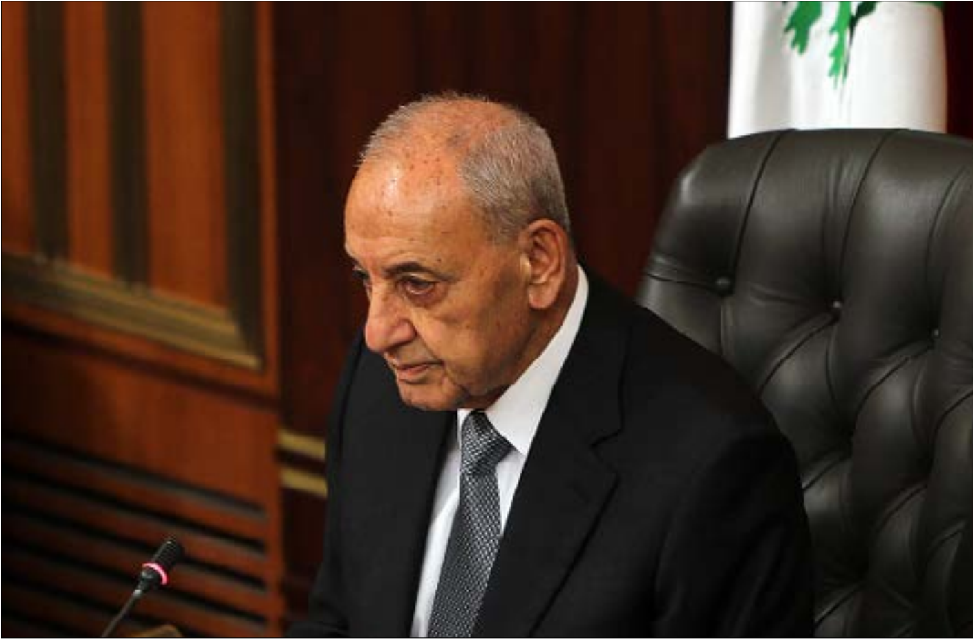
بري: تخطى توقيع وزير المال مخالفة دستورية صريحة

فتح توقيع الرئيسين ميشال عون وسعد الحريري مرسوم منح أقدمية سنة لضباط «دورة عون» خلافاً جديداً بين رئيس الجمهورية والرئيس نبيه بري، خصوصاً أن المرسوم تخطى توقيع وزير المال علي حسن خليل، ما ينذر بأزمة سياسية جديدة بعد أسابيع على طي أزمة استقالة الحريري