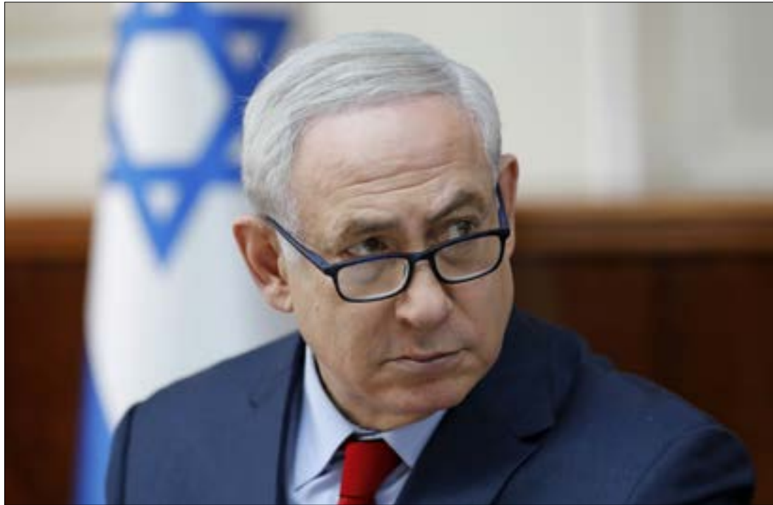
تجسد الزيارة طموحات نتانياهو الذي رحب بها خلال جلسة الحكومة أمس

في هذه الأجواء، لم تعد زيارة نائب الرئيس الأميركي محطة تقليدية في سياق العلاقات العامة بين الطرفين، بل محطة في سياق تصيدي أميركي، لا يقتصر فيها طابع التحدي على زيارة حائط البراق، بل إن الحديث المتواصل عن مساعي دفع التسوية انطلاقاً من الوقائع المفروضة في القدس، يشكل إصراراً على محاولة كسر الإرادة الفلسطينية والعربية، بمن فيها السلطة الفلسطينية، وزرع اليأس في نفوس الشعب الفلسطيني من إمكانية تحقيق أي نتائج مرجوة على هذا الصعيد.