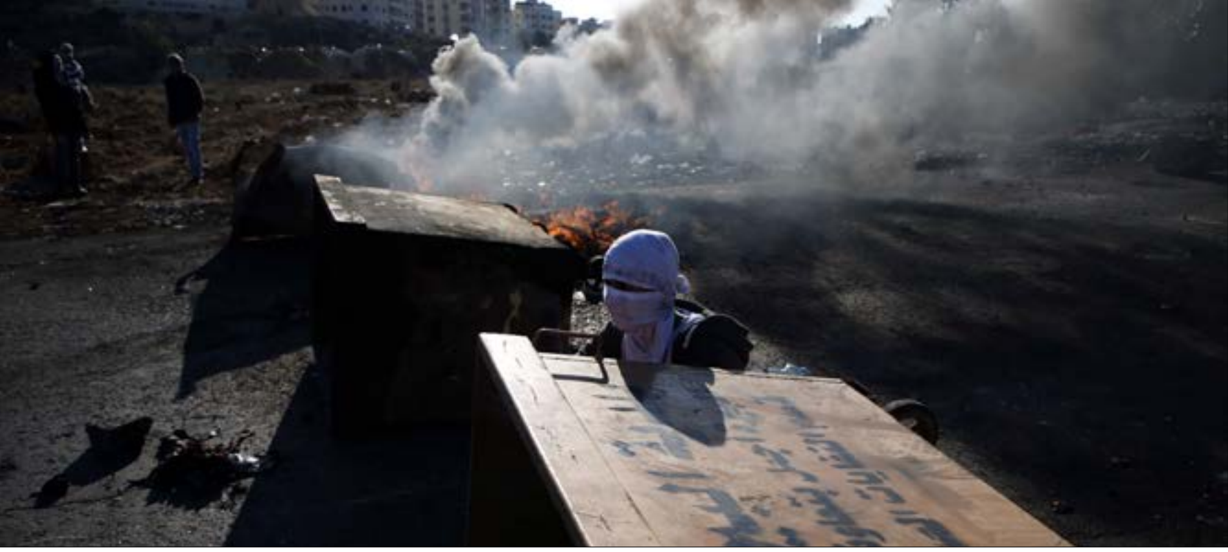
دعت فصائل السلطانية إلى تصعيد المواجهات خلال زيارة بنس