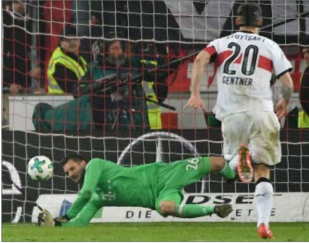
أولريتش خلال إبعاده ركلة الجزاء لشتوتغارت في الدقيقة 94

ولعل هذه الفرصة التي استغلها أولريتش أتت في التوقيت المناسب، إذ إن عقده ينتهي في ختام الموسم الحالي، وقد كان مدرب بايرن يوب هاينكس واضحاً بتقديمه نصيحة للبايرن بتمديد عقد هذا الحارس بقوله: «أتمنى استعادة مانويل نوير بعد العطلة الشتوية، ولكن هذا لا يمنع من أن زفين قام بعمل كبير، أنصح إدارة بايرن بتجديد عقده»، وهذا طبعاً ما يبدو متوقعاً ومنطقياً حصوله، خصوصاً أن بايرن كسب حارساً مميزاً يمكنه الاعتماد عليه في أي وقت يغيب فيه نوير.