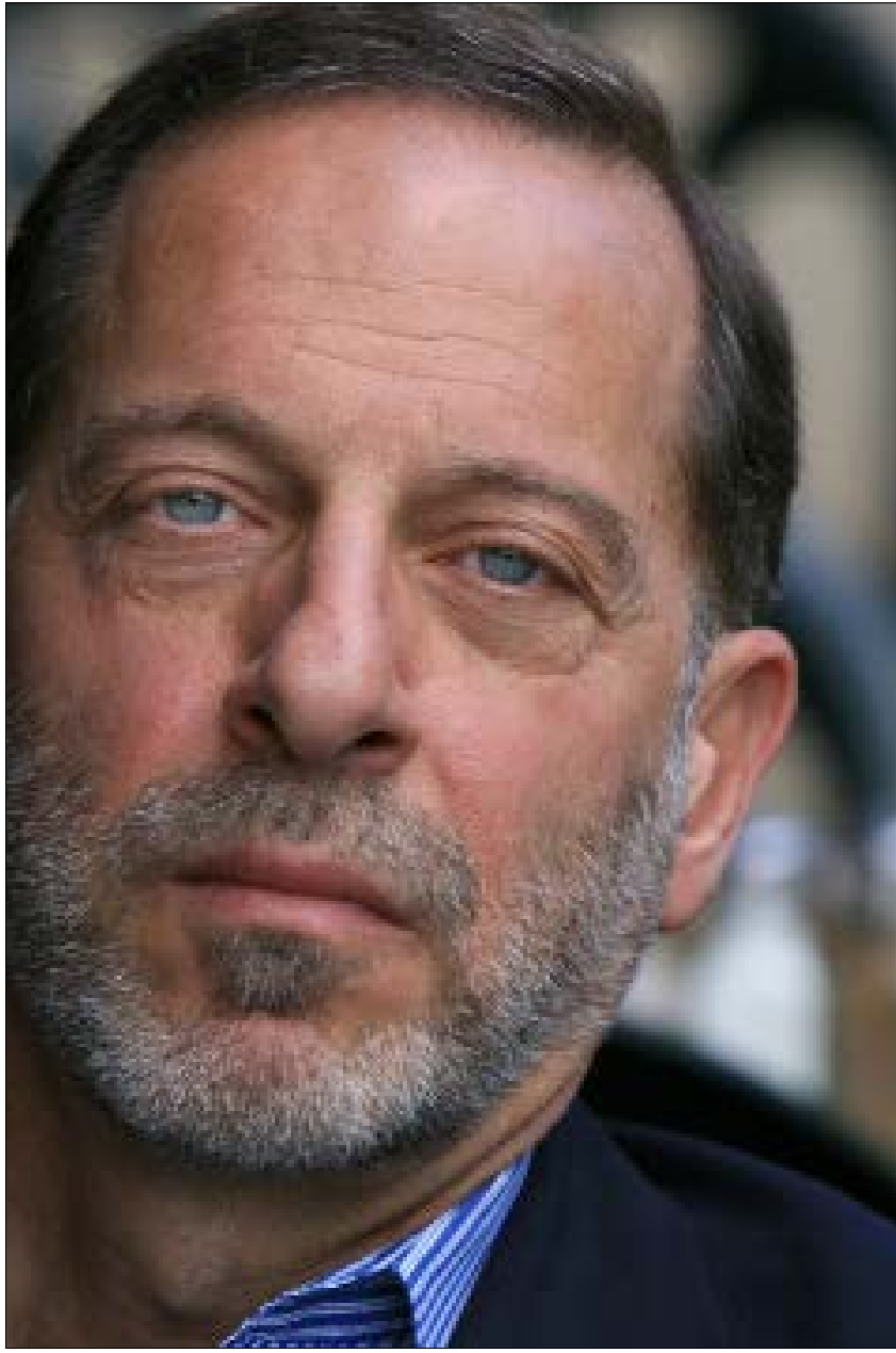
بشير المؤرخ الفلسطيني إلى أن القدس تنطق أيضاً في تصورات الإسرائيليين وخزانتهم (الأخبار)

«في المقابلة التي أجراها وزير الاستخبارات الإسرائيلية يسرائيل كاتس، مع موقع «إيلاف» السعودي، يتحدث فيها عن مشروع خط سكة الحديد بين حيفا والخليج، يقطع الطريق على إيران ومضيق هرمز لأنه ينقل البضائع بين الخليج والمحيط الهندي والبحر المتوسط.