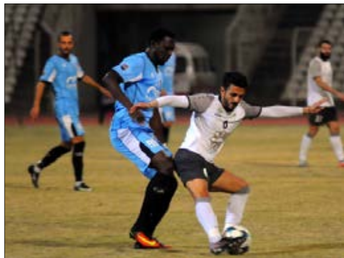
نجم النجمة في الفوز على الشباب العربي رغم لعبه ساعة وربع بعشرة لاعبين