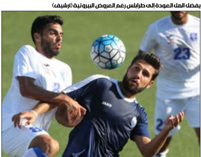
يفضل الملك العودة إلى طرابلس رغم العروض البيروتية

لبنان لاستكمال المفاوضات بعدما طلبه طرابلس لهذا الغرض. وسيشكل التعاقد مع الملك دفعة قوية لطرابلس في النصف الثاني من الموسم، وهو الذي يبحث أيضاً عن لاعب وسط أجنبي جديد بعد فسخ