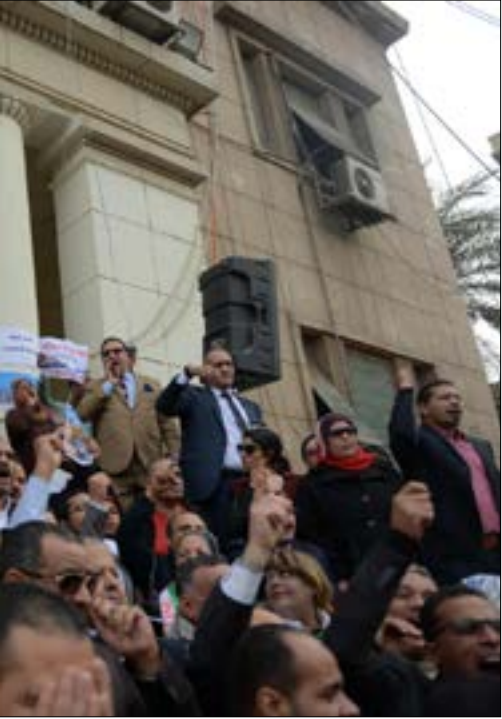
ليست الثورة جولة خاطفة، بل تنوير لنضال طبقي وحراك سياسي ونشاط نظري

ومع تراجع الهويات القومية، عالمياً، أصبح «الثائر الليبرالي» مغترباً عن تاريخه الوطني الذي اعتبر تدريجاً أنه مجرد «ماضي»، أو بمعنى آخر انفصمت عرى ارتباطه العضوي