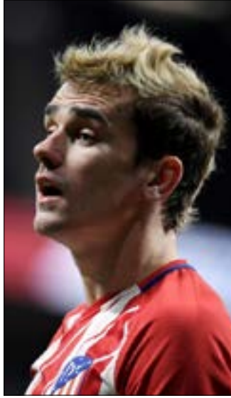
سيواجه برشلونة مشكلة في حال تفاوض مع غريزمان من دون علم ناديه (أ ف ب)

قرر أتليكو مدريد الإسباني عدم السكوت والتقدم بشكوى ضد برشلونة للاتحاد الدولي لكرة القدم «الفيفا» بسبب سعي الأخير وراء لاعبه الفرنسي أنطوان غريزمان «بطريقة غير شرعية»، وذلك بحسب صحيفة «ذا إندبندنت» البريطانية. وقال مدير أتليكو، غيرمو أمور، إن اعتراف رئيس النادي الكاتالوني، جوسيب ماريا بارتوميو «بالتواصل مع عائلة غريزمان» يرجح تواصل النادي الكاتالوني مع اللاعب من دون علم ناديه الحالي. وكانت قد انتشرت شائعات عديدة في الأونة الأخير حول انتقال غريزمان إلى «البرسا» في فترة الانتقالات الشتوية المقبلة أو خلال الصيف المقبل، في وقت أكد فيه أمور أن «علاقة النادي باللاعب الفرنسي جيدة»، مشيراً إلى أن انتشار الشائعات في عالم الكرة هو «أمر لا بد منه، لكن ذلك