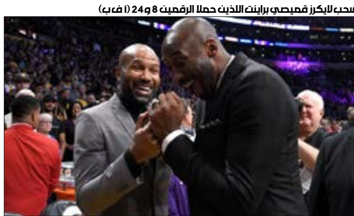
سحب لايكز قميصي براينت اللذين حملتا الرقمين 8 و24

9 و9 متابعات و10 تمريرات حاسمة. وفي باقي المباريات، فاز سان أنطونيو سبزن على لوس أنجلوس كليبرز 109-91، وأتلانتا هوكس على ميامي هيت 110-104، وشيكاغو بولز على فيلادلفيا سفنتي سيكسرز - ساكرامنتو كينغز، وأشنطن ويزاردز - نيو أورليانز بيليكانز، ميلووكي باكس - كليفلاند كافالييرز.