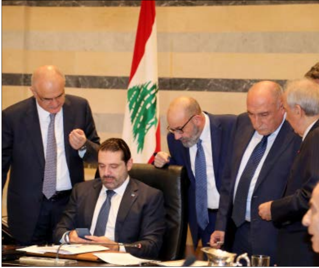
طرح وزير القوات اللبنانية مسألة عدم تحديد موعد لتسليم السفير السعودي الجديد أوراق اعتماده

هذا الشأن غير مشجعة لجهة العودة عن التزام قطعه لعون والوزير جبران باسيل». وأكدت أن «جنبلاط وبزي ينسقان مع حزب الله وينتظران منه التدخل لدى عون وباسيل للتراجع عن هذا الأمر»، فيما أكدت مصادر في قوى 8 آذار أن «حزب الله يرفض توقيع المرسوم، لكنه لا يريد أن يفتح معركة إعلامية وعسكرية مع