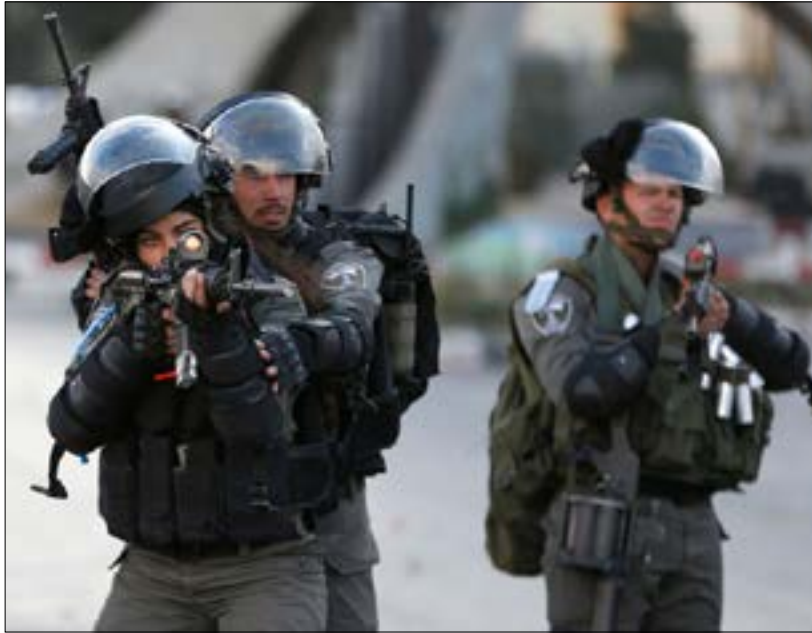
«المجتمع» الإسرائيلي وظيفي مبني على إيديولوجيا ذات مخزون فكري توسعي