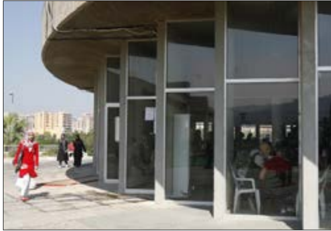
كافيتيريا الكلية مغلقة منذ ثلاث سنوات