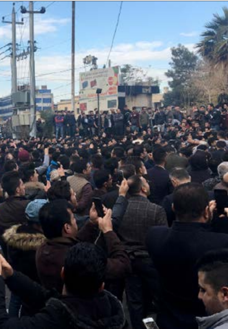
تجمع مئات المتظاهرين في مركز مدينة السليمانية لليوم الثاني على التوالي

حدة الصدام بين القوات الأمنية «الأسايش» والمواطنين، والحديث عن انضمام بعض مجموعات قوات «البيشمركة» إلى الحراك القائم. ولأن ما يجري «ثقل الوقع» على سلطات «الإقليم» كان لافتاً القرار الحكومي بإغلاق شبكة قنوات «NRT» (باللغتين العربية، والكردية)، بتهمة «التحريض على التظاهرات»، واعتقال مؤسسها، رئيس حركة «الجيل الجديد» شناسوار عبد الواحد، في خطوة وصفت بـ «التعدي على حرية التعبير، والتقييد للعمل الإعلامي في الإقليم»، لمصلحة الطبقة السياسية الفاسدة، بتعبير مصدر سياسي كردي.