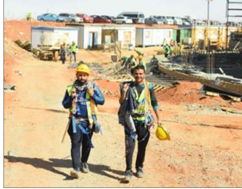
بعد «ثورة 25 يناير». اتسمت أنشطة صاحب مصانع «حديد المصريين»