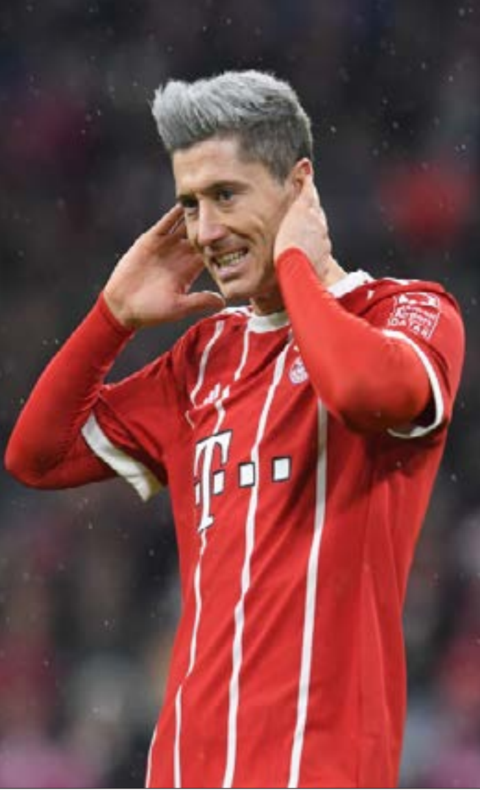
يتواصل الصراع بين ليفاندوفسكي وأوباميانغ على لقب هداف «البوندسليغا»

تبرز في «كلاسيكو ألمانيا» الليلة مواجهة دور الـ 16 لمسابقة الكأس لينتجدد النزاع بين الهادفين روبرت ليفاندوفسكي وبيار - إيميريك أوباميانغ. هي منافسة مستمرة للعام الثالث على التوالي بين هذين المهاجمين اللذين تجمعهما نقاط مشتركة رغم اختلاف أسلوبهما