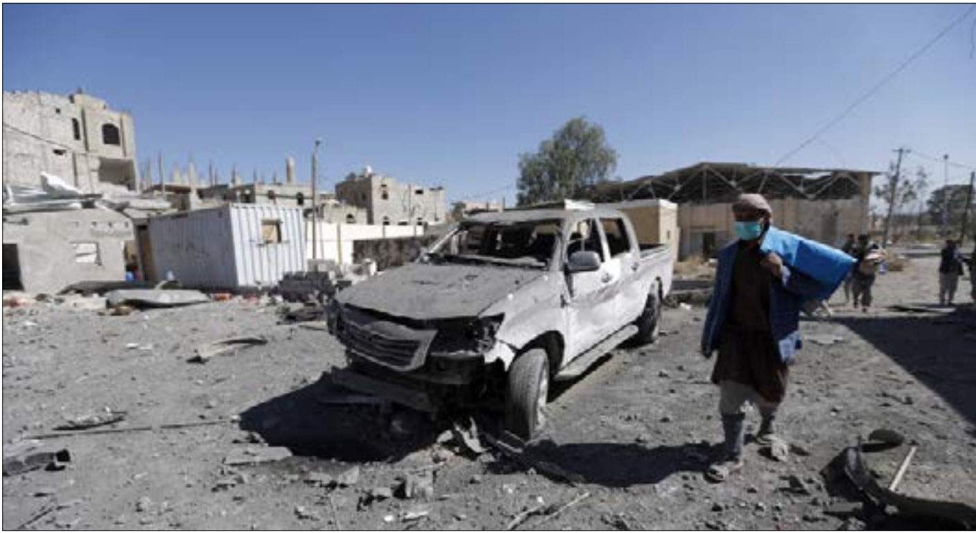
الحوثي: انتم تقصفون صنعاء، ونحن نقصف الرياض وابو ظبي

مع تسارع المؤثرات السياسية والميدانية إلى اعتزام تحالف العدوان على اليمن إطلاق حملة تصعيدية جديدة تستهدف الاستفراد بـ«أنصار الله» وإخضاعها، جاءت الرسالة الصاروخية اليمنية إلى الرياض، أمس، لتدشن مرحلة دفاعية أكثر تطوراً، وتثبت معادلة ردع إضافية في مسار التصدي للعدوان المندلع منذ آذار/ مارس 2015، وتنبه «التحالف» وحلفاءه الثابتين والمحتملين إلى أن أي مغامرة جديدة لن تكون بلا ثمن يتجاوز ما خبرته المملكة ومن معها خلال الأشهر الماضية. بدا المشهد، ظهر الثلاثاء، مختلفاً عما سبقه من عمليات استهداف للعمق السعودي. انفجار يدوي في العاصمة السعودية تنقل أنباء الوكالات العالمية، وشهود يؤكدون للأخيرة تصاعد عمود دخان في الرياض. لم يكن الهدف إلا قصر اليمامة في أثناء اجتماع قيادات سعودية داخله، بحسب ما أعلنت حركة «أنصار الله». صحيح أن السلطات السعودية لم تعترف ببلوغ الصاروخ هدفه، مؤكدة اعتراضه جنوب الرياض، إلا أن الرسالة التي حملها «بركان 2 H» لا بد أنها وصلت إلى أسماع المستهدفين بها. رسالة سرعان ما ظهر خيوطها زعيم «أنصار الله»،