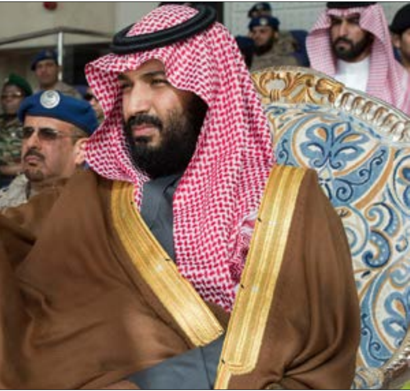
لا تنفصل معركة ابن سلمان عن سعيه إلى كسب ودّ إدارة ترامب