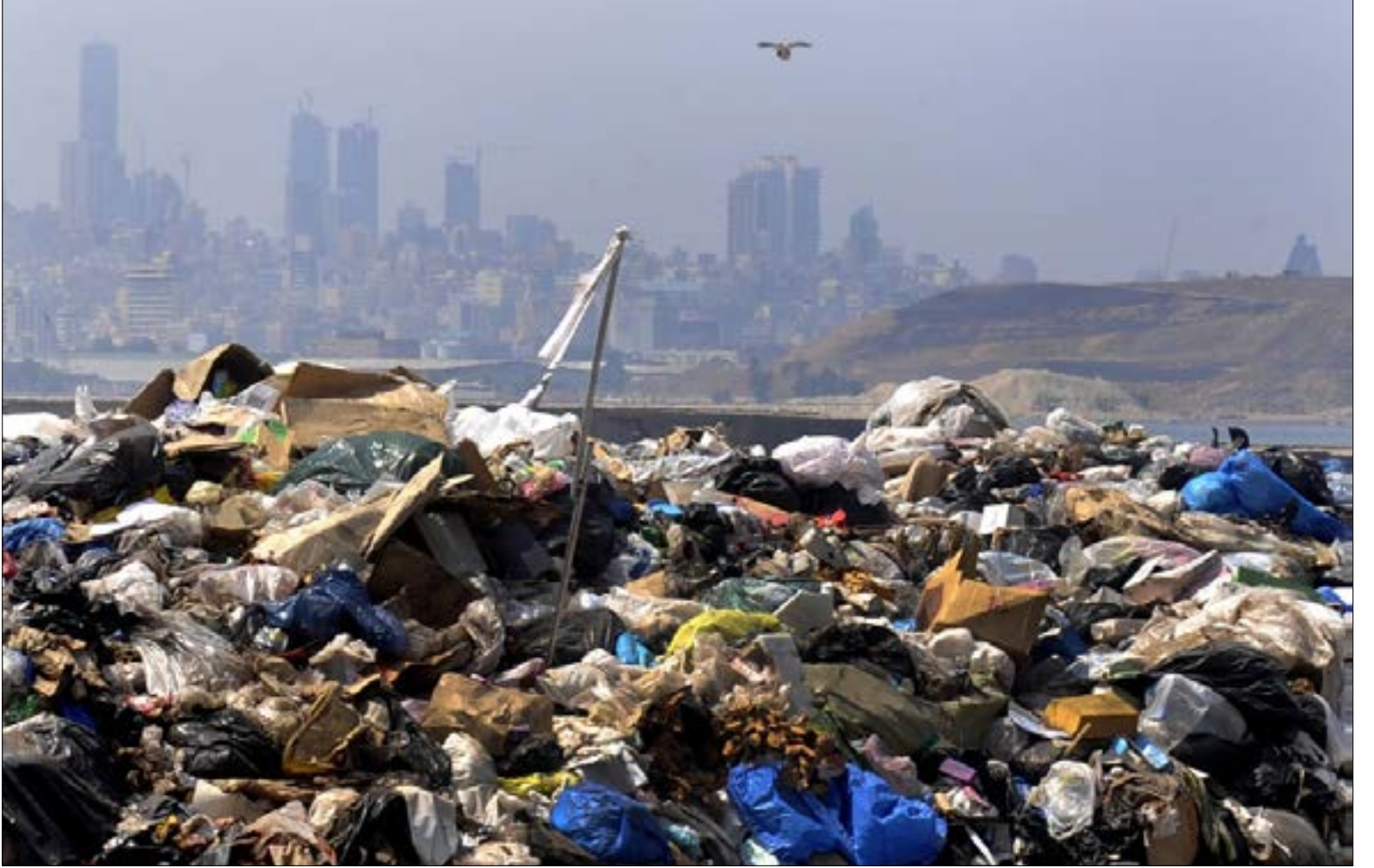
مكبات النفايات ترفع اعلاها البيضاء لقرارات الحكومة

لتحديد الأولوية في النفايات المنزلية الصلبة، منها ما هو جيولوجي كالصفات الحجرية وكثافة التصدع والفتحات وإمكانية التسرب، ومنها هيدروجيولوجي، والأخذ بالاعتبار البعد عن مجاري التصريف أو البعد عن ينابيع المياه، بالإضافة إلى البعد عن الأماكن السكنية، بالإضافة إلى الكميات وعامل رؤية المكب وعمق الطمر وعمر المكب. اختير 20 موقعاً من كل نوع بناءً على هذا الأساس. وقد اختيرت المواقع العشرون لمكبات النفايات في مناطق طرابلس، جبيل، النية - الضنية (2)، البترون وعكار (3)، زحلة (2)، صور (2)، كسروان، المتن، صيدا (3)، جزين، بعلبك والنبطية. إلا أن ما عرضه وزير البيئة على مجلس الوزراء لم يأخذ بهذه المعايير!