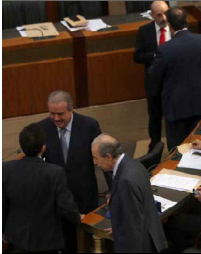
سينمير برلمان 2018 بحضور وازن لرجال الاملاك وليس للمشرعينا (هيلن الموسوي)

الحرب، في عز نهضته التربوية والثقافية. أما في عام 2018، فظهر أولى الأسماء المطروحة للترشيح أن الغلبة ستكون لنوعين، إما حزبيين مطوابعين لرؤساء أحزابهم، وإما فئة رجال الأعمال التي كانت موجودة في المجالس السابقة، لكنها في طريقها كي تصبح الأولى بين النواب، لكون «الطلب» عليها يتزايد بوضوح.