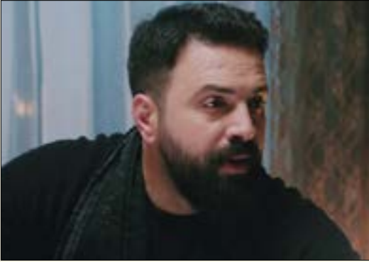
يؤدى تيم حسن بطولة العمل للمرة الثانية

الماضي، انتشرت أخبار في الكواليس تفيد بأن قناة Ibc1 تسعى لشراء المسلسل بعدما أعادت عرض الجزء الأول منه. لكن يبدو أن هذه الأنباء دفعت mtv إلى التمسك بالمشروع وتوقيع العقد مجدداً مع «صباح للإعلام». علماً بأن مجموعة عقبات وقفت بوجه تلك «الصفقة»، أولها ارتفاع ثمن العمل الدرامي بعد النجاح الذي حققه في 2017، وهذا الأمر لا يستهان به في ظل الأزمة المالية التي تعيشها القنوات المحلية. كذلك، اتبعت «صباح للإعلام» سياسة بيع إنتاجاتها كـ «سلسلة واحدة»، وهذه الخطوة تعني بيع مسلسلين معاً لشاشة لبنانية واحدة.