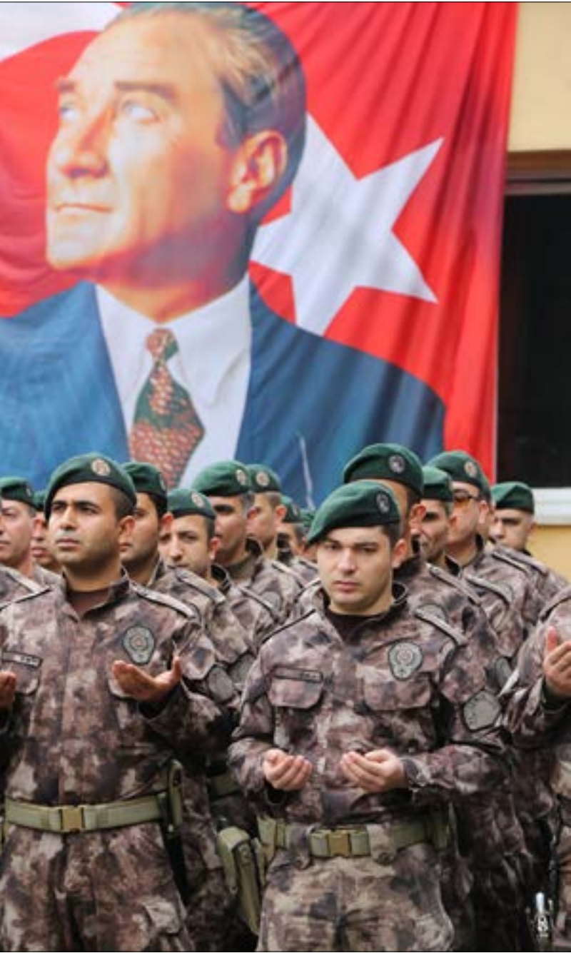
أفراد من «الشرطة الخاصة» التركية يستعدون للتوجه إلى منطقة عفرين (الناضول)

يتم الكشف عن طبيعة التعديلات التي قدمتها موسكو على مشروع القرار المقترح، وخاصة أنه خضع لتعديلات خلال الأسبوعين الفائتين، منها استثناء المنظمات المصنفة «إرهابية» من الهدنة المقترحة. وأوحى حديث المندوب الروسي أمس، بأن بلاده تسعى إلى توضيح آليات ضمان الهدنة ومراقبتها، لتكون ذات فاعلية على أرض الواقع. وقد تسعى موسكو عبر مشروع القرار إلى إحياء الآلية التي سبق تضمينها في اتفاقات هدن الغوطة الشرقية الماضية، التي كانت موسكو والقاهرة والرياض رعاة لأحدها. ويأتي هذا الجهد الروسي بالتوازي مع نشاط دبلوماسي لافت، حمل المبعوث الروسي إلى