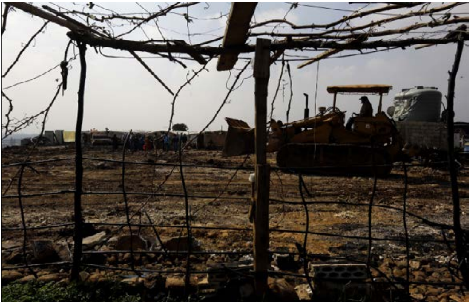
أثار الحريق في المخيم

وهي ليست المتضررة الوحيدة. «شلنا ولادنا من الفرشة ولقحناهن بز الحريق» تقول شمسة (أم لثلاثة أطفال)، متأسفة على خسارة خيمة ترى فيها قصراً في حين يرى فيها آخرون جحيماً. الأرض الزراعية في الجهة المقابلة للمخيم كانت الخيار الوحيد لعائلتها وباقي العائلات الهاربة ليلة وقوع الحريق... «ركضنا