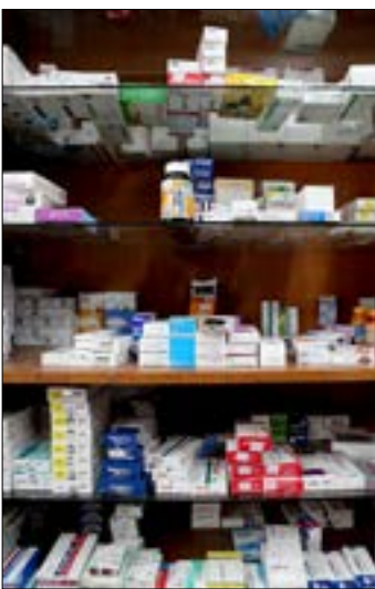
ضبطت الاسهم الماضي شاحنة دواه مهزبة

هنا بلاد «فورات الكبد». شعبة مكافحة التهريب في بيروت، لدى الجمارك، اوقفت شاحنة الثلاثة أطنان من الدجاج الفاسد قبل نحو