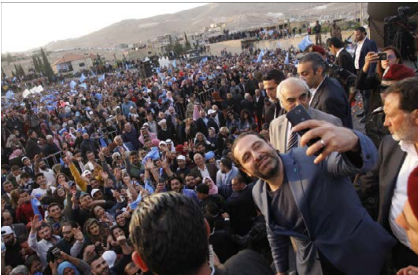
الحريري في عرسال امس (الناظر ونهرا)

لا حديث يعلو على حديث الانتخابات في كل لبنان، إلا في عرسال، البلدة التي عاشت سنوات صعبة نتيجة الحرب السورية، وحرزت أراضيها قبل أقل من عام من الإرهابيين الذين استباحوها، لا تزال تعيش تداعيات ما حل بها على مختلف الصعد. حاجاتها كثيرة وتجاربها مع السياسيين مريرة، وهذا ما يصبغ مهمة الباحثين عن أصواتها من خلال خطابات زائنة او وعود عرقوبية