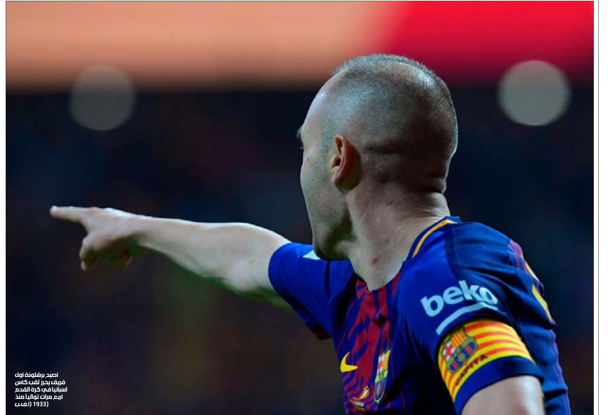
اصبح برشلونه اول فريق يحرز لقب كأس اسبانيا في كرة القدم اربع مرات تواليًا منذ (1933)