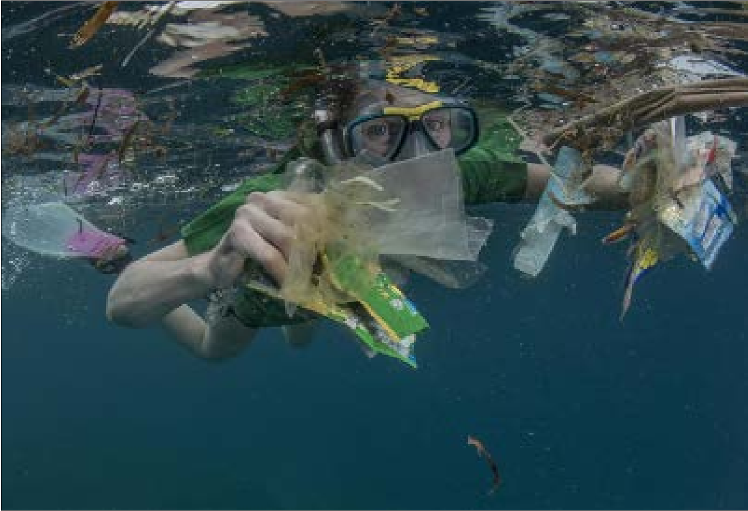
مستحضرات التجميل أحد أهم مصادر جزيئات البلاستيك

مختراعه، قبل ما يزيد على 100 عام، أصبح البلاستيك جزءاً لا يتجزأ من الاقتصاد العالمي ورفيقاً في حياتنا اليومية... قبل أن تصبح هذه المادة التي يستغرق تحللها ما يصل إلى 1000 عام، مشكلة عالمية باعتبارها واحدة من أكبر مصادر تلوث البحار والمحيطات. أخيراً تبين أن خطرها وصل إلى موائدنا بعدما تبين أن الحبيبات البلاستيكية الصغيرة، تلك الناجمة عن غسل الملابس، تتسبب في تلويث المياه والتربة