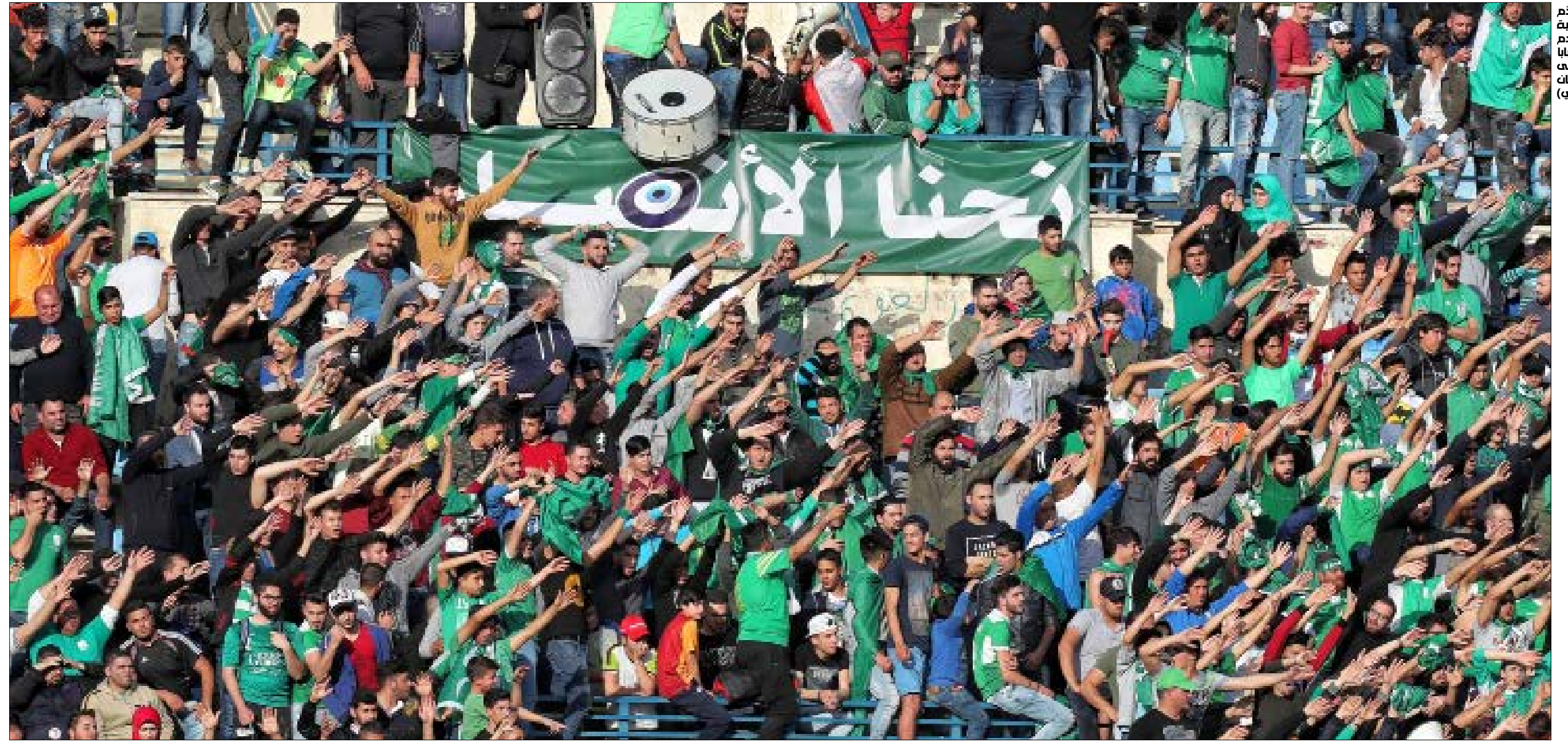
هذا الشخص مهمون من الدولة الأردنية الملكة الأردنية

قرار مستغرب خصوصاً أن البابا سافر إلى العديد من البلدان وأخرها عُمان