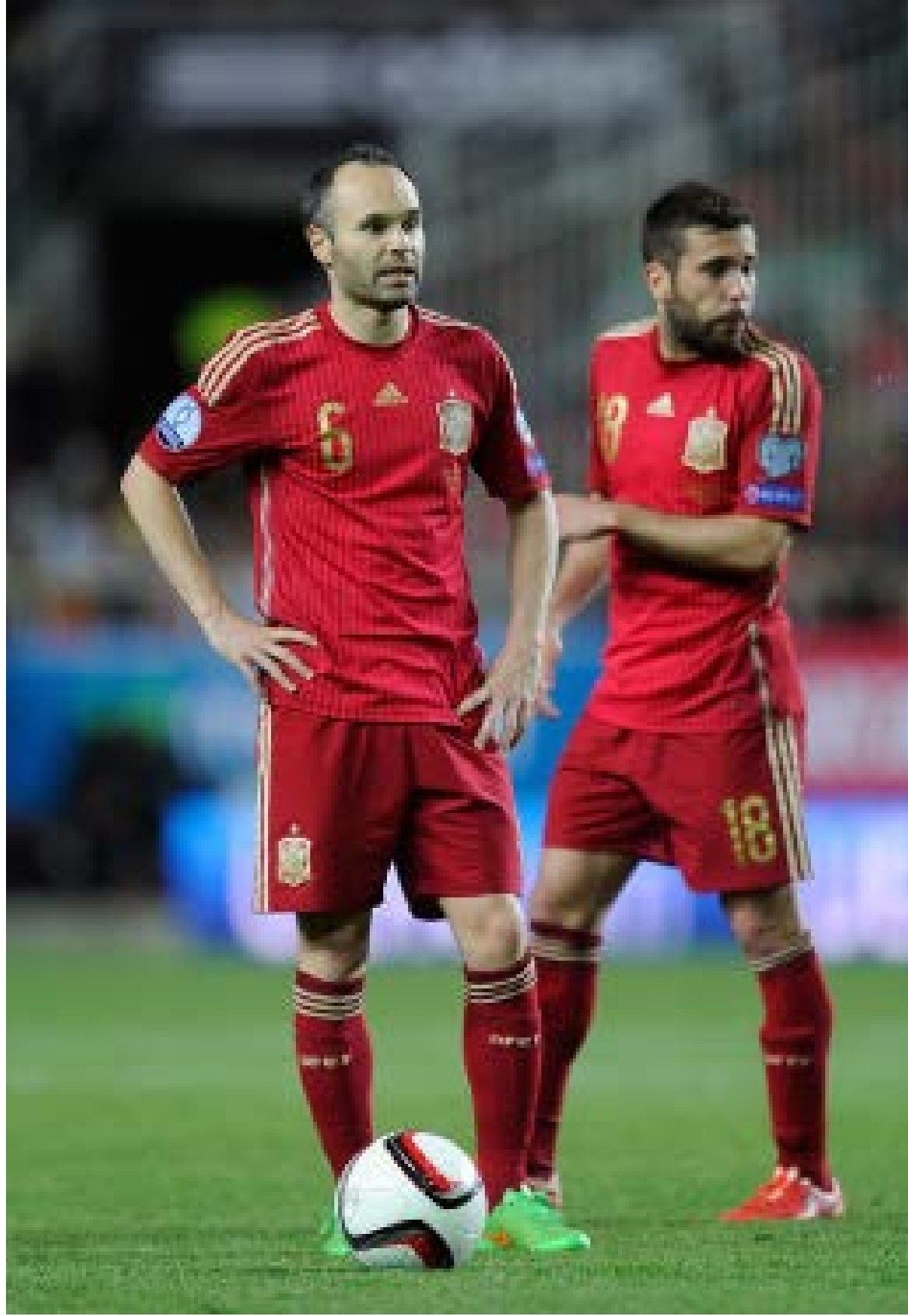
(الجميع يذكر هدف انبيستا ضي نهائي مونديال 2010 ضد هولندا (أ.ع.ب))