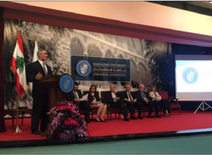
من احتفال «اليوم الوطني للتلامذة ذوي الصعوبات التعليمية» في جامعة هايكازيان امس (الأخبار)

وصلت إلى اللبنانيين، أمس، 3 ملايين رسالة نصية تذّكر بـ«اليوم الوطني للتلامذة ذوي الصعوبات التعليمية»، في 22 نيسان، هذا اليوم الذي يحتفل به لبنان للجنة السادسة يحفز خصوصاً على ثقافة الدمج ويستهدف من يعانون فروقاً في القدرات الذهنية والمردود الأكاديمي، لكن يستطيعون أن يخرطوا في المجتمع مع جهد إضافي من المسؤولين، والحالات تتنوع بين عسر في القراءة (ديسلاكسيا)، أو عسر في الكتابة (ديسغرافيا)، أو عسر في الحساب (ديسلكوليا)، أو التوحد أو فرط الحركة أو قلة الانتباه، أو اضطرابات سلوكية أو اضطرابات نفسية وغيرها.