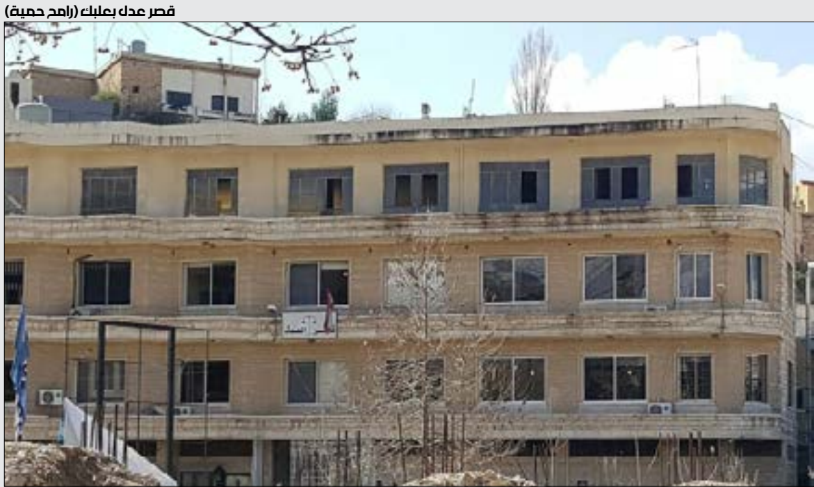
قصر عدل بعلبك (إمخ حمية)

وزير الصحة السابق، وإثل أبو فاعور، وتعلقاً على ضبط اللحوم الفاسدة أخيراً، إلى جانب الأدوية، يقول: «حصل خطأ تاريخي في اتفاق الطائف، جرى تهميش دور المدير العام في كل وزارة لصالح دور الوزير. هكذا ضرب مبدأ الاستمراريّة، في الخطط المستقبلية، نظراً لاختلاف مزاجيّة الوزير اللاحق عن السابق». يستقيض أبو فاعور: «عندما قمنا بحملة المطابق للمواصفات تحسنت الأمور كثيراً، لا أقول تماماً، ولكن قبل مدة أخبرني صاحب أحد أشهر المطاعم في لبنان أنّ آخر زيارة تفتيشيّة استقبلها، في مختلف فروعها، كانت قبل سنة ونصف سنة. أين أصبحت الهيئة الوطنية لسلامة الغذاء التي عملنا عليها؟ جرى تعطيلها. لو يعلم الجميع ماذا ناكل!».