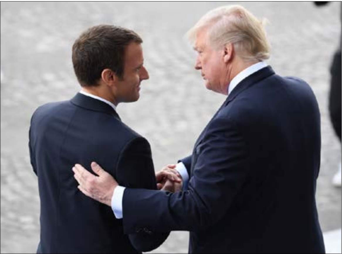
استقبل ماكرون زيارته الأميركية بالناكيد على أنه ليس لديه خطة بديلة، من الاتفاق (أه ب)

العقوبات والحظر، وفق تأكيد المسؤولين الإيرانيين من الجهة الأوروبية، المازق الغربي يكبر كلما اقترب الوقت من موعد أيار، إذ يعجز الأوروبيون حتى اليوم عن توحيد موقف يستجيب للضغوط الأميركية ويحفظ المصالح الاقتصادية مع إيران في الوقت ذاته. أما إيران، فتحاول التأكيد، على لسان مسؤوليها، أن ضرب الاتفاق سيكون بالغ الثمن، وسيواجه برد «مدروس مسبقاً».