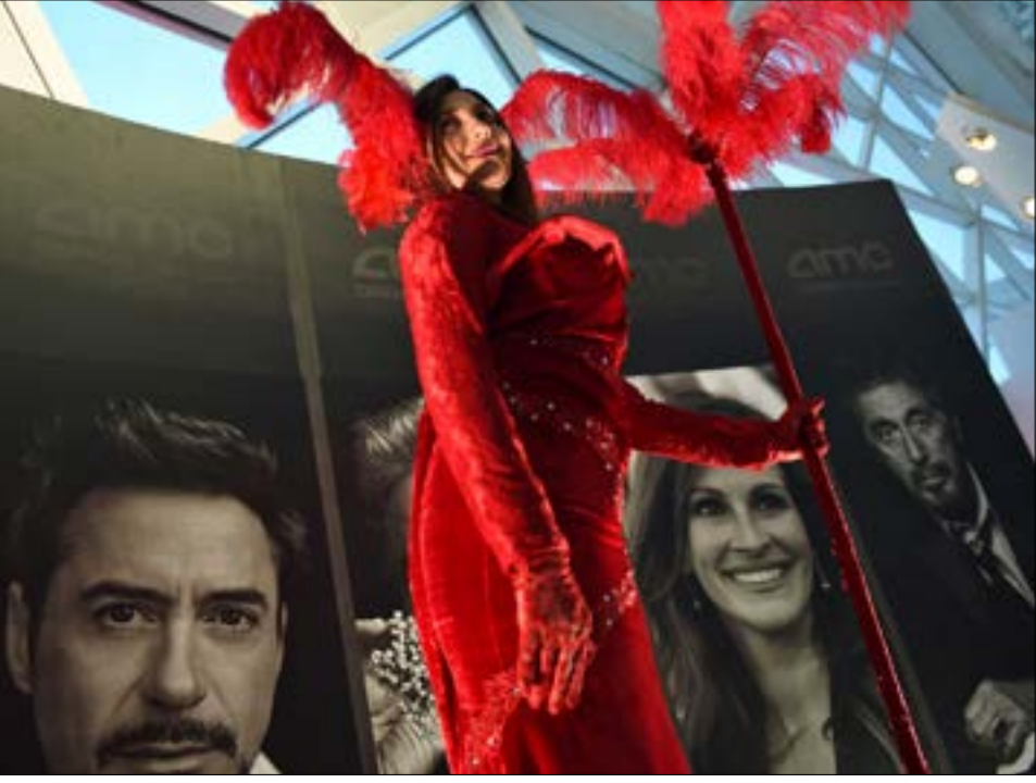
من حفلة افتتاح أول دار سينما في مركز الملك عبد الله بالرياض (أه ب)

تسجيلاً مصوراً له من داخل بلدة العوامية، الواقعة في المنطقة الشرقية، يقول فيه: «هنا هزمت السلطات السعودية الإرهابيين، وبدأت إعمار المجتمع». المفارقة أنه في الوقت نفسه، كانت السلطات «تقطع الراس السابع والأربعين خلال عام 2018» بحسب «المنظمة الأوروبية - السعودية لحقوق الإنسان»، ووفقاً لتقرير نشرته المنظمة على موقعها، فإن لإرجاع السعوديين إلى السياحة والترفيه الداخليين بدلاً من «الحج» إلى الخارج لتن تسير وفق ما عليه الحال الفقرة نفسها من العام الماضي، ارتفاع يمثّل وجهاً واحداً فقط من وجوه الأضطهاد المتواصل في السعودية، والذي سيظل يشكل عامل اضطراب سياسي، على رغم إصرار الرياض على أنه لا وجود في الأصل لناشطين وحقوقيين ومطالب مشرعة، إنما مجموعة «مجرمين ومخزّين»، هذا الإنكار يرافقه تجاهل للمسخط الشعبي