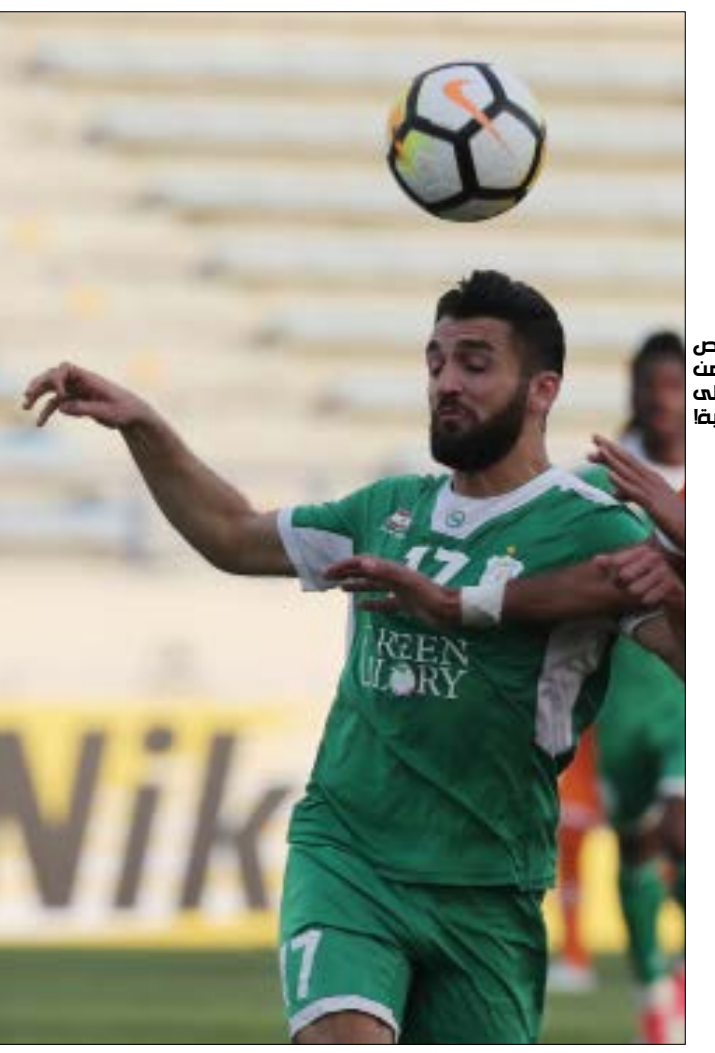
هذا الشخص مهمون من الدولة الأردنية الملكة الأردنية

وعليه، فإن اهتمام العهد سيكون موزعاً بين المدينة الرياضية والنمامة البحريني حيث يلعب الزوراء مع الجيش السوري، إضافة إلى ما يحصل في المجموعة الأولى. لكن أولاً على العهد أن يفوز وينتجية كبيرة كي يضمن تأمله وهو يملك جميع مقومات الفوز. فالصنوف مكتملة والمعنويات مرتفعة بعد ضمان لقب الدوري، والحافز المادية جاهزة في حال التأهل. كل هذا يجعل اللاعبين في أعلى درجات التركيز للفوز غداً وإكمال الطريق الأسبوعي.